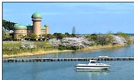
手賀大橋から見る親水広場・水の館