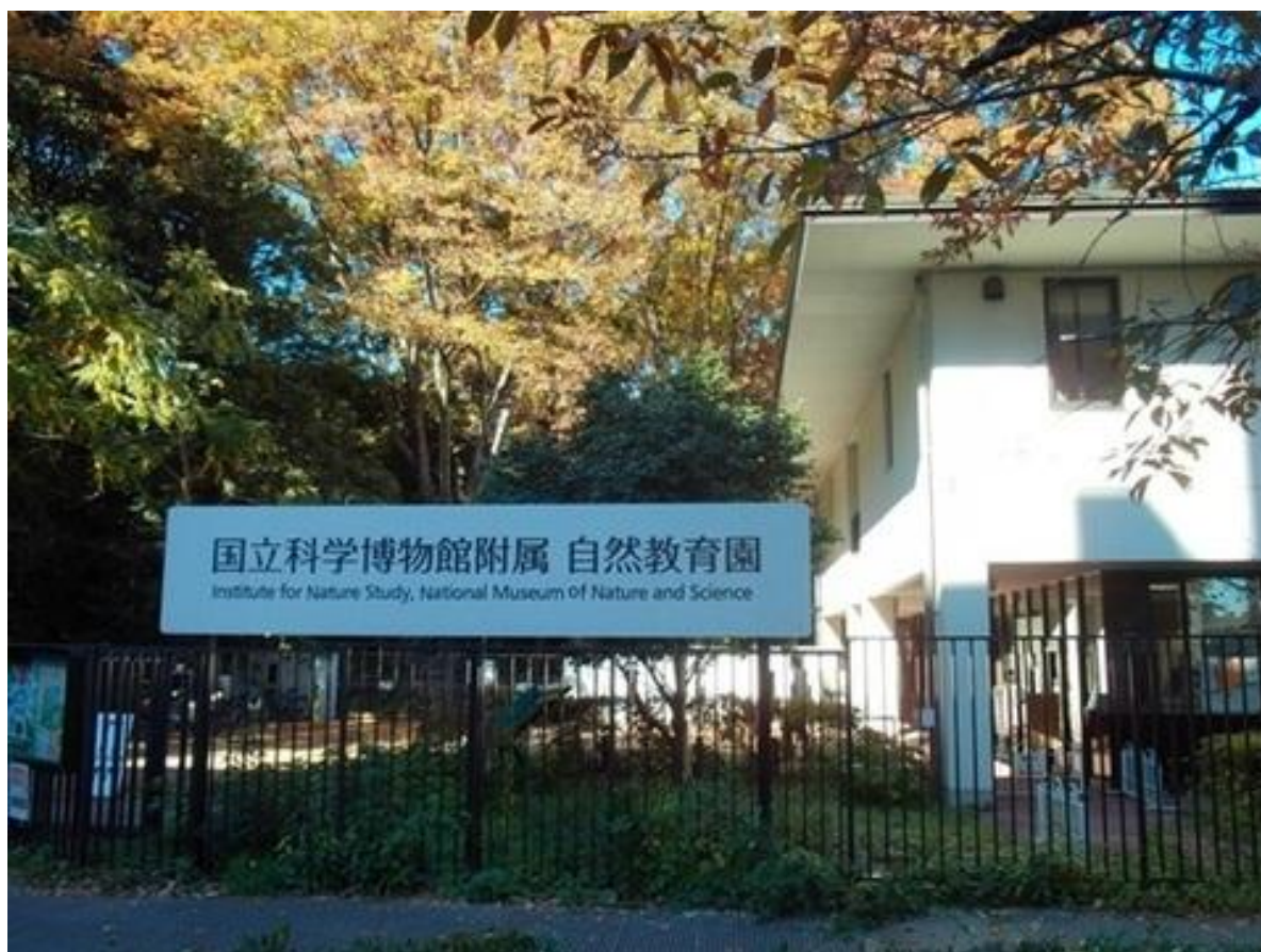
東京大学 医科学研究所