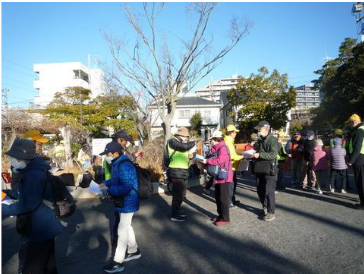
受付を 5 分前に開始しました