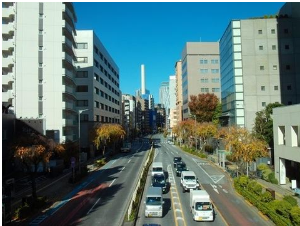
恵比寿ガーデンプレイス