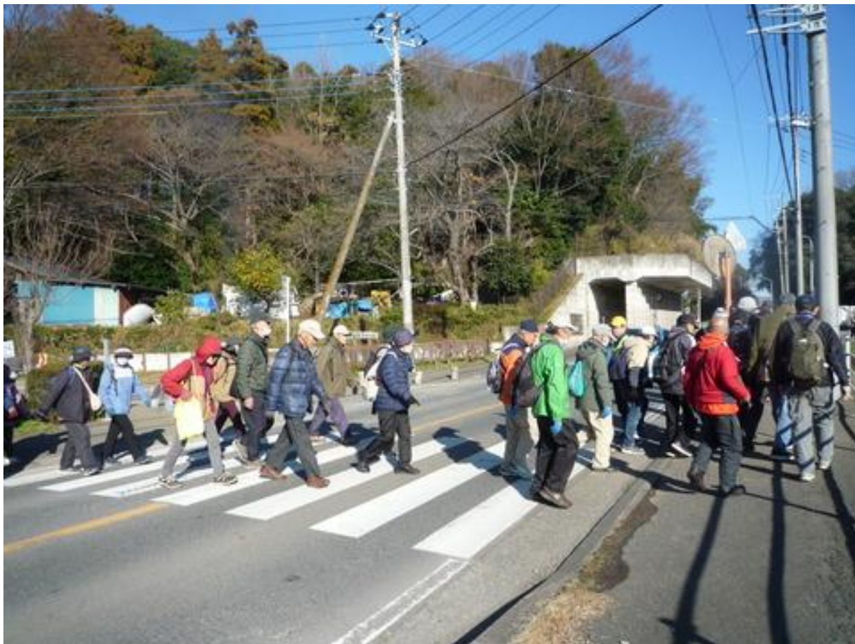
根戸城下の横断歩道を渡り、ハケの道に入ります