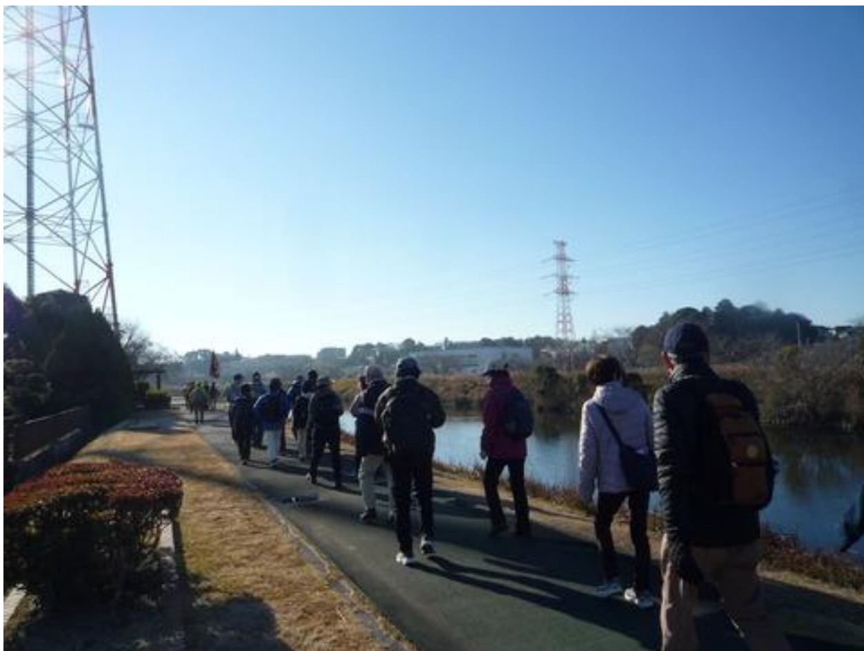
大堀川左岸の遊歩道を歩く参加者