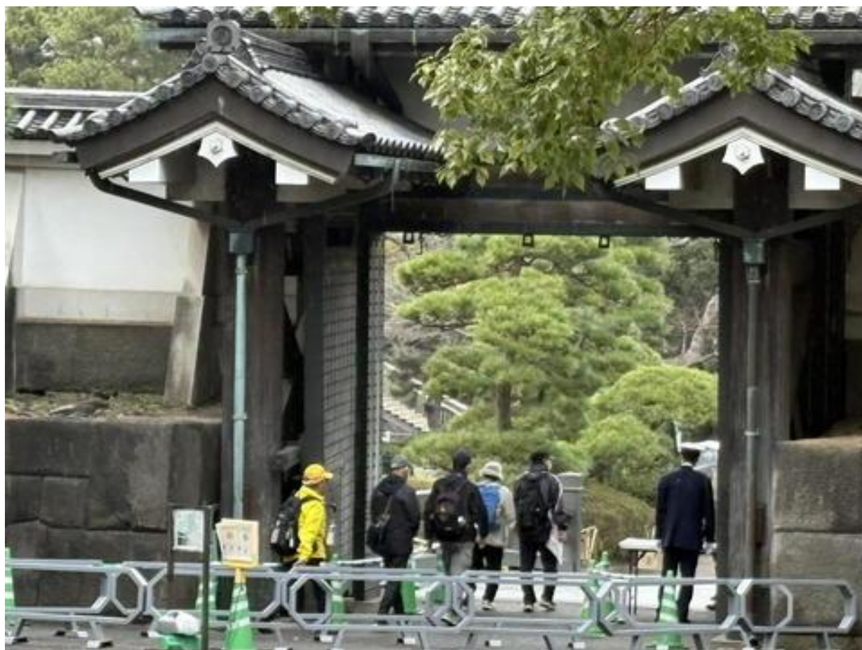
「北桔橋門（きたはねばしもん）」から皇居東御苑を出ました。