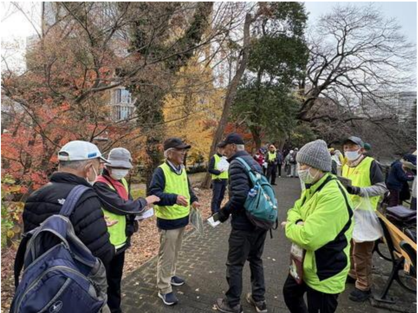
受付風景(日比谷公園)

この日の朝は、曇り空で午後から雨が降る予報でしたが、「江戸城三十六見附巡り」シリーズ最終回ということもあってか、集合場所の日比谷公園には、 109名 のウォーカーが集まりました。歩き出して20分ほどすると、霧雨が降ってきましたが、傘を差すほどの降りではありませんでした。