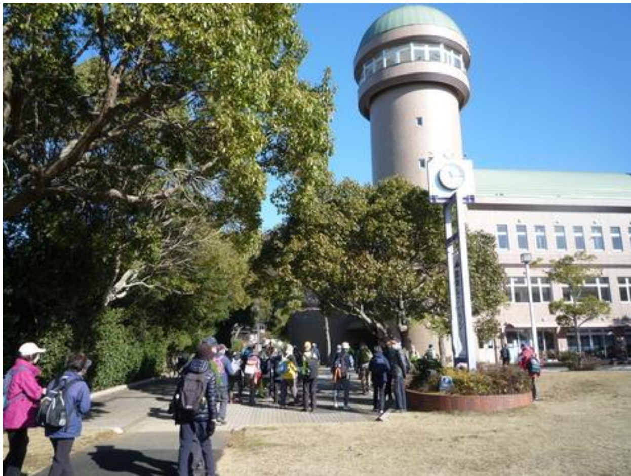
水の館でトイレ休憩です