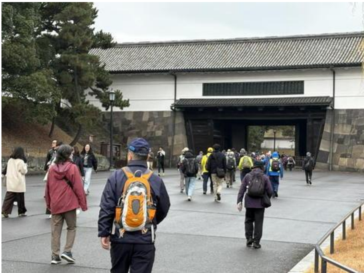
「桜田門」を通り・・・