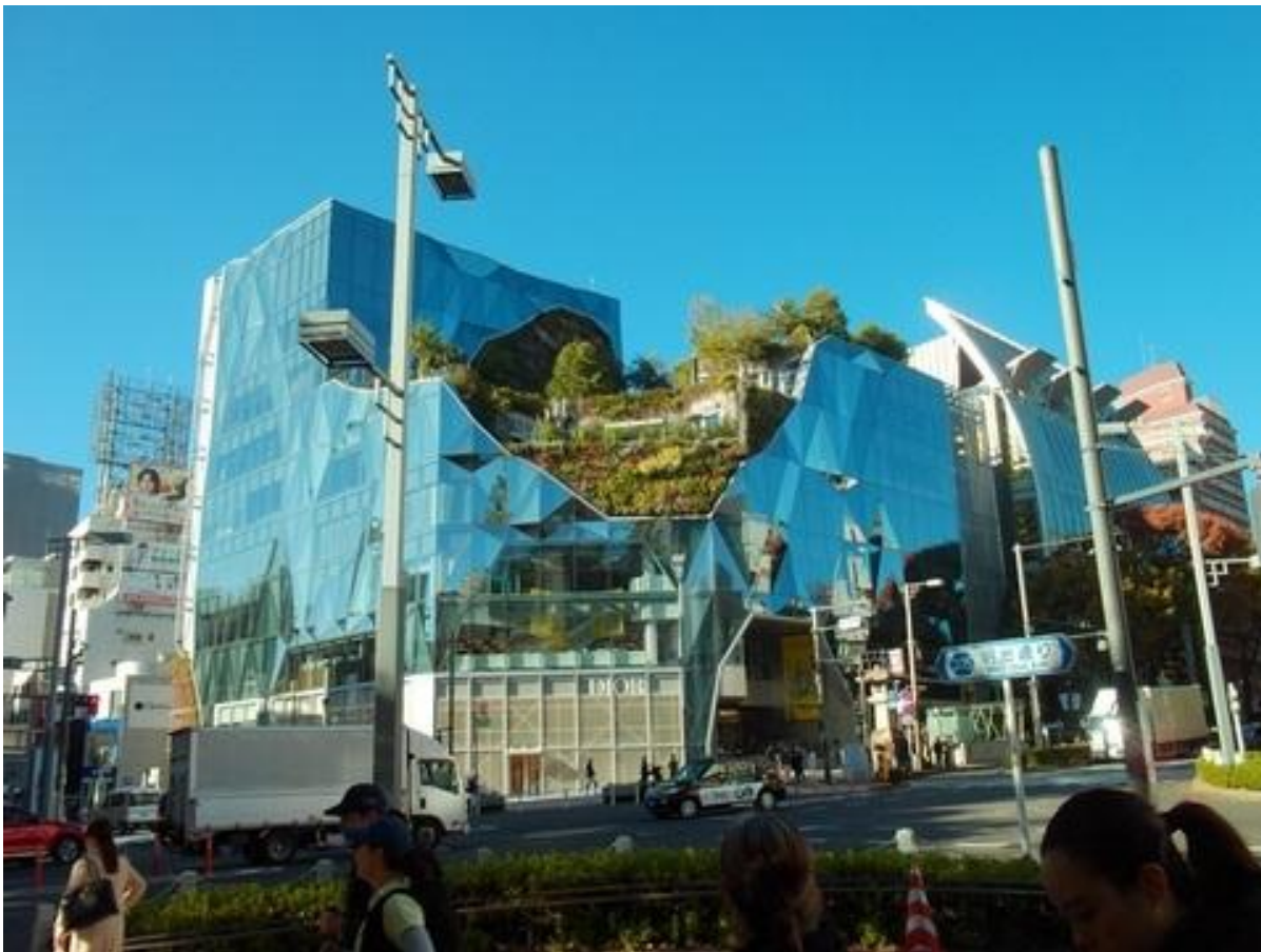
表参道ヒルズ同潤館ビル