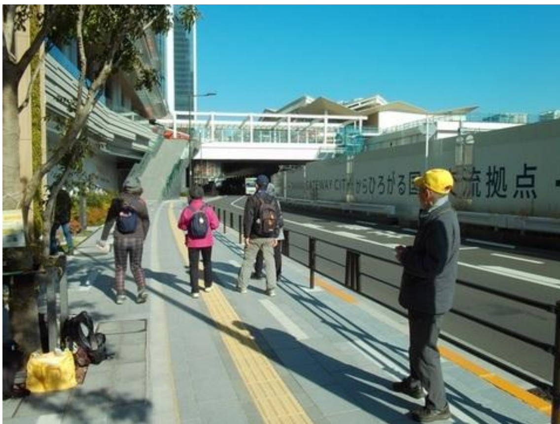
高輪ゲートウェイ駅