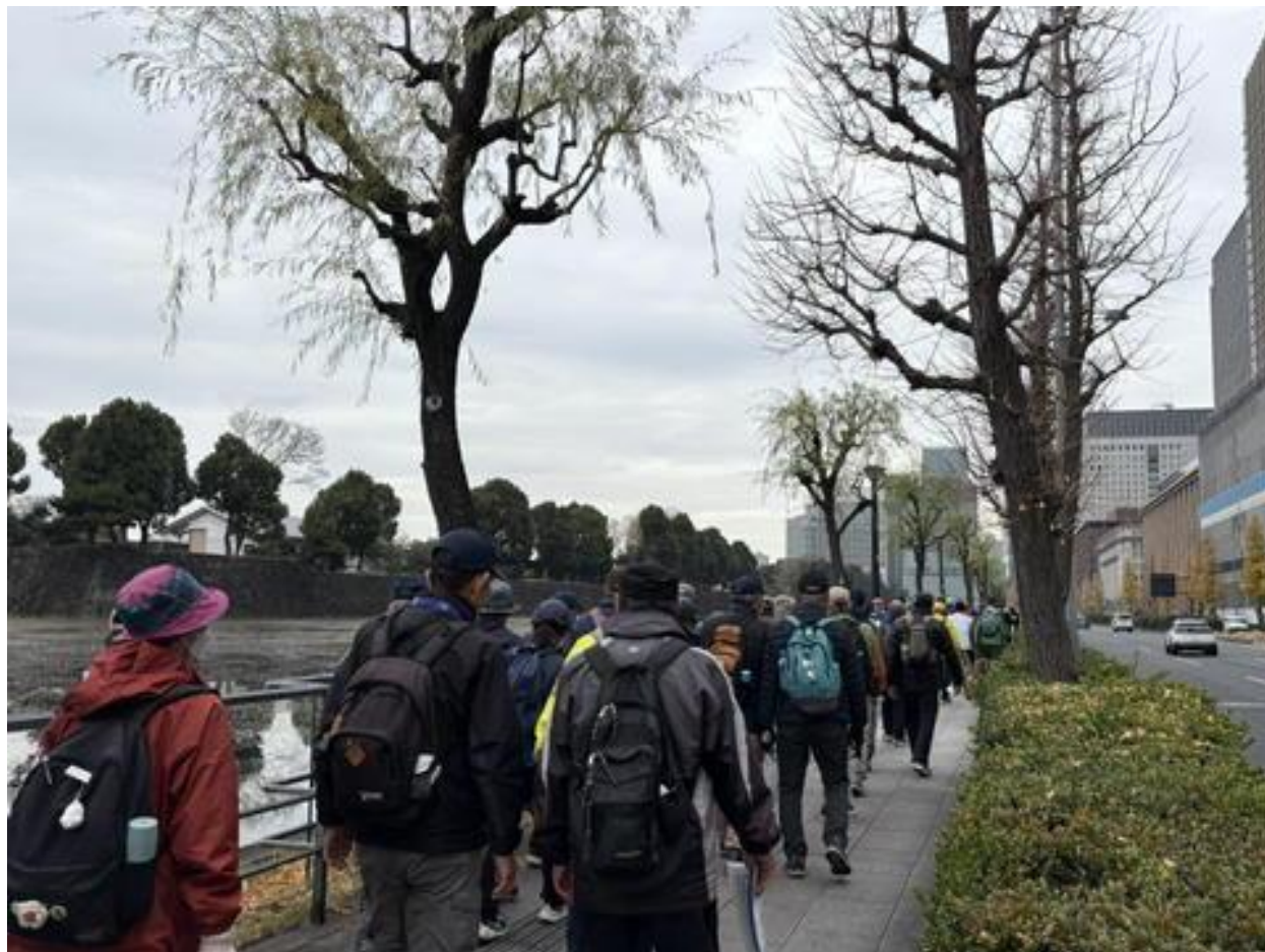
「日比谷濠」脇を歩行し・・・