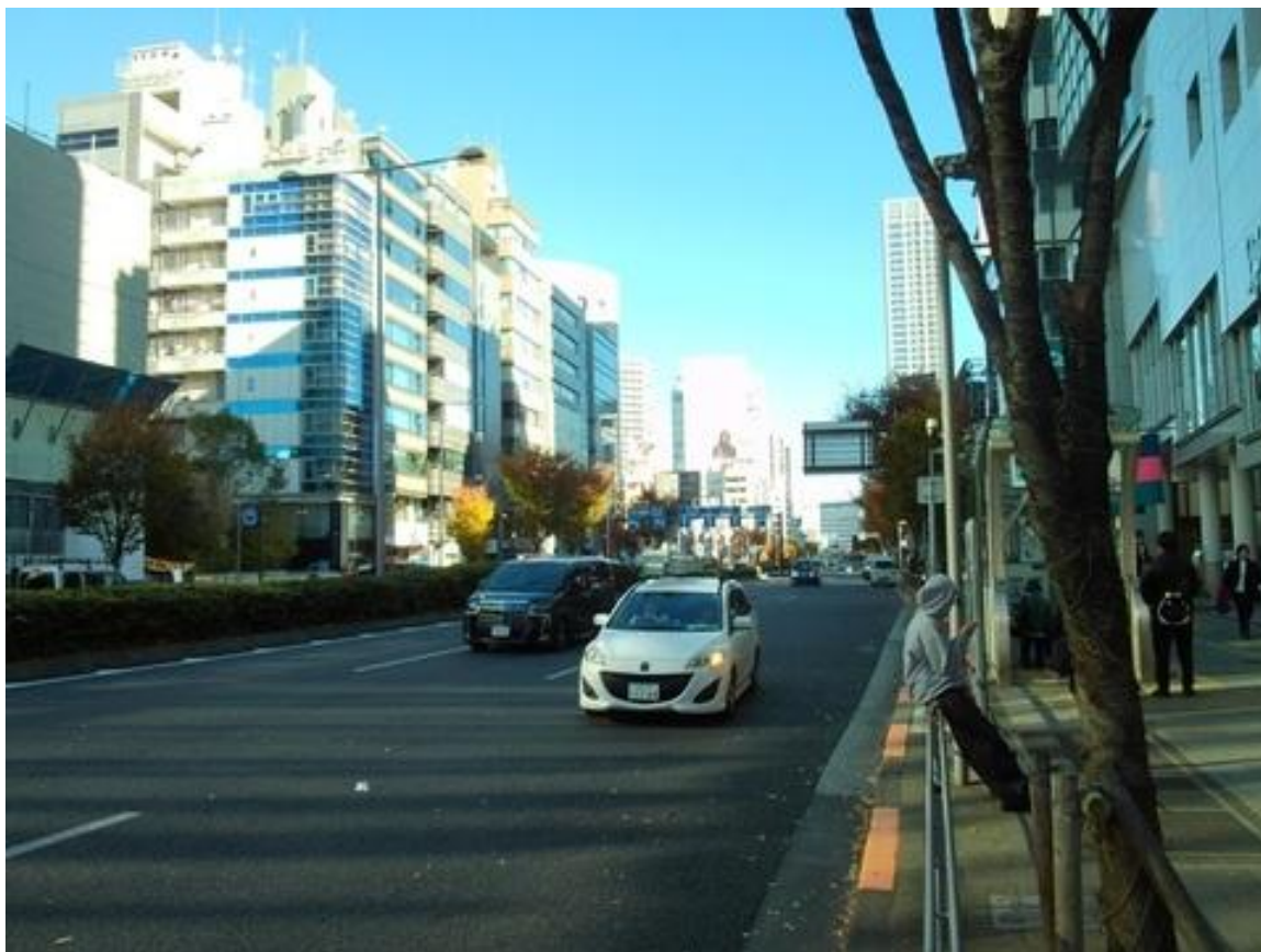
国連大学本部ビル（青山通り）