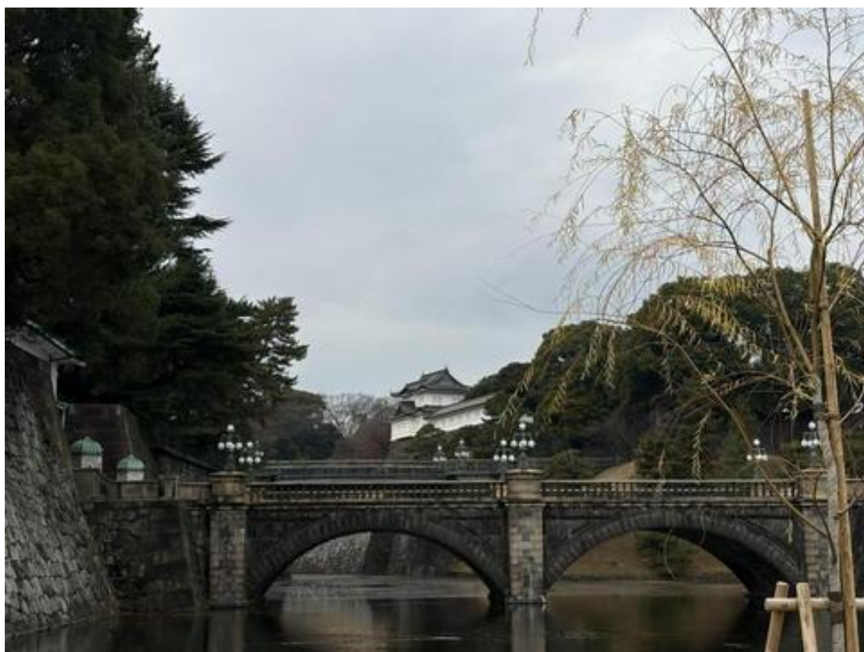
「石橋」※奥の橋が二重橋