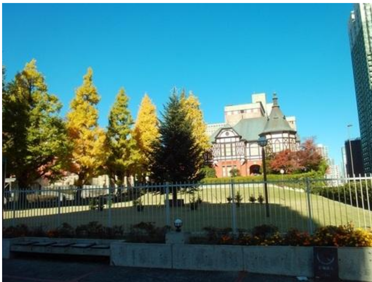
高輪消防署二本榎出張所（東京都選定歴史的建造物）