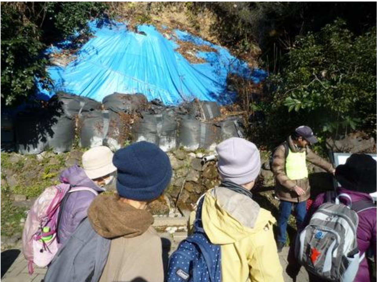
現在も水が湧く湧水を見学しました