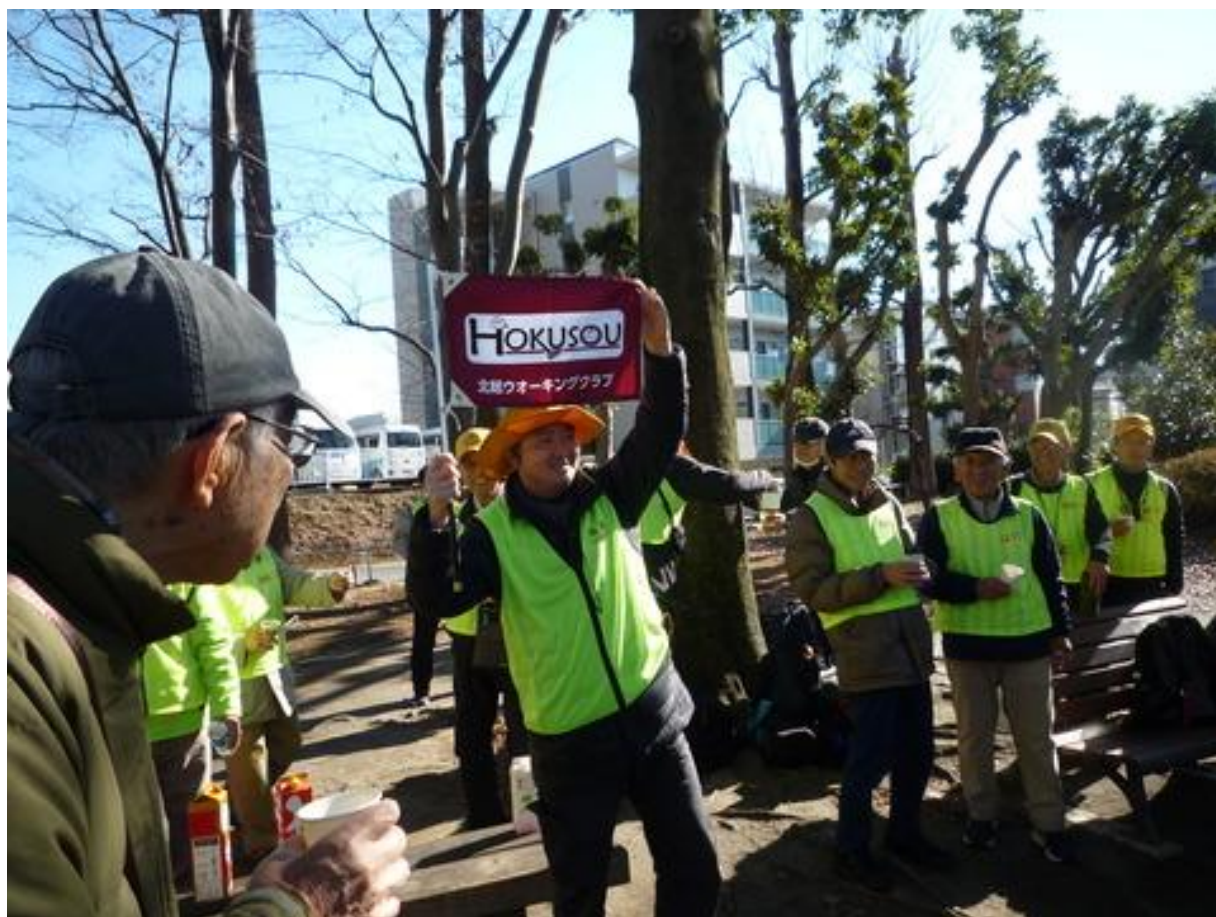
乾杯の前に北総の新しい旗と制服が披露されました