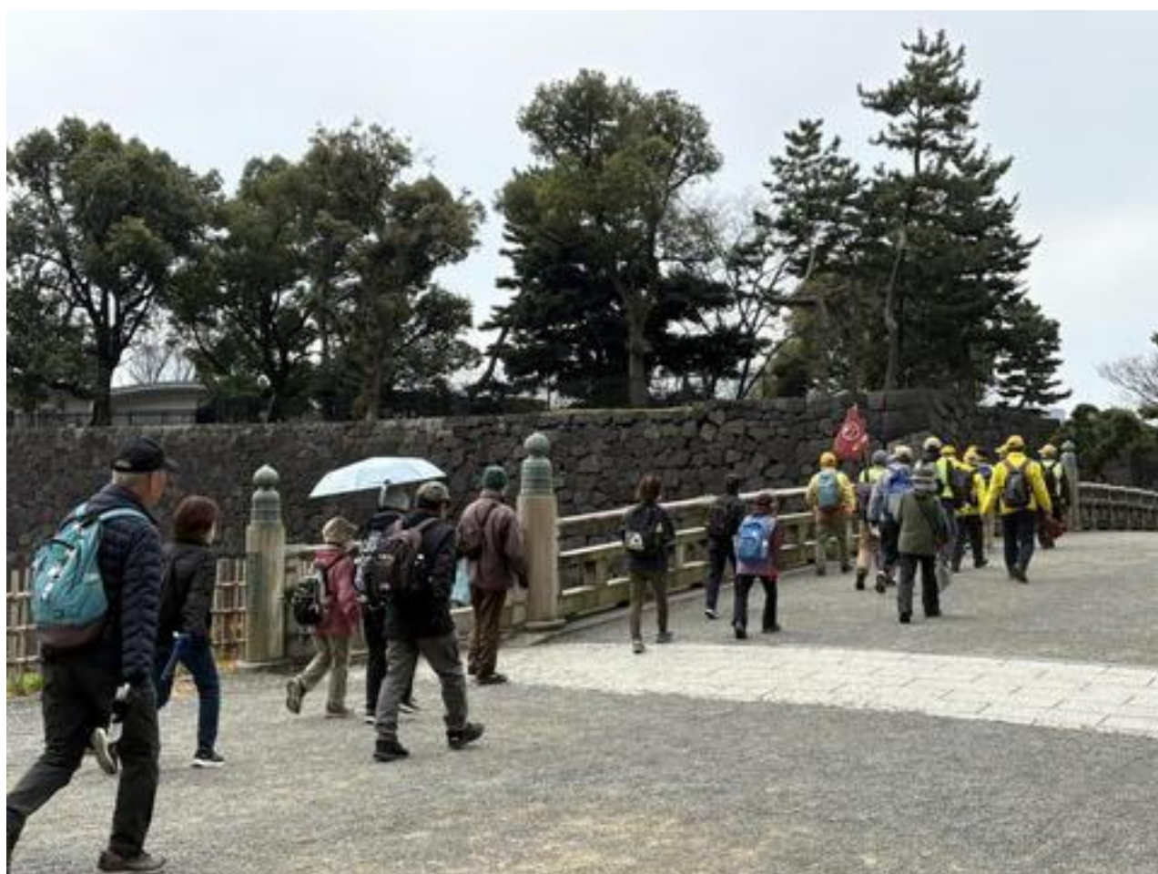
「和田倉橋」を渡り・・・