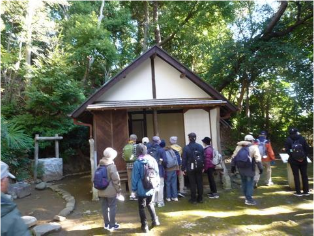
志賀直哉邸跡を見学しました