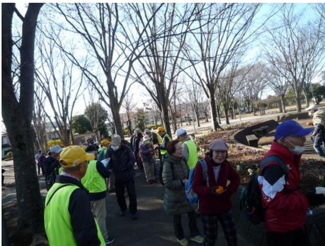
みかんと IVV・完歩賞を配布して解散です。忘年会会場の我孫子へ急ぎます。

大人数の歩行でしたが怪我もなく無事に予定時刻通りにゴールできました。久しぶりの我孫子の歩行を十分楽しめたと思います。参加者の皆様、支援役員の皆様ありがとうございました。