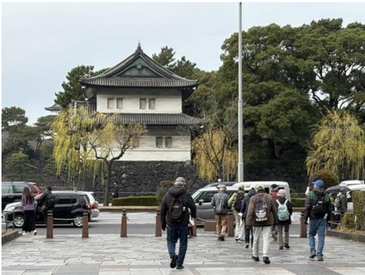
「和田倉門跡」、「和田倉噴水公園」を抜け、「大手門」に向かいます。