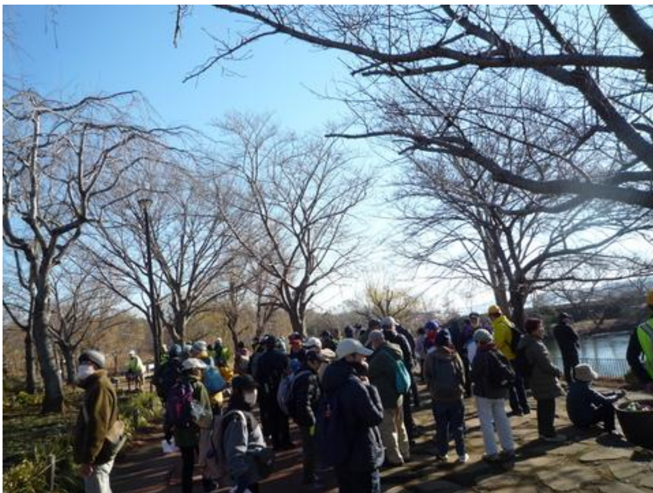
最初のトイレ休憩は北柏ふるさと公園、池のほとりで休憩中です