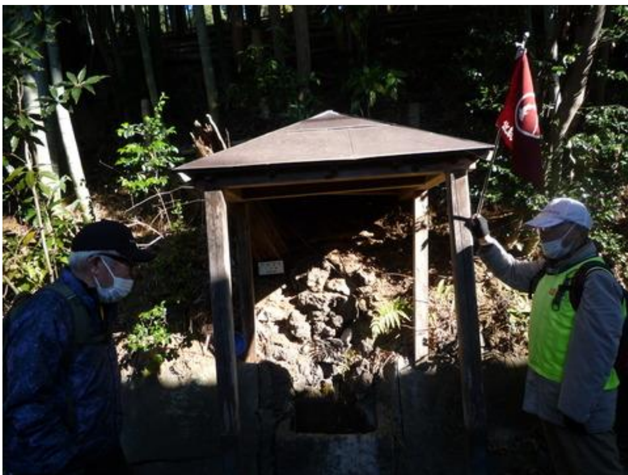
湧水が出ていたところを案内しています