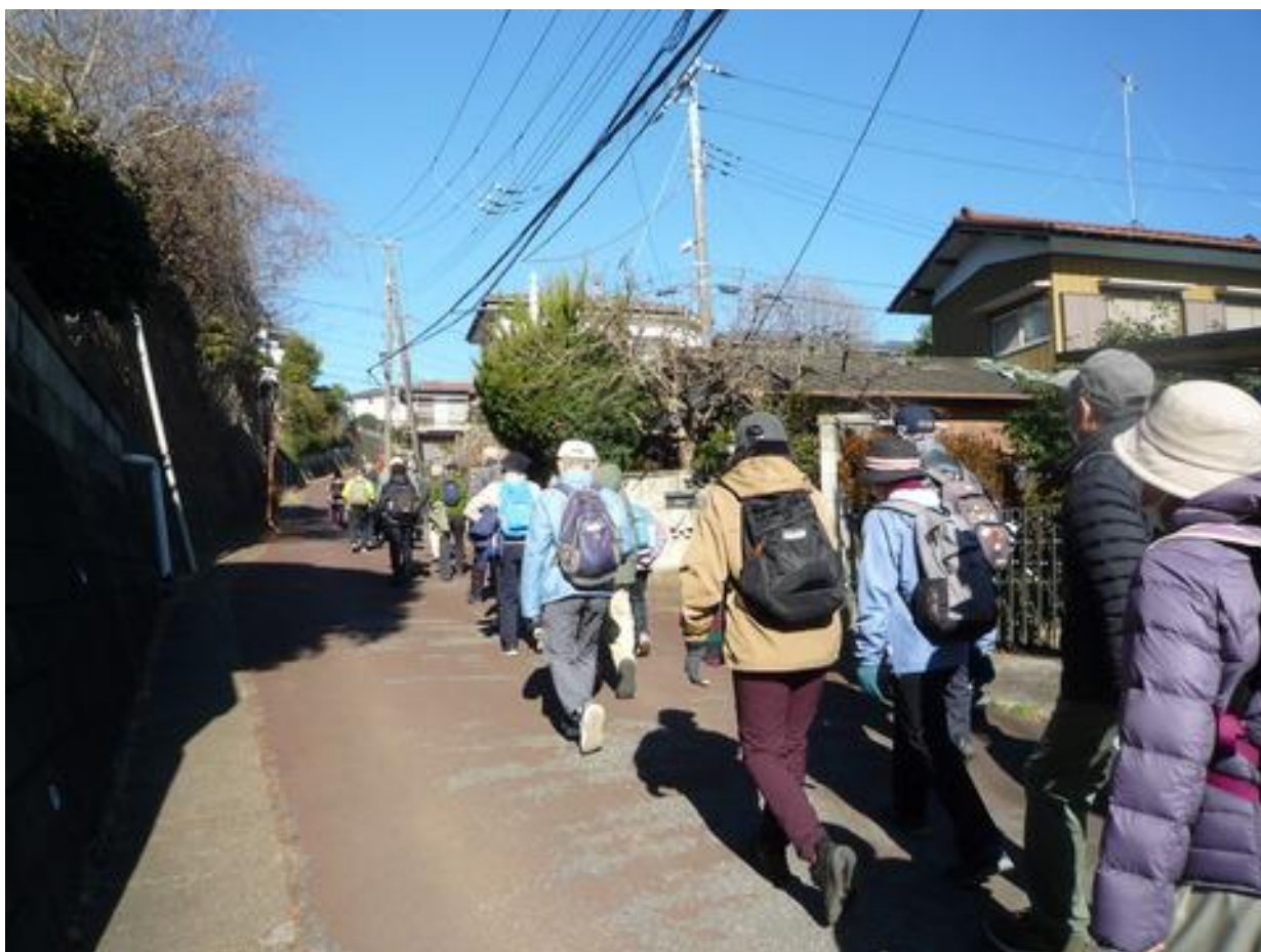
今日一番の上り坂を元気に歩きました