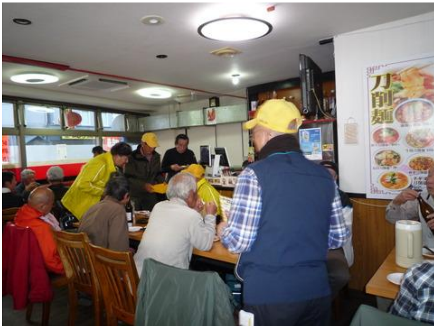
忘年会のスナップ写真です。 (投稿担当：青木 茂)