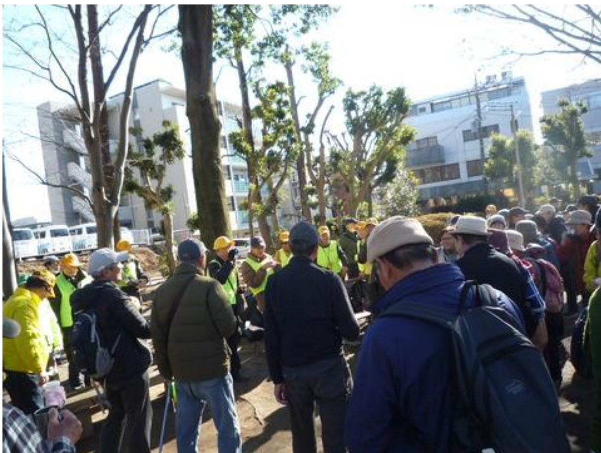
行事リーダーの音頭で乾杯し、今年一年の無事と来年も元気に歩くことを誓いました