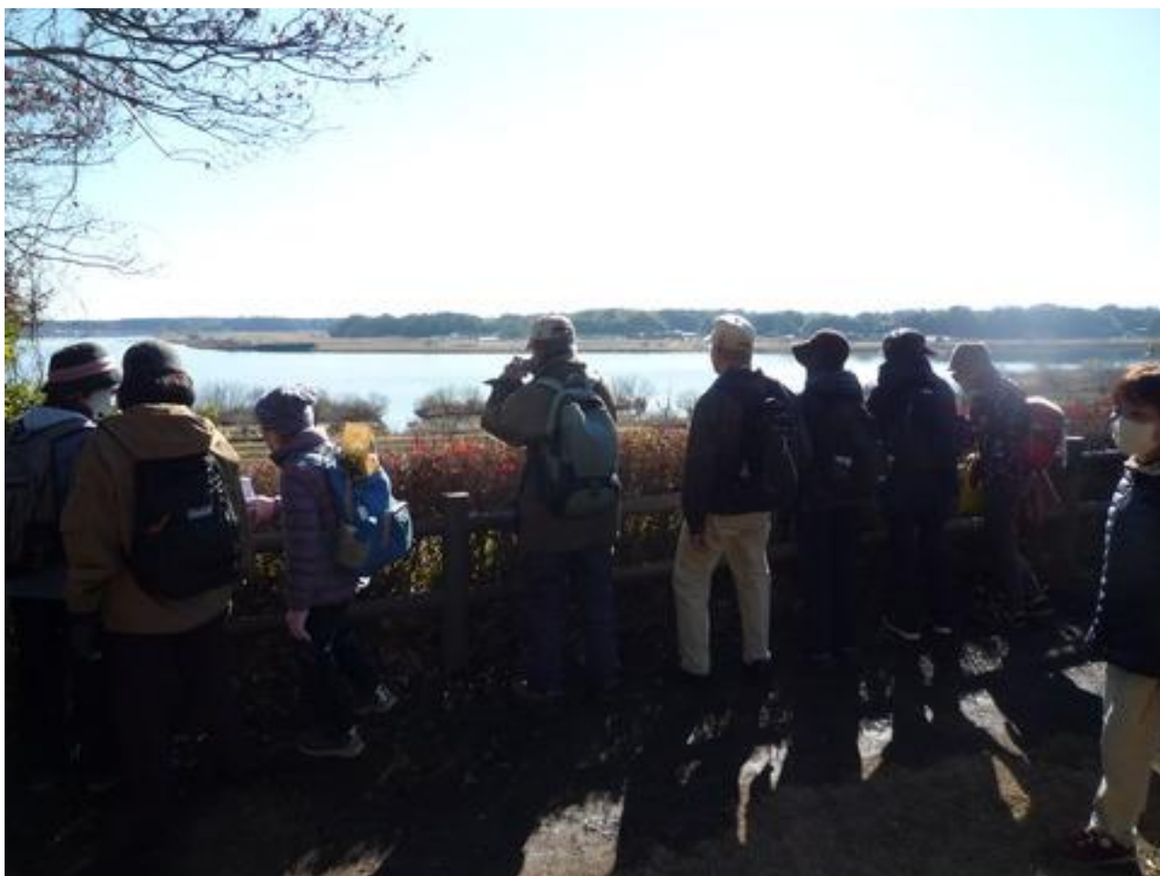
手賀沼一望の高野山桃山公園で手賀沼の眺めを楽しみました