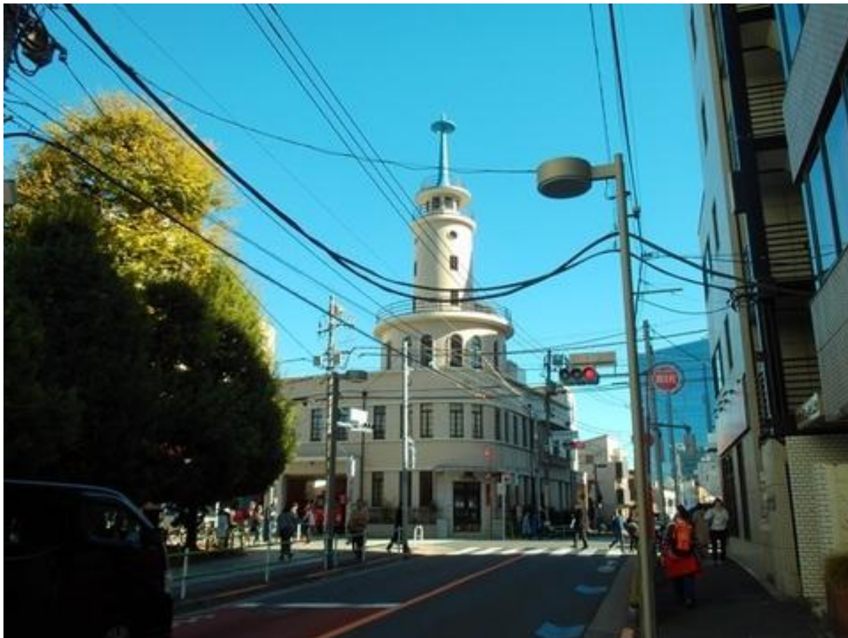
高輪ゲートウェイシティの高層ビル