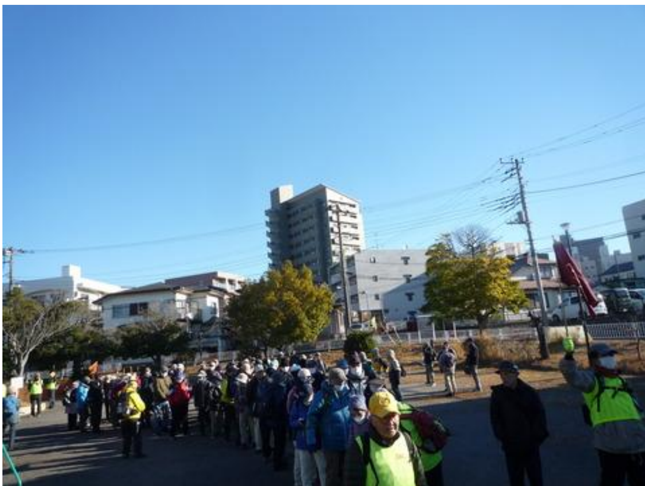
2列の隊列でスタートです