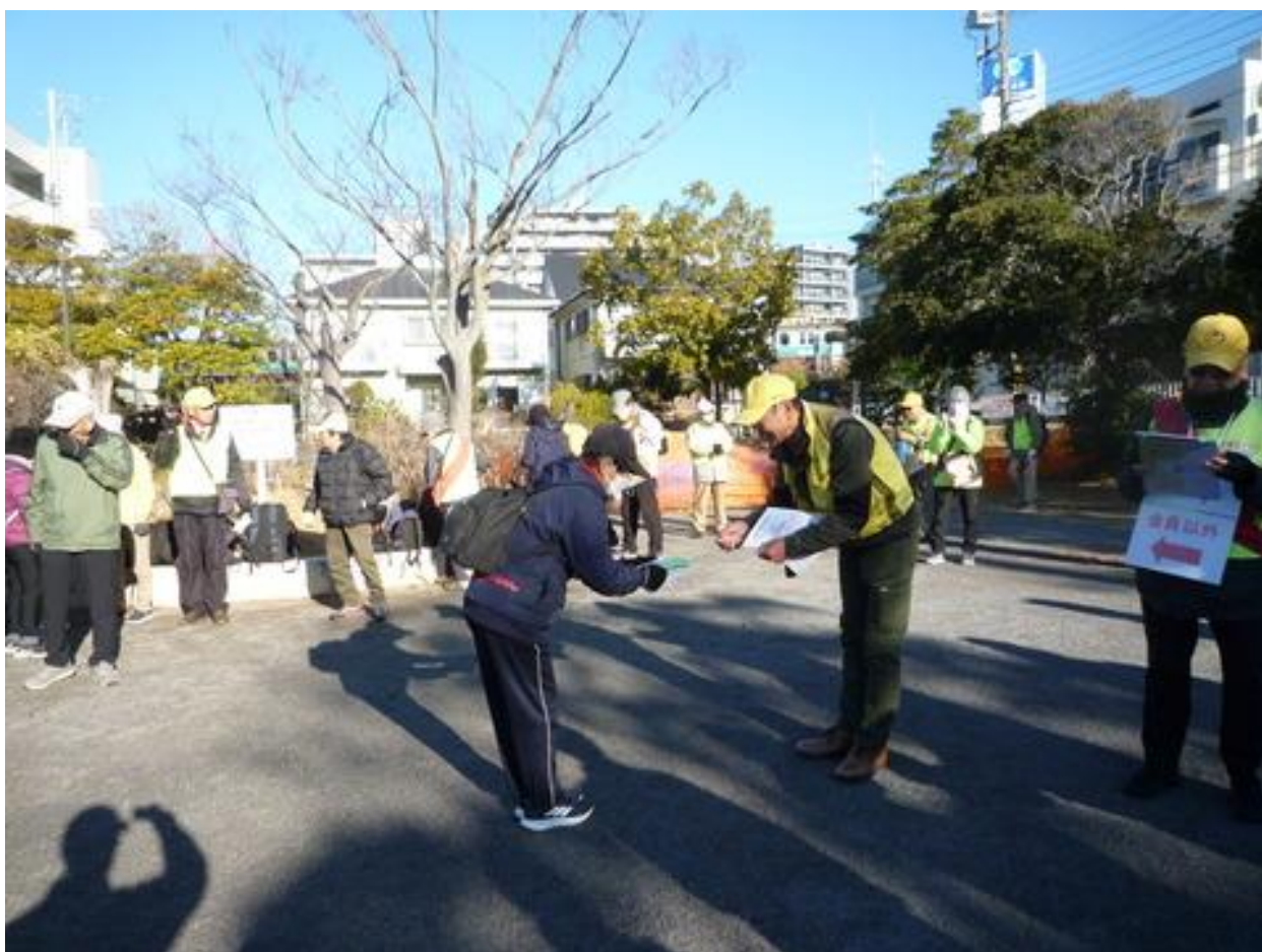
開会式では恒例の北総パスポートの参加回数表彰が行われました