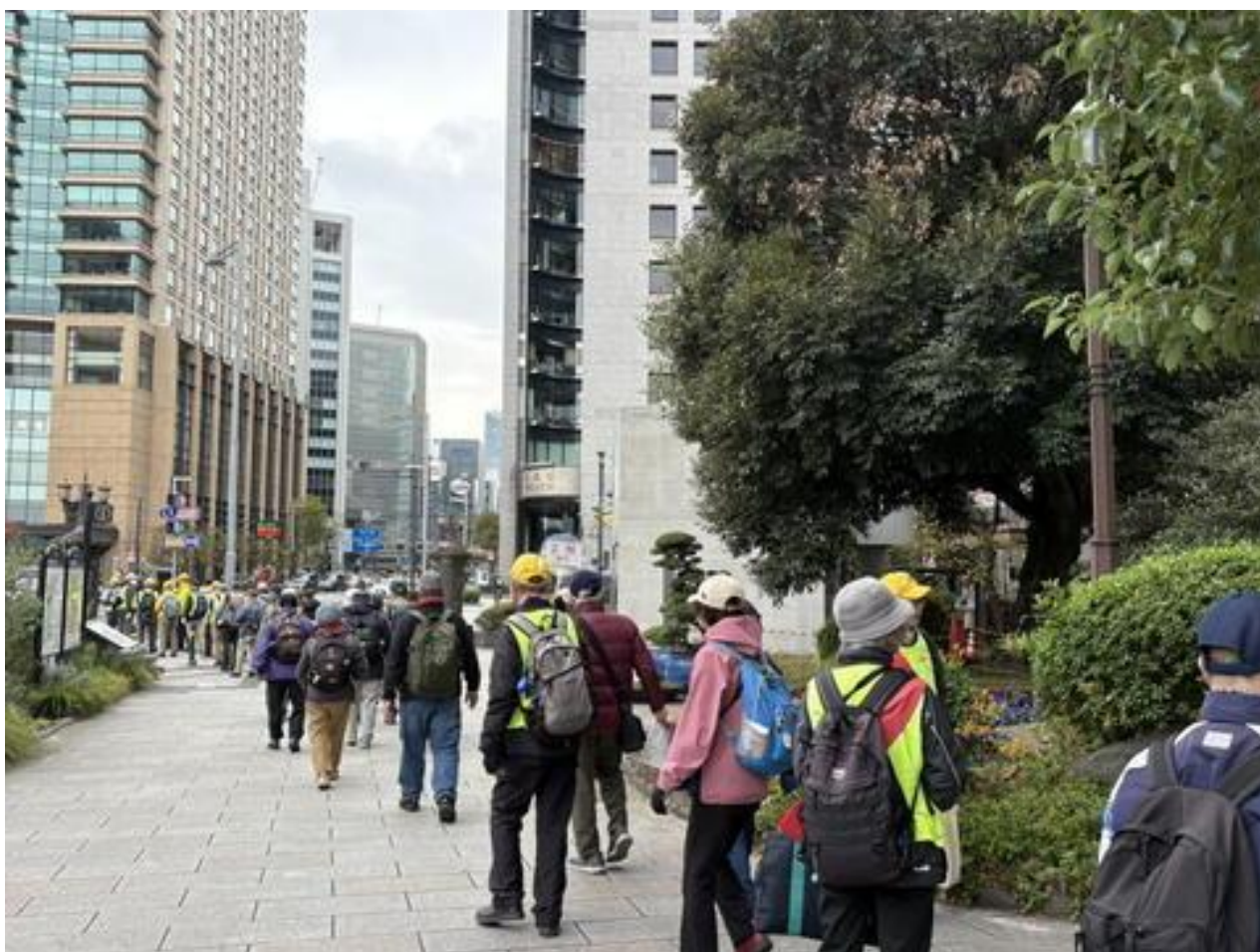
旗手を先頭に、日比谷公園を出発しました。