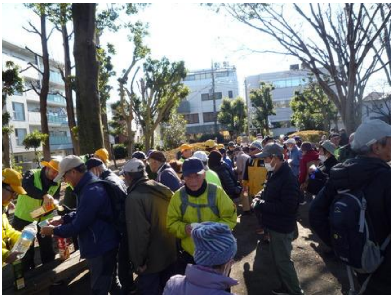
ゴールの天王台西公園では恒例の納会で飲物が振舞われました