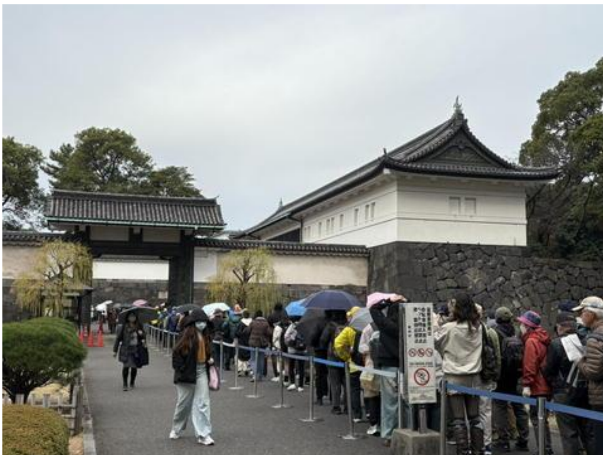
「大手門」入口で、手荷物検査を行っており、長い行列ができていました。