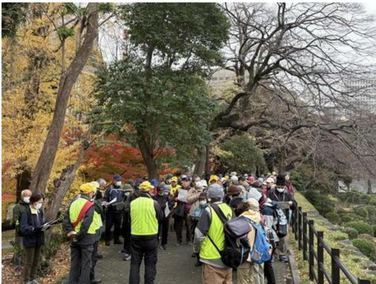
出発式風景 コースリーダーからコース説明がありました。