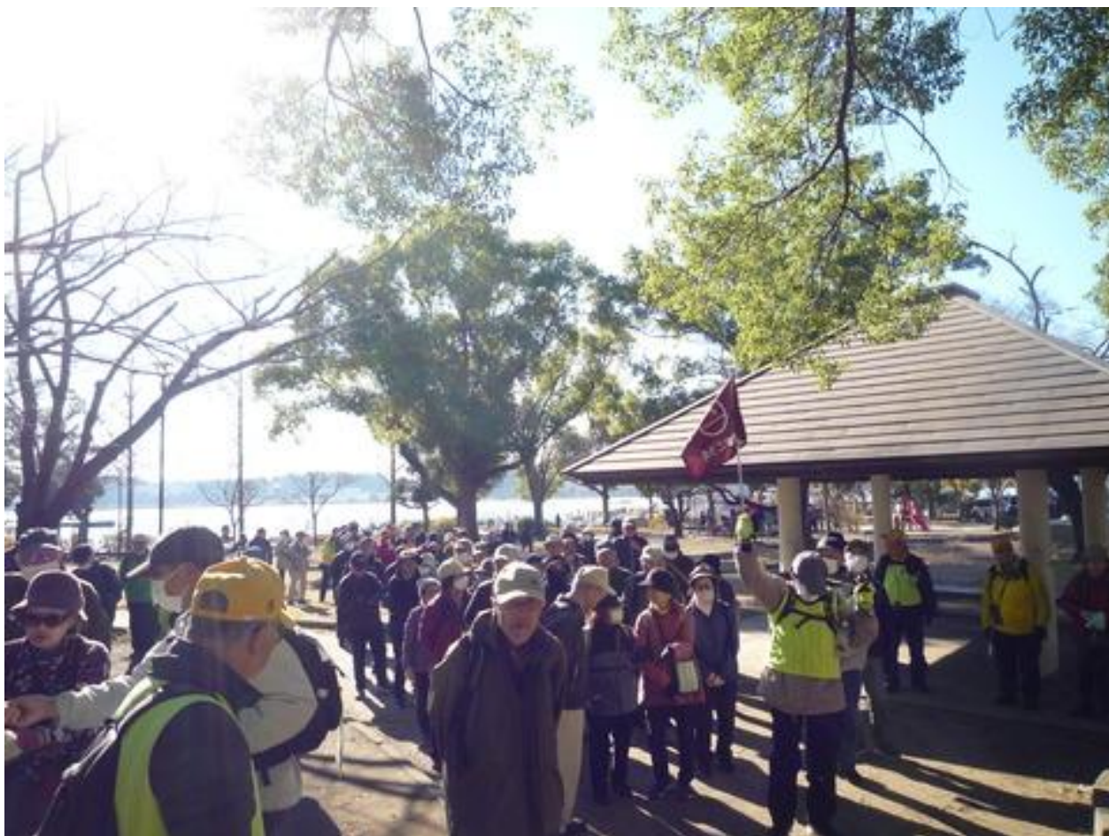
100名を超える参加者が9kmゴールを目指しました