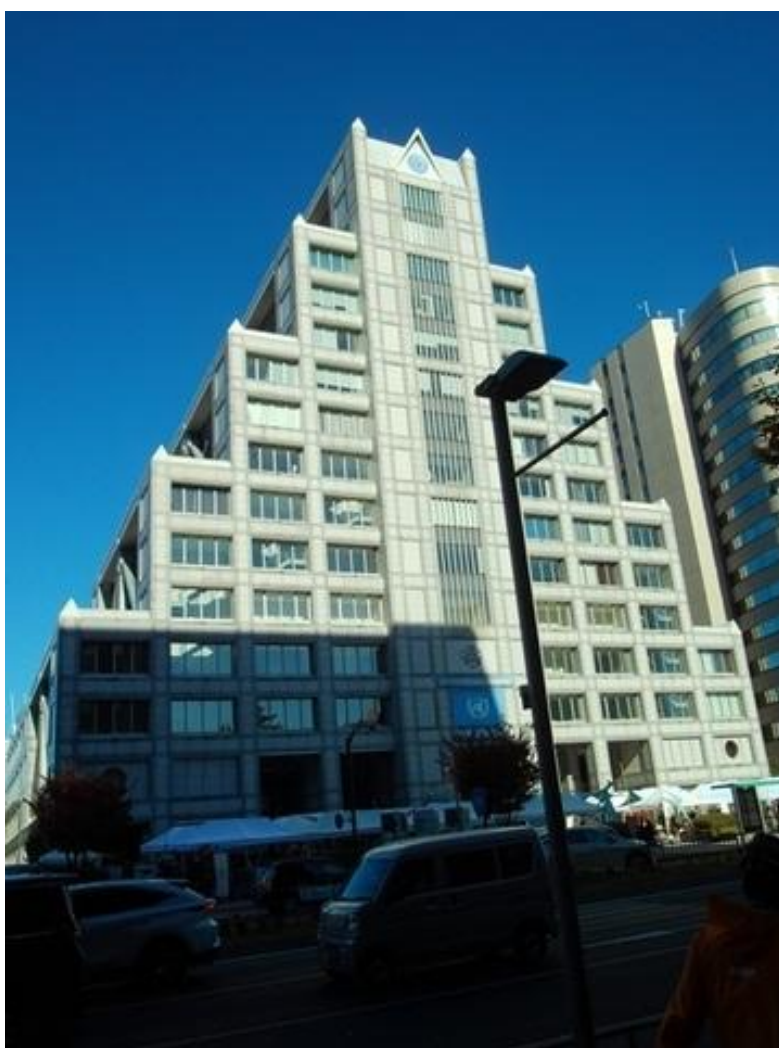
渋谷橋上から見る明治通り