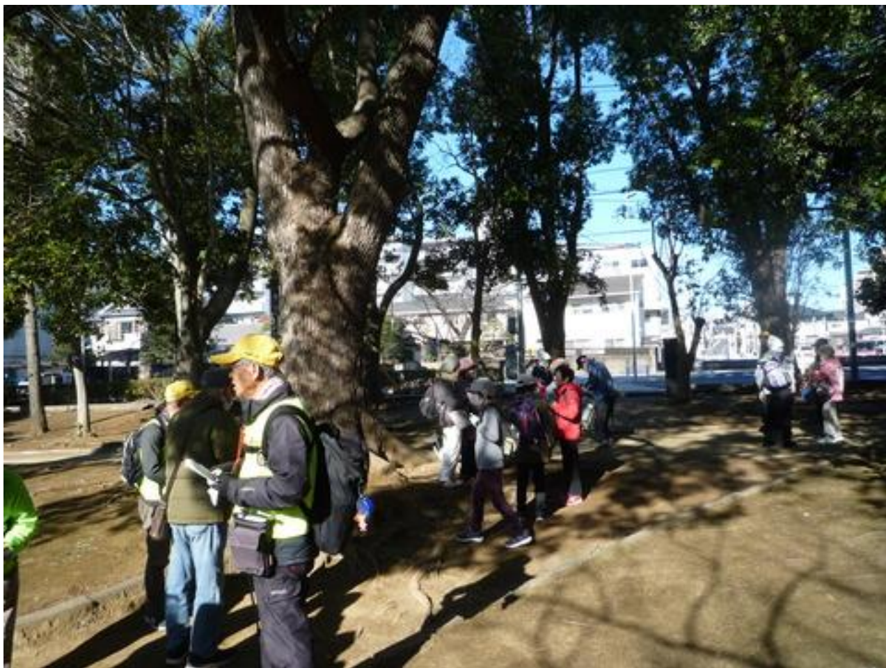
手賀沼公園（5kmコースゴール）で約25名位が帰られました