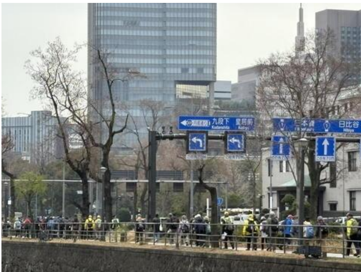
「凱旋濠」脇を通り、ゴールの「楠木正成像」のある皇居外苑広場に向かいました。