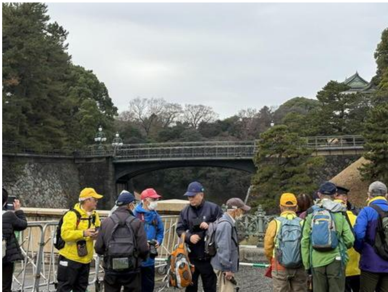
「西の丸玄関門（二重橋）」を見学。