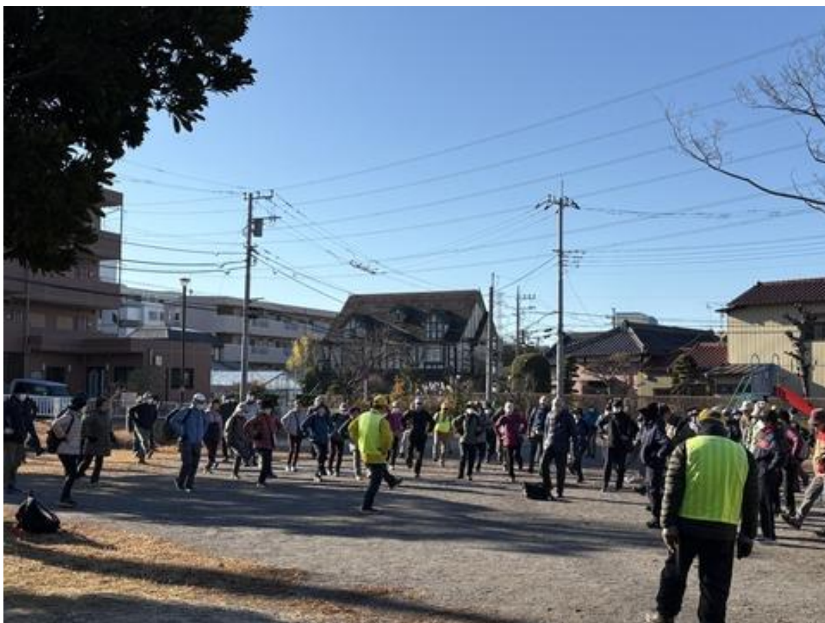
ウォームアップストレッチを行い出発です