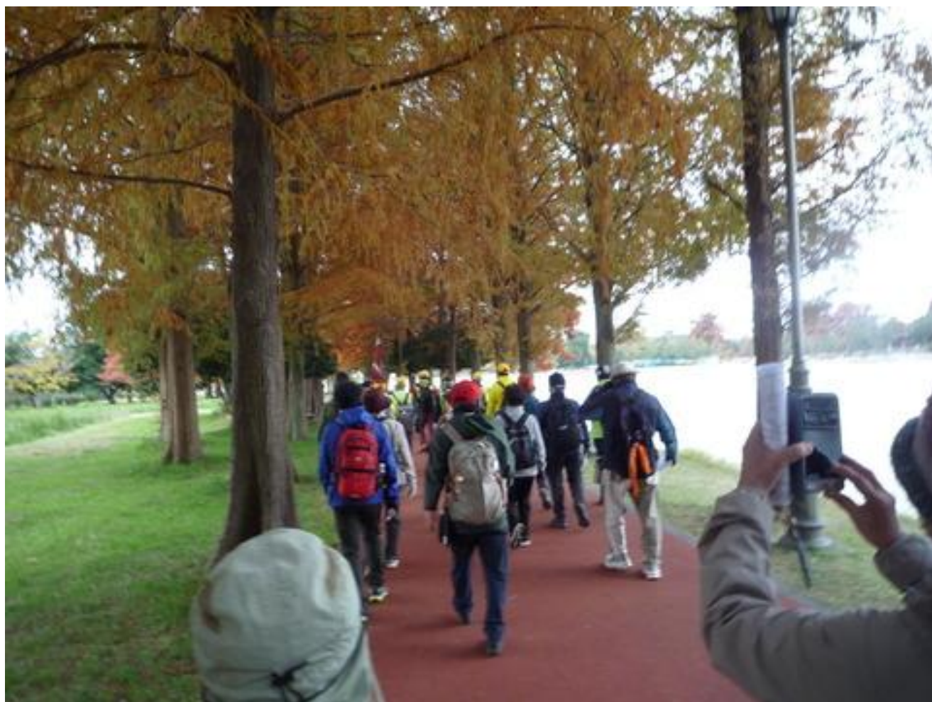
色づいたメタセコイア並木を進む参加者