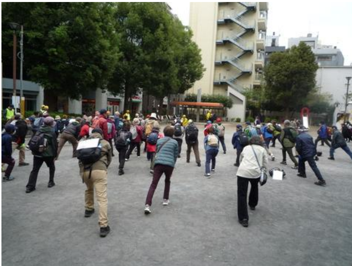
ウォームアップストレッチをしました