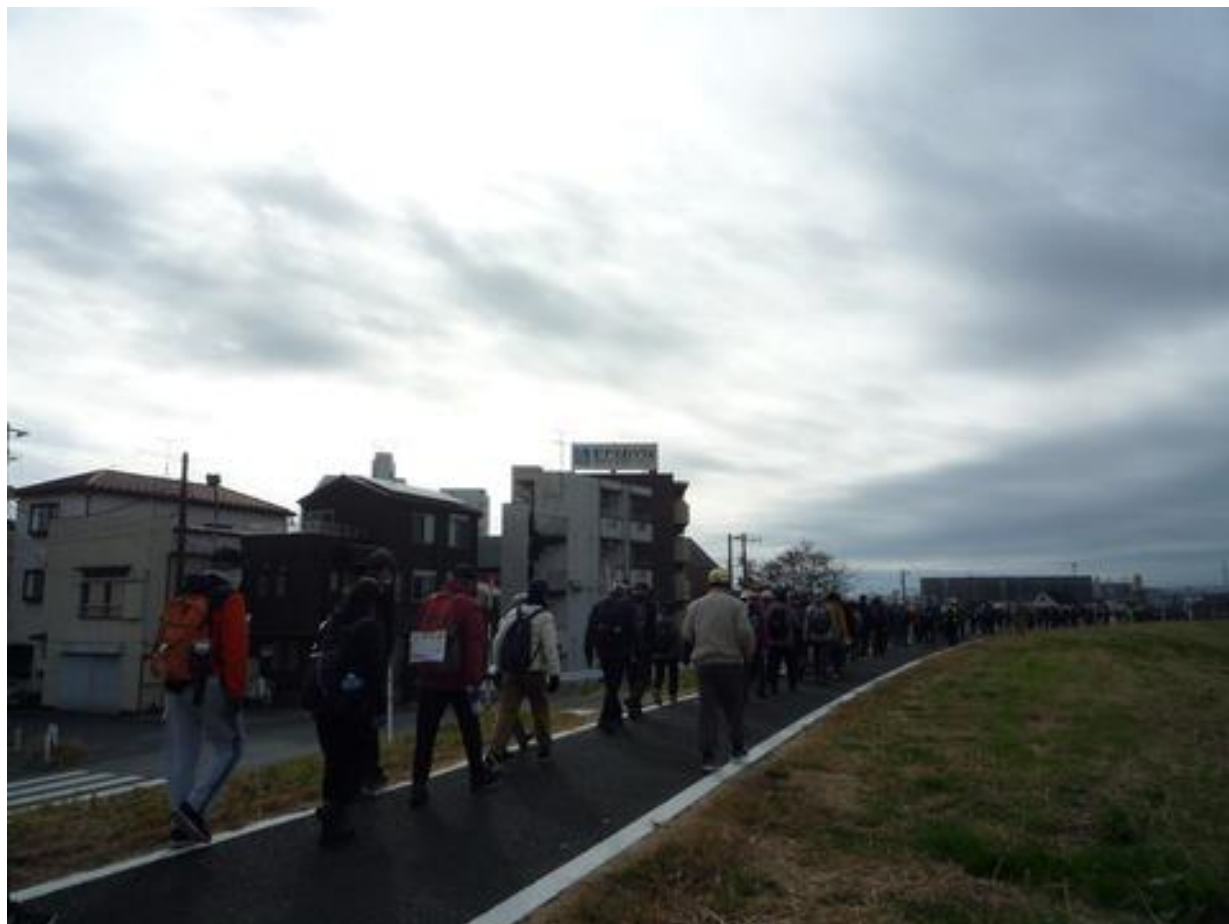
江戸川土手に登り整然と歩いています