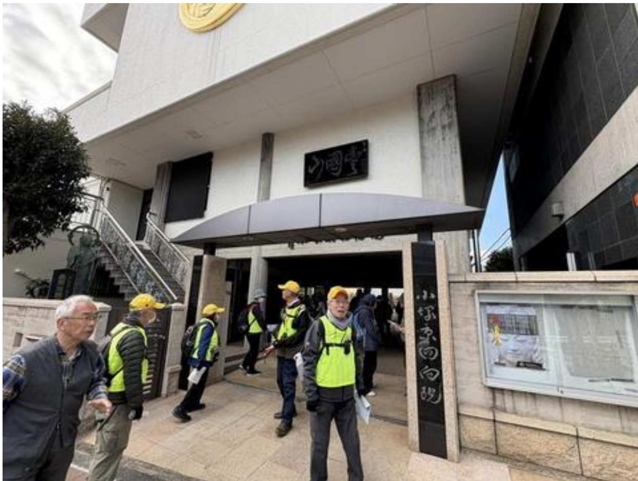
「小塚原回向院（こずかっぱらえこういん）」を参拝した後、