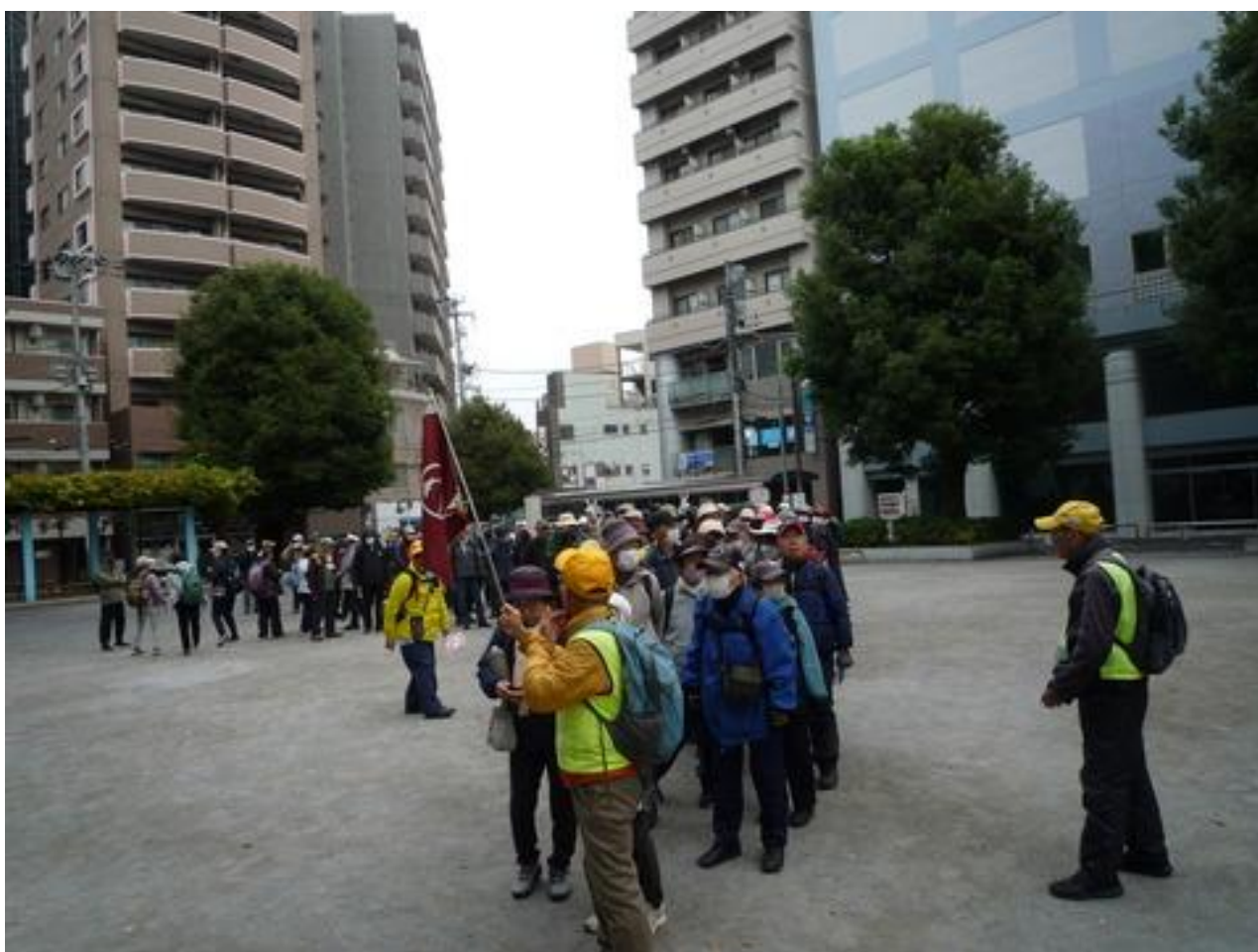
長い列で出発です