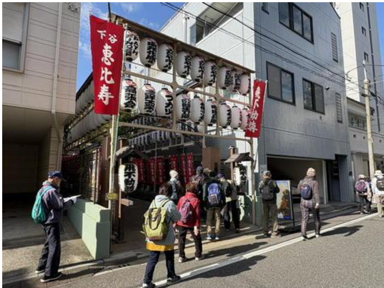
「下谷飛不動尊」前を通り・・・