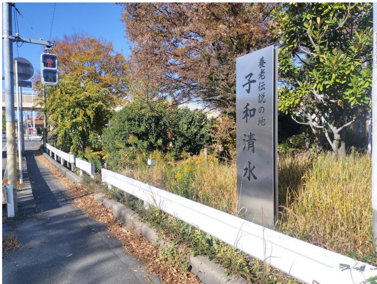
道路の三角州で目立ちませんがコース上にありました。養老伝説