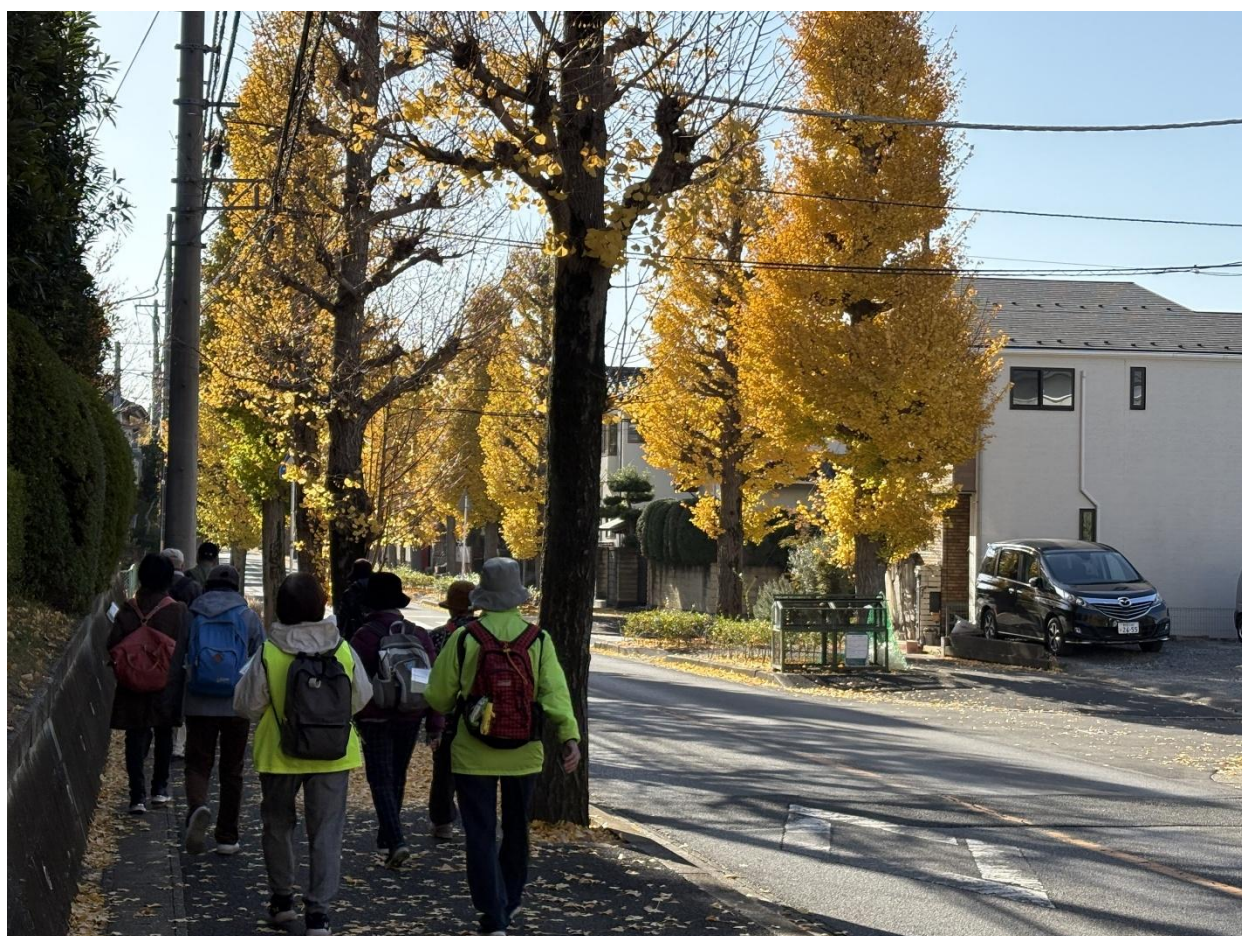
市街地を黙々と落ち葉を踏みしめて歩く参加者