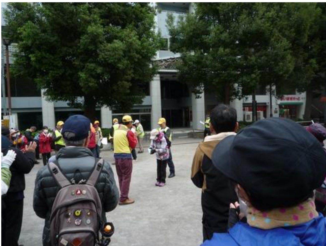
開会式では北総パスポートの表彰がありました