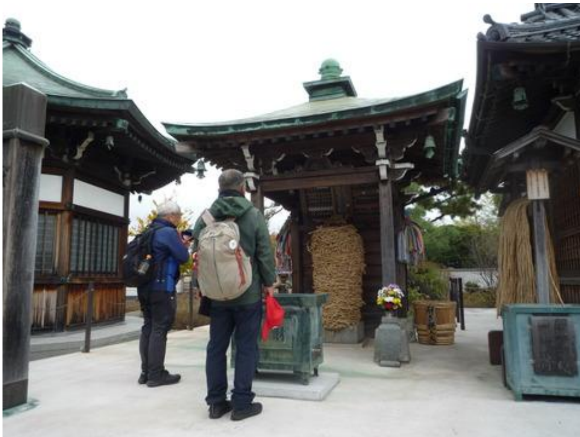
南蔵院の縛られ地蔵を参拝しました