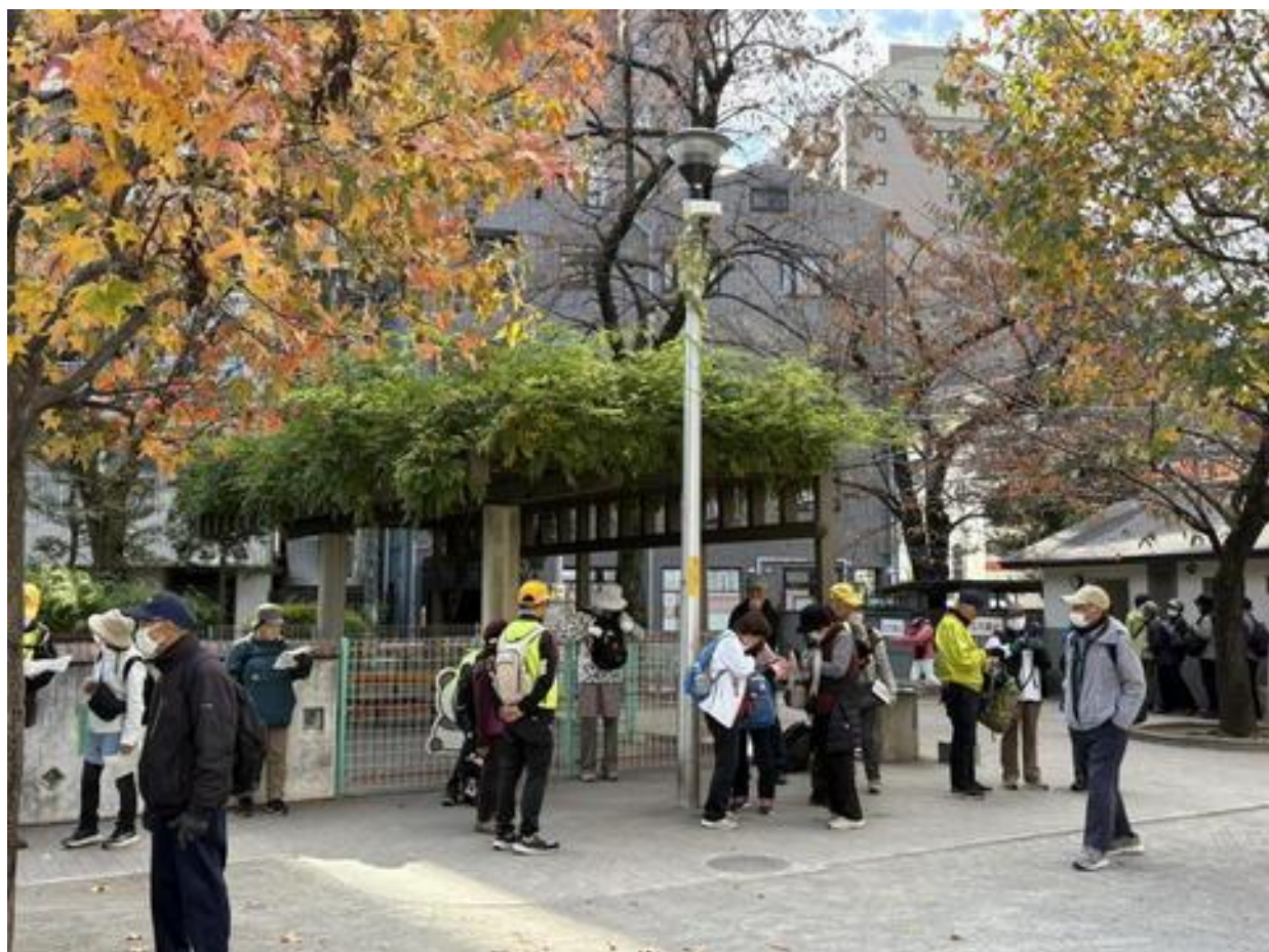
「入谷南公園」でトイレ休憩。