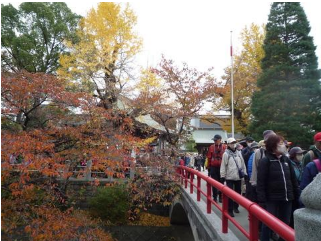
松戸神社の宮前橋の紅葉が見事でした