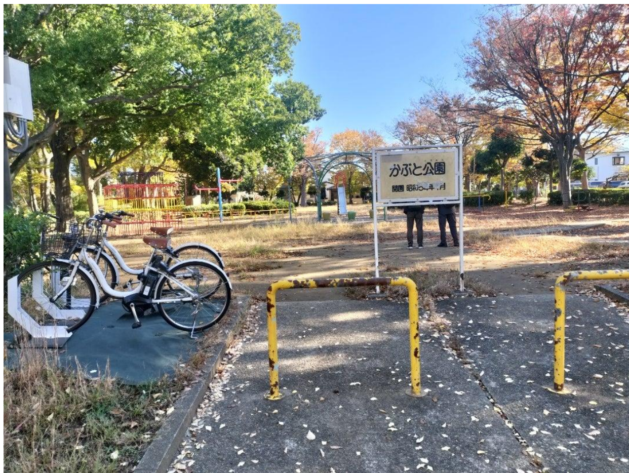
かぶと公園ではいろいろなカラーバリエーションも楽しめました