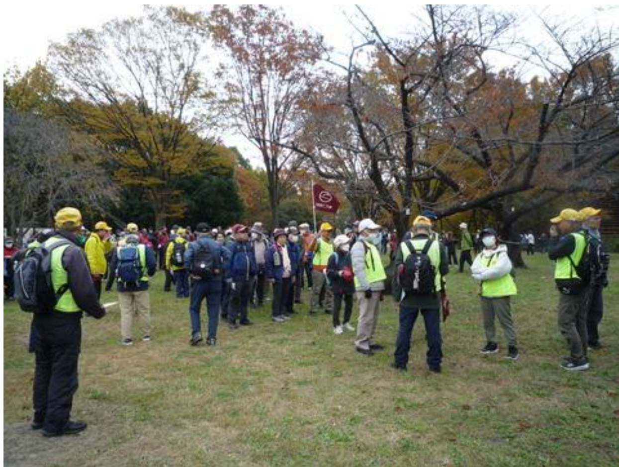
最初の休憩地の東金町ふれあい広場でスタートを待つ参加者