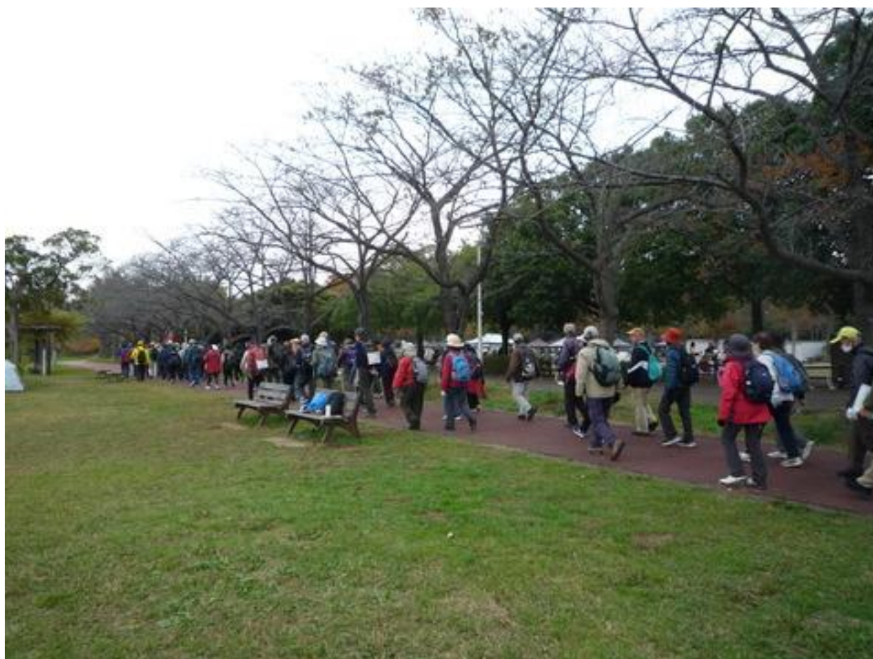
みさと公園の遊歩道を周遊する長い列、自由散策としましたが殆どが団体歩行でした