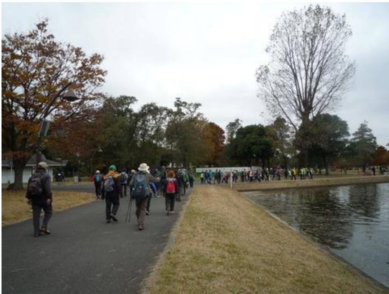
みさと公園から水元公園の睡蓮池に向かう参加者達