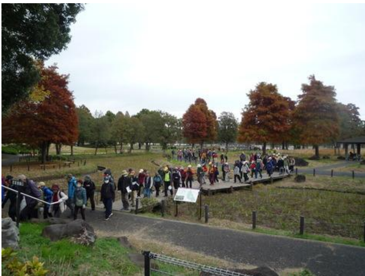
休憩の後、睡蓮池を出発する長い列