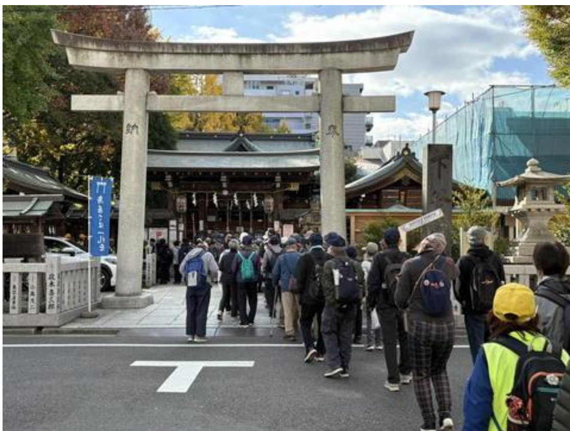
出発して20分ほどで、「下谷神社」（稲荷町駅近く）に到着。

※730年（奈良時代）に創建された。都内で最も古い「お稲荷様」で稲荷町の名の由来となっているようです。