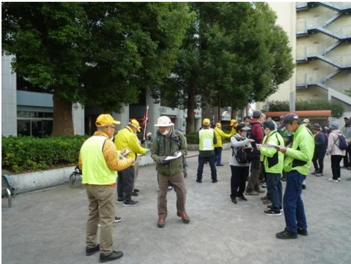
5 分前から受付を開始しました