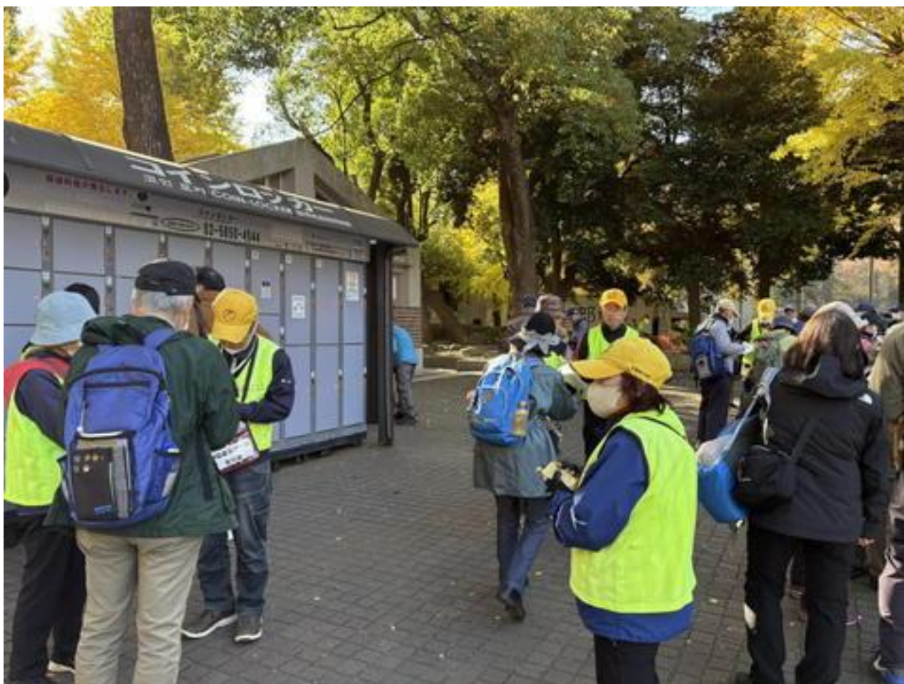
受付風景（上野恩賜公園 動物園前交番前広場）