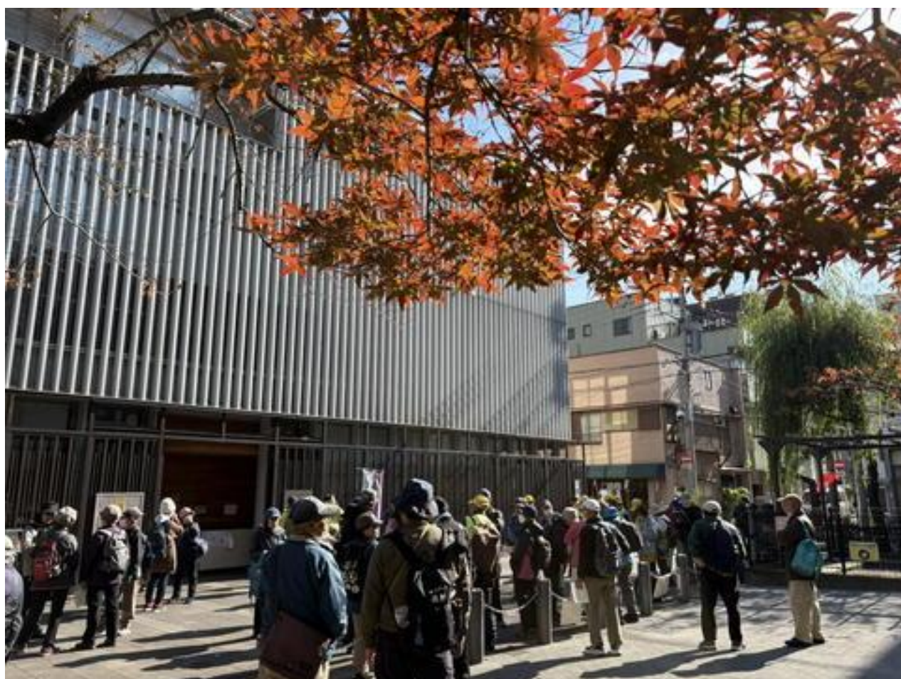
「一葉記念館」前の「一葉記念公園」でトイレ休憩。