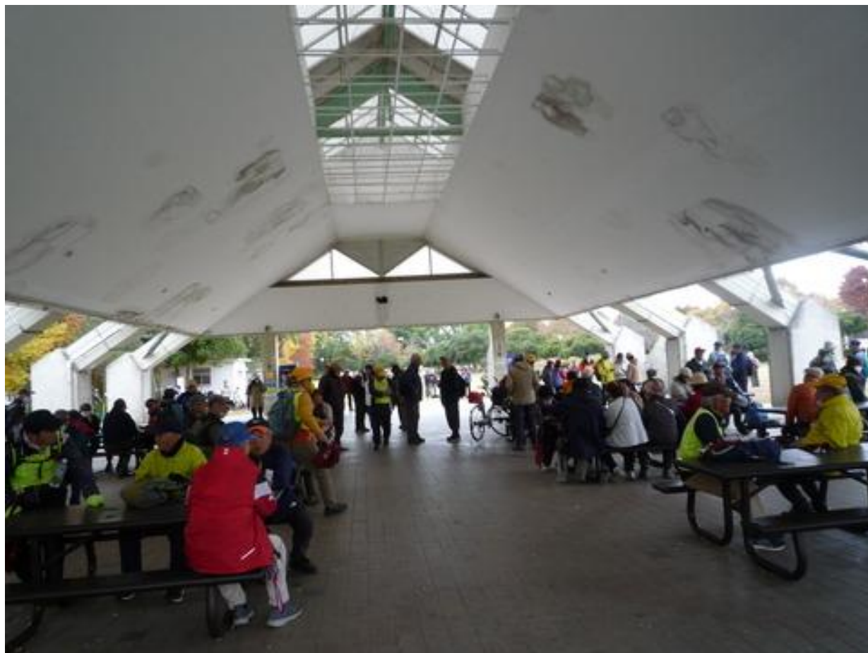
みさと公園に入り、休憩舎でくつろぐ参加者達