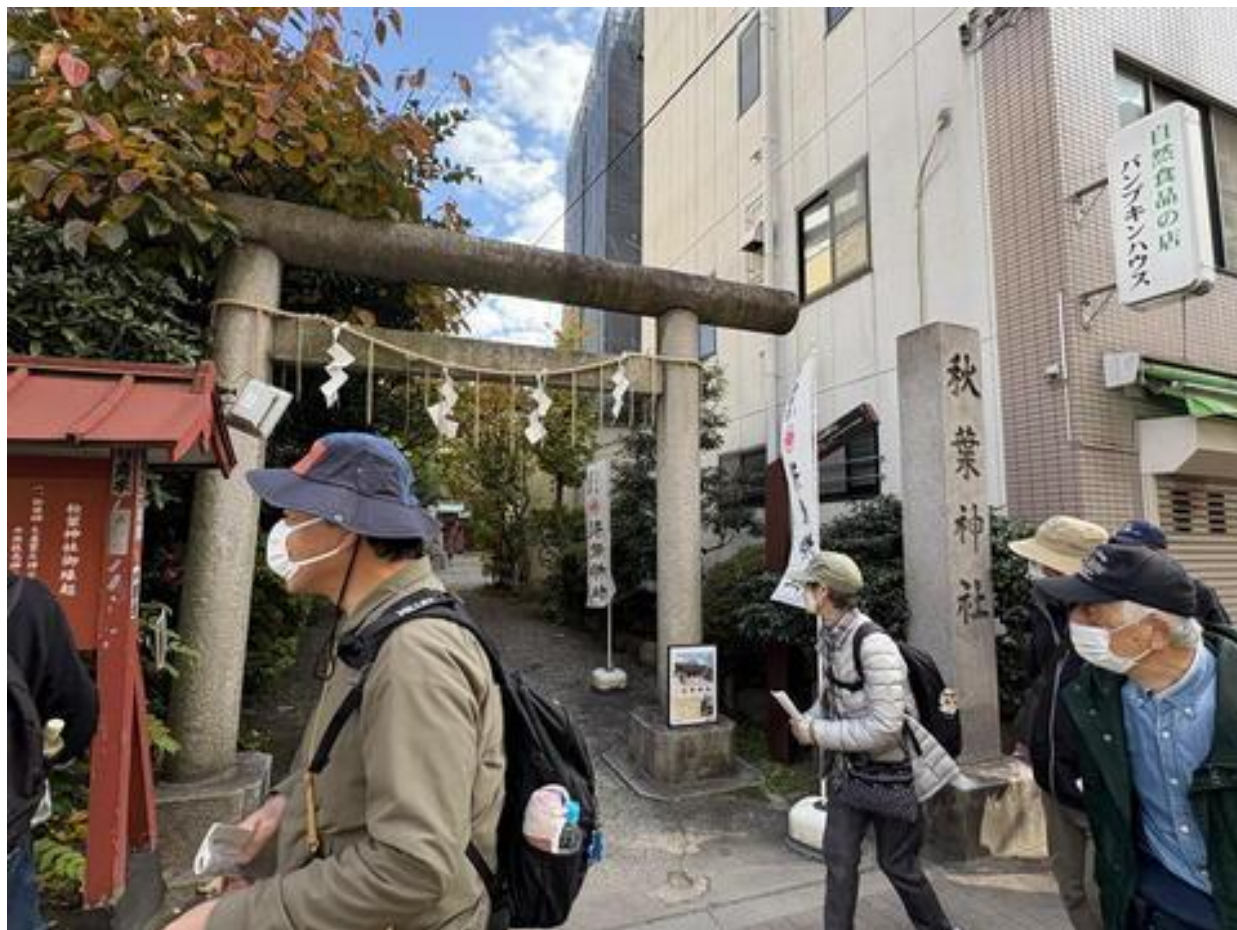
「秋葉神社」前を通り・・・