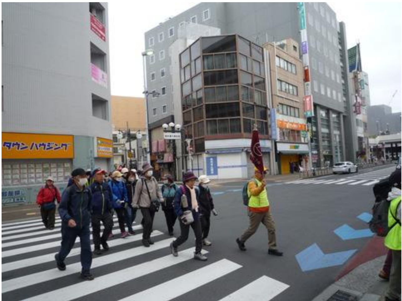
松戸の駅前大道路を横断しています