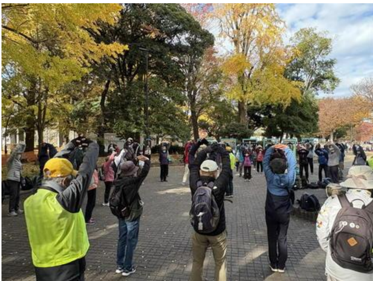
いつものように、ウォーミングアップを行いました。