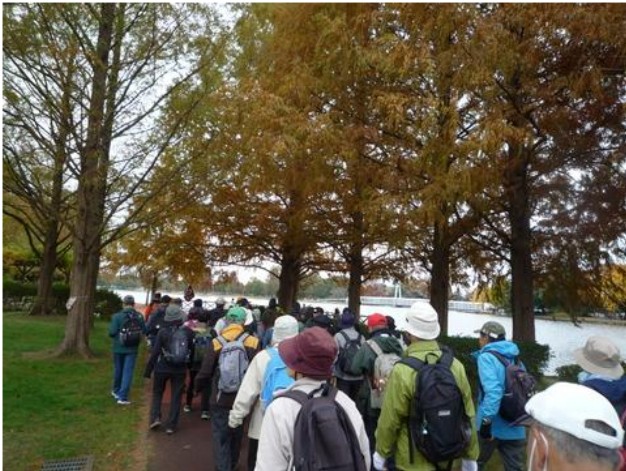
小合溜越しに水元公園が見え良い眺めです