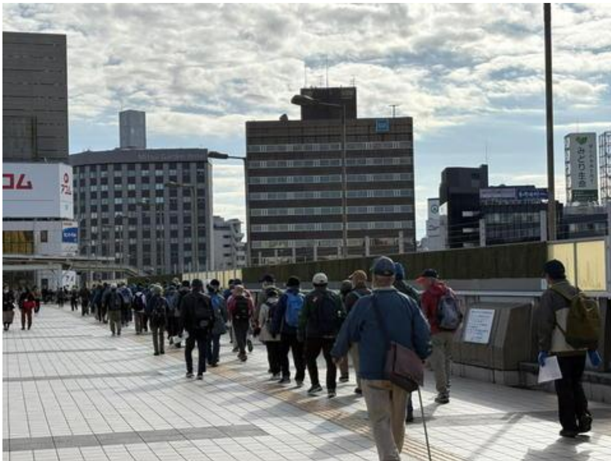
上野公園からパンダ橋を渡り、上野駅入谷口方面に抜けました。