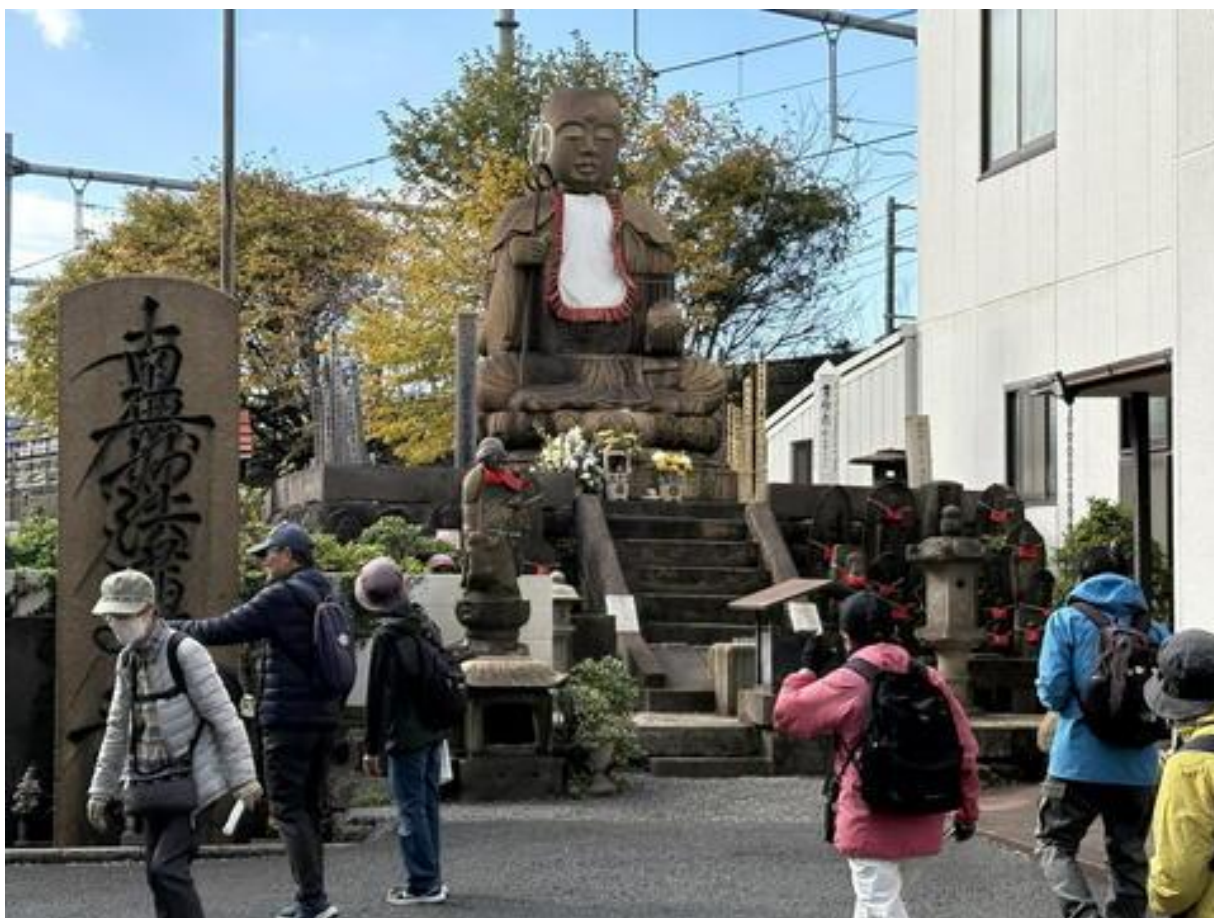
「延命寺・小塚原刑場跡」をまわり、ゴールの南千住駅に向かいました。