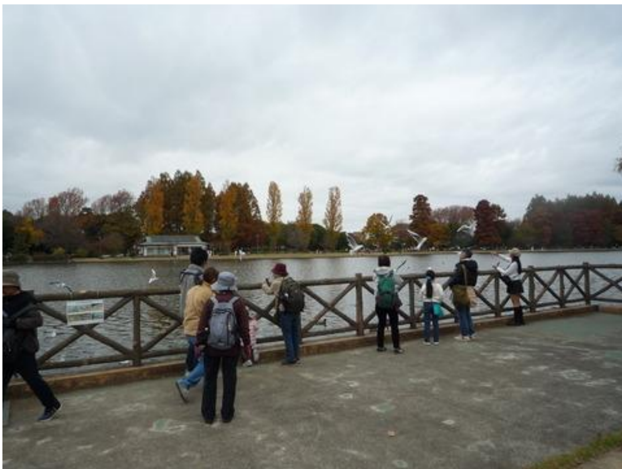
水上テラスではかもめの大群と水元公園の紅葉が見られました