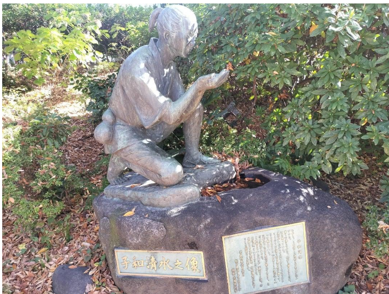
子和清水の由来が書いてあります