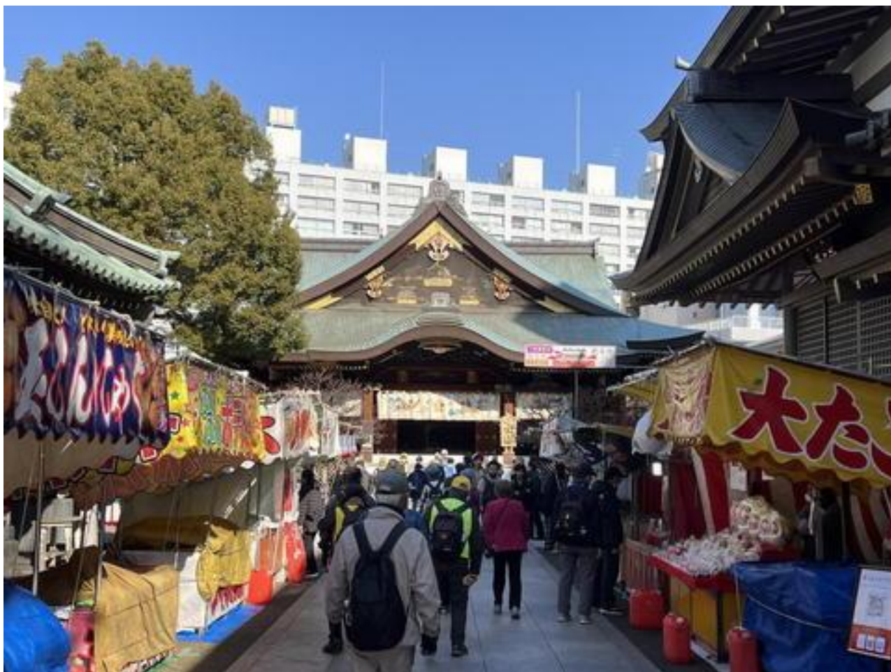
「湯島天満宮」に到着。参拝した後、境内を抜け・・・