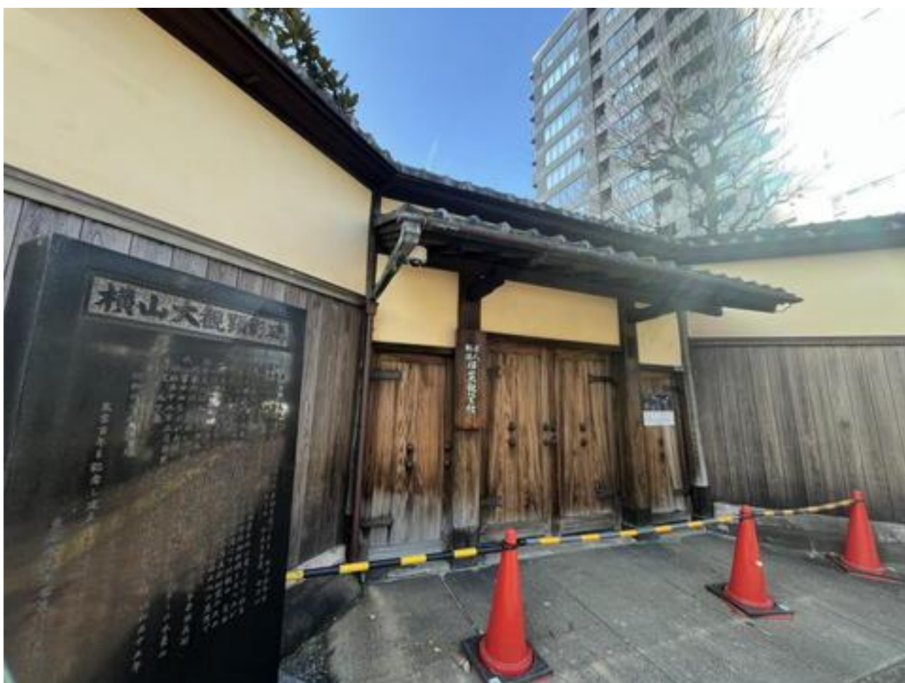
「横山大観記念館」前を通り・・・