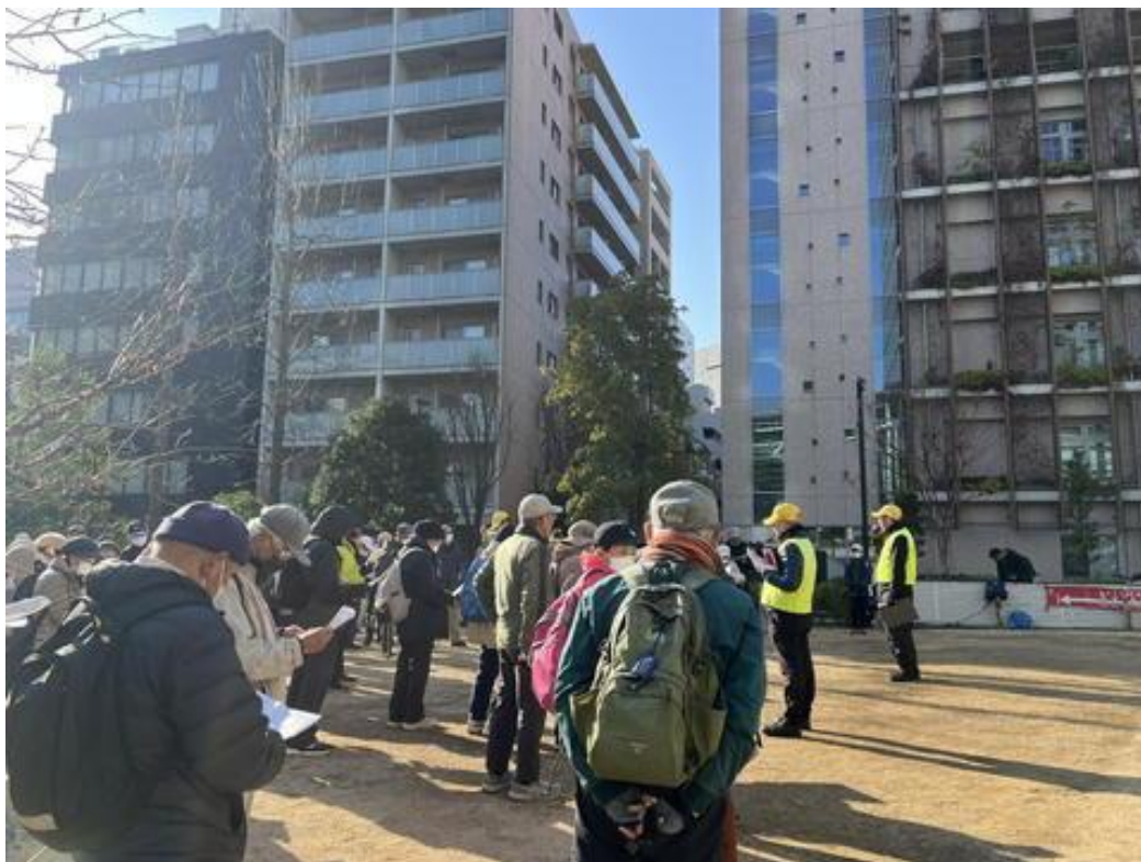
出発式風景 (コースリーダーからコース紹介がありました。)