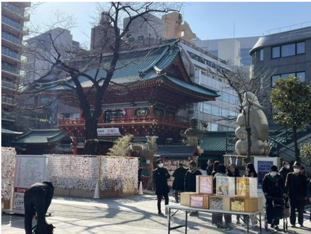
「神田明神」を参拝して、