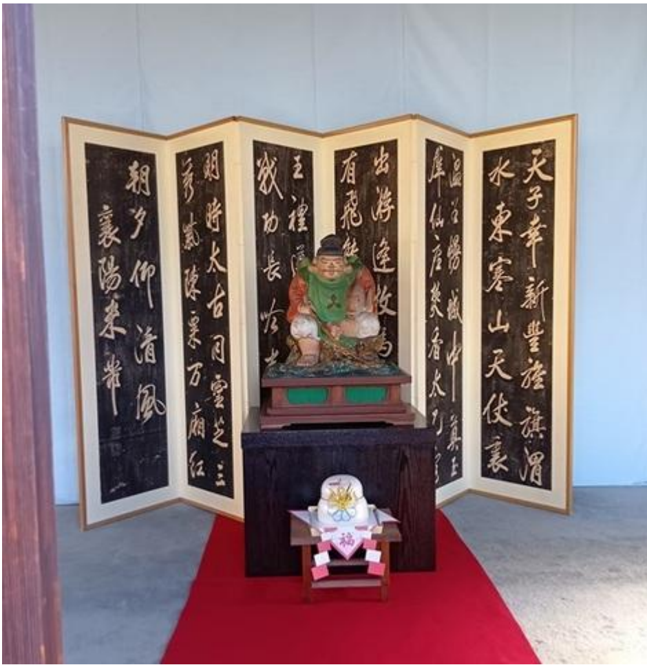
修正院の本堂と壁画の布袋尊