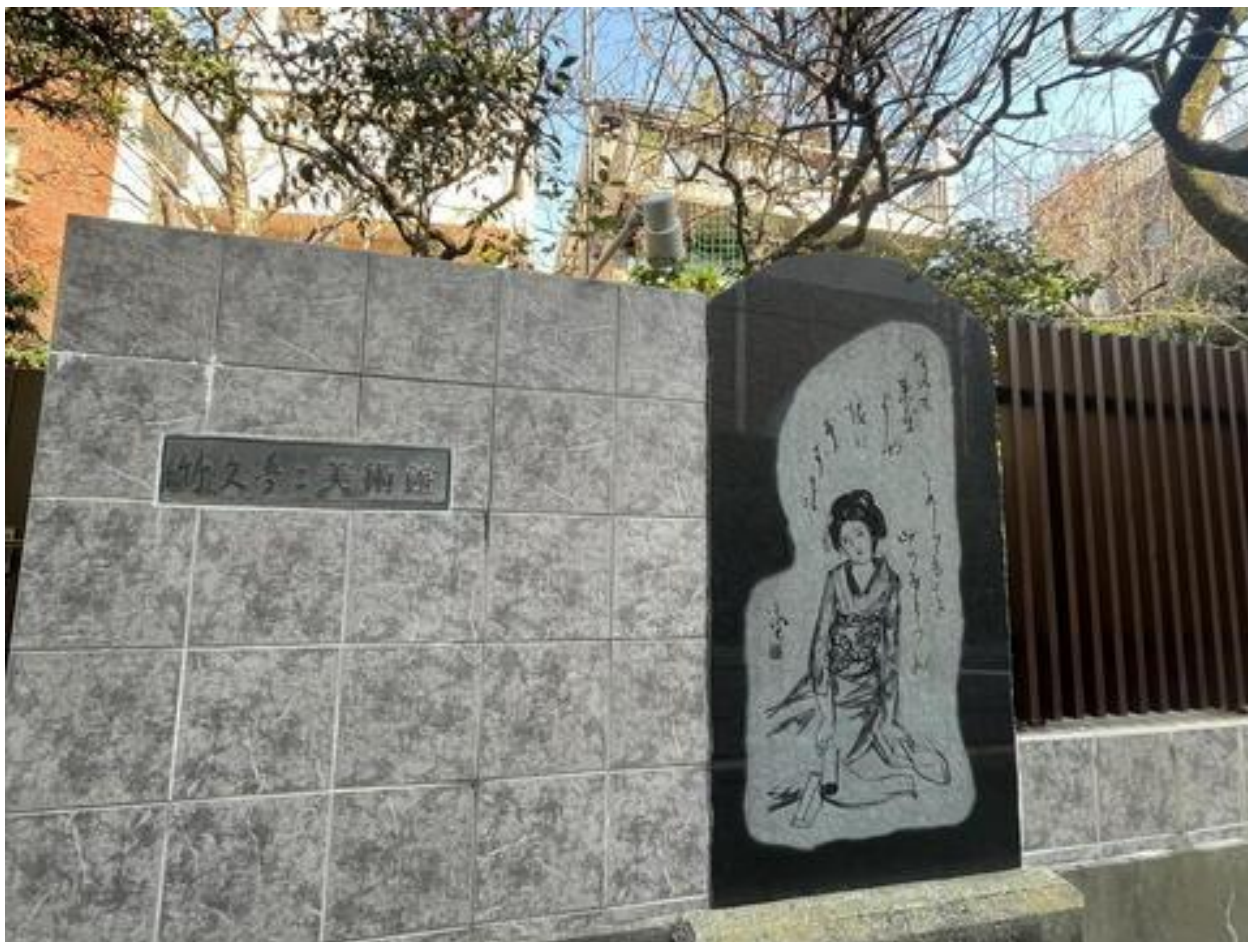
「竹下夢二美術館」前を通り・・・