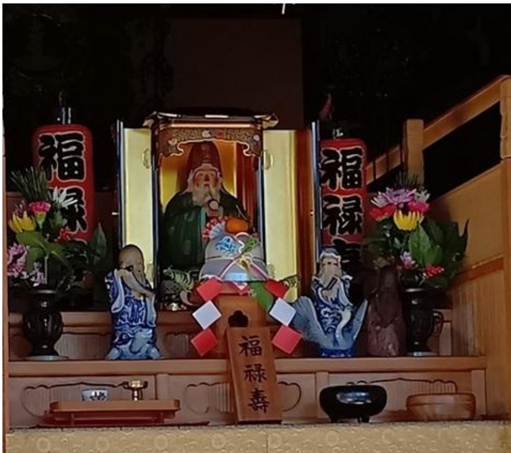
青雲寺の本堂と恵比寿