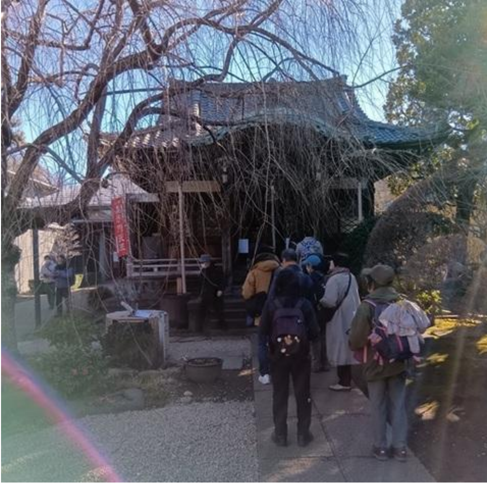
護国院の本堂 ※大黒天は堂内の為、写真無し