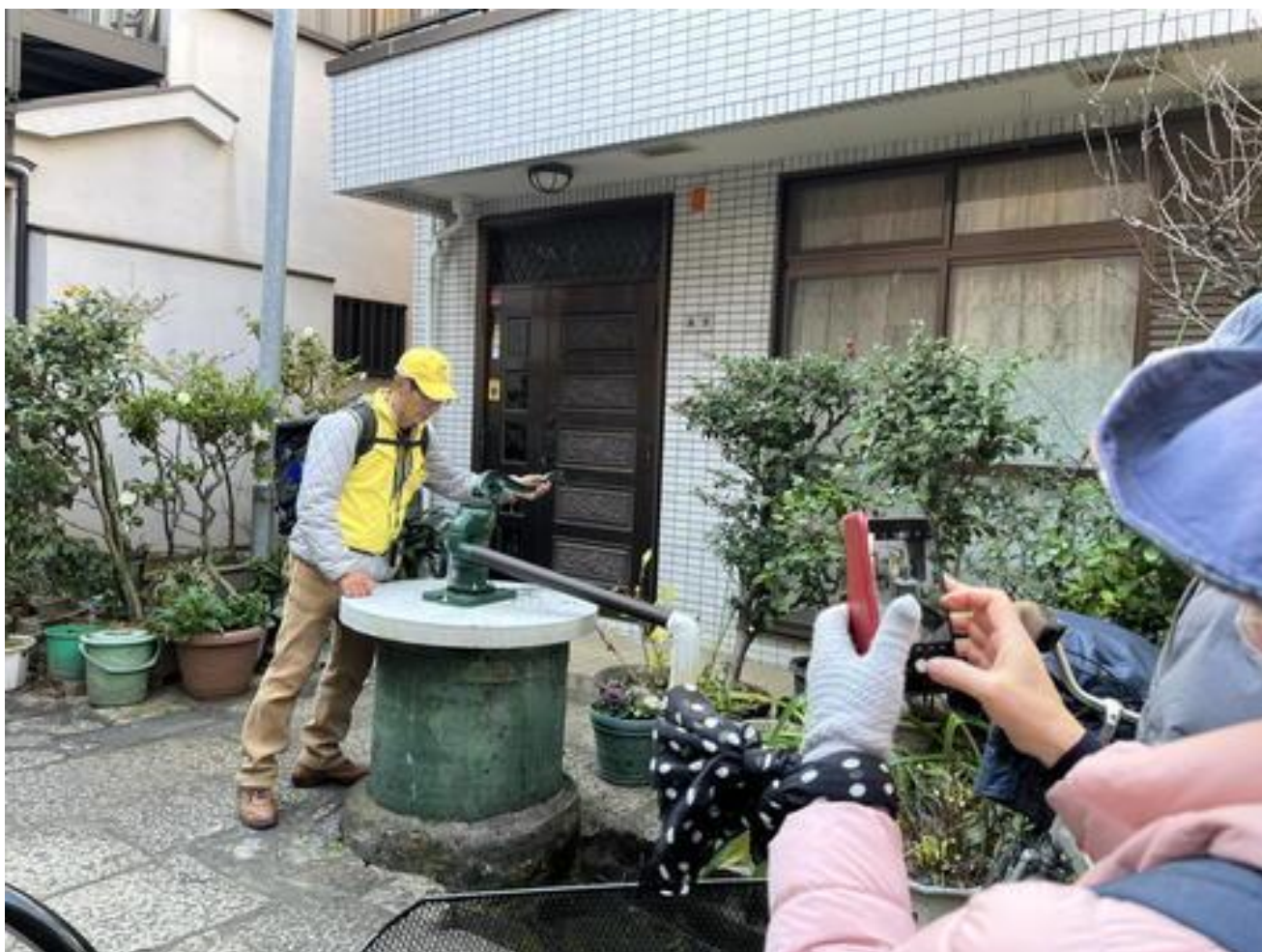
「一葉旧居跡の井戸」を見学。