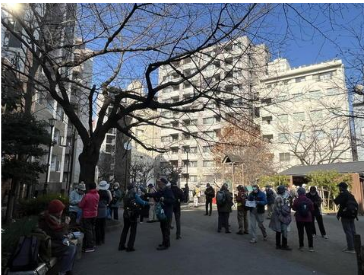
すぐ裏の「宮本公園」で、トイレ休憩。