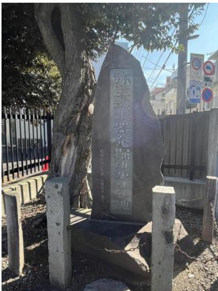
「弥生式土器ゆかりの地碑」を見学して・・・