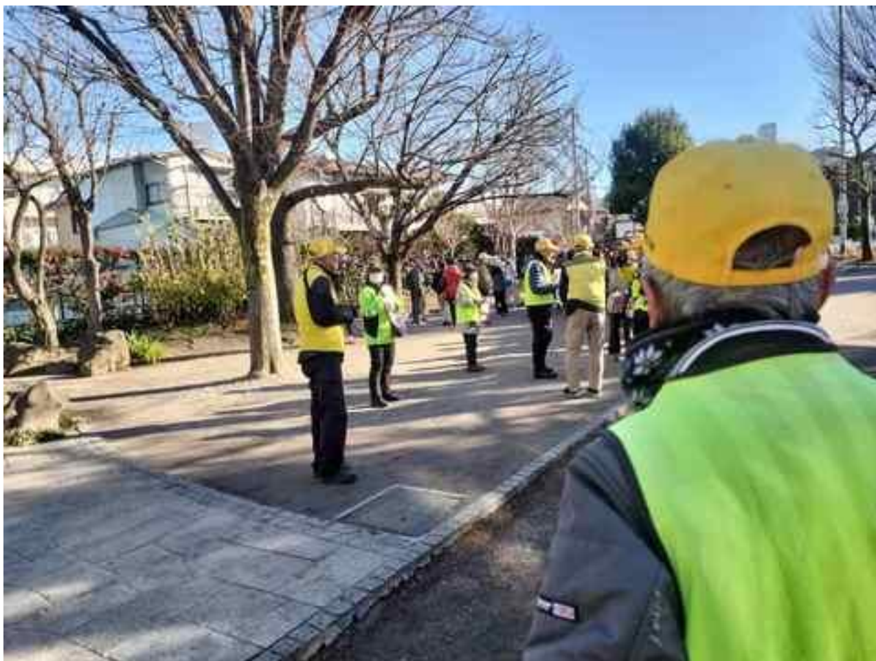
東覚寺の本堂と福祿寿