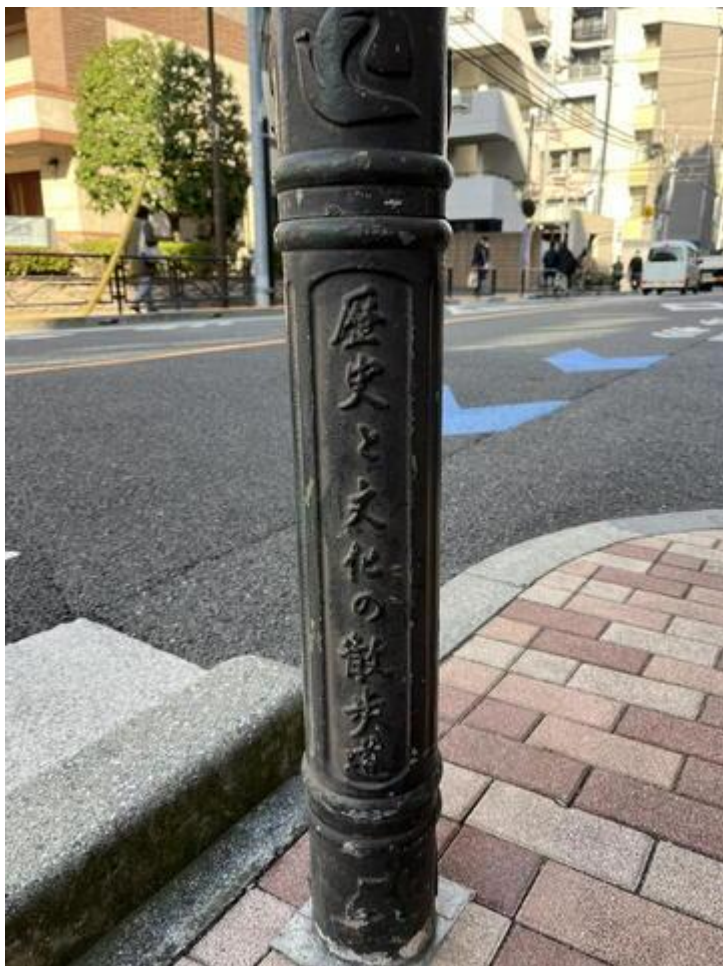
「歴史と文化の散歩道」を通り、