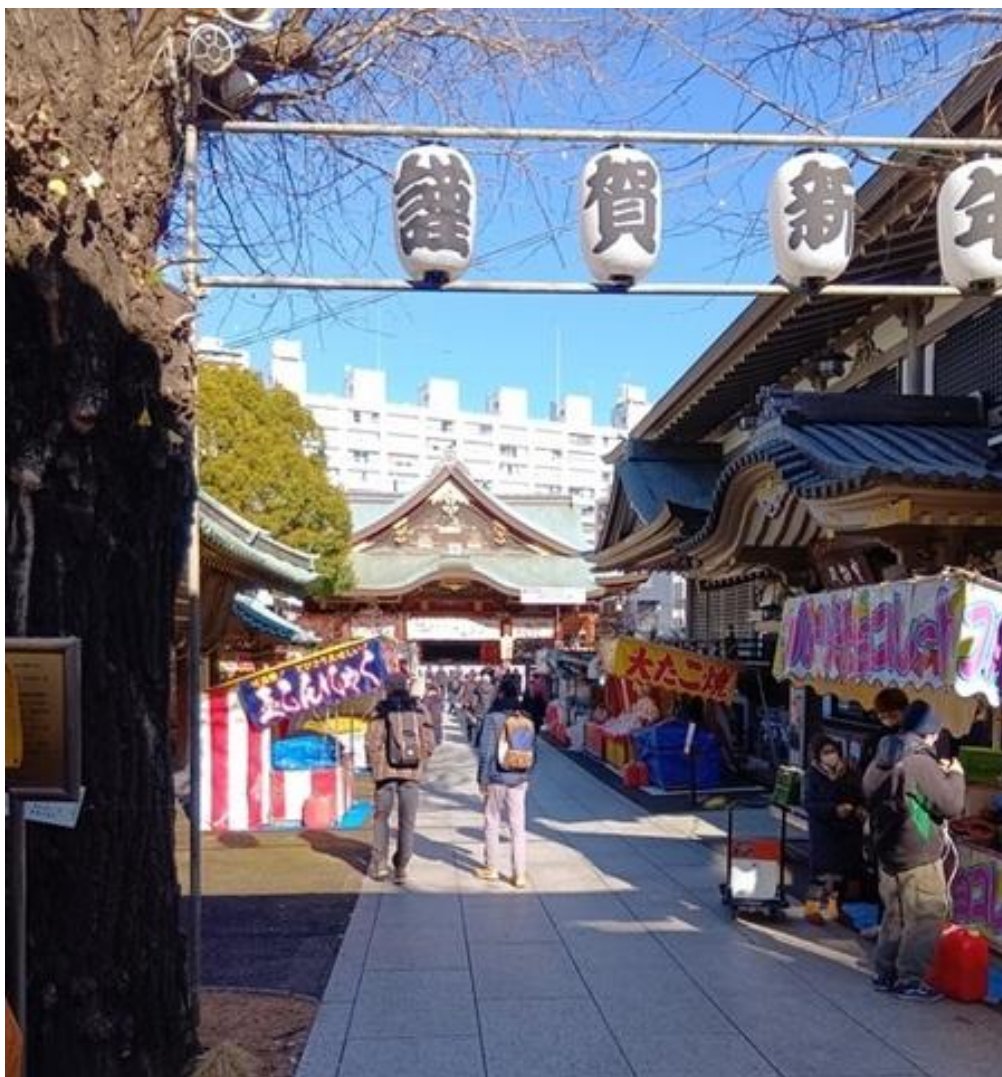
不忍の池と弁天堂