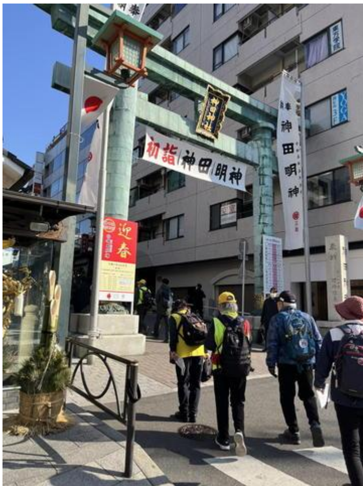
「神田明神」（正式名は神田神社）に到着。