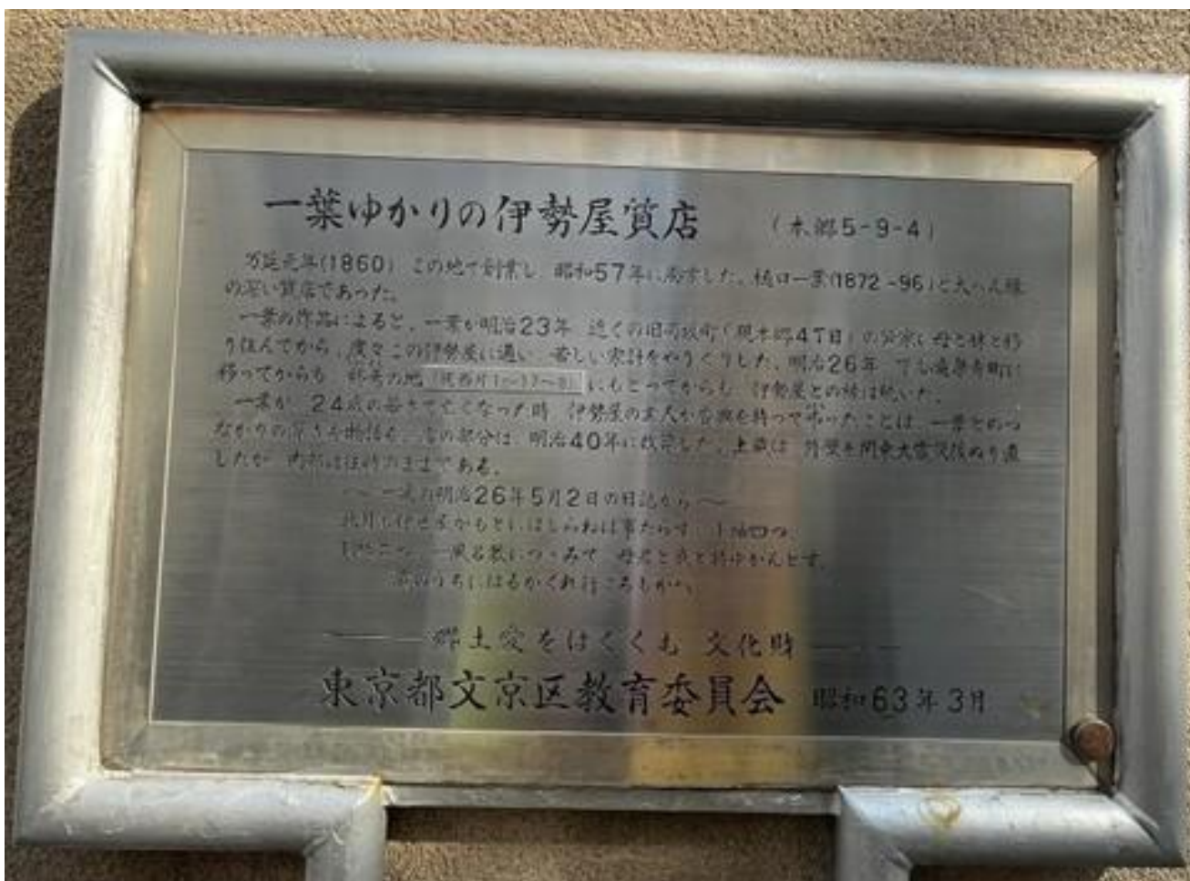
「一葉ゆかりの伊勢屋質店」前を通り・・・