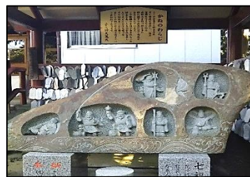
かねのわらじと七福神

湖北・北柏スタートで今回は天王台スタートです。大正浪漫を感じつつ裏道を歩きながら我孫子の魅力を再発見できればと思います。ゴール後14時から定期総会が開催されます。多くの方のご参加をお待ちしています。