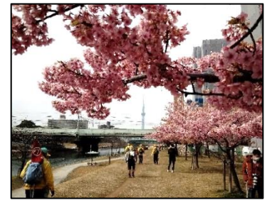
小松川ポンプ場前の河津桜

コース/亀戸駅前公園~亀戸天神~龍眼寺~天祖神社~普門院~香取神社~東覚寺~常光寺~亀戸水神~亀戸中央公園(昼食最適地)~旧中川桜観賞~7km 分岐平井橋~10km 分岐点~堀切駅