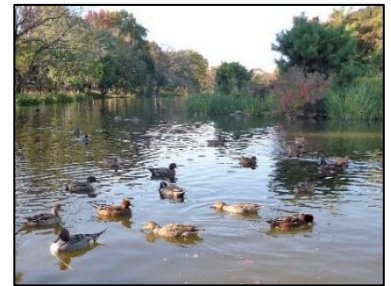
じゅん菜池と冬鳥

コース/松戸駅西口ペデストリアンデッキ~松戸神社~戸定が丘歴史公園(WC)~浅間神社~野菊の墓文学碑(WC)~じゅん菜池緑地(WC)~里見公園(WC)~国府台駅手前江戸川堤防