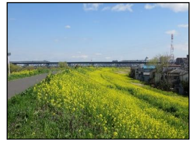
江戸川土手の菜の花

○みどころ 春風に乗って自然豊かな運河と江戸川堤をウォーキングし、土手いっぱい咲き誇る菜の花の香りをかぎながら春を満喫しましょう。