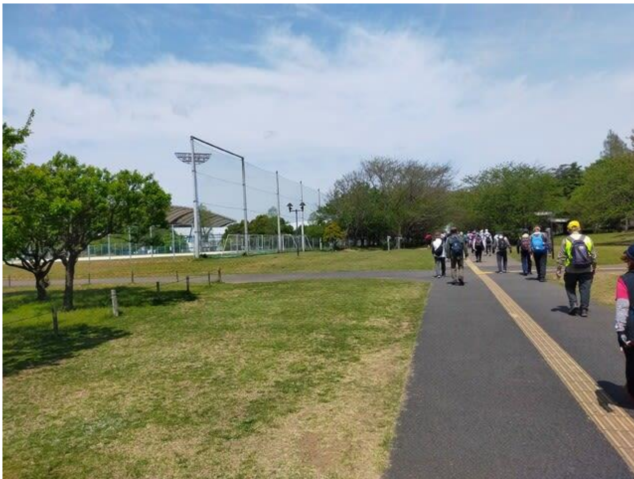
一番奥の野球場の脇に咲いています。