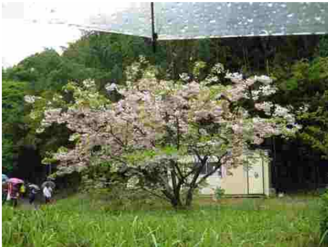
コース途中に咲いていた八重桜が綺麗でした。