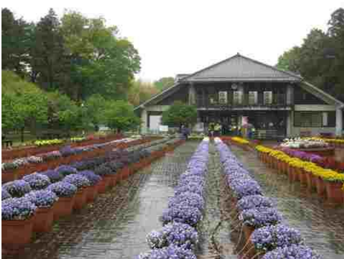
あけぼの山農業公園の花壇に咲く花