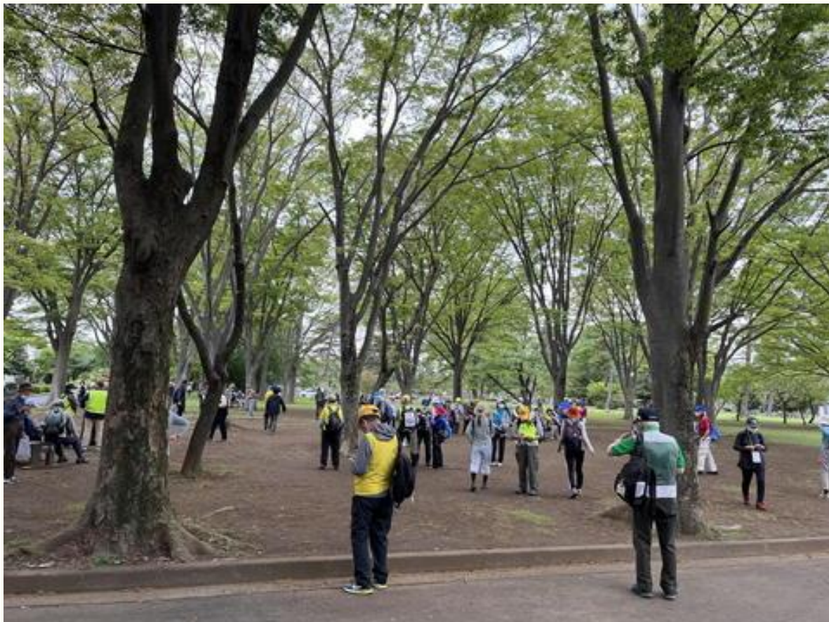
八柱霊園内の「ふれあい広場」で休憩をとりました。