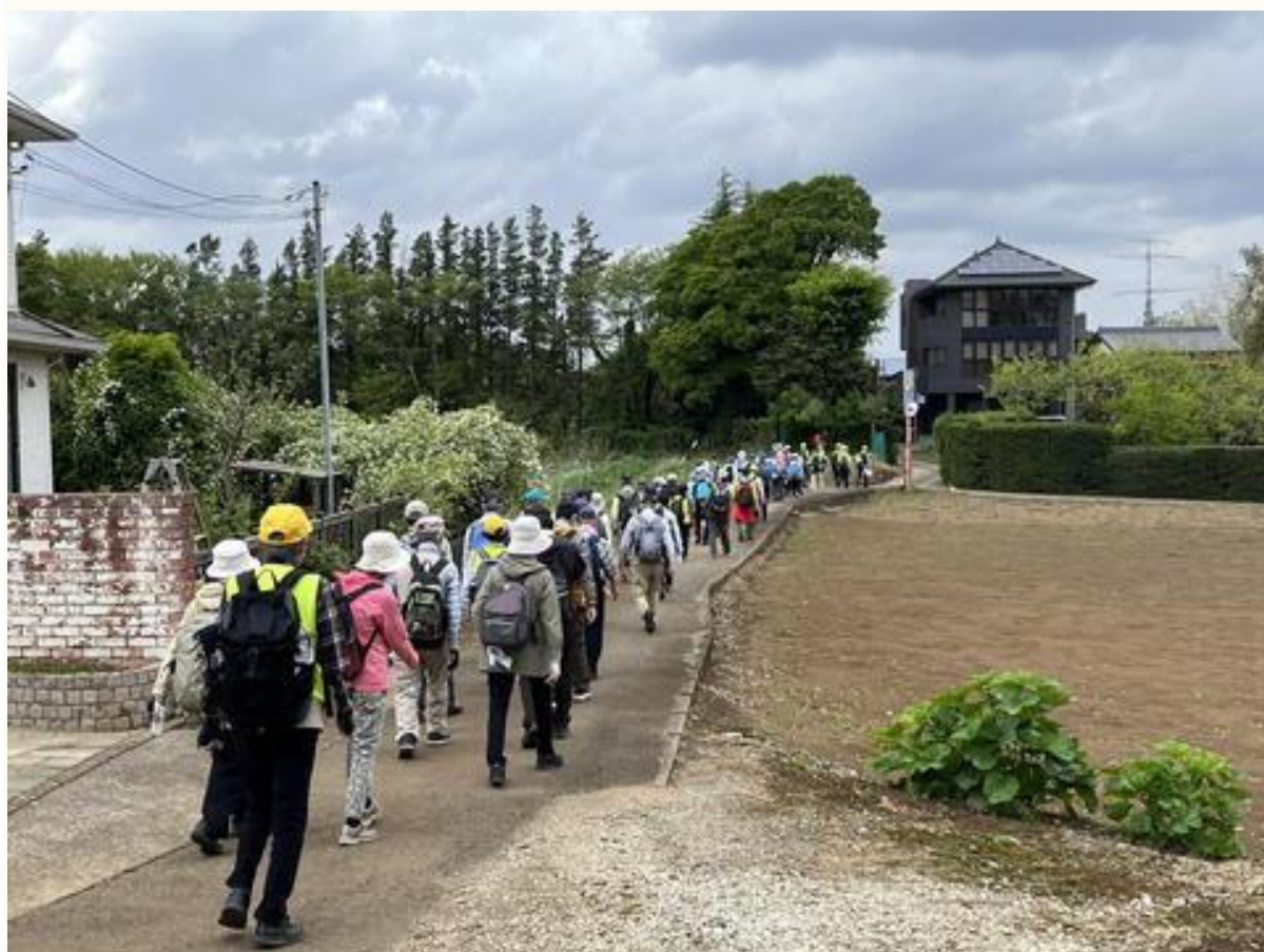
次の休憩場所「和名ヶ谷スポーツセンター」に向かう参加者。