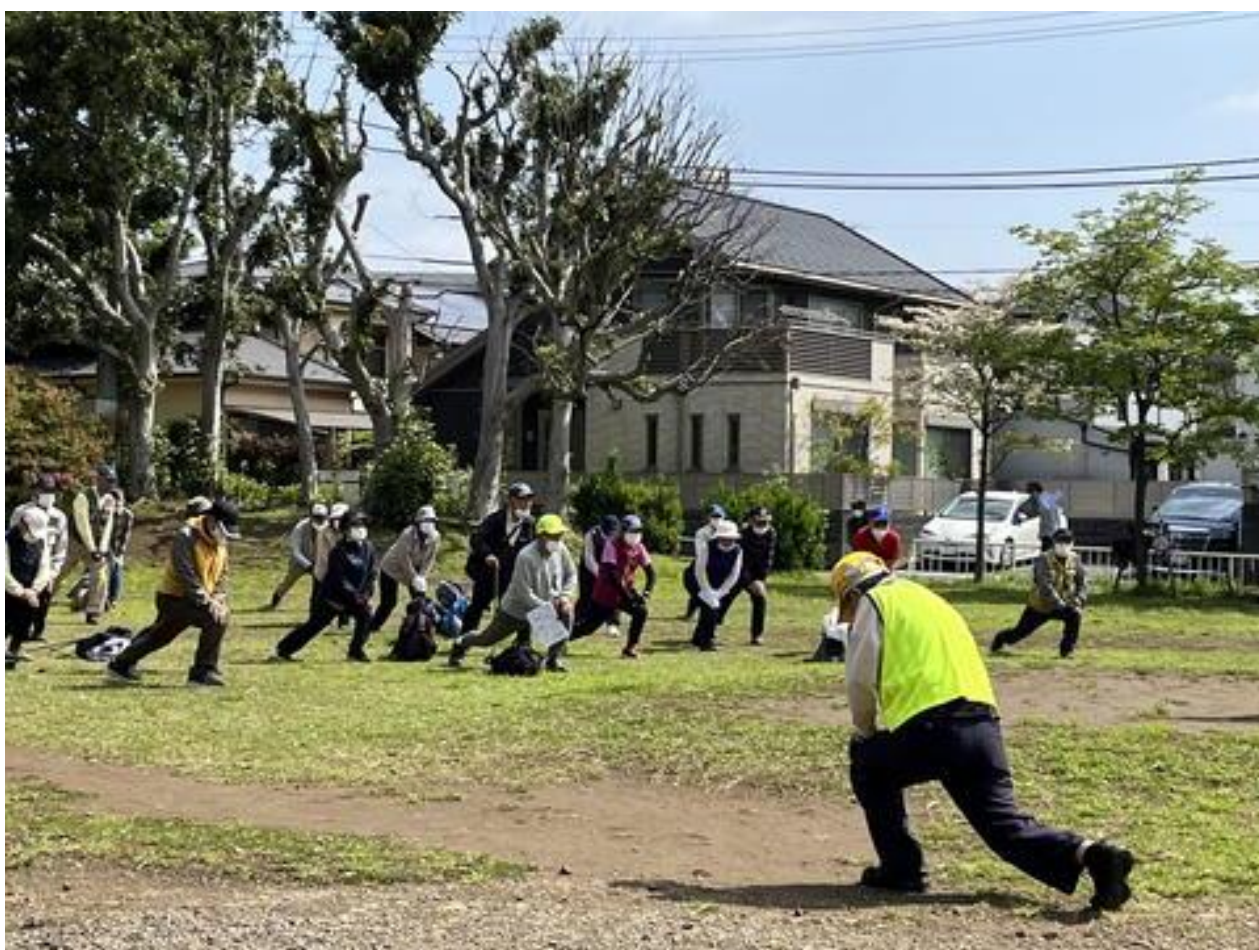
出発前のウォーミングアップ。