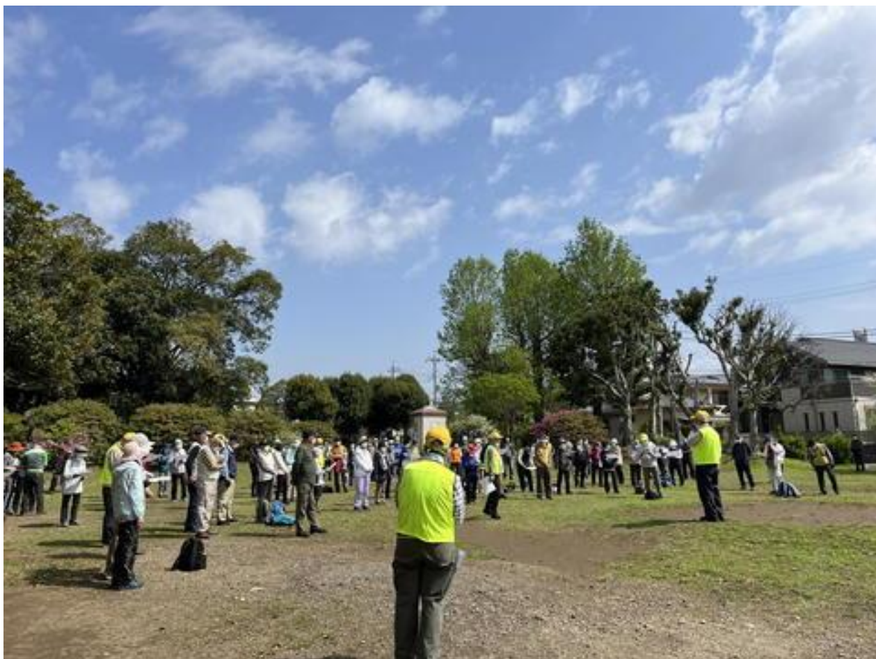
出発式風景（コースリーダーからコース紹介と歩行中の注意事項等の説明がありました。）