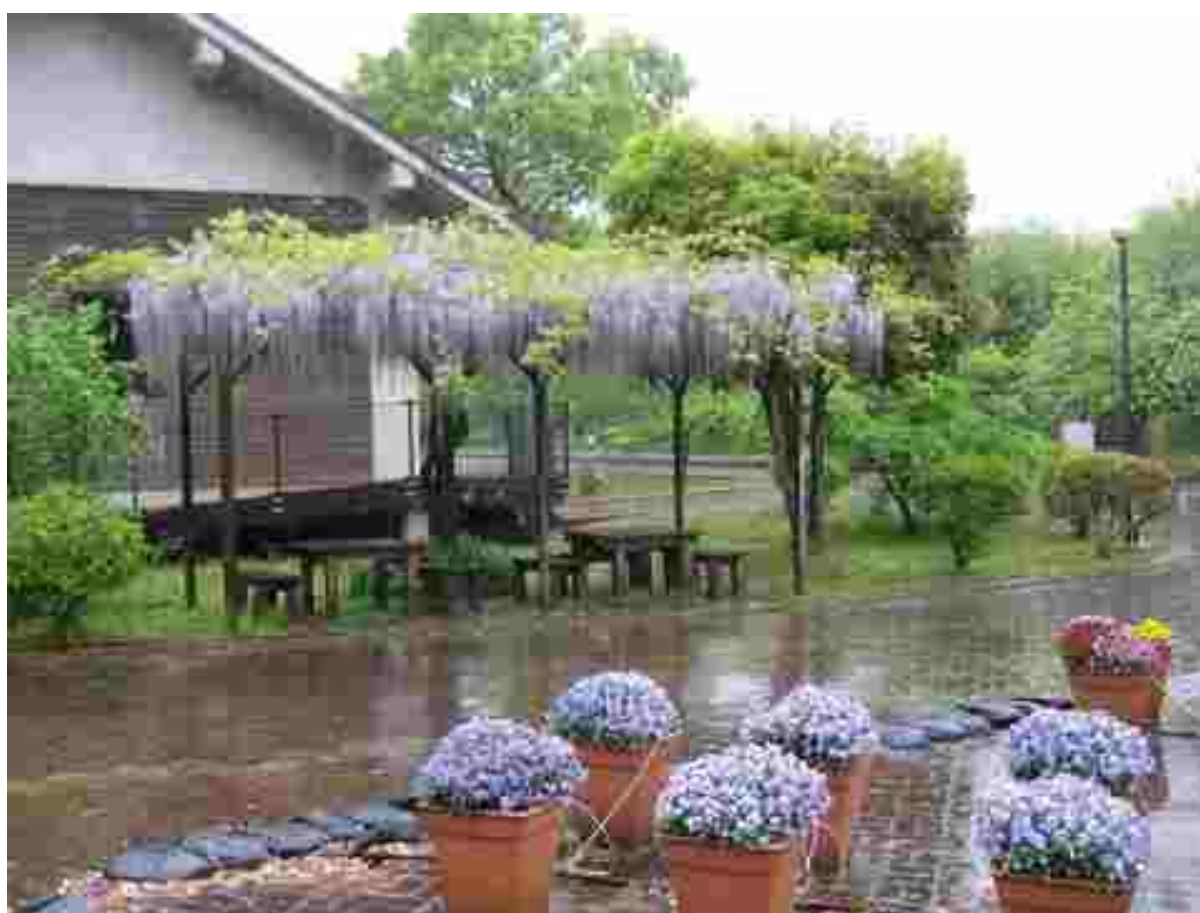
あけぼの山農業公園の藤の花