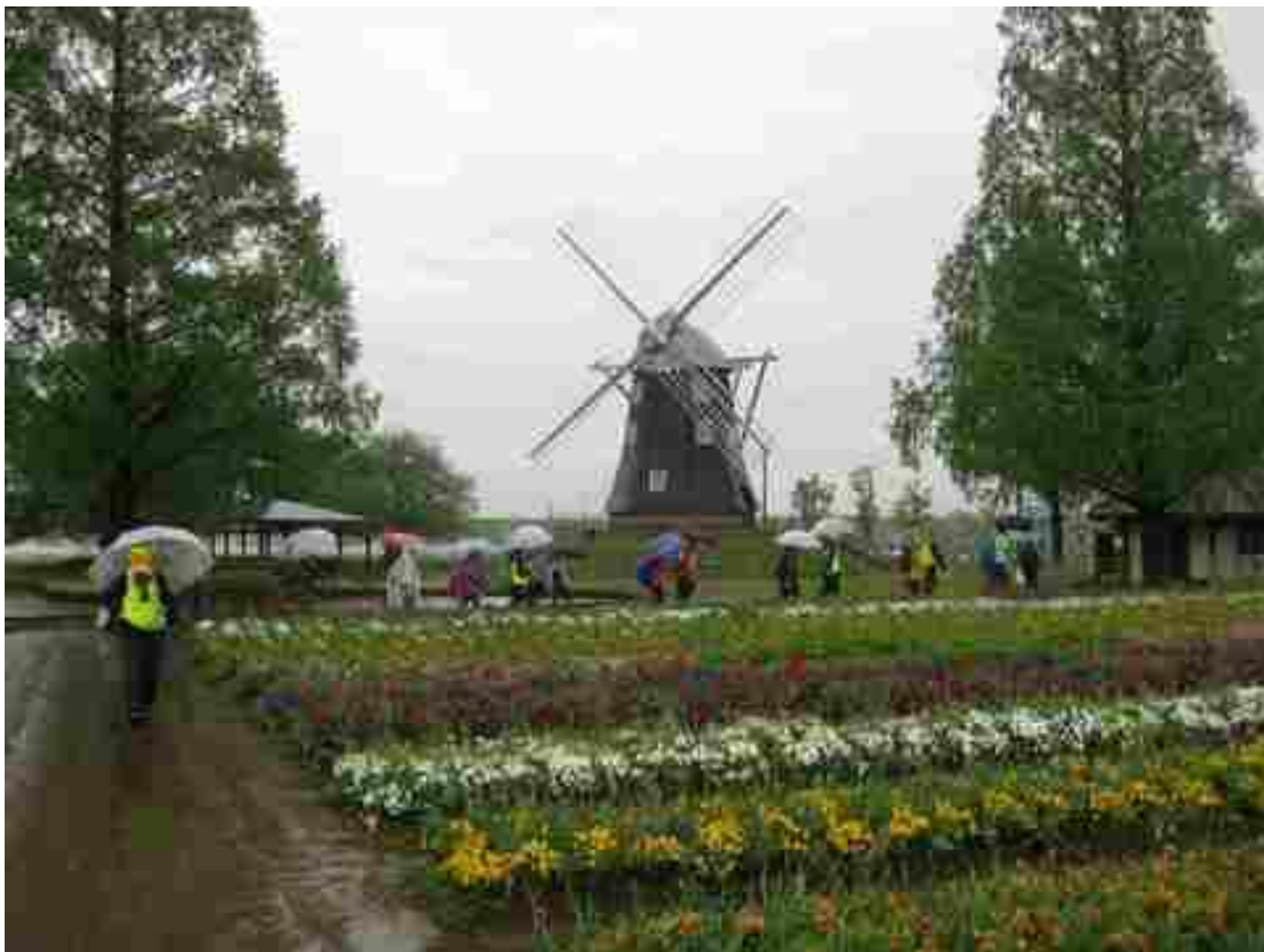
あけぼの山農業公園 風車前を歩く参加者

雨の中、ご参加いただきました皆様、支援の役員の皆様、有難うございました。お疲れさまでした。