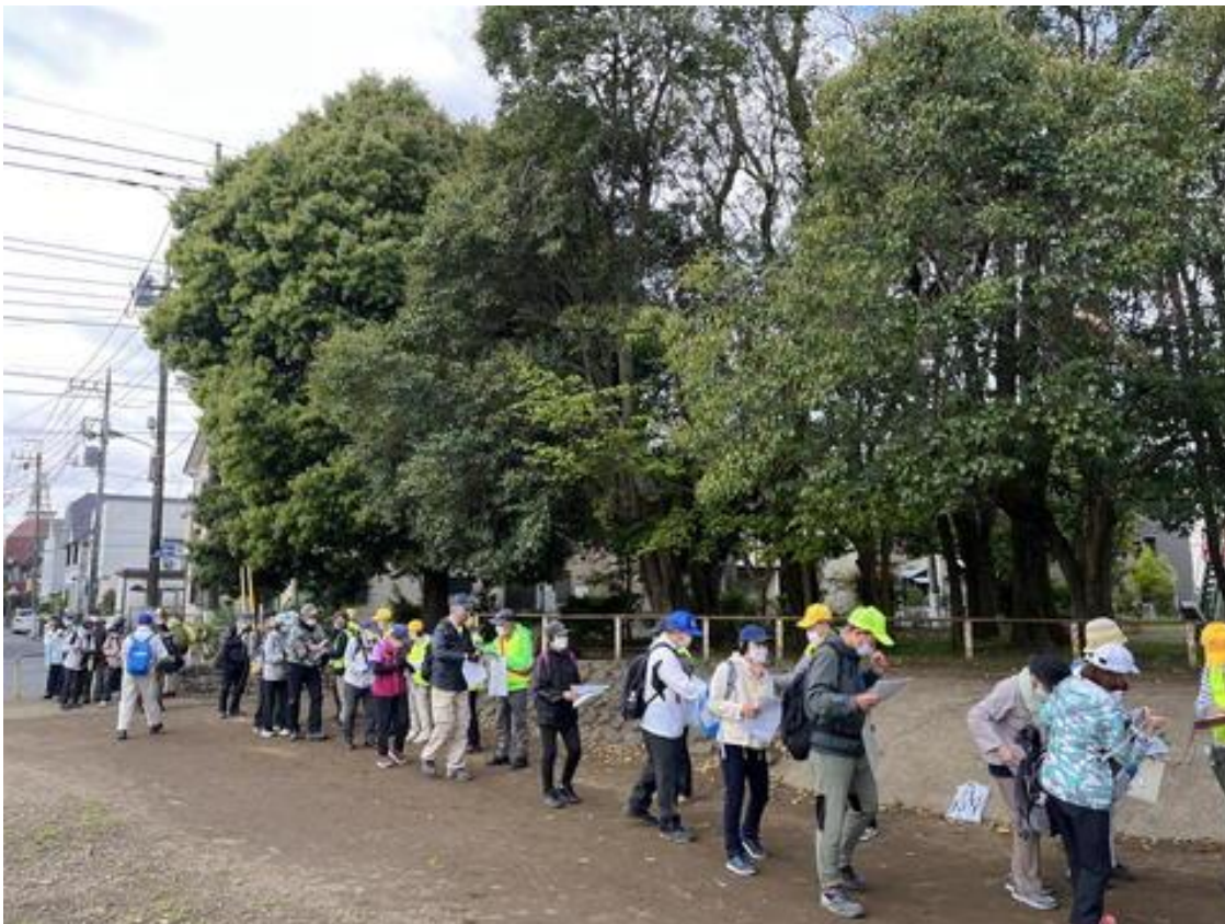
受付風景 (やまぶき公園)

この日の朝は、風もなく青空がひろがる絶好のウォーキング日和となりました。お昼頃から小雨が降り出しそうな雲行きになりましたが、雨に降られることはなく、ゴールすることができました。この日の参加者は 97名 でした。