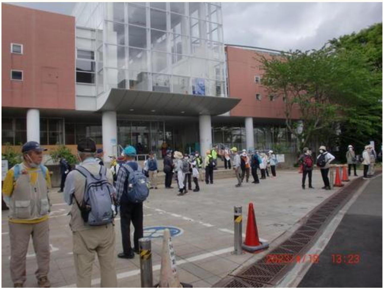
「和名ヶ谷スポーツセンター」でトイレ休憩。