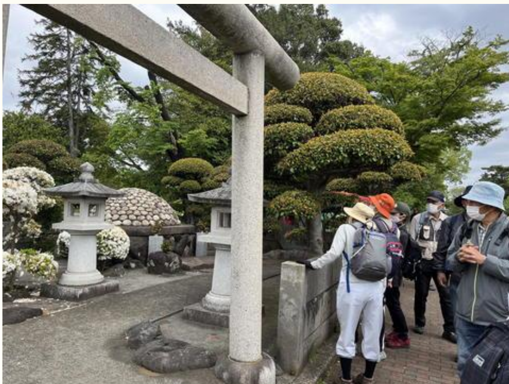
柔道家・教育者「嘉納治五郎の墓」を見学する参加者たち。