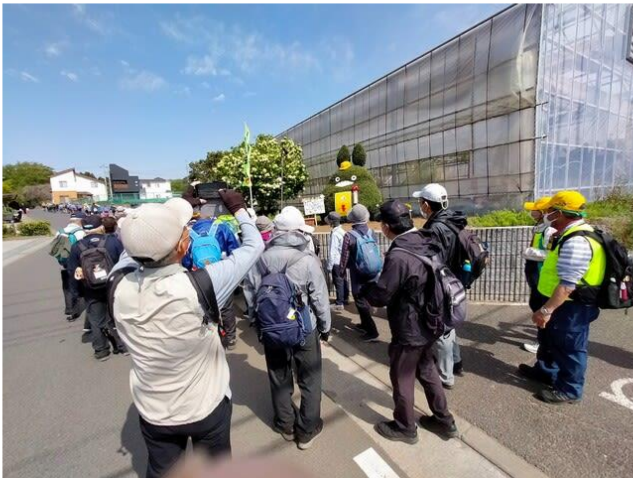
最初の見どころ トトロの木と御衣黄鑑賞