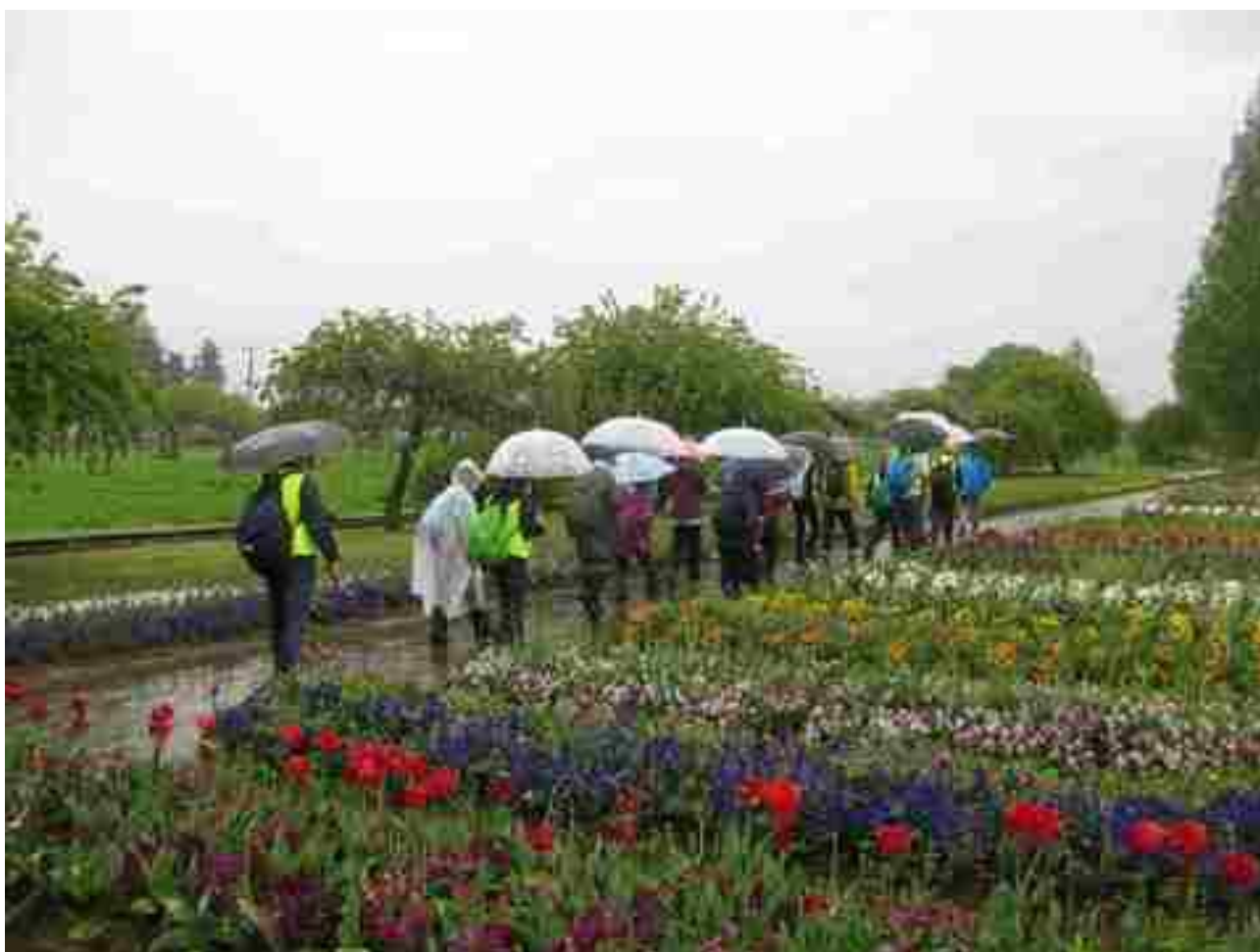
チューリップは散ったしまいましたがヴィオラが綺麗に咲いていました