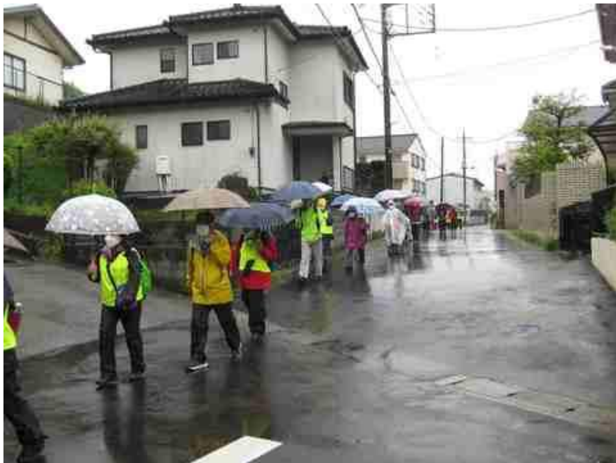
雨の中を歩く参加者の皆さん