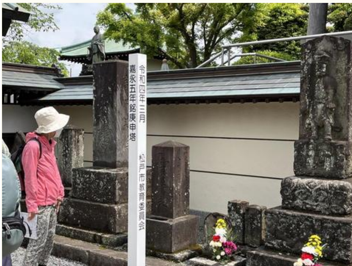
「廣龍寺」の庚申塔（松戸市有形文化財）を見学しました。