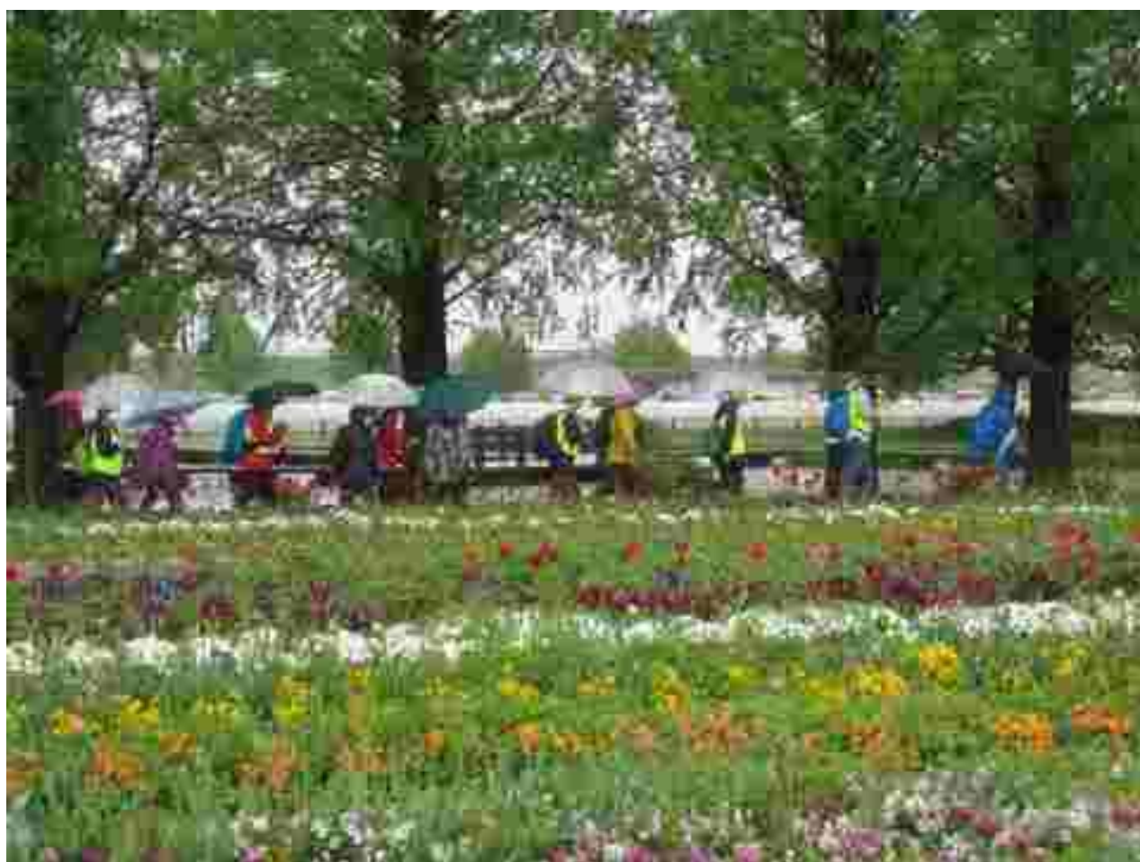
チューリップ畑を歩く参加者