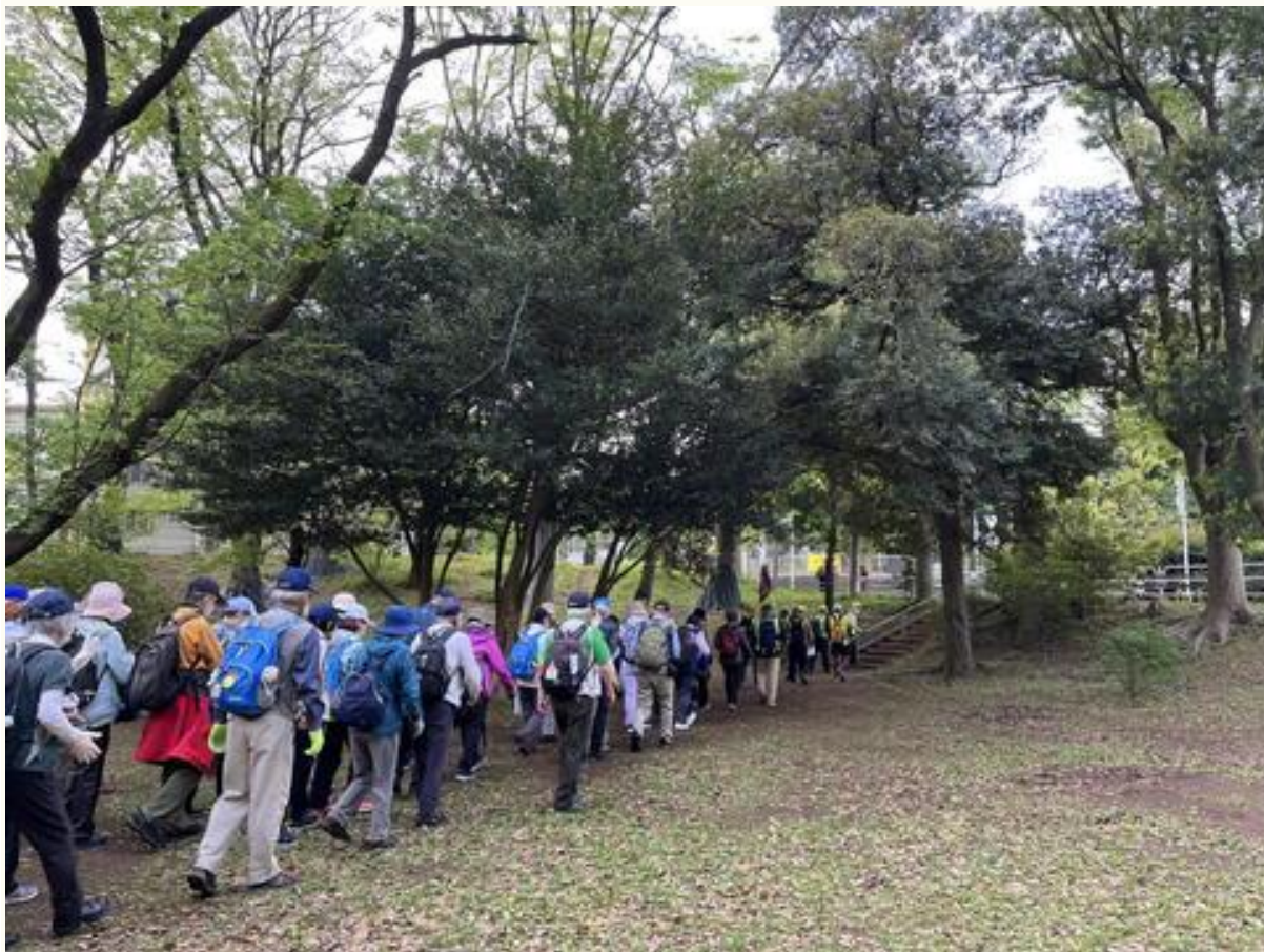
休憩の後、「しょうぶ公園」を出発。八柱方面に向かいました。