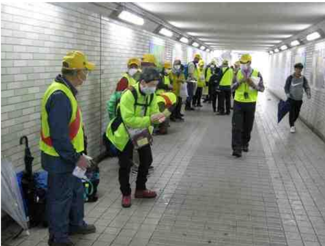
我孫子ふれあい広場側の地下道で受付をしました。

久しぶりの雨天のウォークになりましたが皆さん元気に歩かれて全員無事にゴールが出来と良かったと思いました。