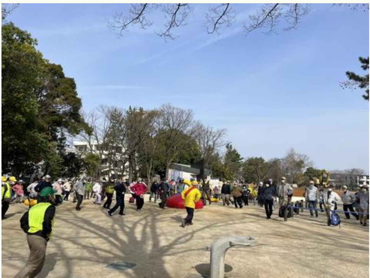
出発前のウォーミングアップ。