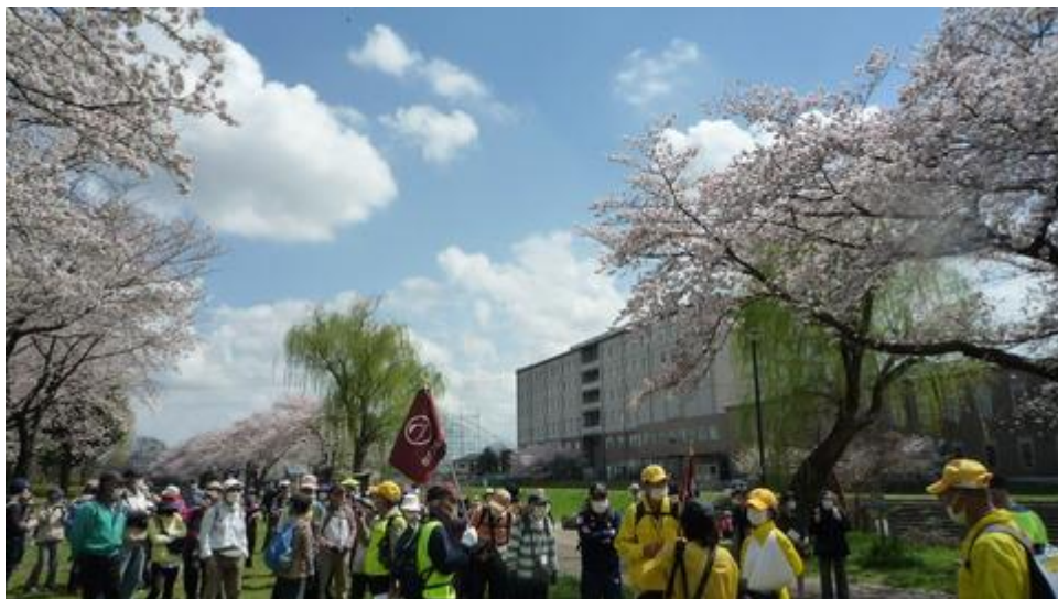
高田緑地で 8km コースはゴール、昼食後に 12km コースはスタート