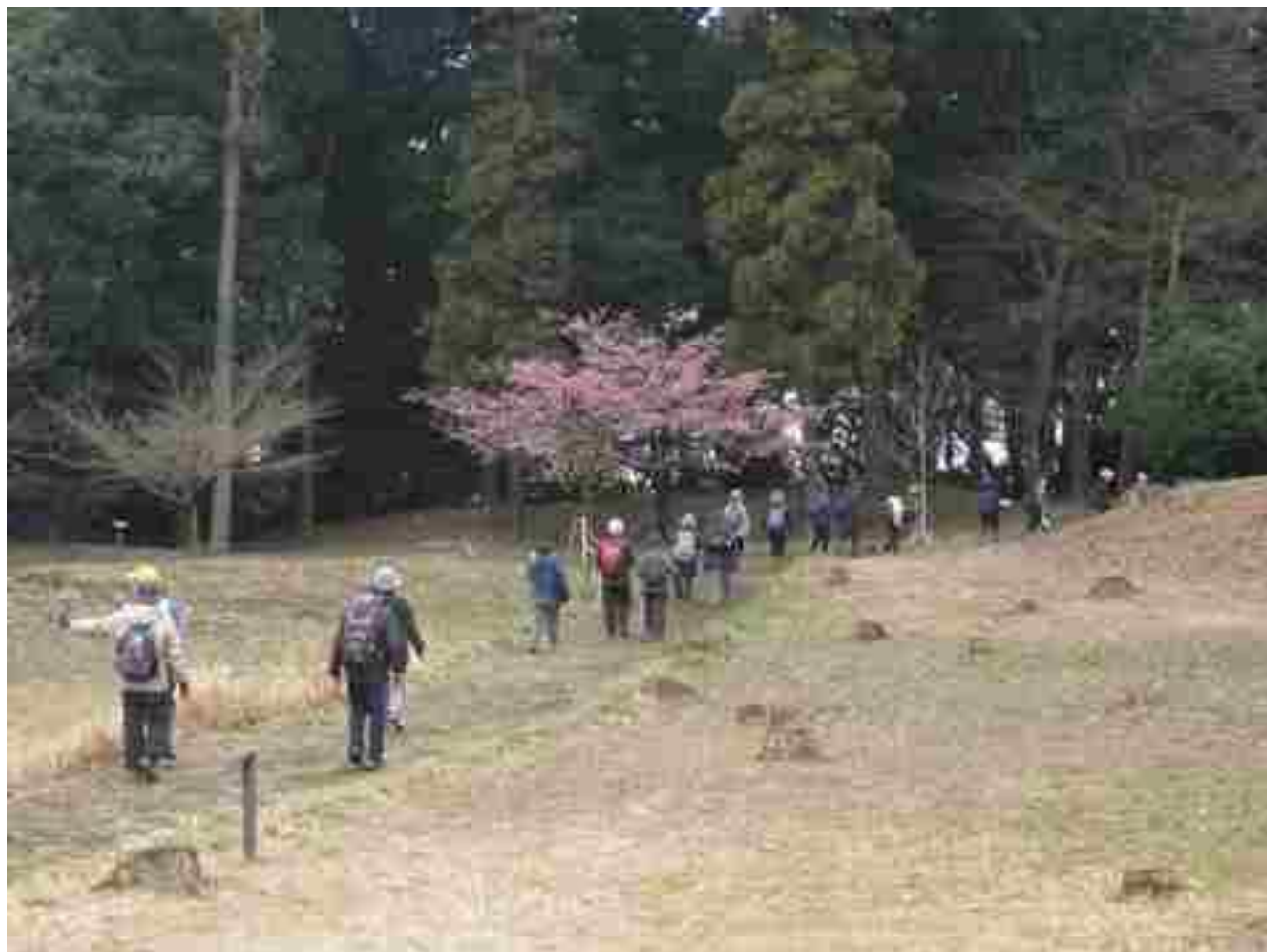
松ヶ崎城跡の説明版を観ながら歩く参加者