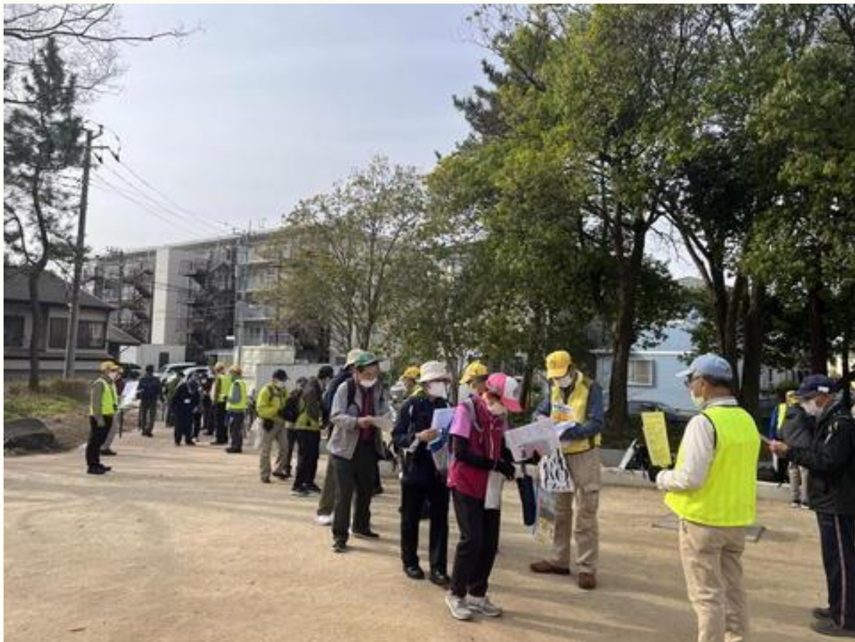
受付風景 (南流山中央公園)

この日は、朝からとっても暖かく、絶好のウォーキング日和となりました。日中気温が18度ぐらいになり、歩いていると汗ばむくらいでしたが、集合場所の「南流山中央公園」には、8時半頃から参加者が続々と来られ、参加者は 130名 になりました。