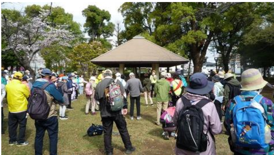
開会式の諸注意の後、12kmゴール後に缶ビール配布の案内がありました