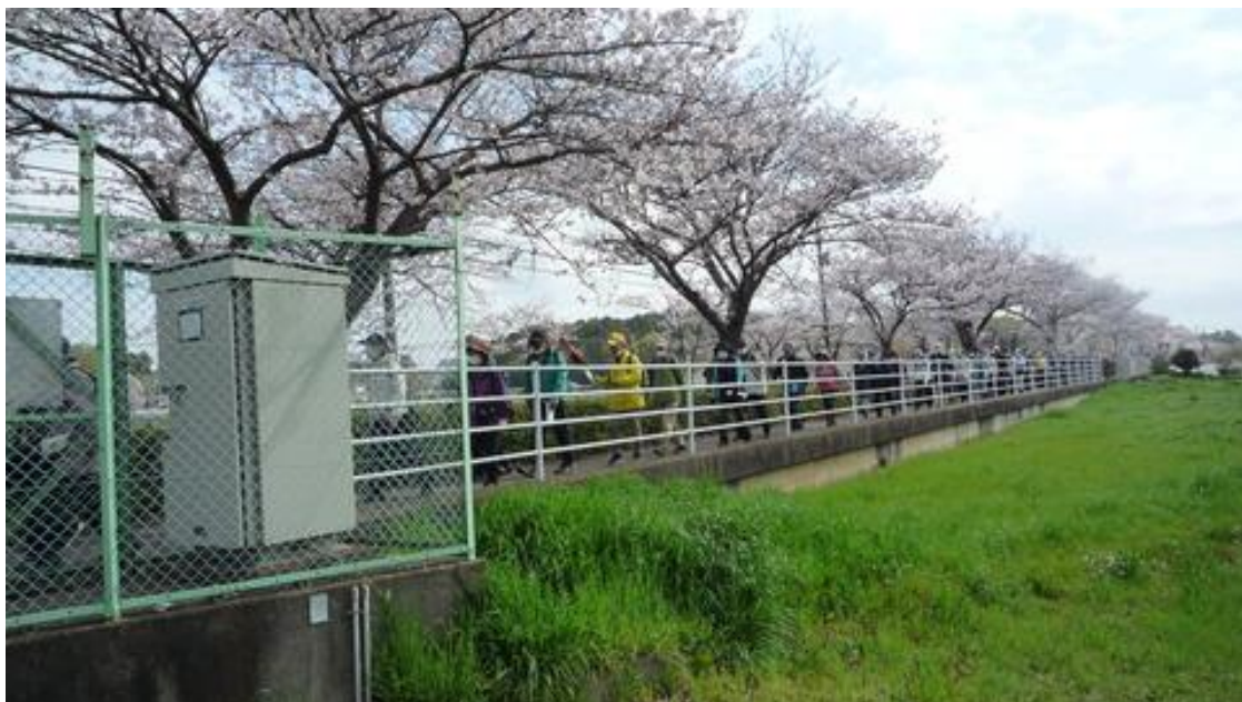
ふれあいラインの桜並木の下を一行で歩く