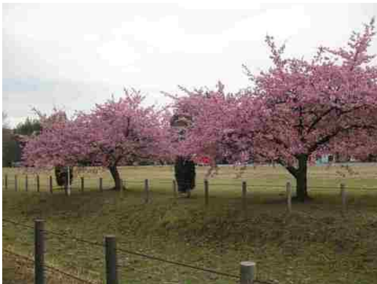
大堀川防災レクリエーション公園に河津桜