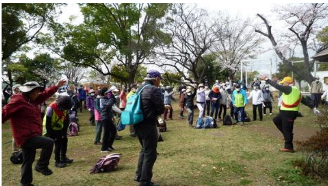
ウォーミングアップのストレッチを行う参加者