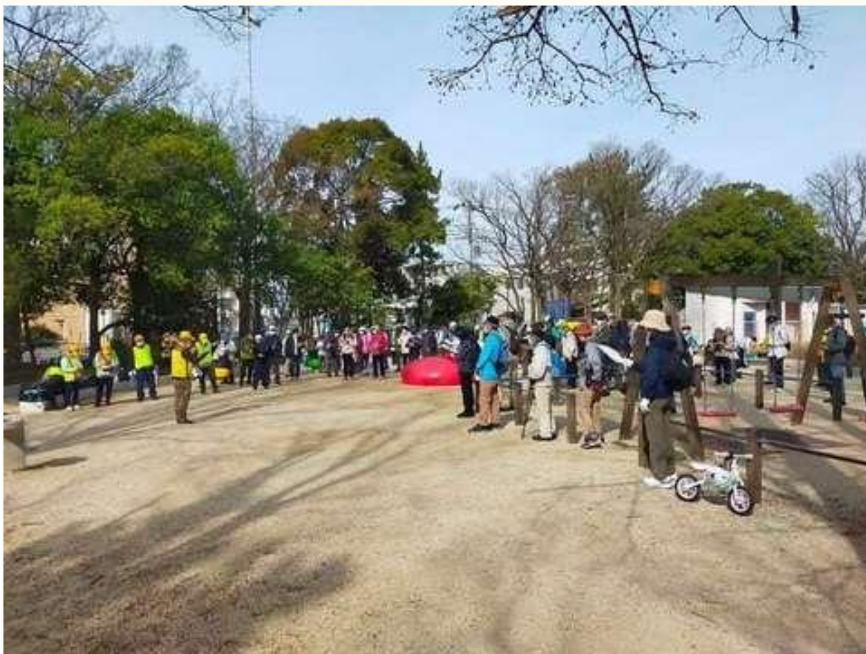
コースリーダーからコース紹介と歩行中の注意事項の説明がありました。