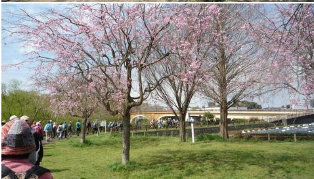
満開のさくらの北柏ふるさと公園を進む参加者