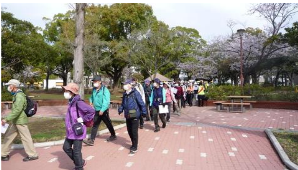
手賀沼公園を元気にスタート