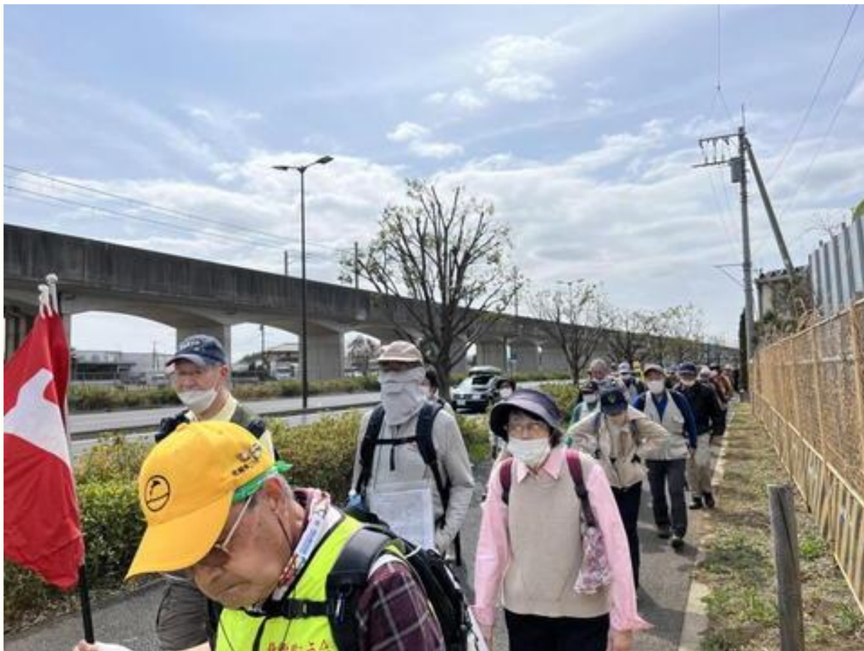
つくばエクスプレス線沿線を歩く参加者の列。