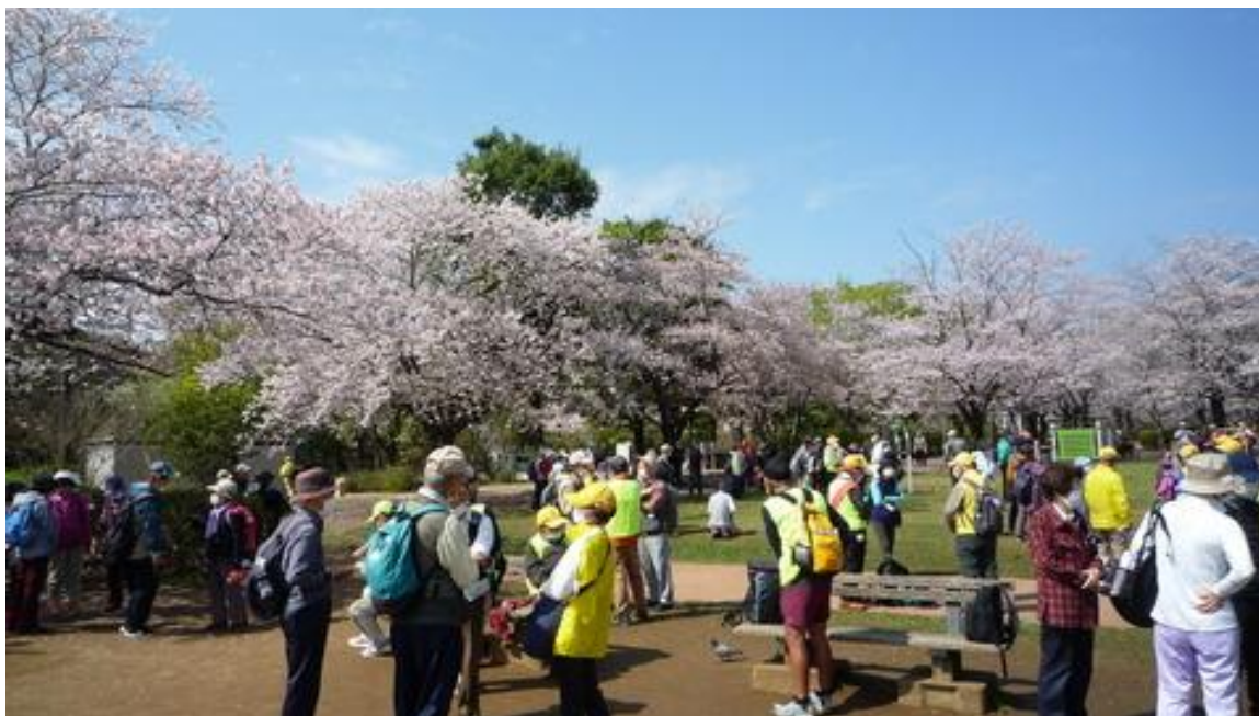
柏ふるさと公園で1回目のトイレ休憩中