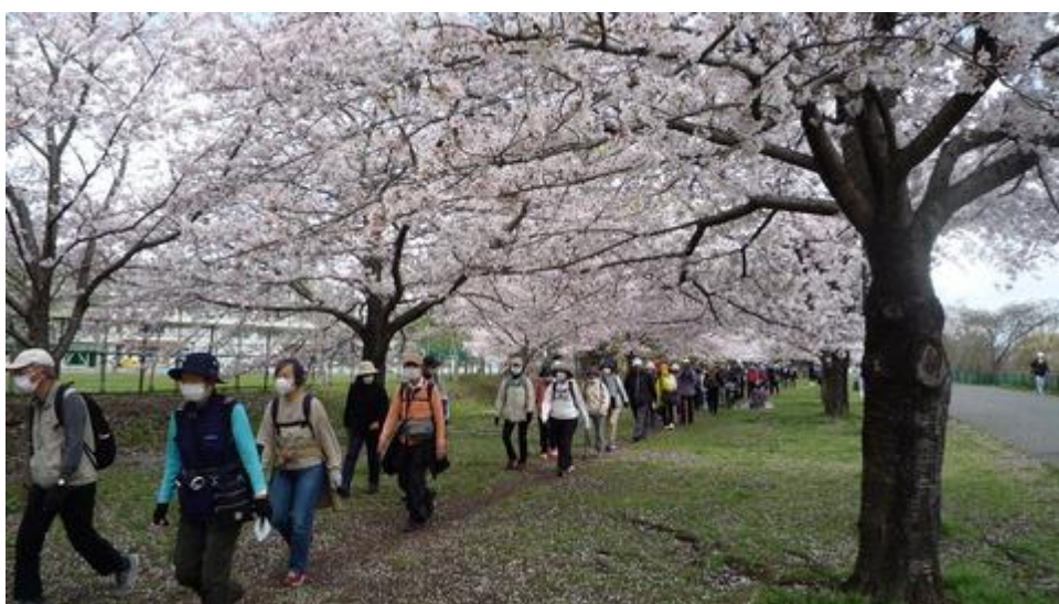
桜並木の下をゴールへ歩く