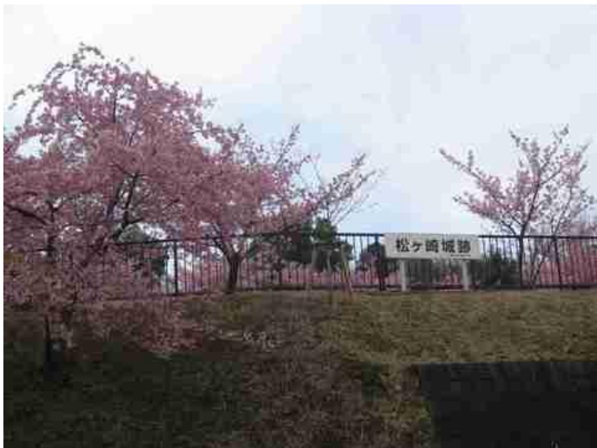
松ヶ崎城跡に咲く河津桜