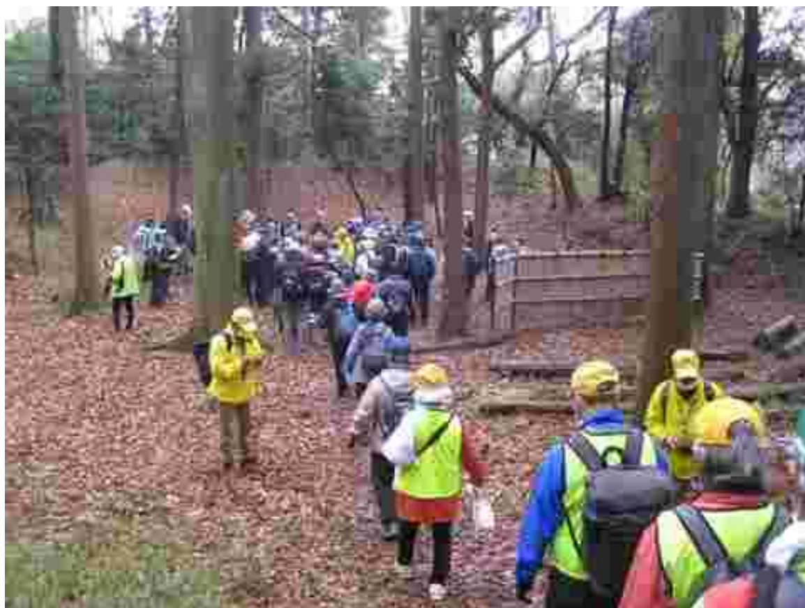
リーダーから根津城の説明を聞く参加者