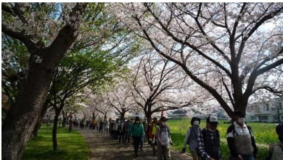
大堀川沿いの桜の木の下を歩く参加者