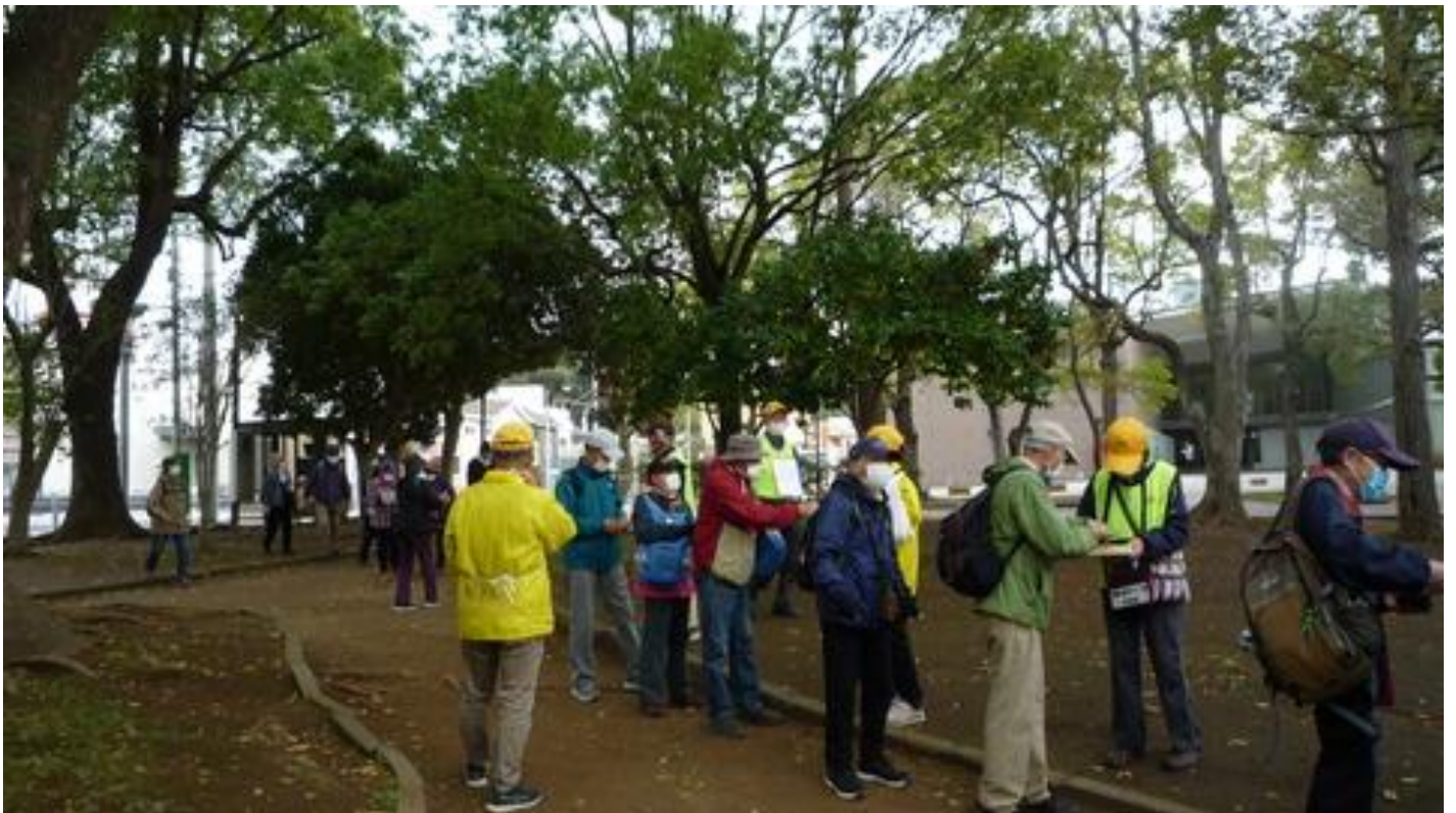
受付を開始しました

今年は例年になく暖かく、都心の桜も22日に満開となり、29日迄持つのか心配されました。しかし、その後雨模様が続き、当日は曇りで若干肌寒かった。若干出足が悪く心配しましたが、開会式が始まっても参加者が見えられ、受付終了までに 115 名の参加者が集まりました。