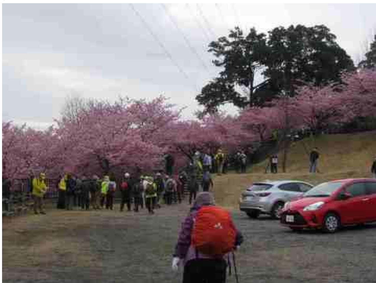
松ヶ崎城跡に咲く河津桜を観ながら進みます。