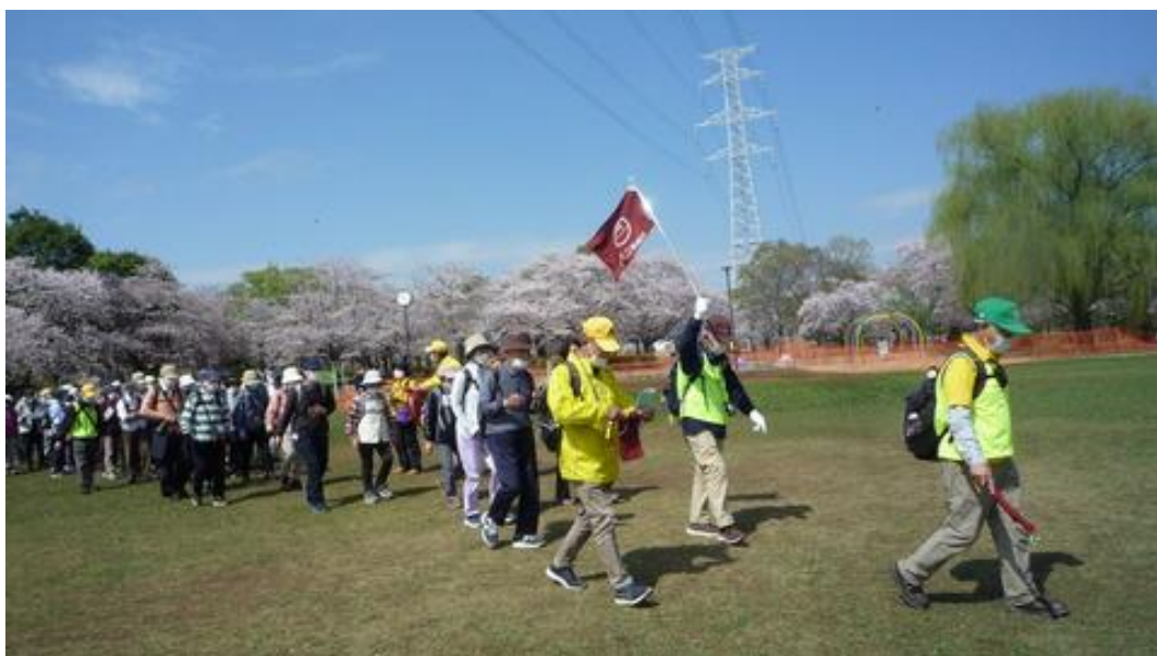
憩終了後出発する参加者