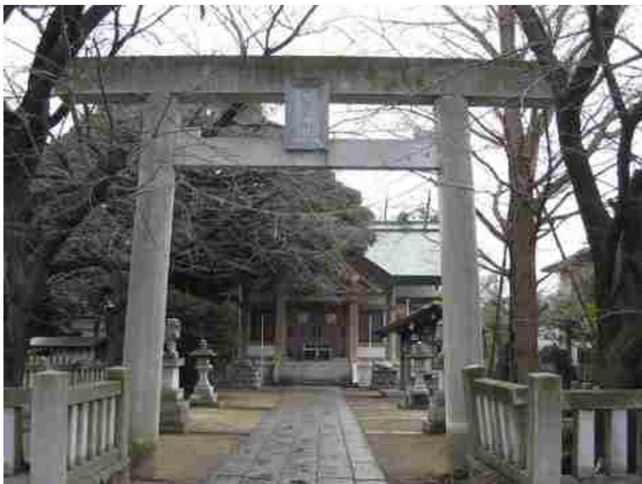
北柏駅近くの北星神社に参拝をしました。