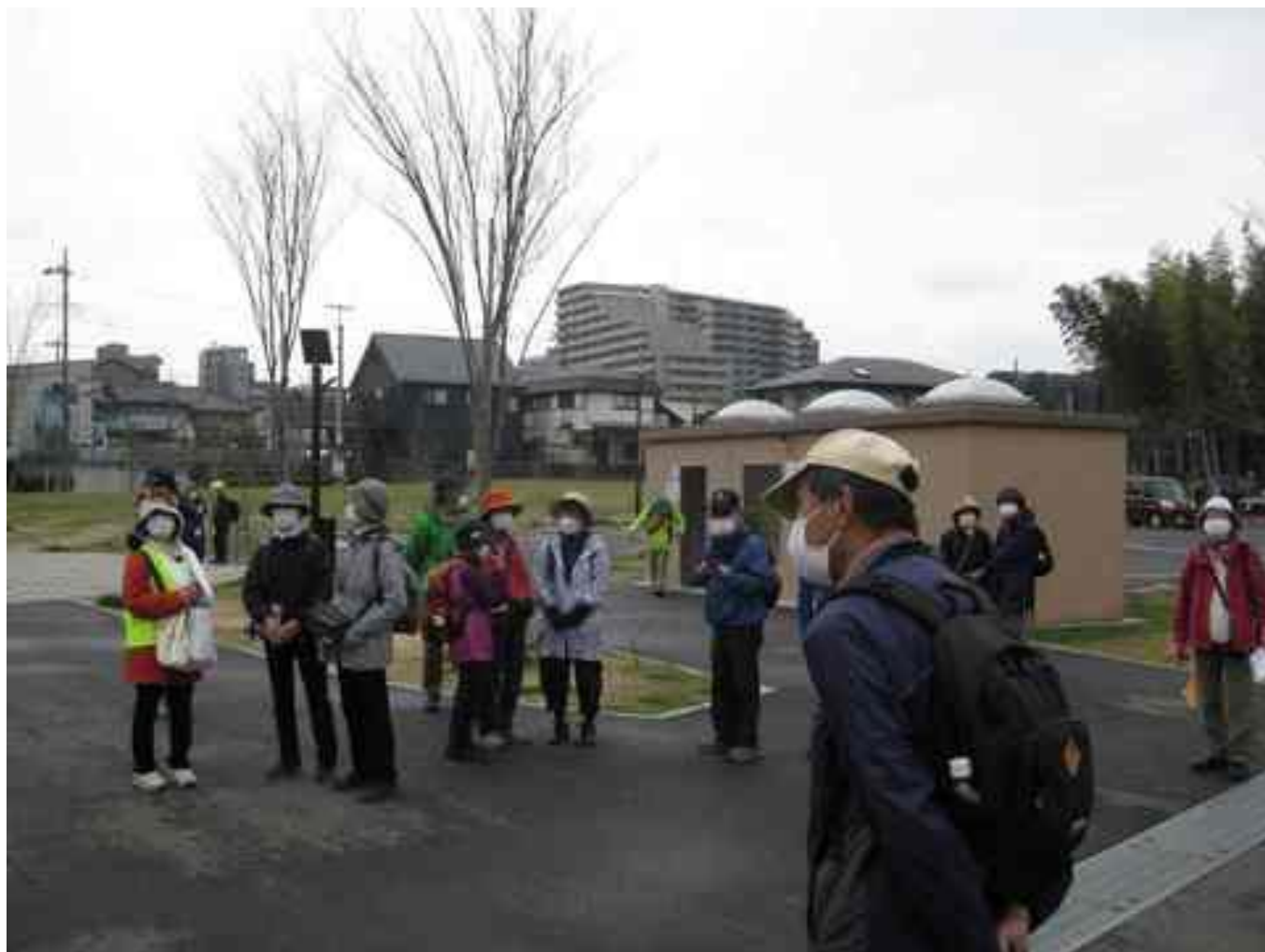
大堀川防災レクリエーション公園(篠籠田)で休憩をする参加者

歩いているうちに天候も回復し、満開の河津桜、根津城跡を観ることが出来て、楽しんでいただけたのではないかと思います。