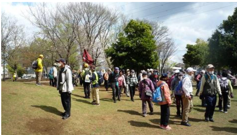
アンカーを待つ参加者

風もなく満開の桜の下、花びらを浴びながらゆったりと歩けました。心配していた桜も満開で十分満足したとの声が沢山聞かれました。曇り空で歩くにはちょうど良い天気でした。12kmには 86名 が無事にゴールされました。お土産の缶ビールとおつまみをザックに入れ帰られました。参加者及び支援役員の皆様お疲れさまでした。(投稿:青木 茂)