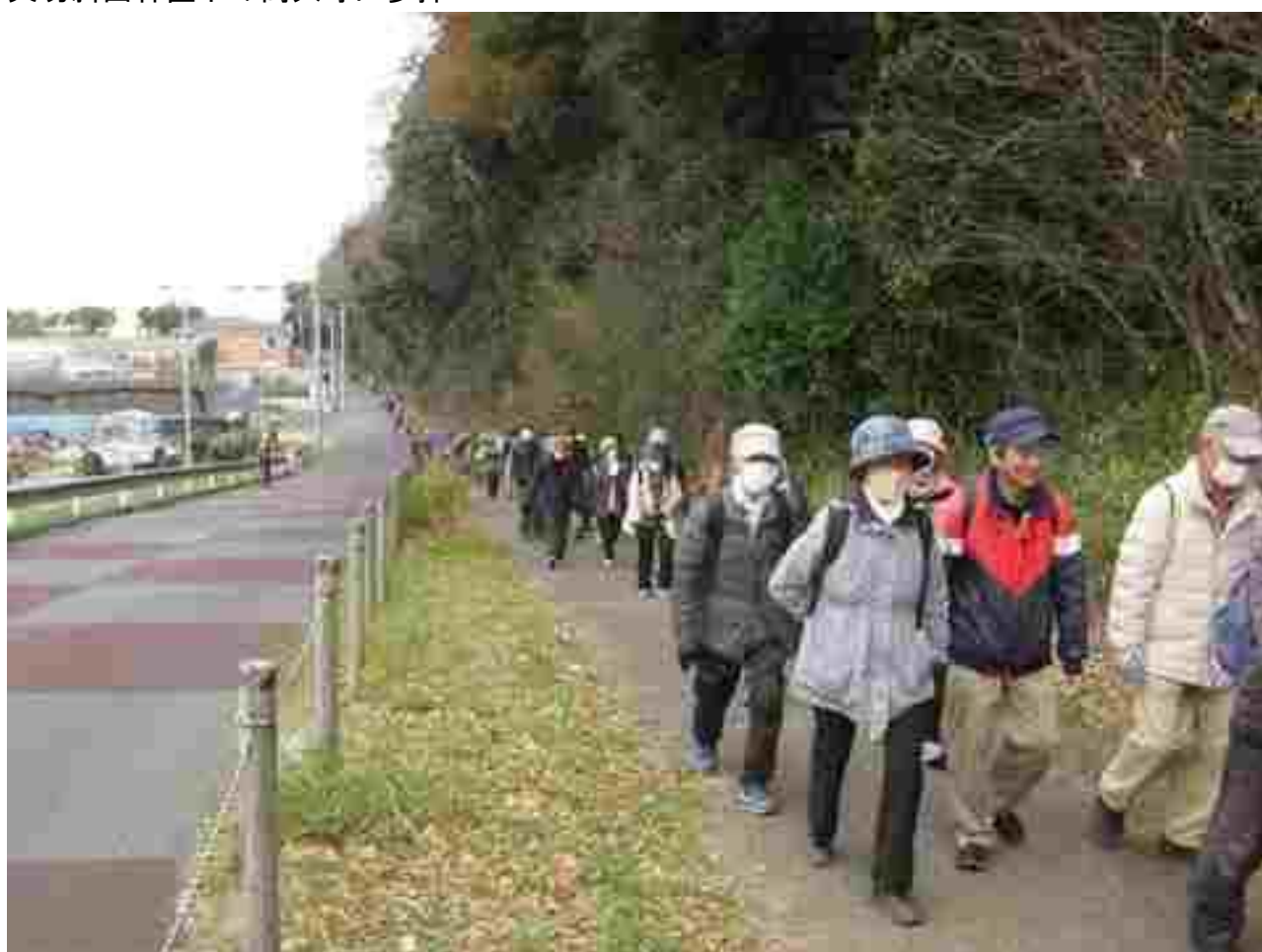
矢切斜面林直下の道を歩く参加者