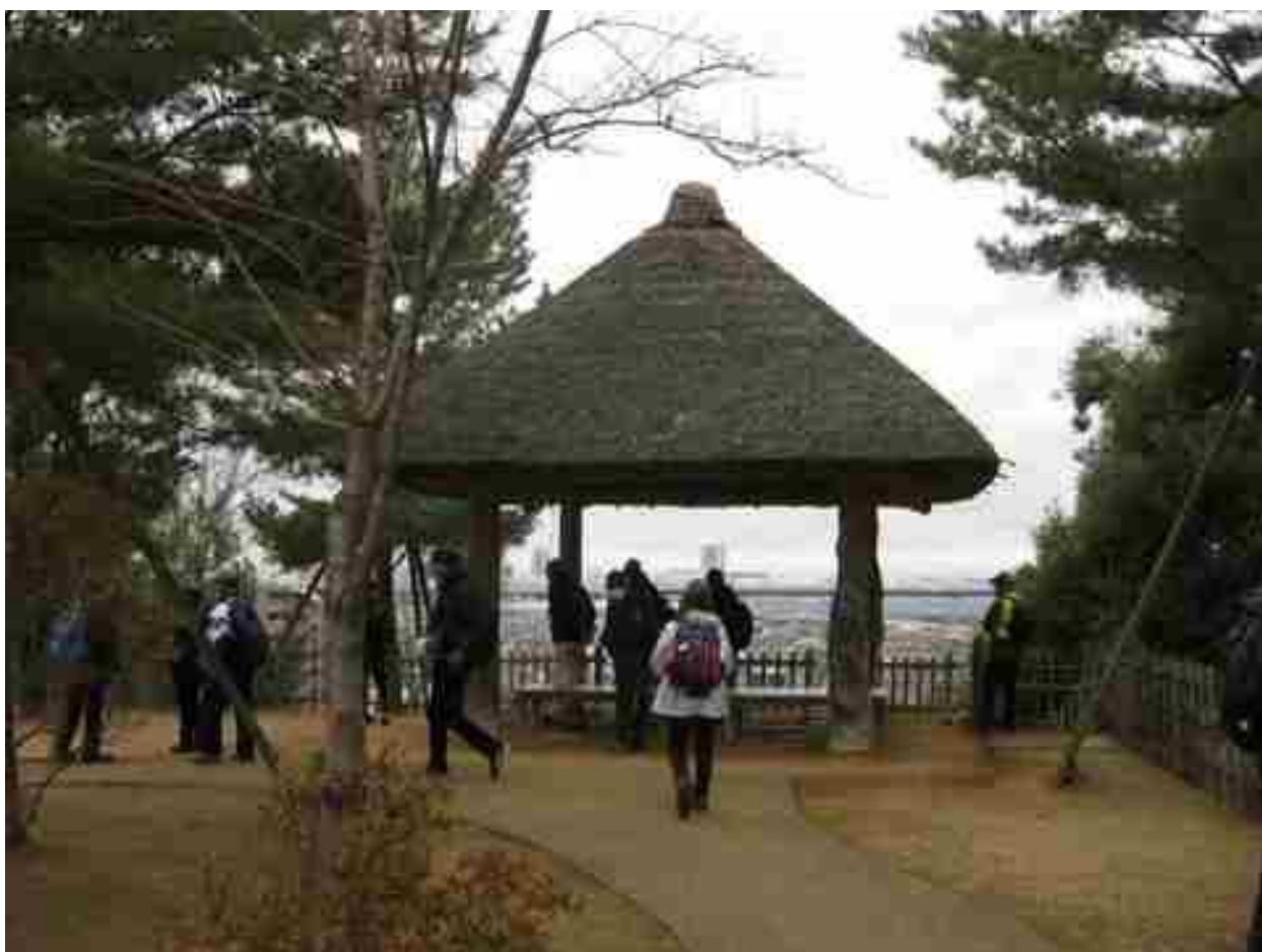
戸定邸庭園の展望台から東京方面が見えます