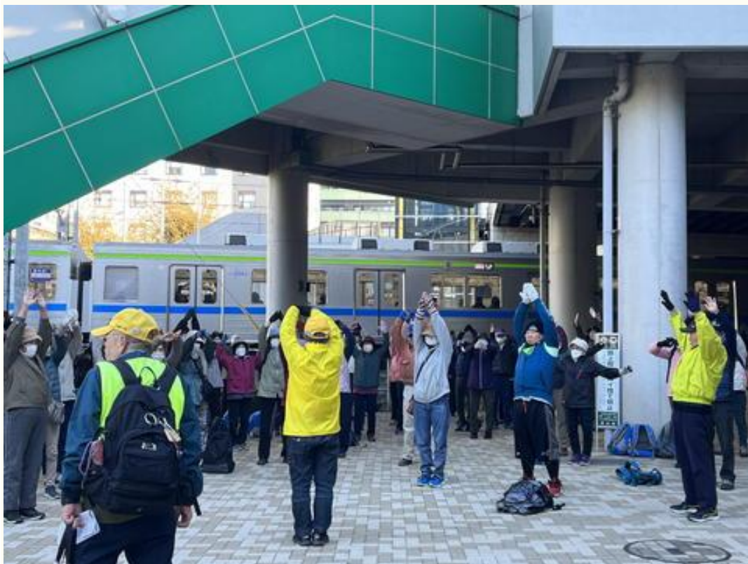
いつものように、ウォーミングアップの後、出発しました。