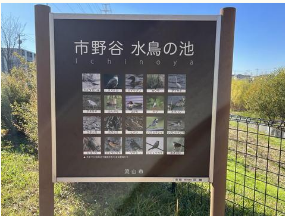
「市野谷 水鳥の池」をフェンス越しに半周ほど歩き、もうすぐゴールです。