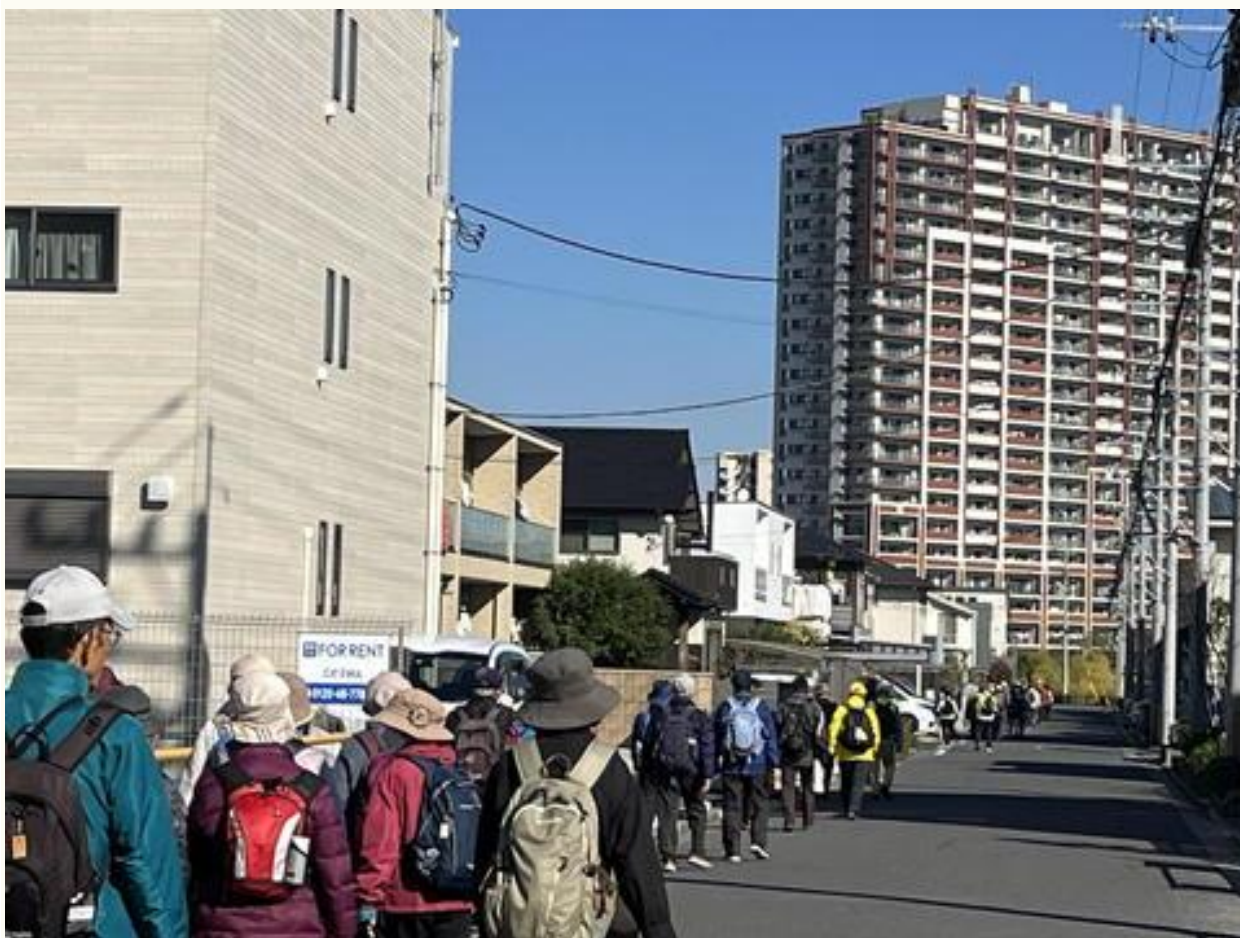
住宅街を通り・・・