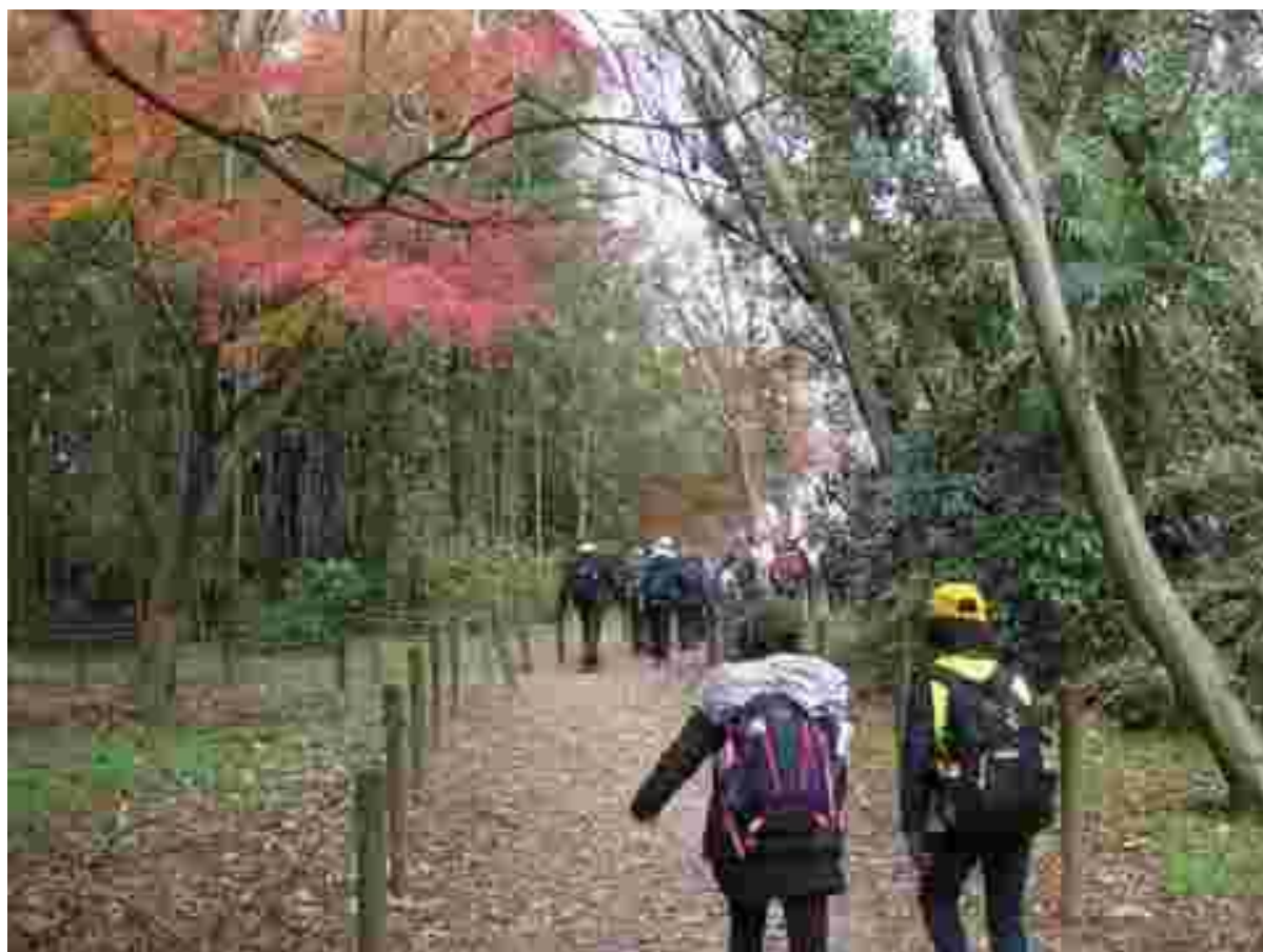
紅葉が残る小路を歩きます