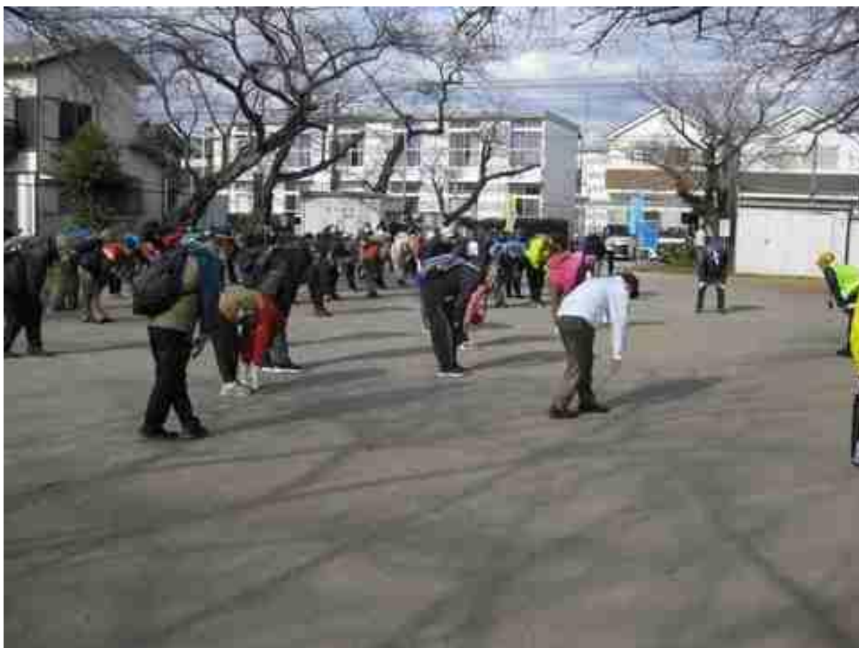
ゴールの立見台公園でクールダウンストレッチ