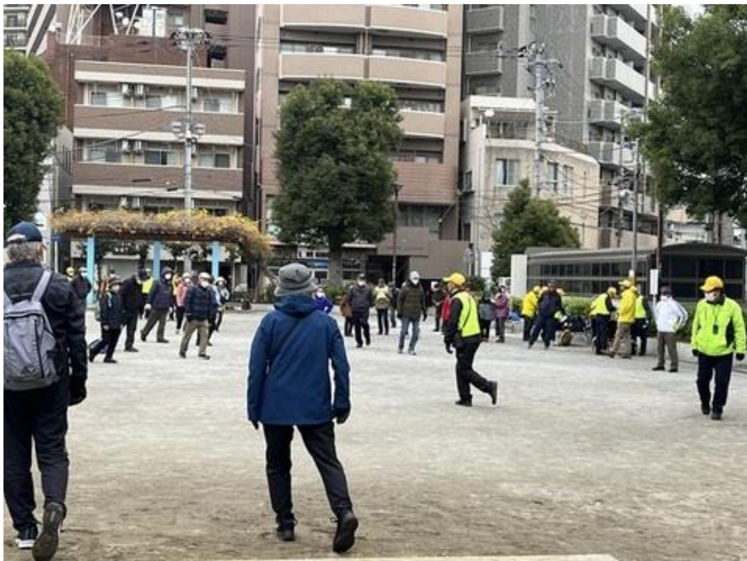
松戸西口公園でストレッチをしてから出発しました

行事終了後は年末恒例のミカン配布、一年無事に終わっての乾杯をしてお開きとなりました。