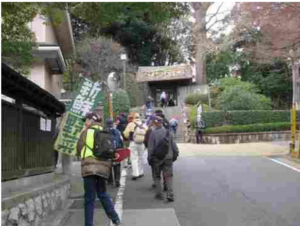
戸定邸に向かう参加者