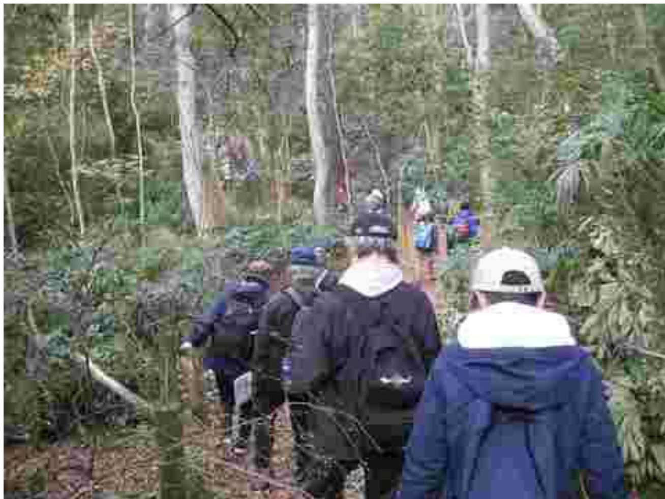
斜面林の中の「国府台ふれあいのみち」を歩いています