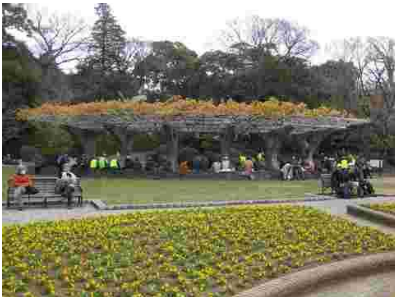
里見公園で昼食・休憩です