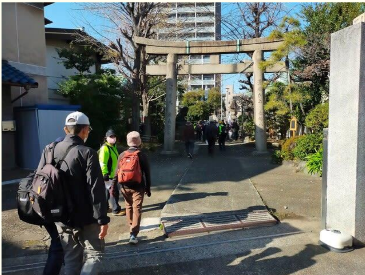
八幡神社 (毘沙門天)