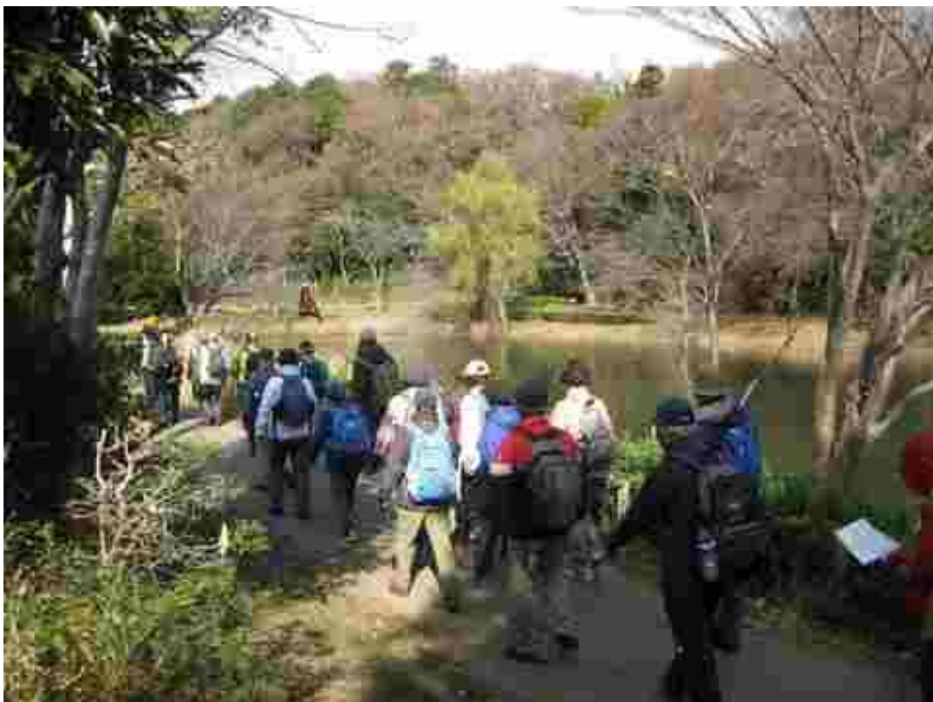
じゅん采池の縁を歩いています