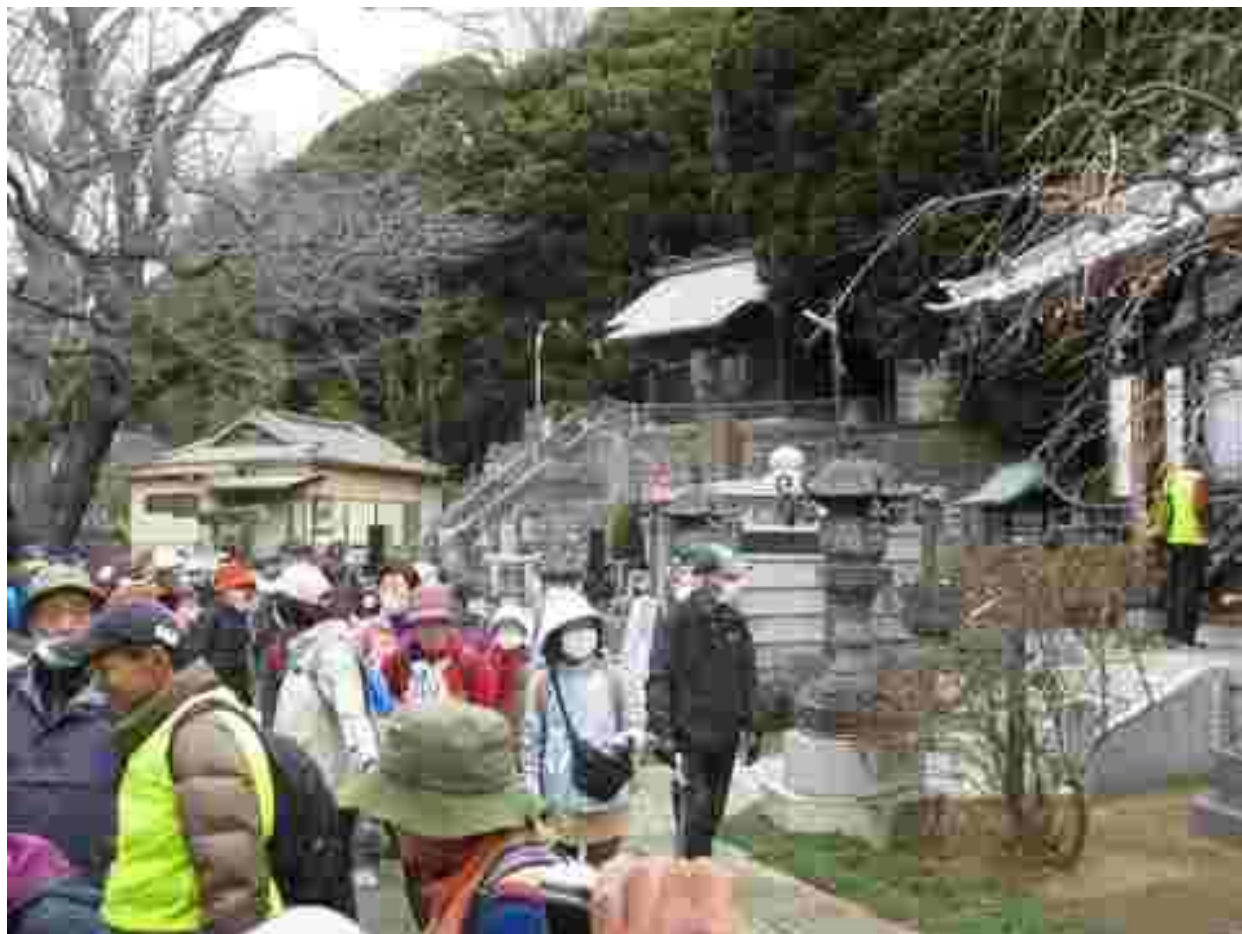
矢切斜面林直下の高久寺に参拝