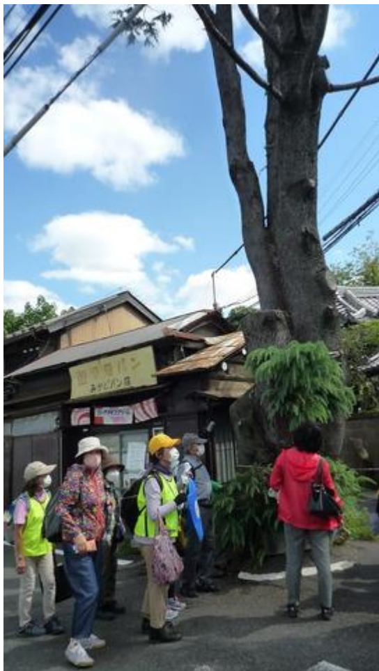
谷中のヒマラヤ杉を通過