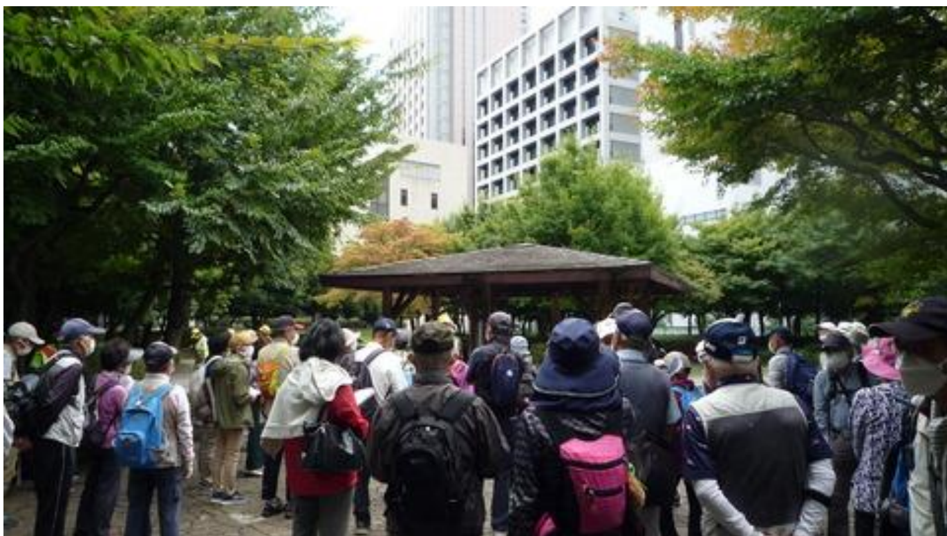
久しぶりに出発式とストレッチを行い、団体歩行で東京の街歩きに出かけました