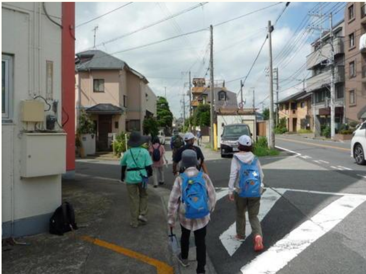
美野里交差点付近を歩く参加者。