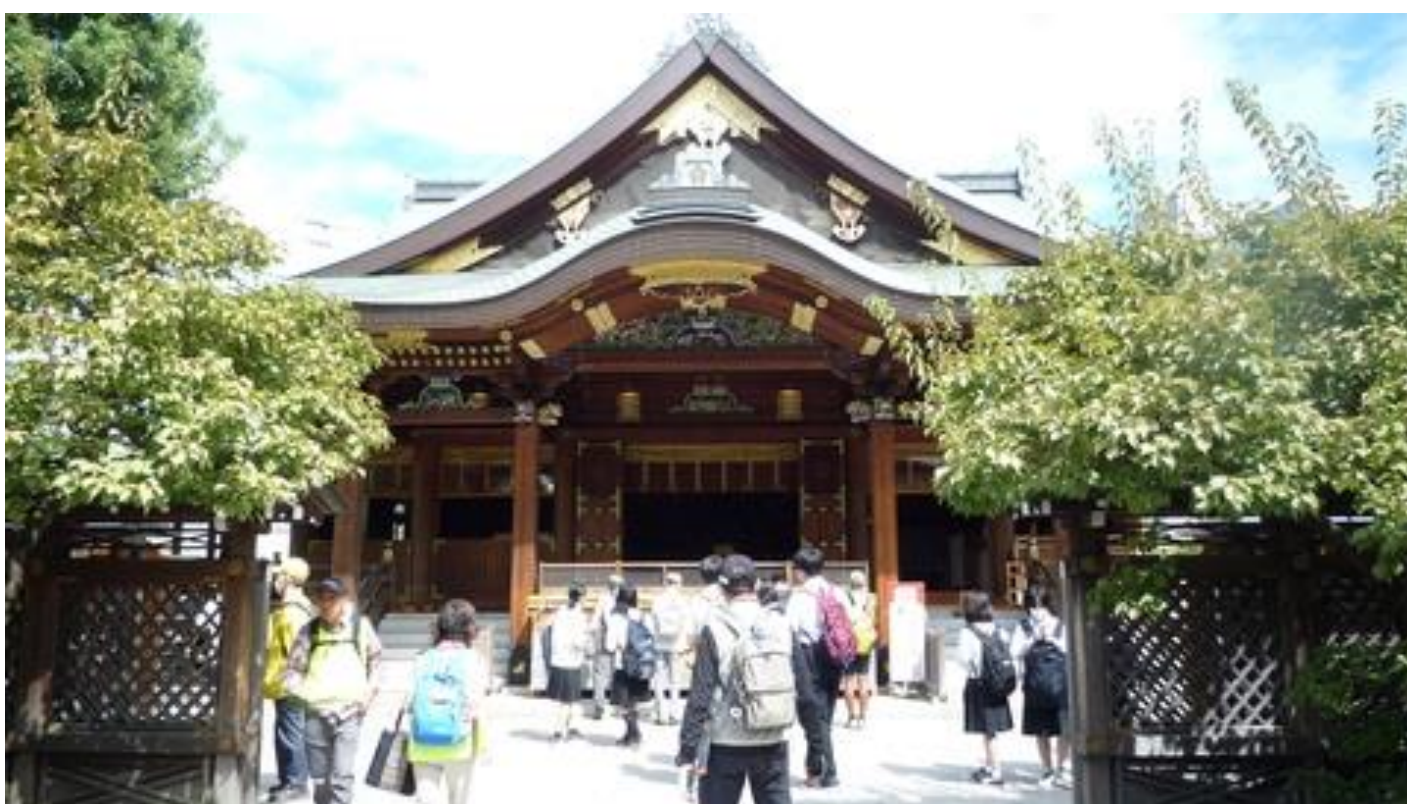
次に急坂を登り湯島天神に参拝、トイレ休憩