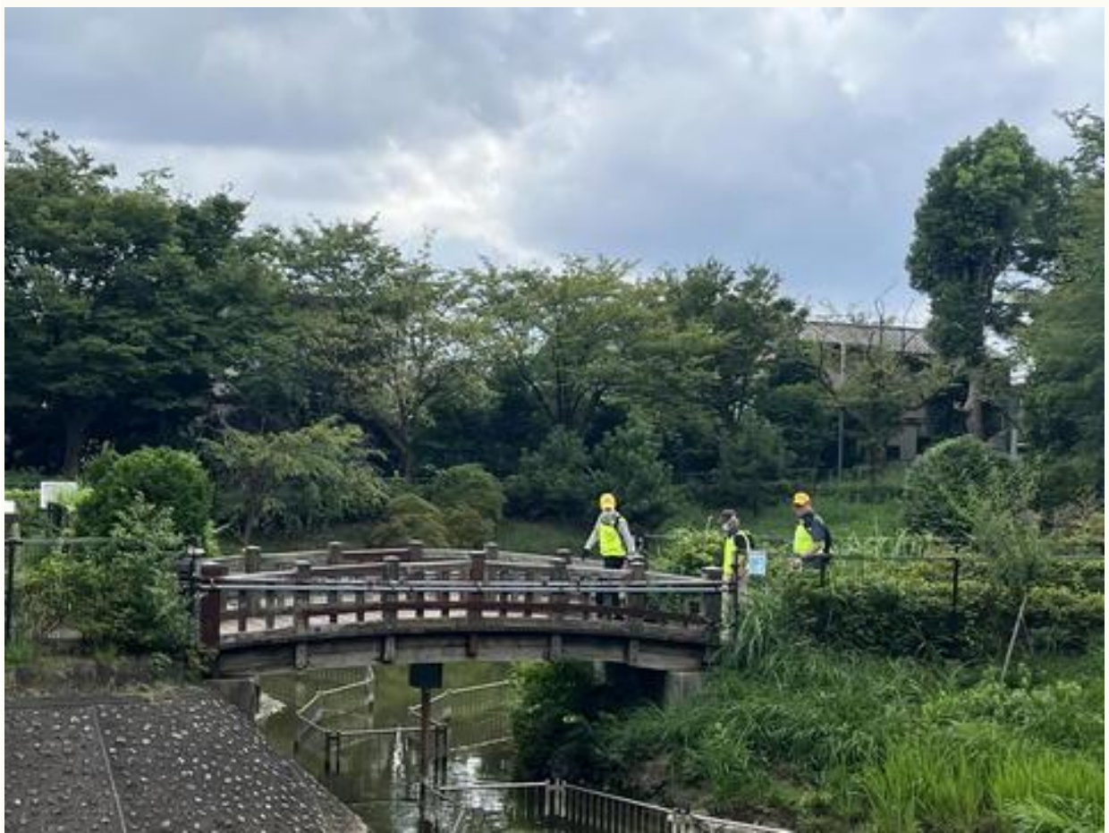
和名ヶ谷スポーツセンター内公園を通り抜け・・・