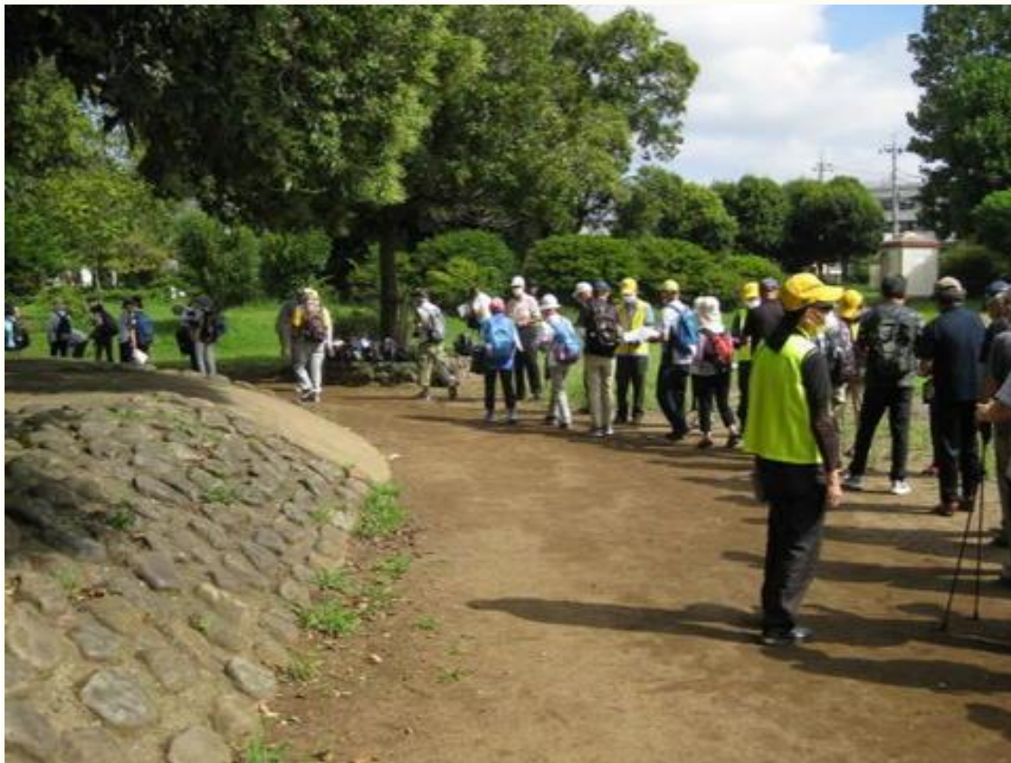
参加受付風景（やまぶき公園）受付終了後、順次コース地図を確認して出発して行きました。