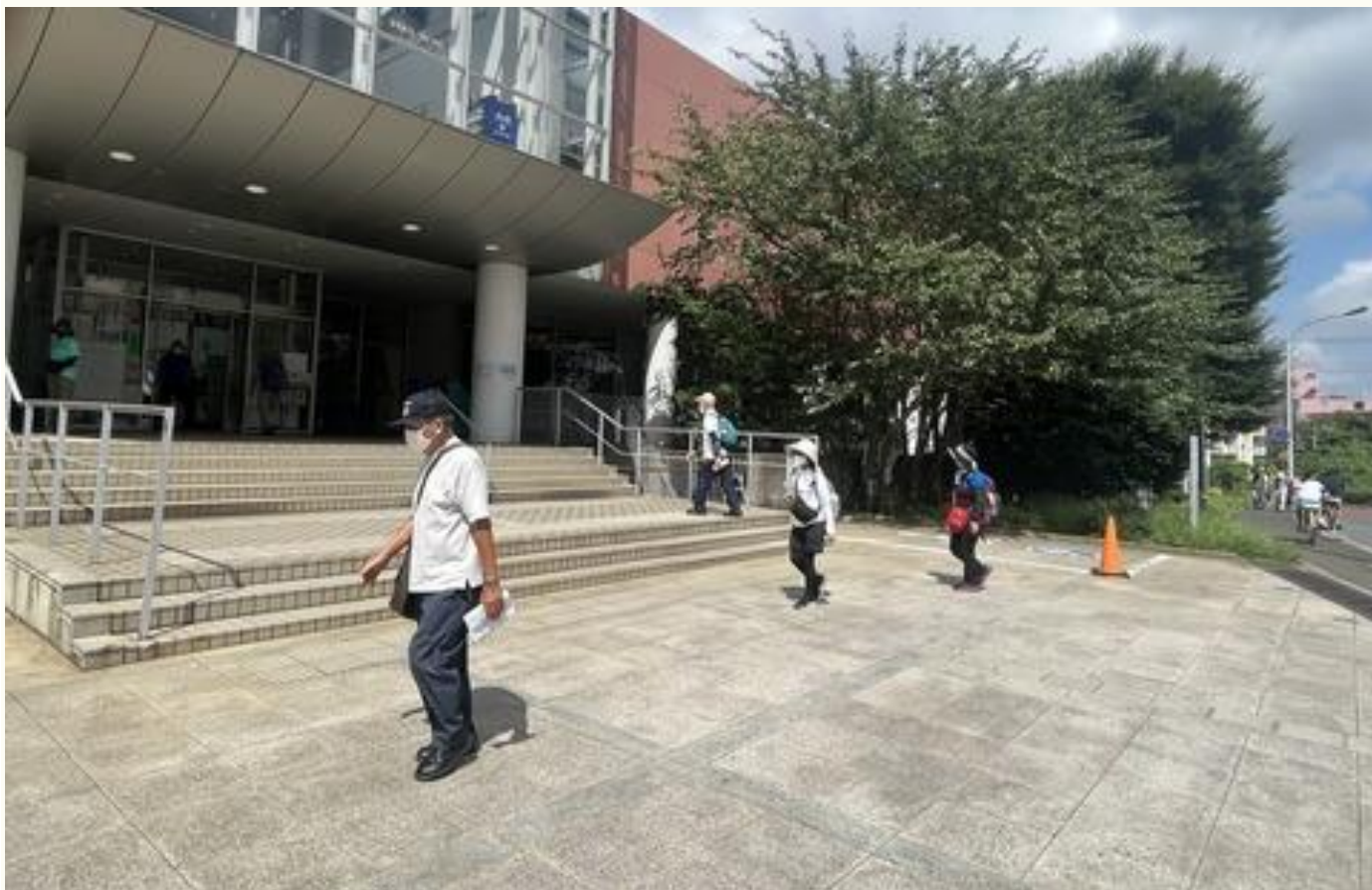
「和名ヶ谷スポーツセンター」前を通過する参加者たち。