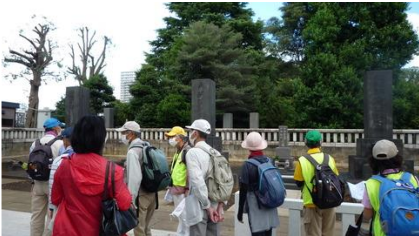
谷中墓地で渋沢栄一墓に墓参り