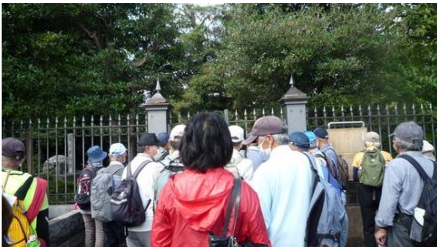
徳川慶喜公墓所に墓参り