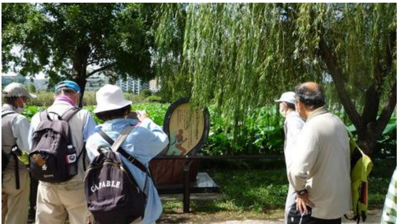
IVV を発行する日本市民スポーツ連盟前を通り、旧岩崎邸入口を過ぎ、不忍池畔にある駅伝の碑 を見学し、上野公園に入り、噴水前で昼食・休憩です