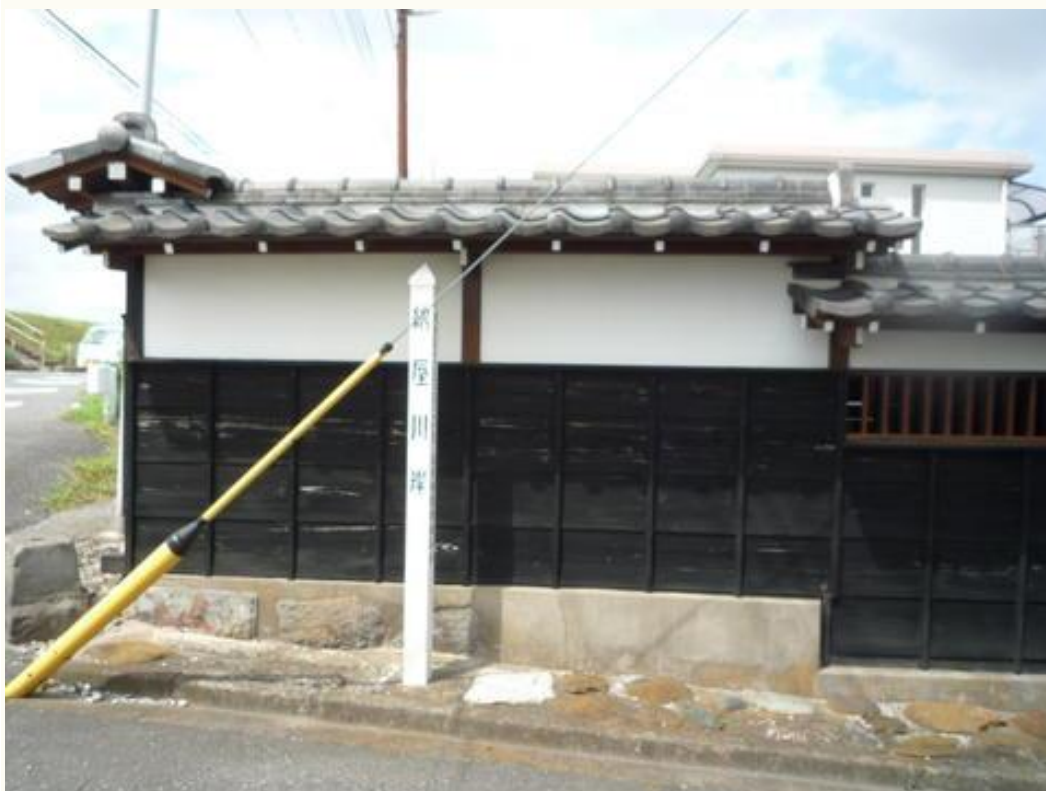
納屋川岸（鮮魚街道の終点）

特集 松戸の街道をゆく「鮮魚街道」なまみち・なまかいどう ウキウキ UKIUKI (ukiukiplus.com)