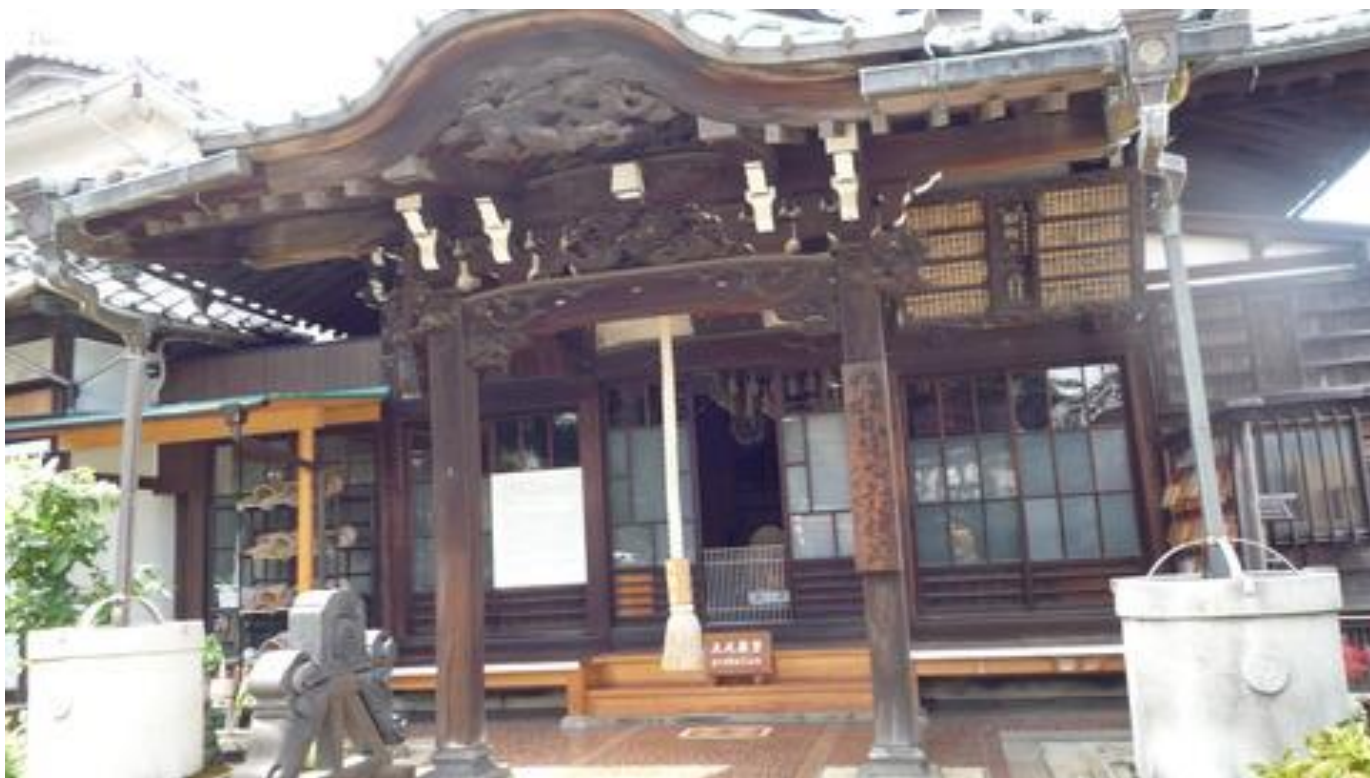
健脚の神様「日荷上人」を祀る日荷堂に参拝