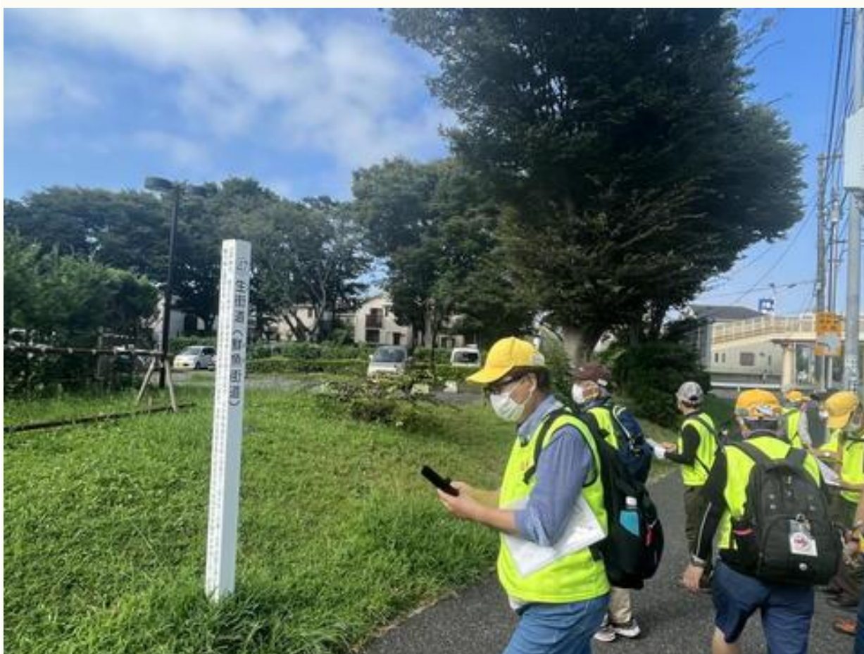
鮮魚街道の標柱（子和清水付近）の写真を撮っている先行誘導役員たちです。