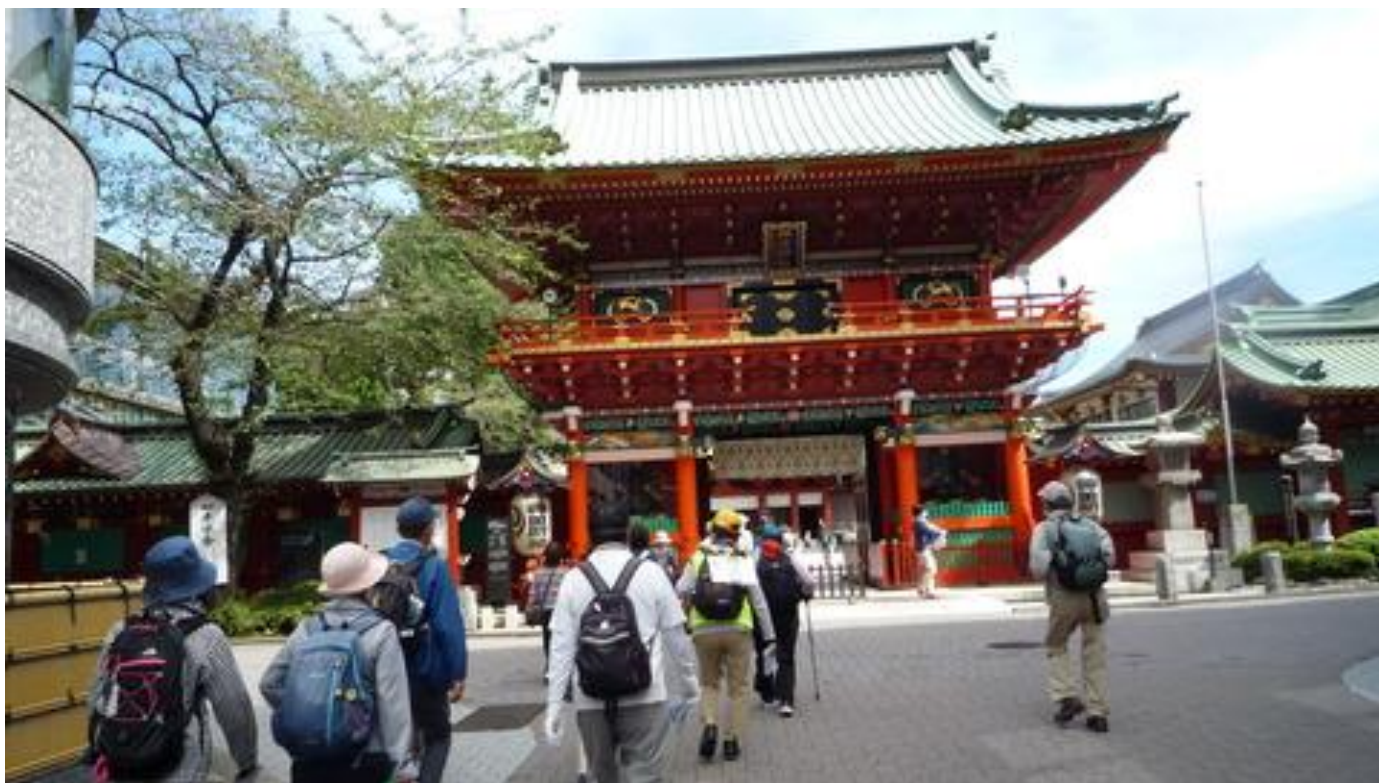
神田明神の隋神門前を歩き神田明神を参拝し飲水休憩