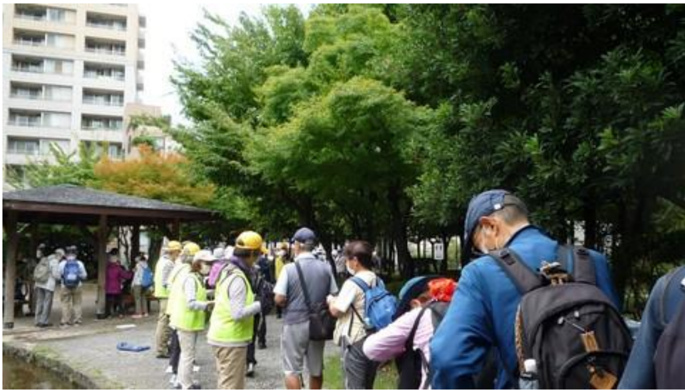
池の前で参加者の受付です

台風通過により、荒天の予想があり心配しましたが、曇天で穏やかな陽気となりました。会場の本郷給水所公苑は御茶ノ水駅から10分と遠く少しわかりづらいところでしたが、都会にもかかわらず緑の多い静かな公園でした。集合時間前から多くの参加者が見えられ、予定時間に参加受付を行い、84名の参加がありました。ホッとしました。