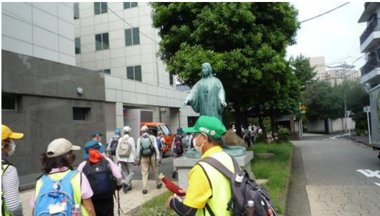
春日局墓がある麟祥院に向かう、春日局像を見てお墓参り