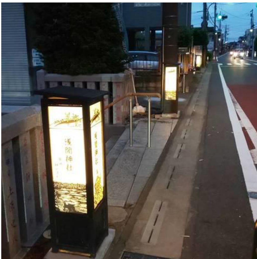
浅間神社前の「切り絵行灯」