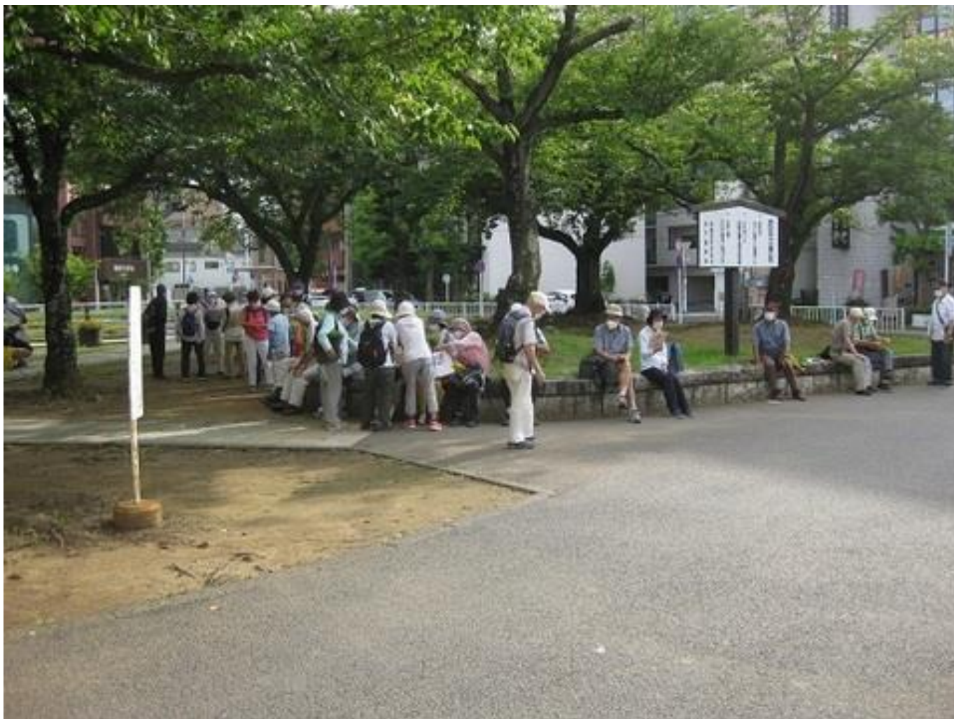
受付を待つ参加者 ※馬橋駅西口噴水広場(2枚)