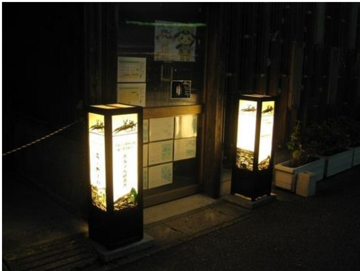
流鉄「流山駅」前の「切り絵行灯」

自由歩行でしたが全員が予定時間までに無事にゴール出来ました。暑い中、ご参加いただきました参加者の皆さん、コース途中の誘導矢貼り、受付、ゴール対応の役員の皆様、お疲れさまでした。