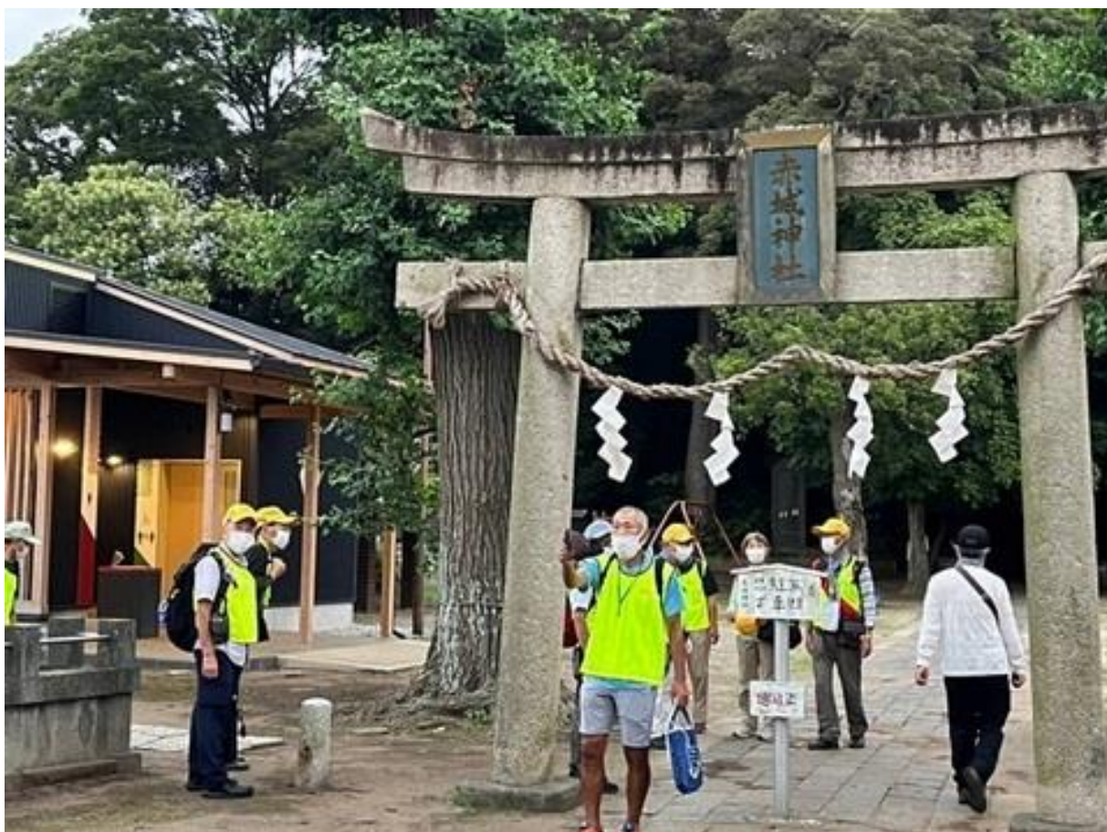
赤城神社に到着し、休憩をするアンカー