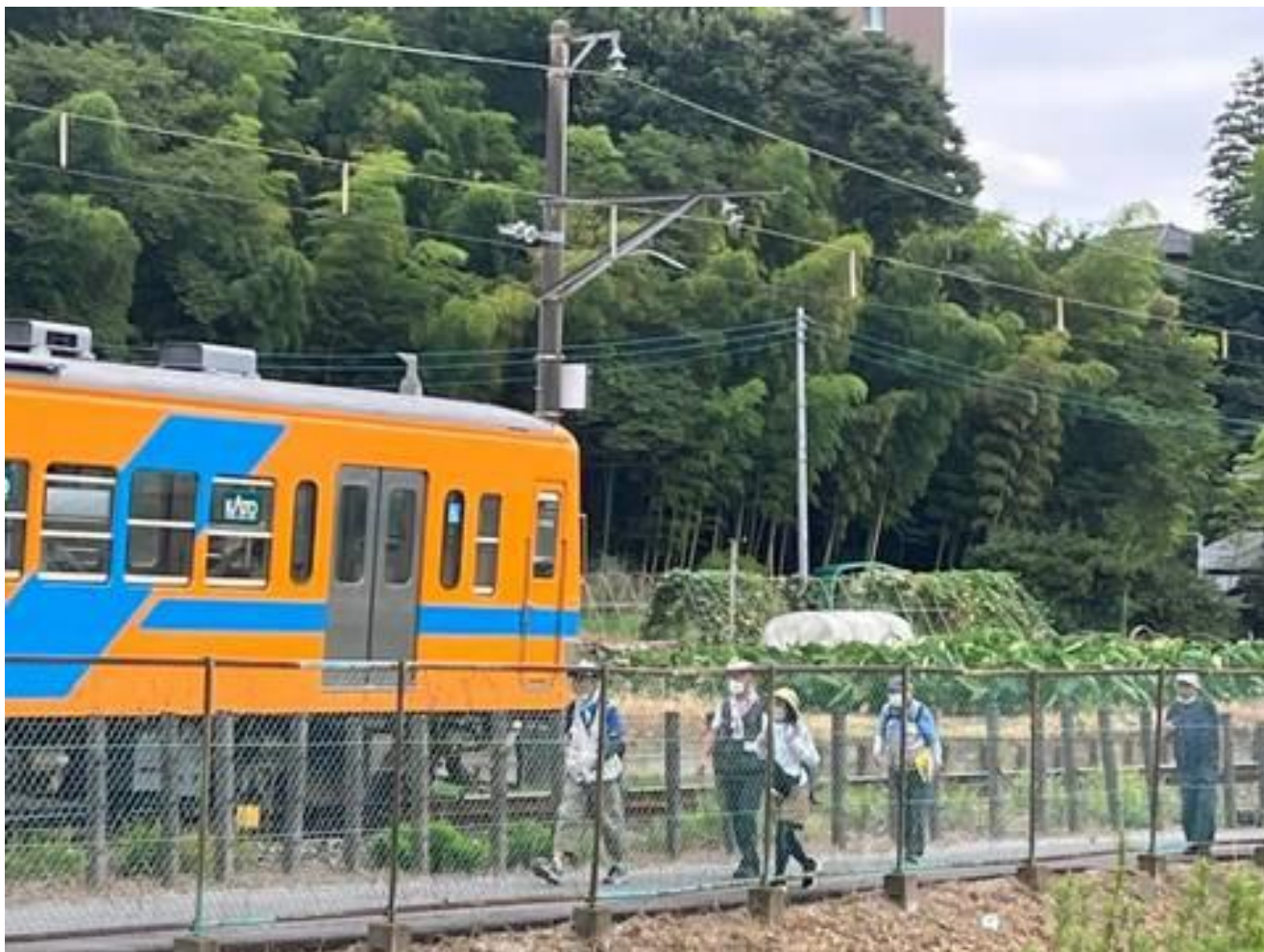
流鉄の電車を観ながら歩く参加者の皆さん(2枚)