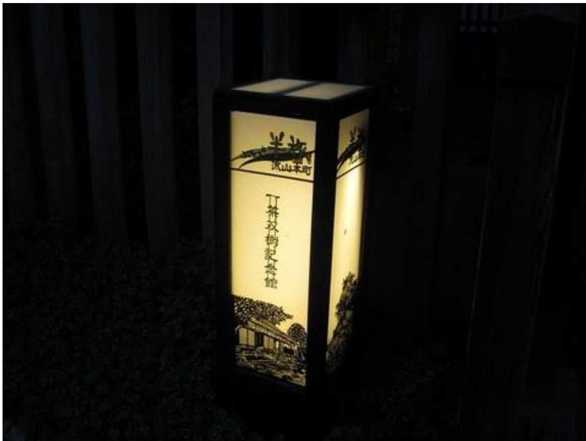
一茶双樹記念館前の「切り絵行灯」