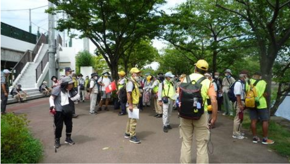
新左近川親水公園のラグビー広場でトイレ休憩し出発