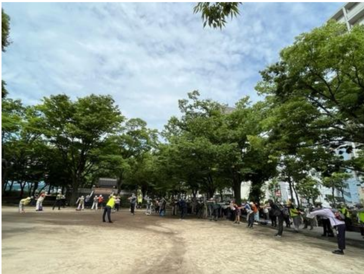
ウォームアップストレッチを全員で行いスタートしました