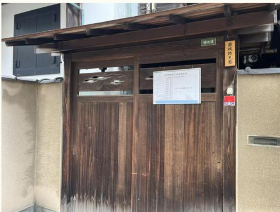
旧伊勢屋質店（菊坂跡見塾）

樋口一葉菊坂旧居跡（一葉の井戸） | 東京とりっぷ (tokyo-trip.org)