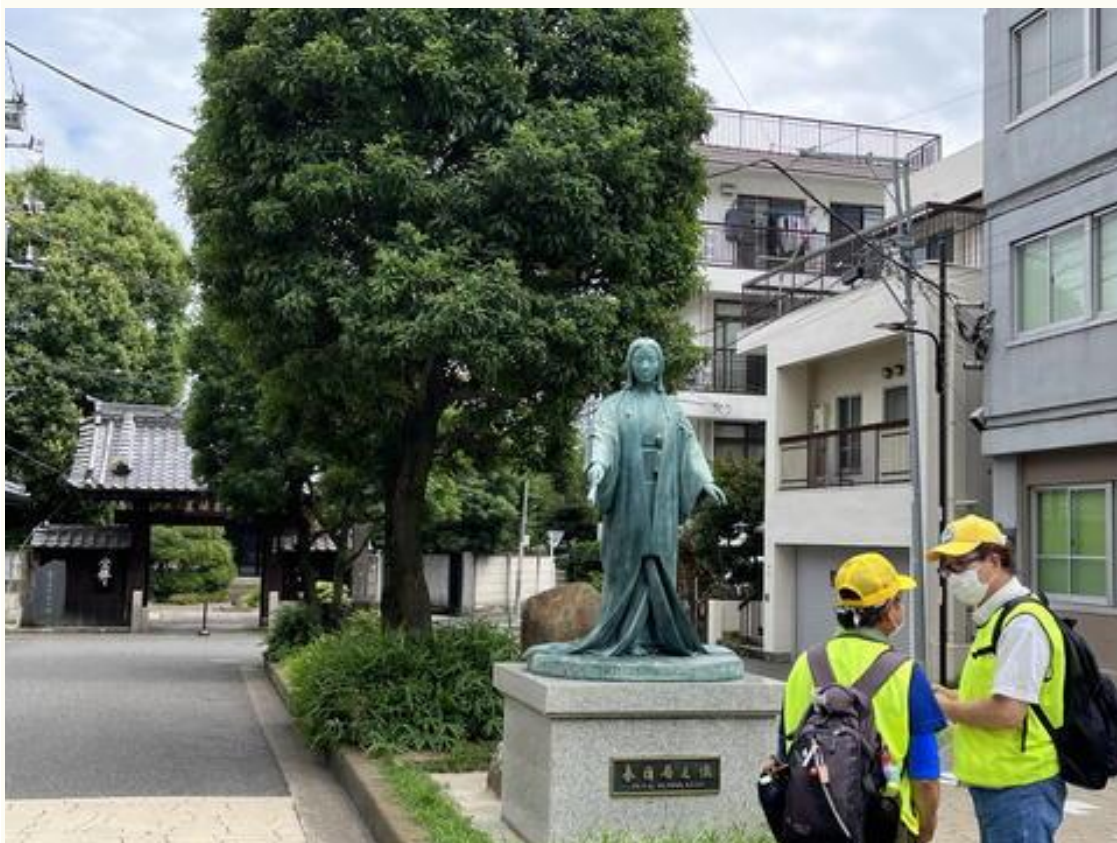
麒麟祥院（りんしょういん）の前にある春日局之像。