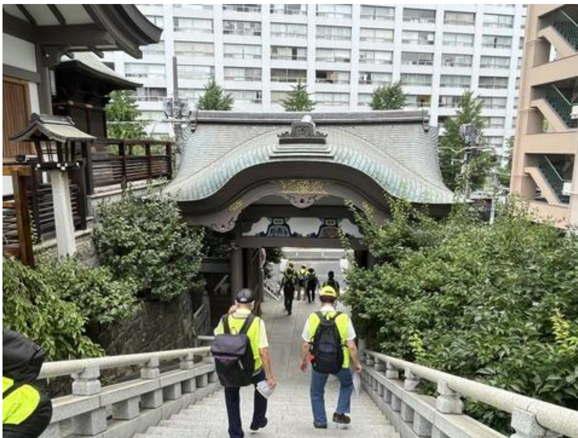
湯島天神境内を抜ける誘導担当役員。