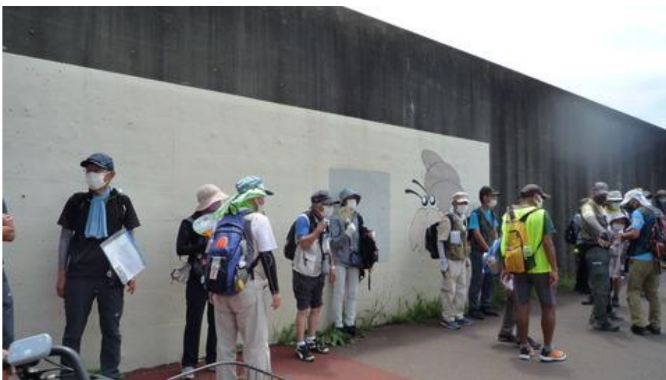
葛西大橋を潜り、日陰で列詰休憩、殆どの方は葛西臨海公園へ歩く