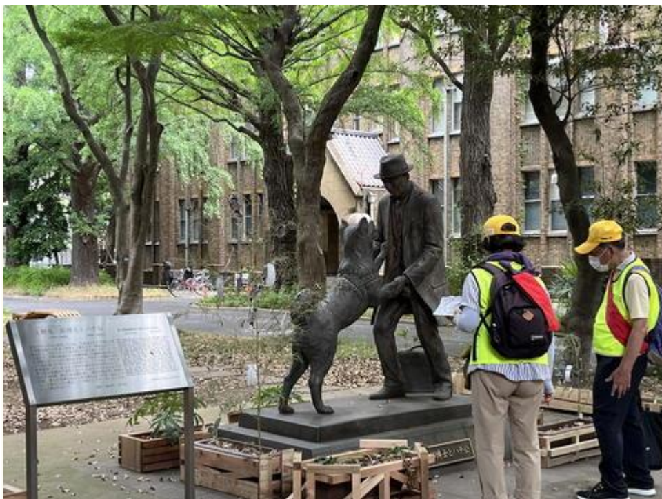
忠犬ハチ公像（東大農学部構内）