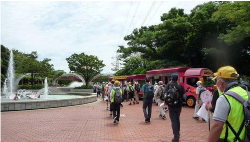
フラワーガーデン噴水横を歩く