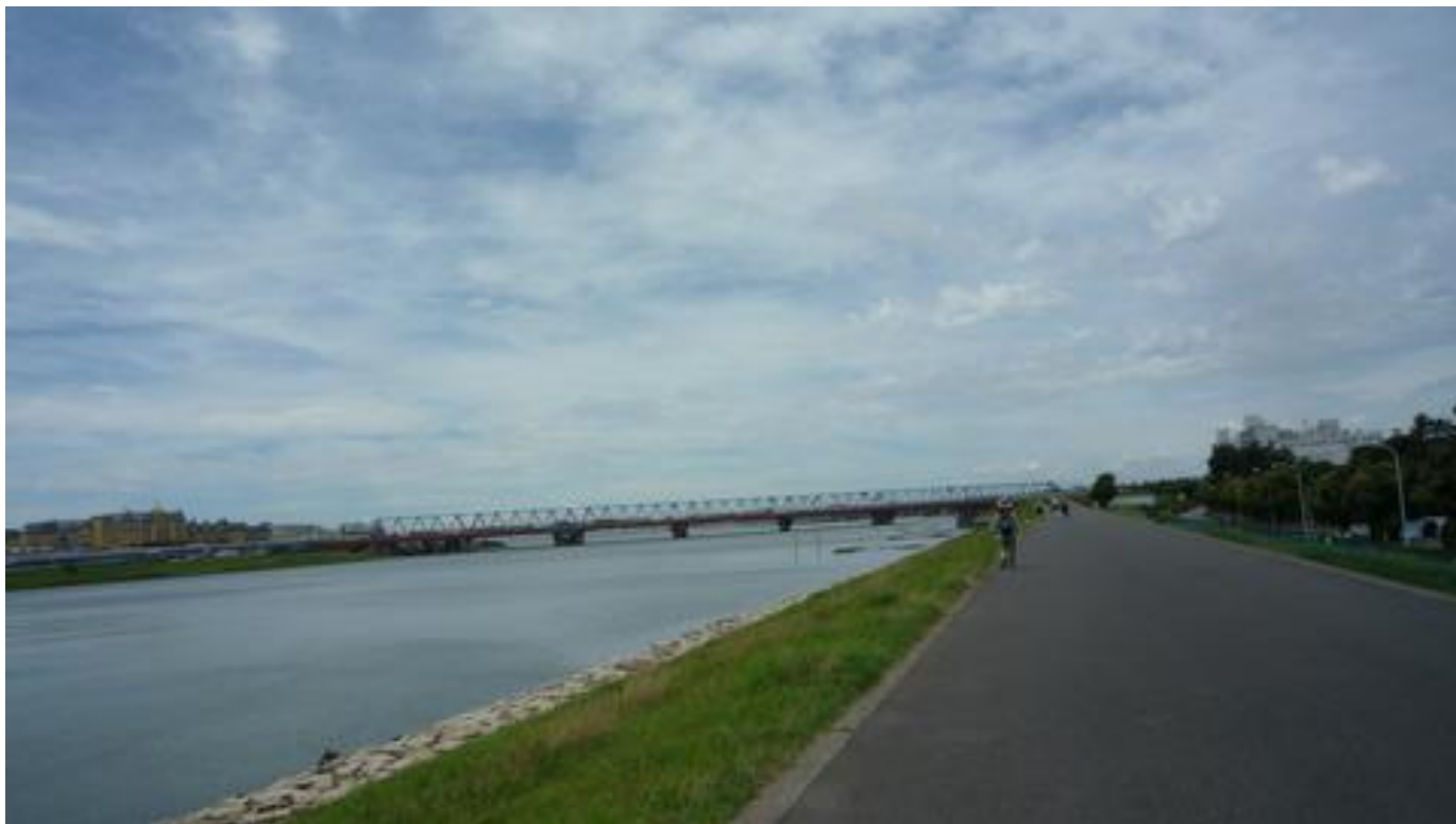
左手にはディズニーランドが見え見晴らしは抜群、健康の道を歩く