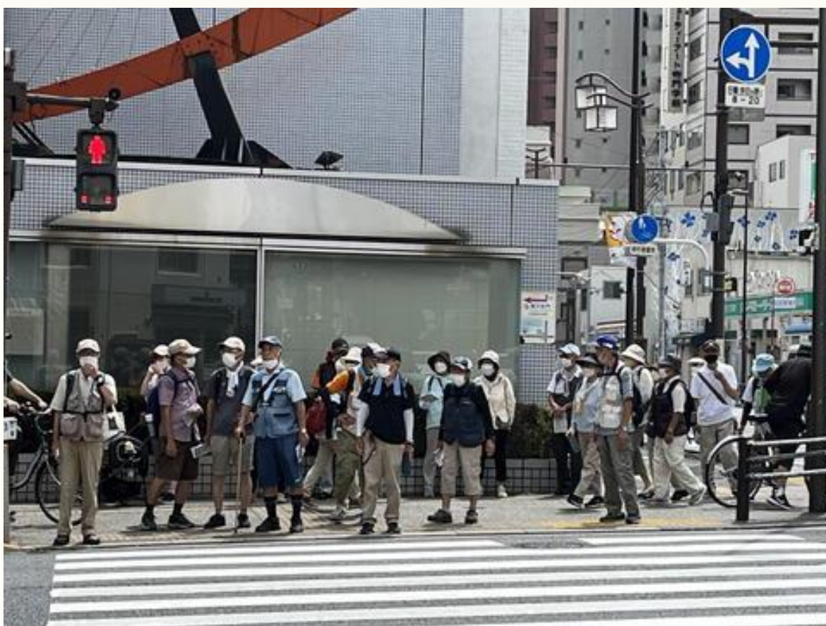
本郷三丁目交差点で信号待ちの参加者たち。