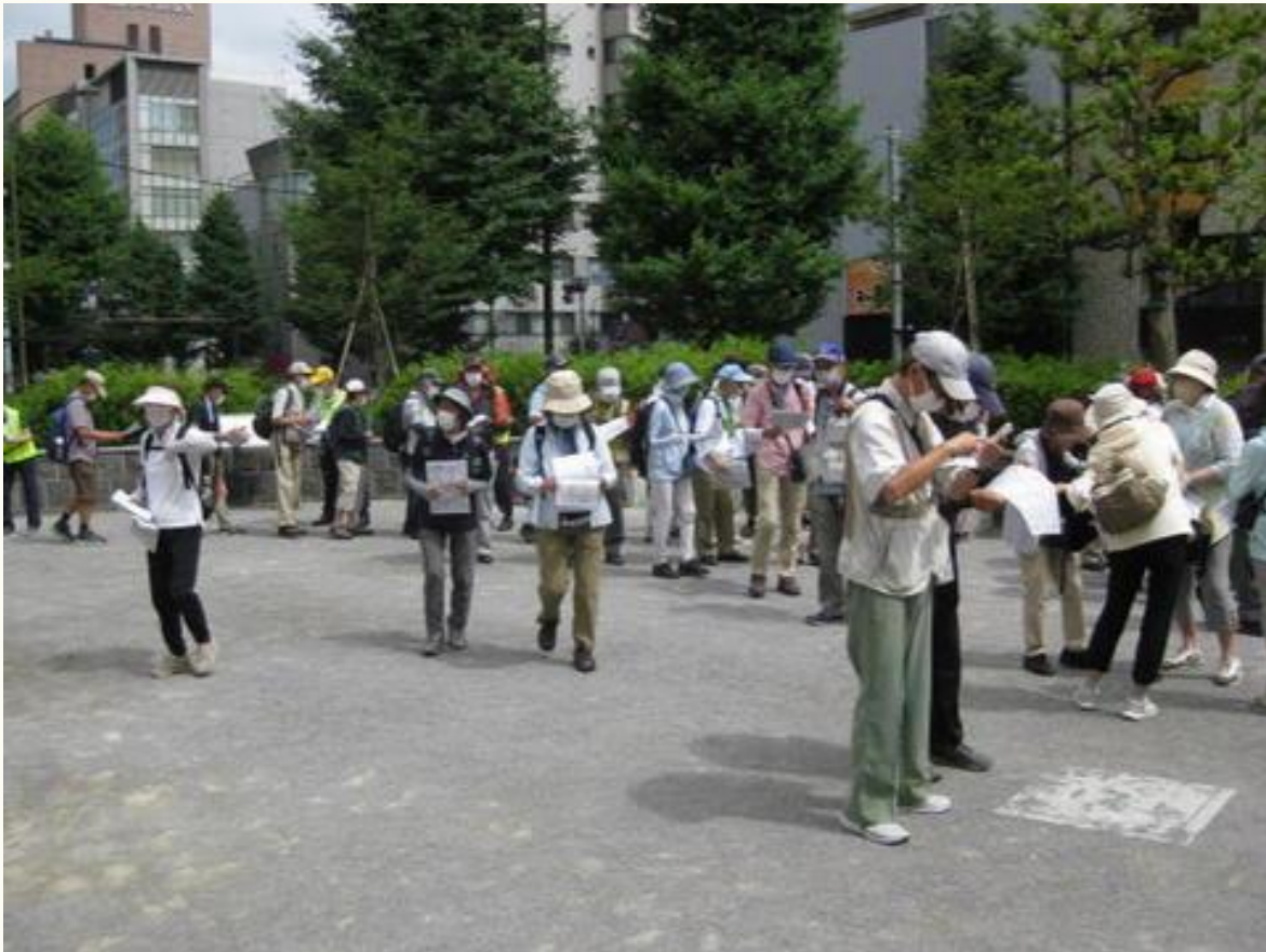
受付を終え、出発前にコース地図を確認しています。