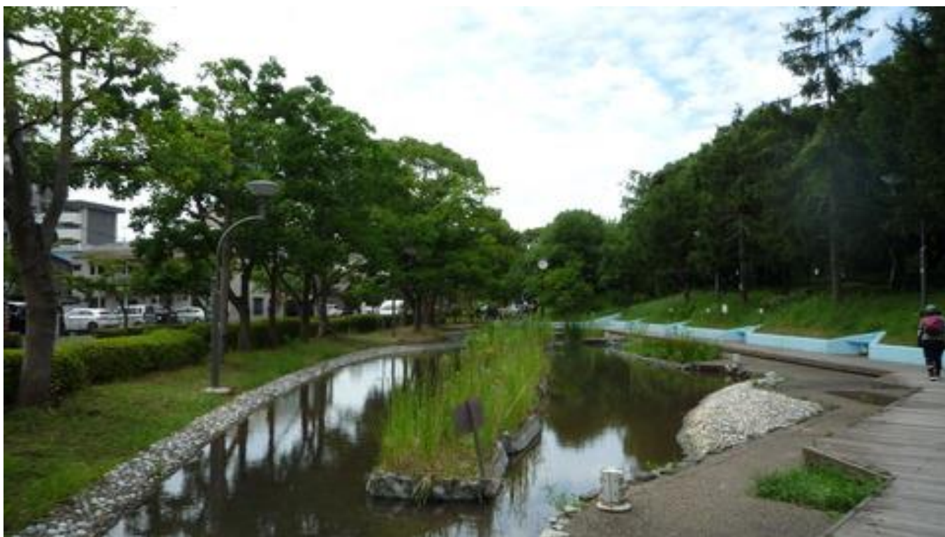
新長島川親水公園のせせらぎの道を歩く