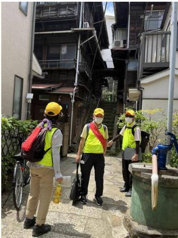
樋口一葉旧居跡・井戸

樋口一葉菊坂旧居跡（一葉の井戸） | 東京とりっぷ (tokyo-trip.org)