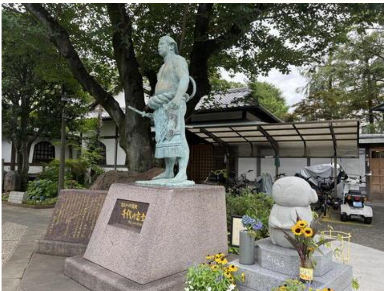
昭和の名横綱千代の富士が眠る「玉林寺」 境内には、千代の富士像があります。