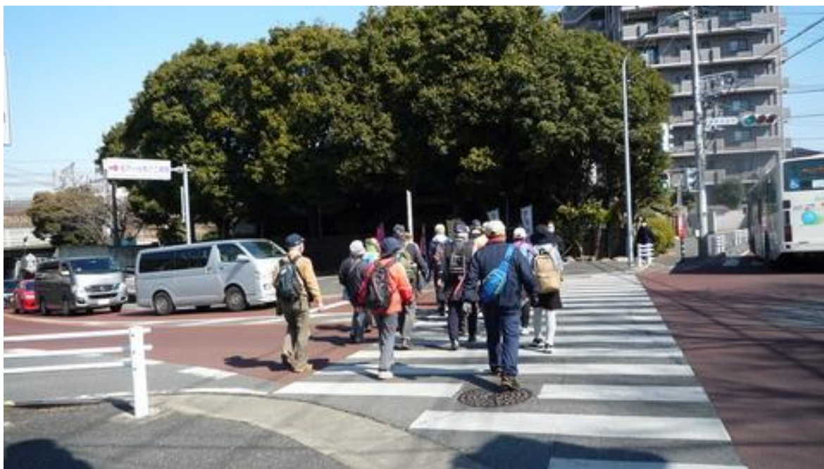
アンカーがゴール