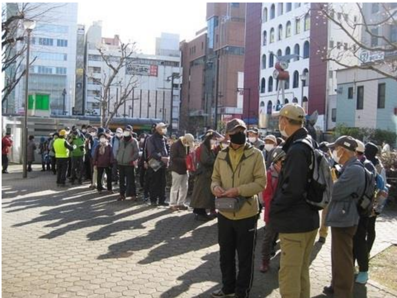
受付開始を待つ参加者の皆さん