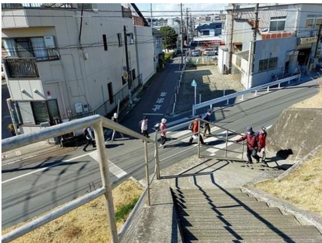
荒川の土手を上る