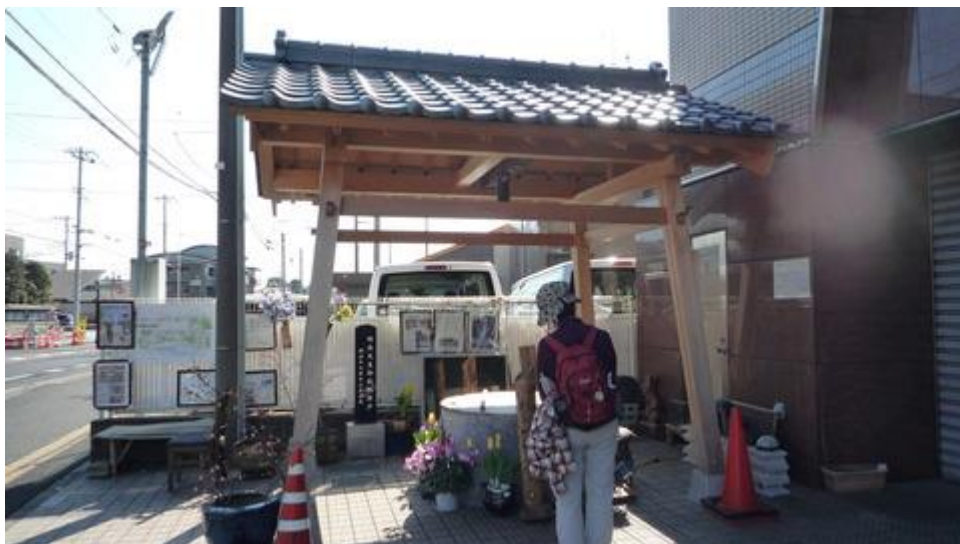
我孫子宿本陣跡案内柱を歩く参加者