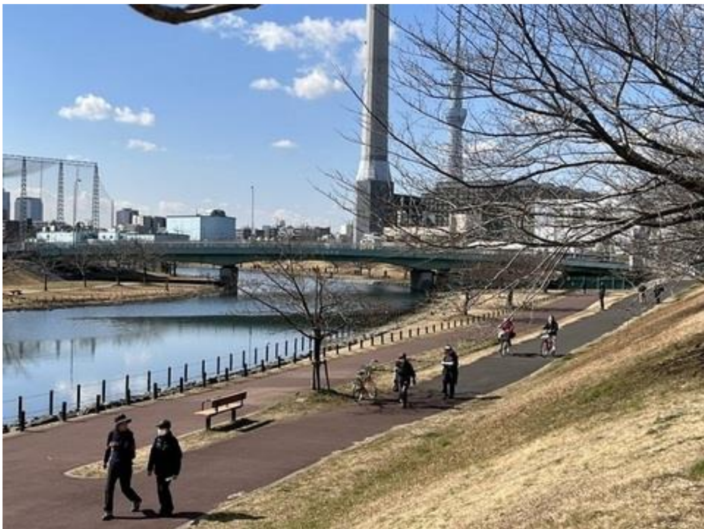
旧中川遊歩道を歩く参加者