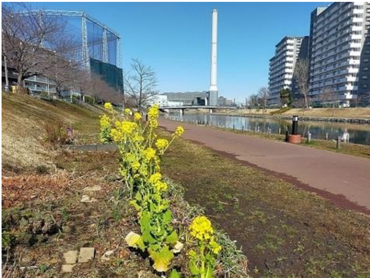
旧中川に咲く菜の花