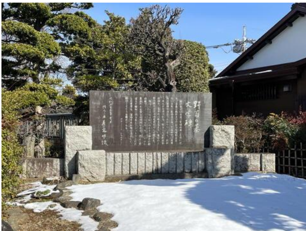
「野菊の墓文学碑」 雪がかなり残っていて、ここまでの階段の上り下りがたいへんでした。