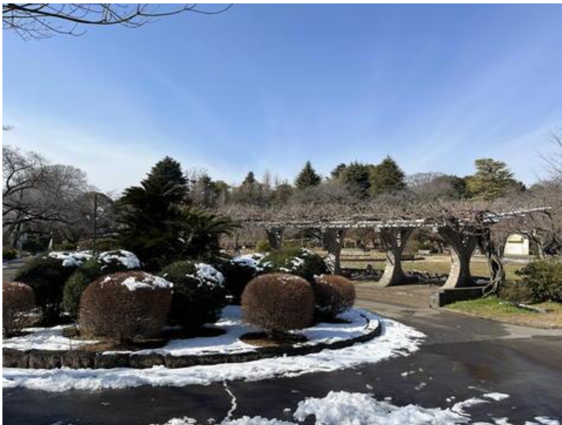
ゴール場所の「里見公園」