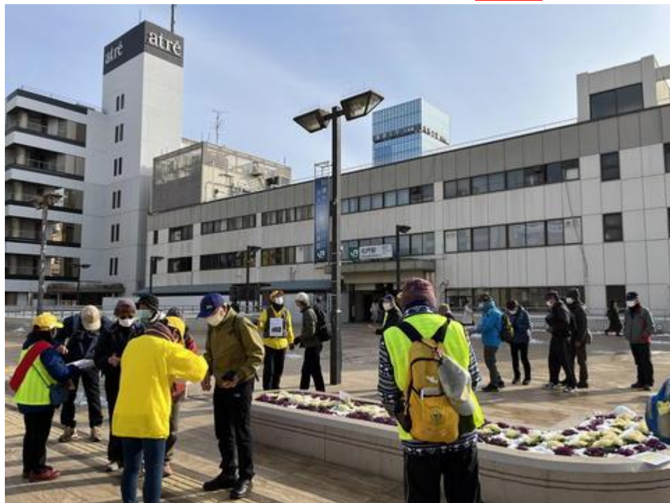
受付風景 (松戸駅西口ペDESTリアンデッキ)

先日降った雪が凍結し、足元が悪い場所もありそうということで、参加されるのをひかえた方も多かったと思いますが、晴天のこの日、なんと 91名 のほゆう (歩友) が参加されました。