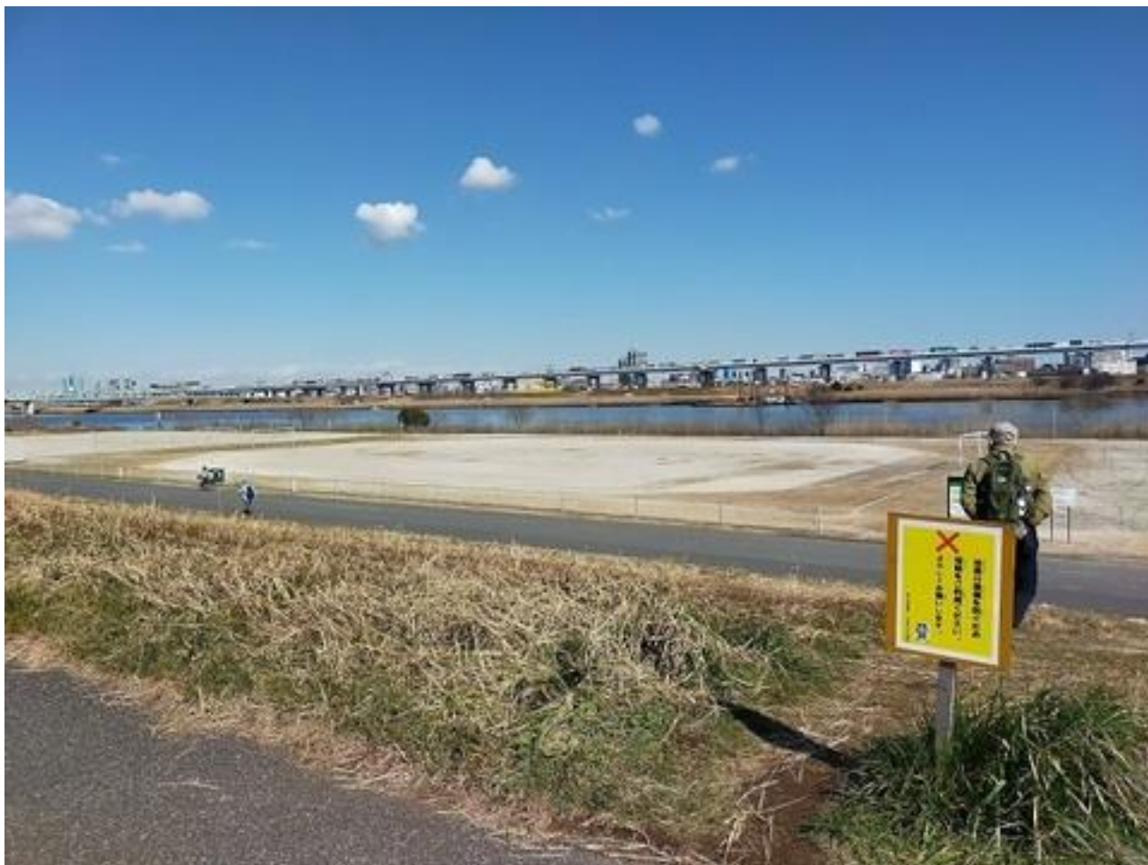
荒川に出た参加者