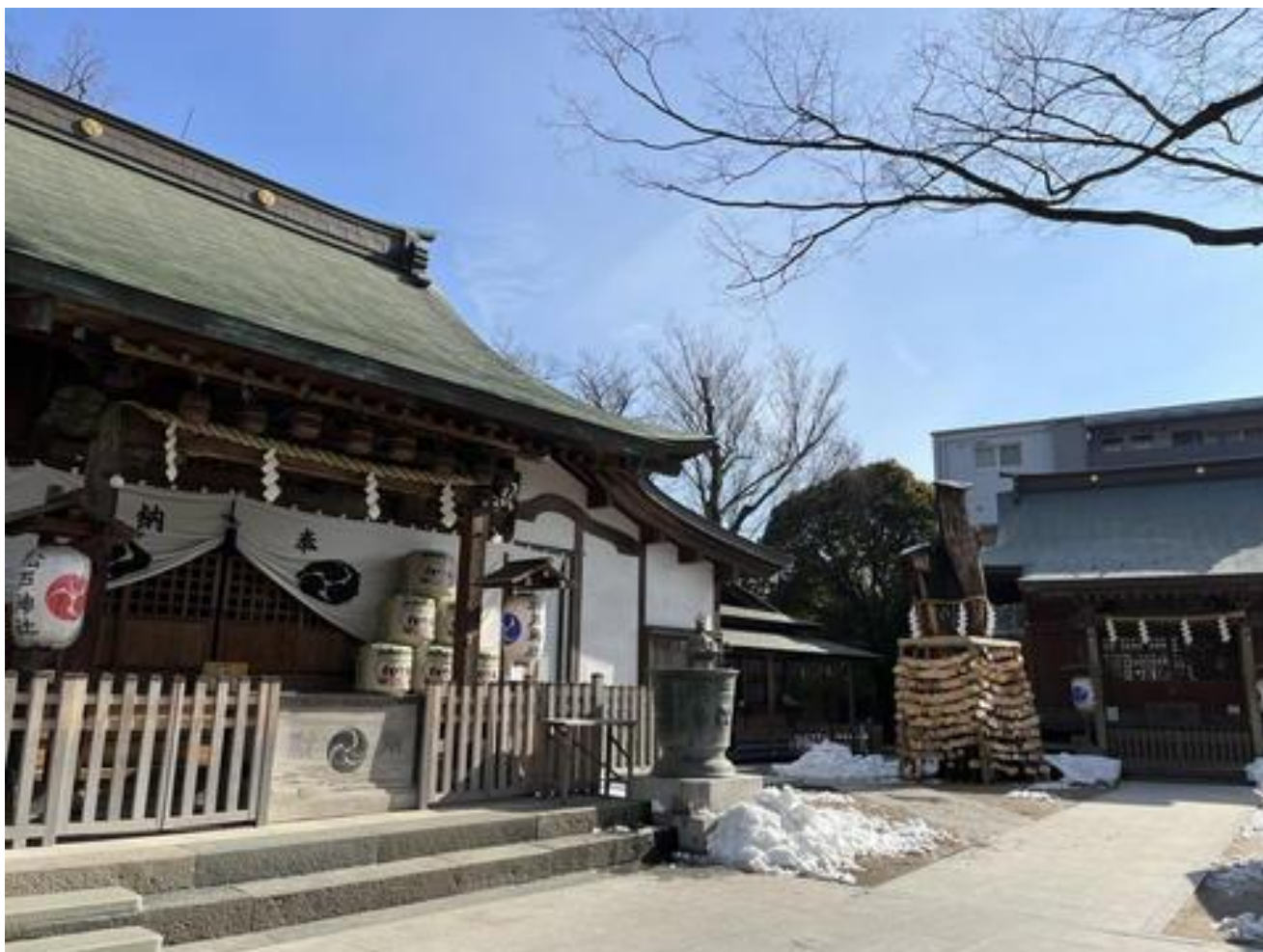
「松戸神社」境内には、先日降った雪が残っていました。