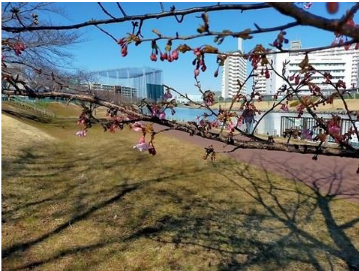
咲き始めた河津桜