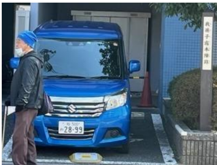
旧水戸街道から常磐線ガードを潜るため横断歩道を渡る参加者