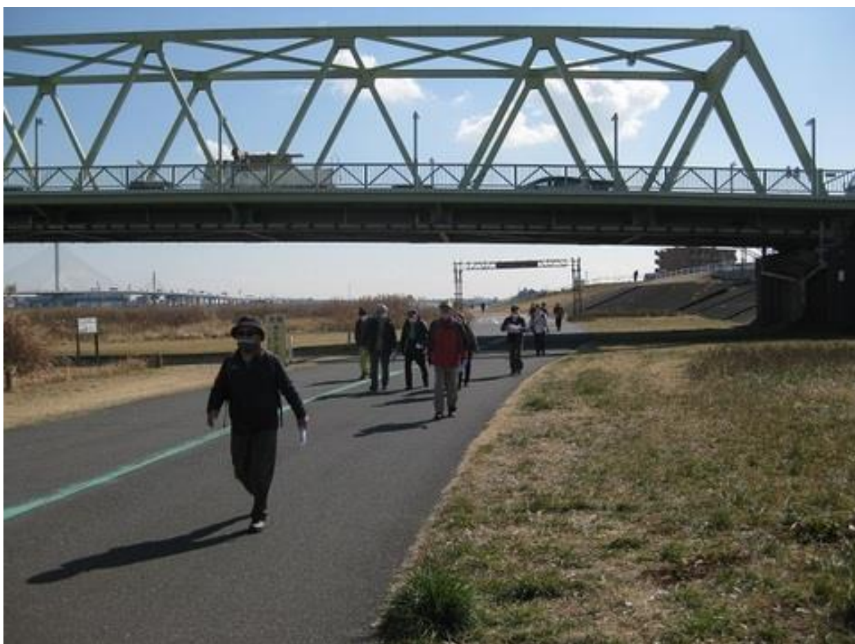
荒川四つ木橋付近を歩く参加者