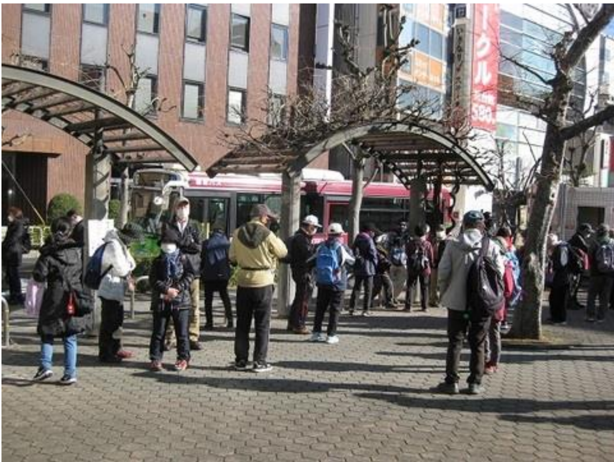
亀戸駅前公園 ※時間前にたくさんの参加者が来られました

後半はコロナ感染の心配の少ない荒川河川敷の遊歩道を思いっきり楽しんで歩けたのではないのでしょうか。