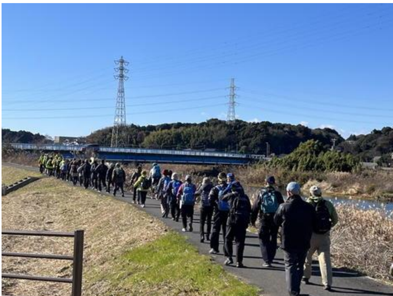
昼食休憩の後、ヒドリ橋から大津川沿いを歩き、柏駅方面にむかって出発です。