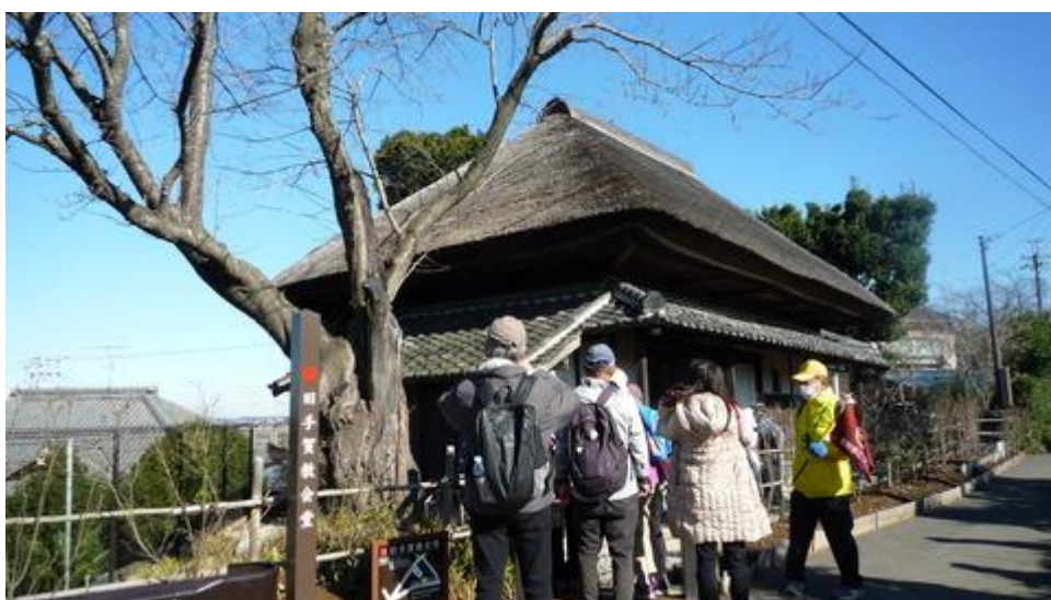
茅葺屋根の旧手賀教会堂を内部見学のため待つ参加者