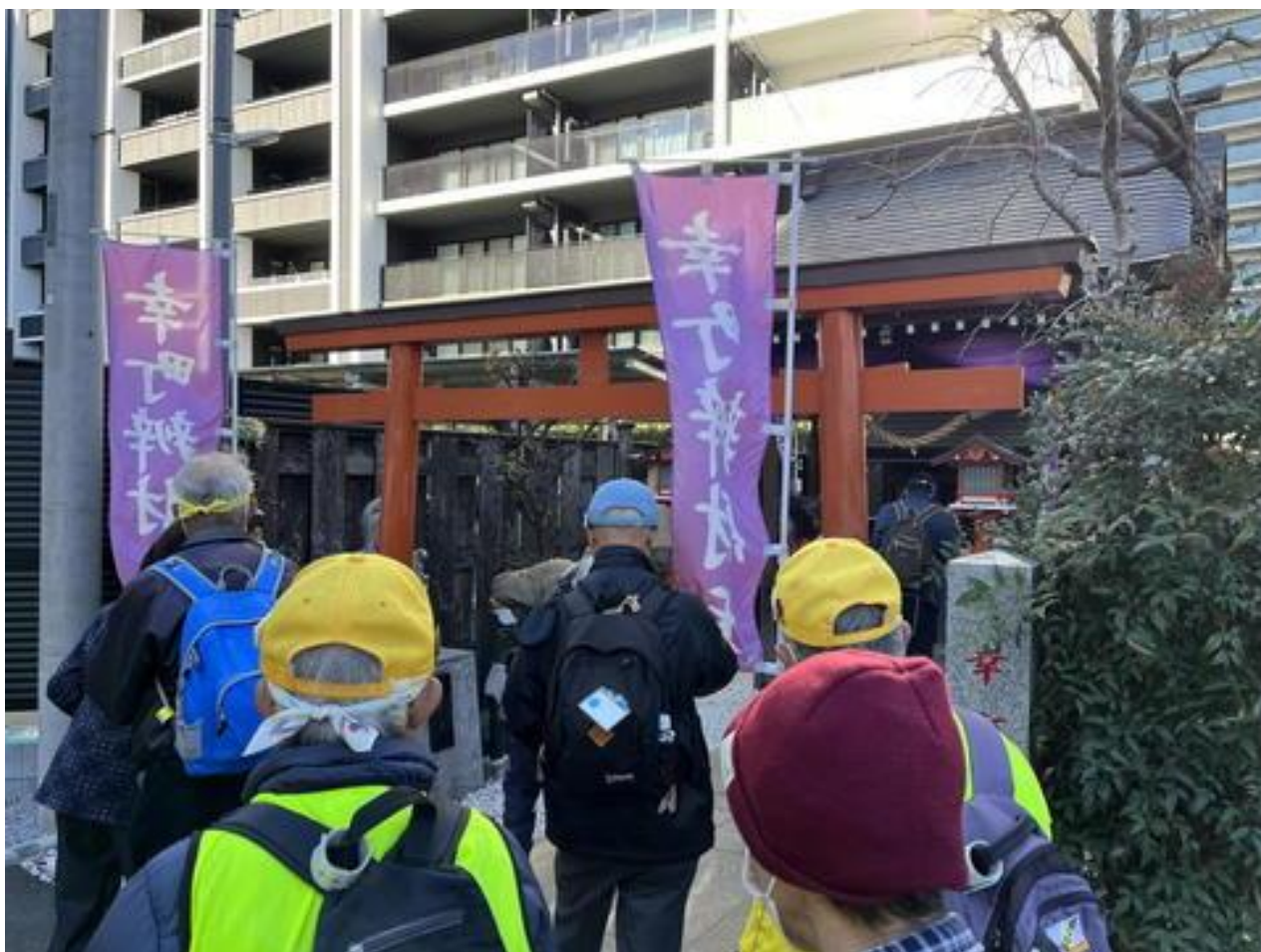
ゴールに近い、今回のかしわ七福神めぐり最後の「幸町辯財天」。