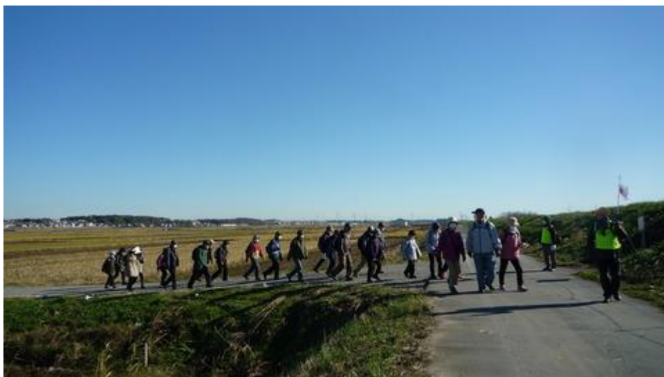
手賀川土手に出て曙橋へ向かう