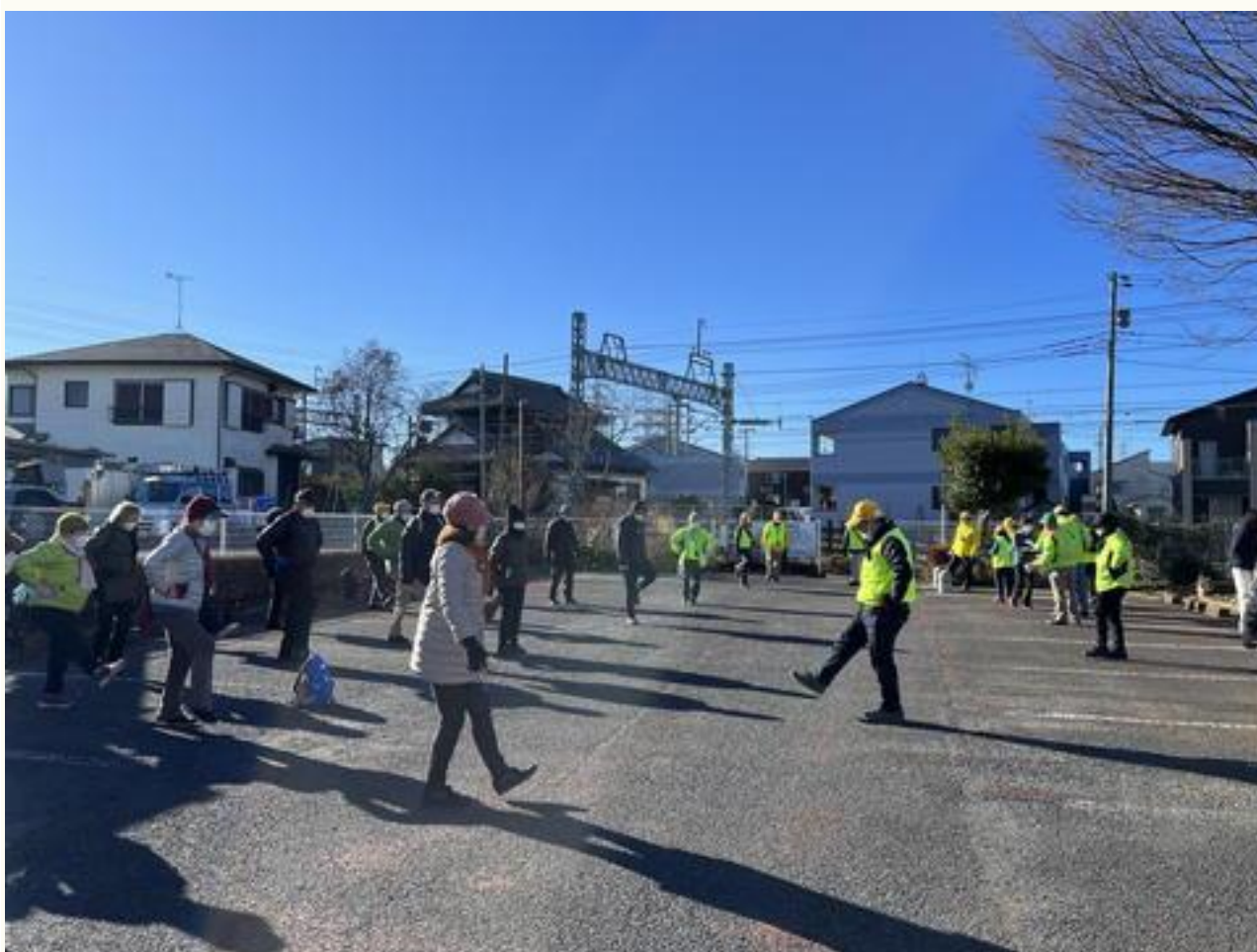
出発前のストレッチ。