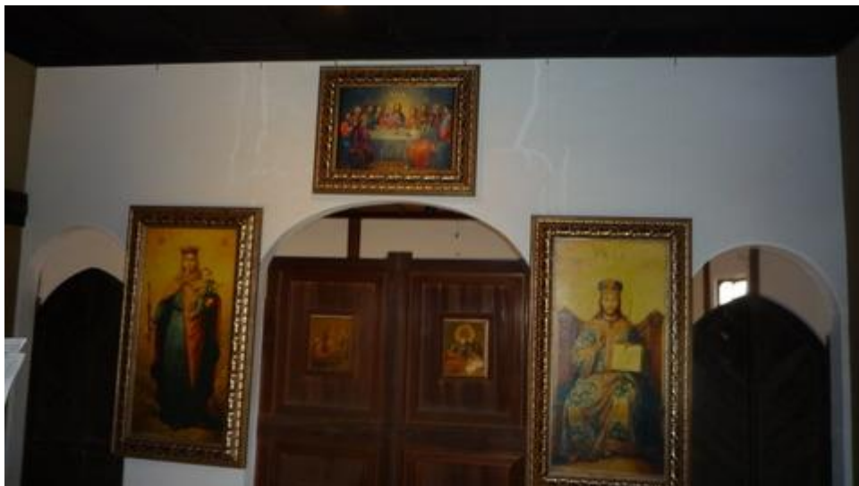
山下りんのイコン（聖画＝レプリカ）を見て満足