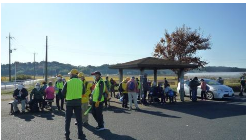
曙橋を渡りトイレ休憩中の参加者