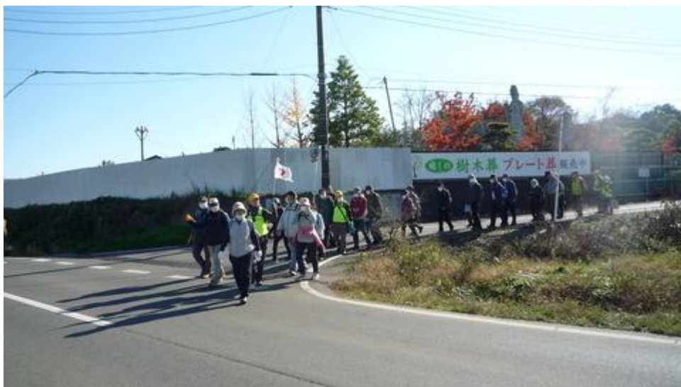
興福院墓地でトイレ休憩の後に出発