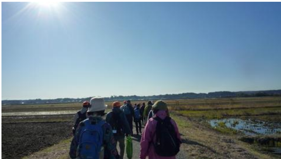
右手に雪をかぶった富士山を見ながら農道を歩く