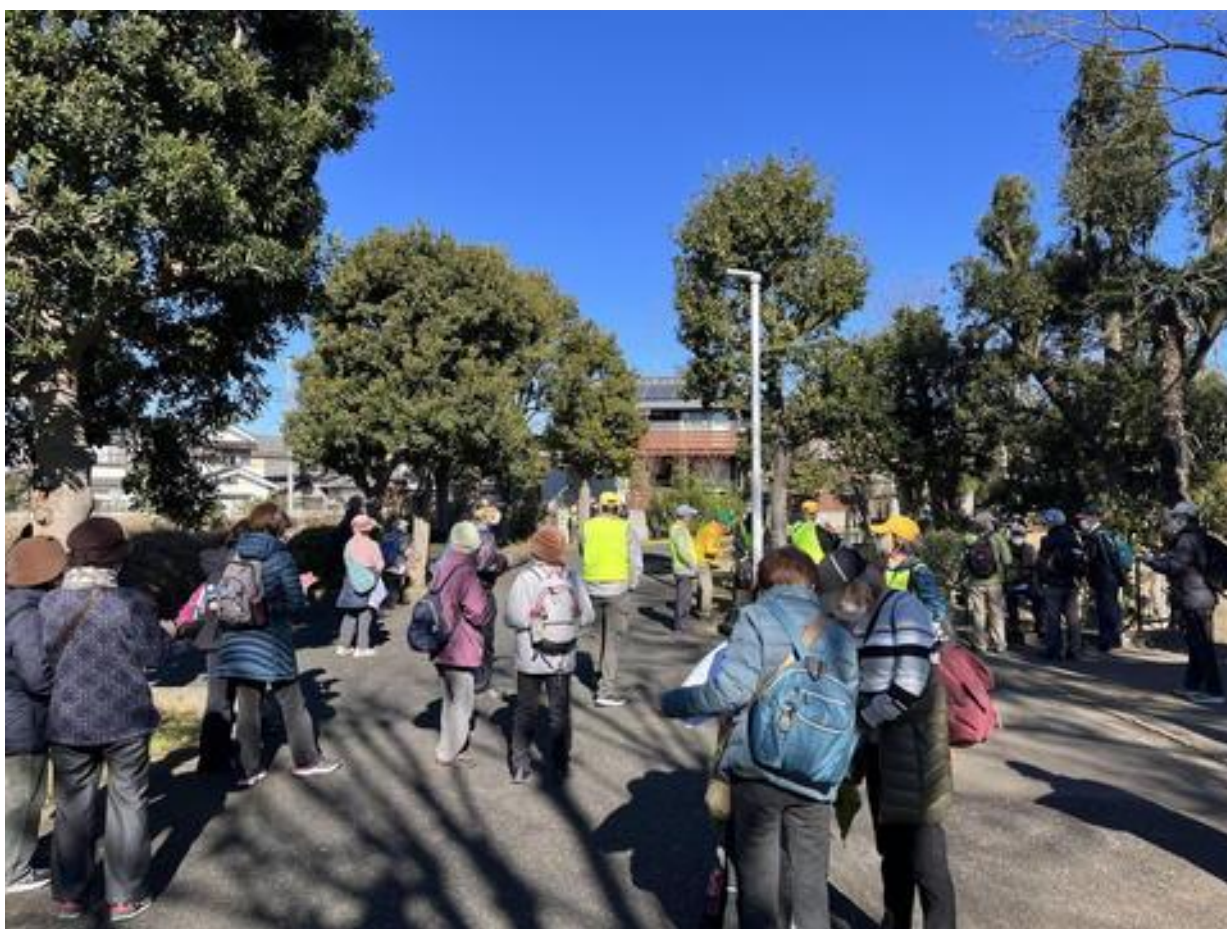
大津ヶ丘中央公園でトイレ休憩。