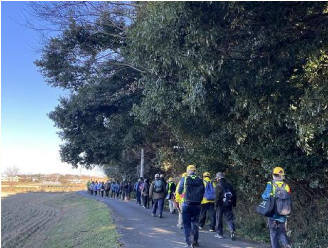
かしわ七福神めぐりスタートしました。