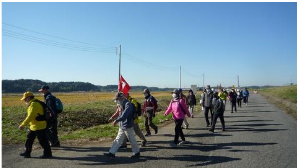
手賀川から分かれ興福院を目指す