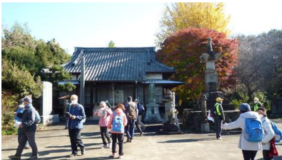
興福院を参拝、大銀杏がお出迎え