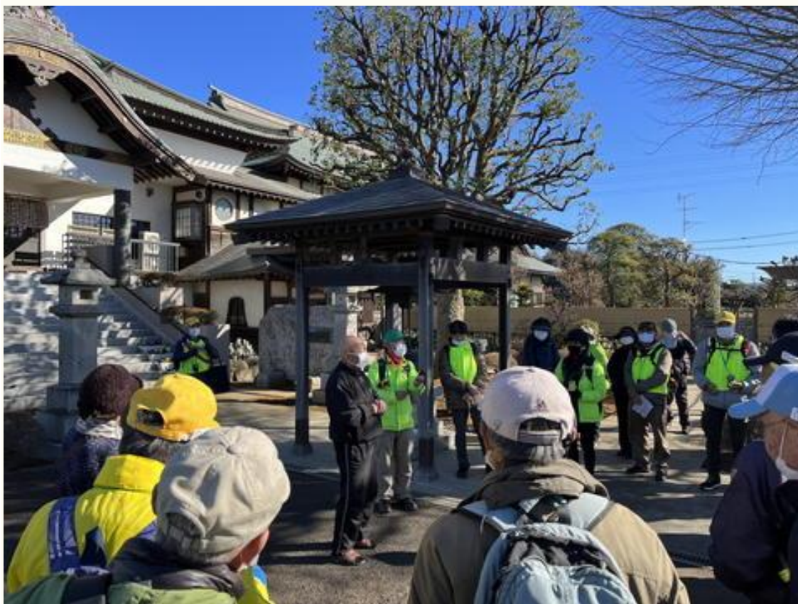
慈本寺の住職の大黒天のお話を聞く参加者たち。