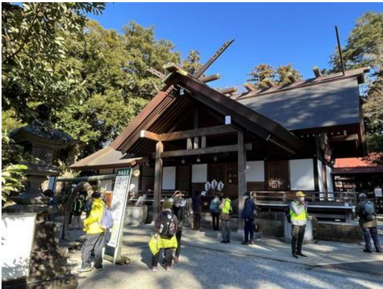
神明社（弁財天・大黒天）