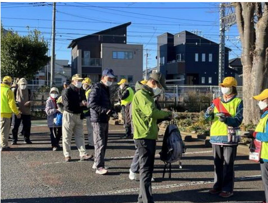
受付風景 (高柳近隣センター駐車場)

この日は、朝から晴天。北総歩の今年最後の行事ということもあってか、集合場所の高柳近隣センター駐車場には、152名のウォーカーが集まりました。今回は基本団体歩行ですが、地図で歩ける方は自由歩行でご自分のペースで歩くことができます。9時5分前から受付を開始。地図を片手に、次々に出発していきました。団体歩行に参加される方は、9時15分頃から出発式、ストレッチを行ったあと、9時30分頃に出発することができました。団体歩行には、役員を含め、約50名が、参加しました。