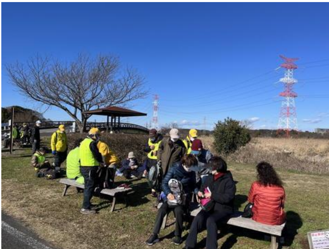
手賀沼ヒドリ橋付近で昼食をとりました。