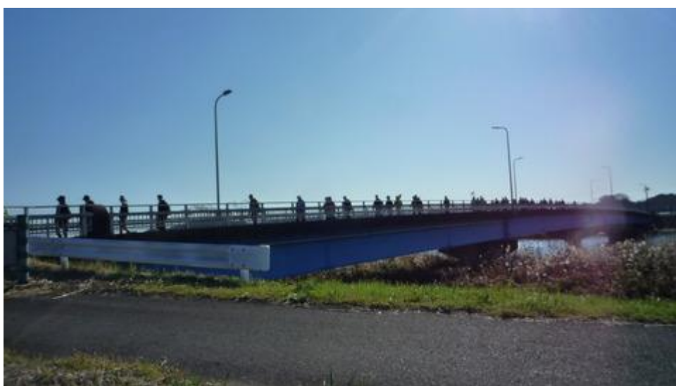
水道橋を渡る参加者達