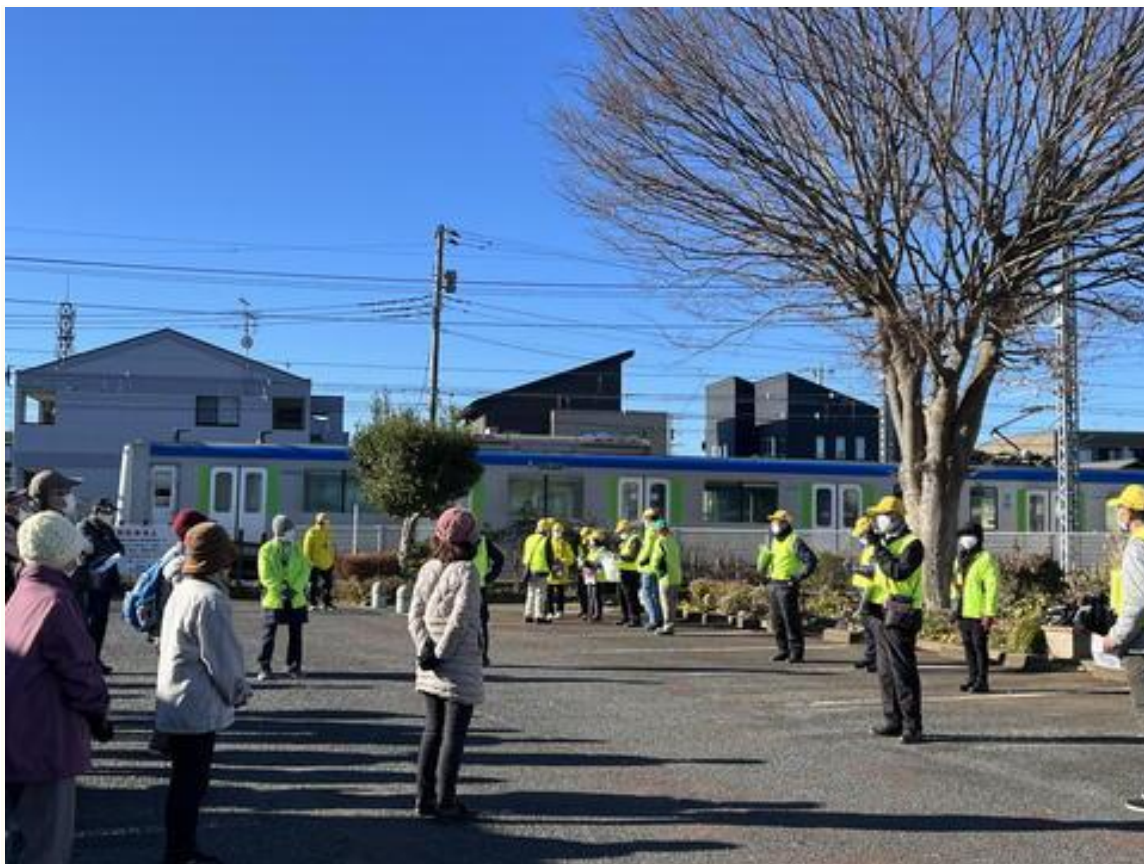
団体歩行出発式風景