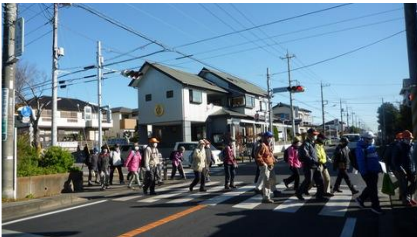
湖北台中学校入口の横断歩道を整然と横断