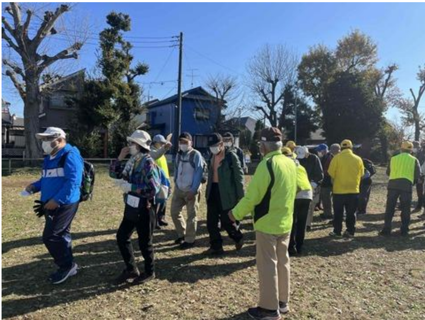
2 班に分かれ湖北台中央公園をスタート