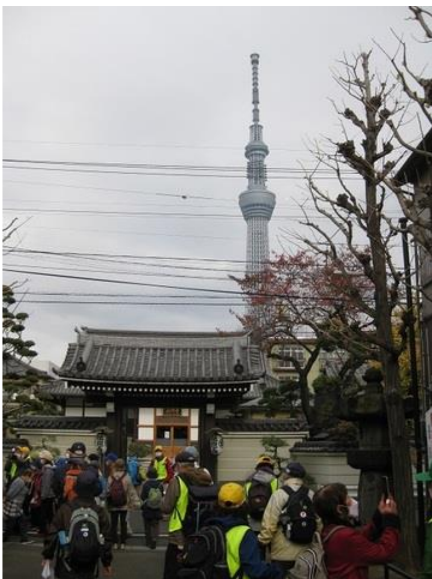
法恩寺で法事が有り、入れない為に門前から拝観しました