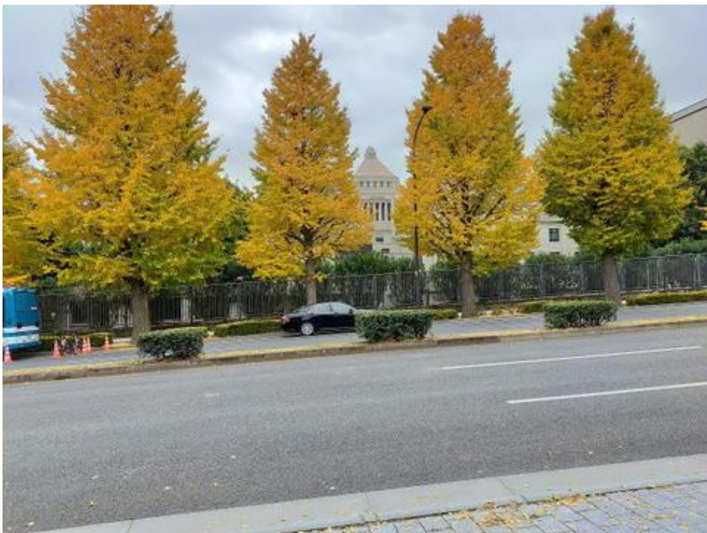
国会議事堂前の銀杏並木