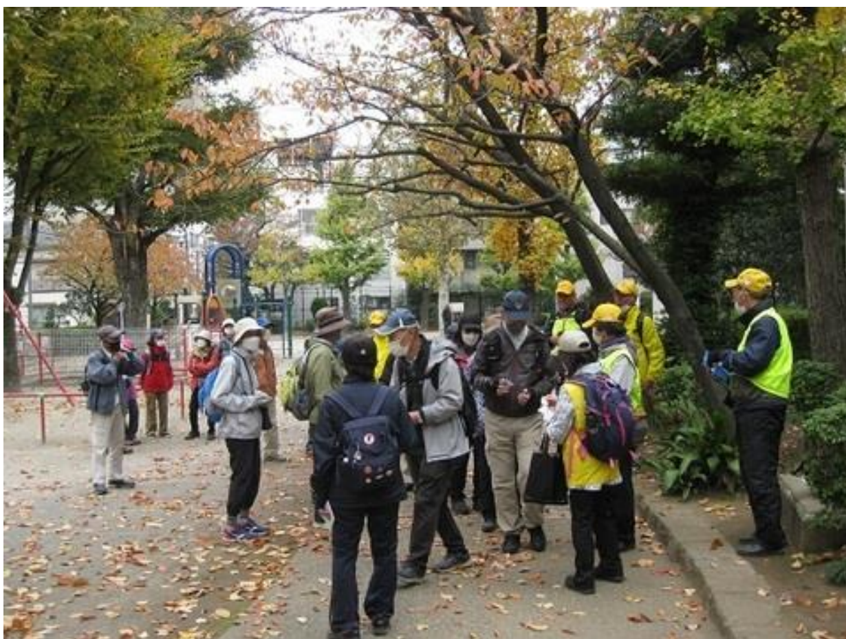
待乳山聖天公園。「池波正太郎生誕の地」 昼食と9kmの方はゴールでした。