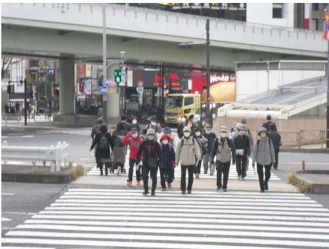
赤坂見附交差点を横断する参加者。