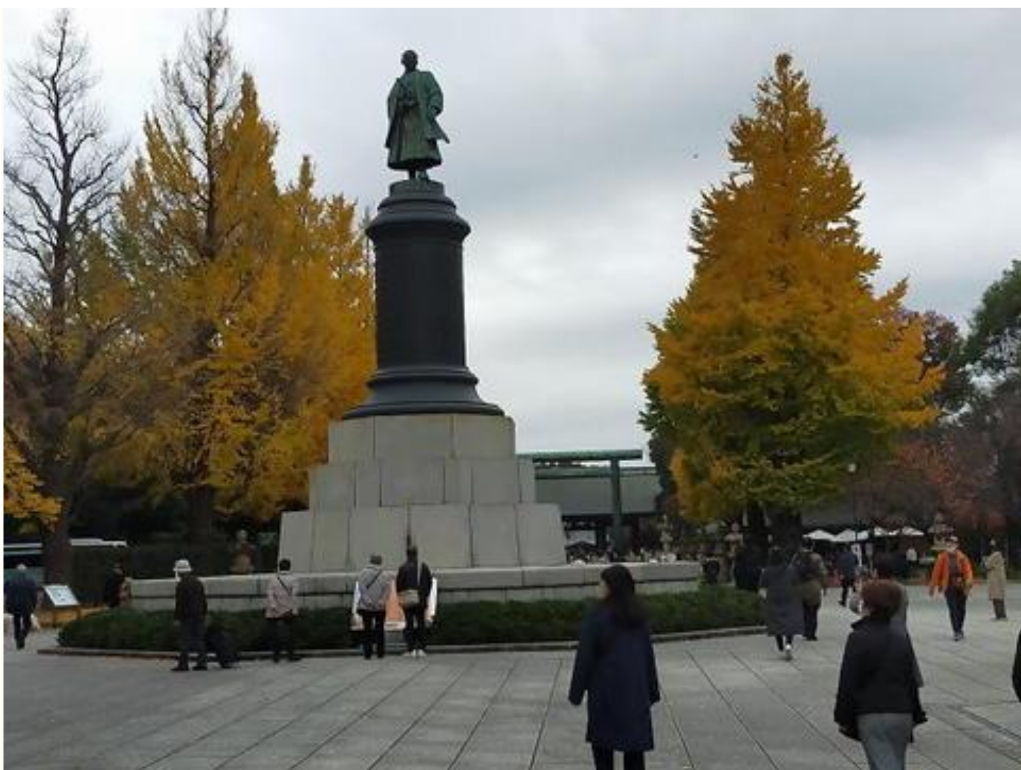
靖国神社「大村益次郎」の銅像