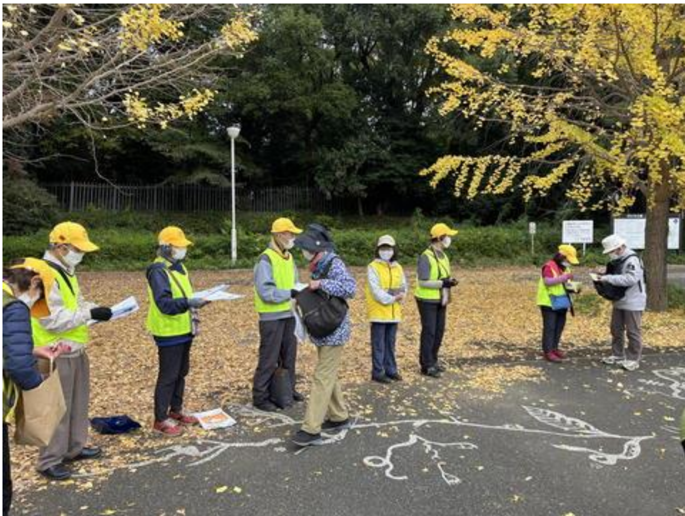
受付風景（代々木公園原宿門）