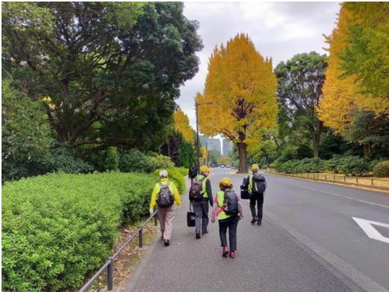
北の丸公園の大銀杏