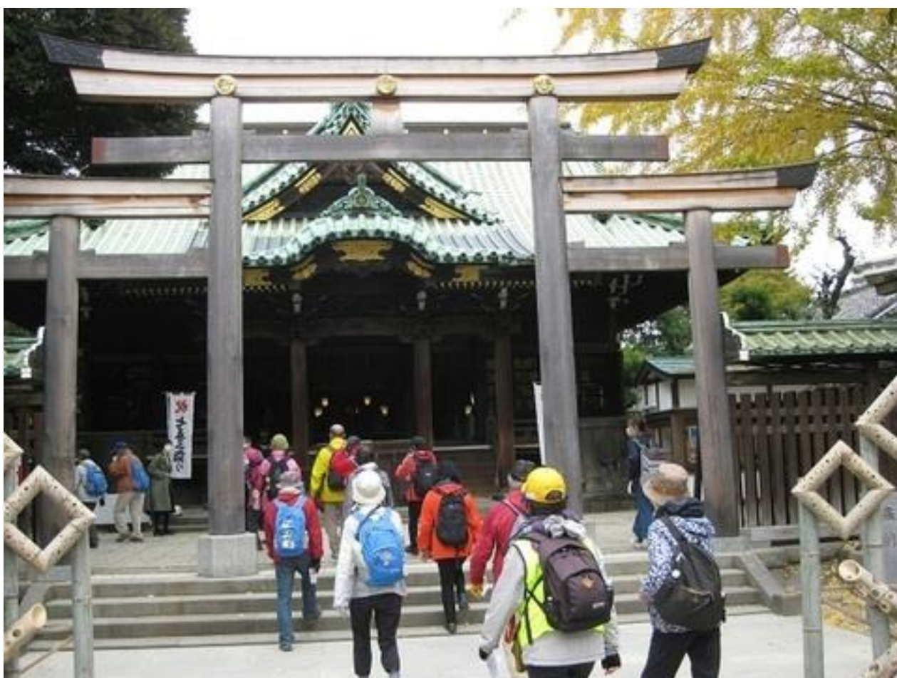
牛嶋神社に参拝をする参加者