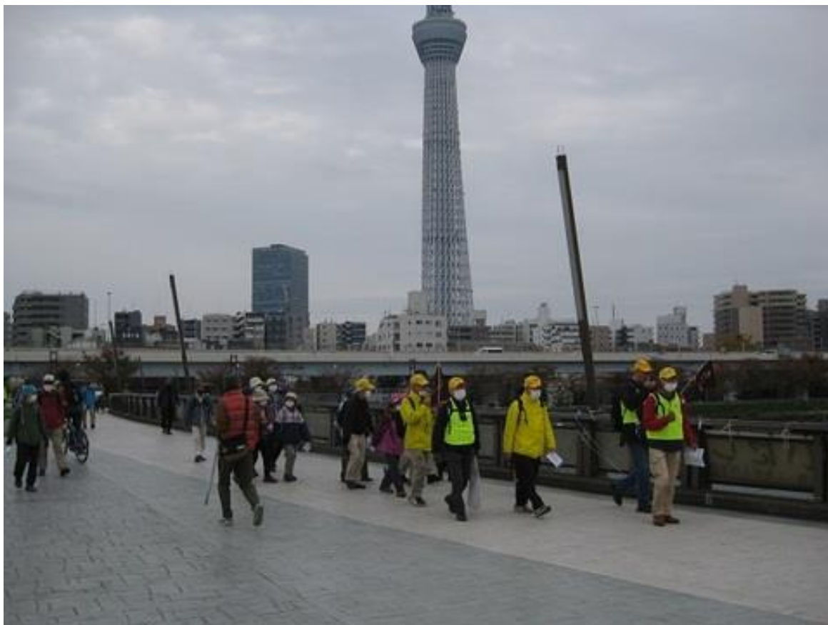
隅田川に架かる「桜橋」を渡り、台東区に入ります