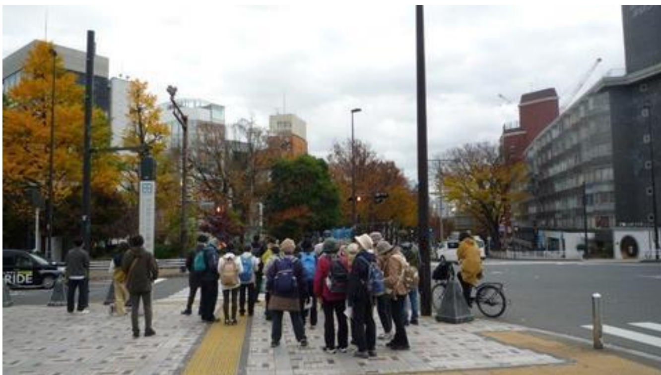
原宿駅前交差点を横断して、表参道銀杏並木を歩きます。