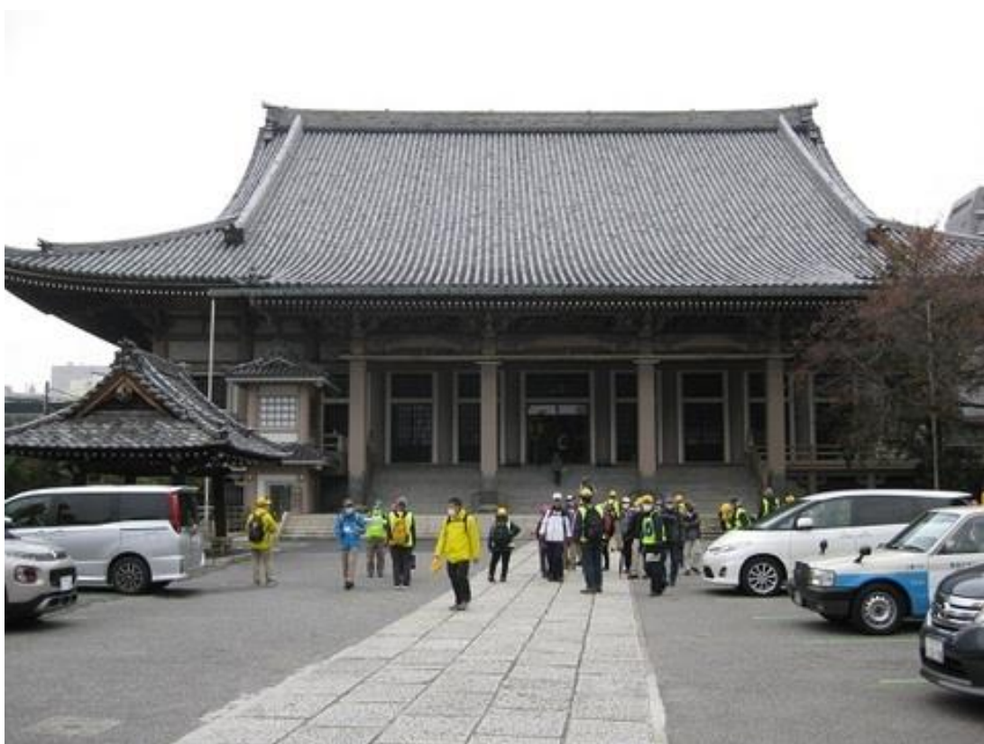
東本願寺本堂を拝観する参加参加者