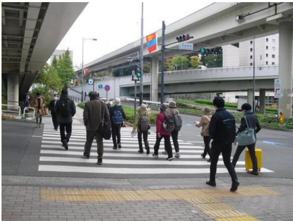
青山通り銀杏並木に向かう参加者。