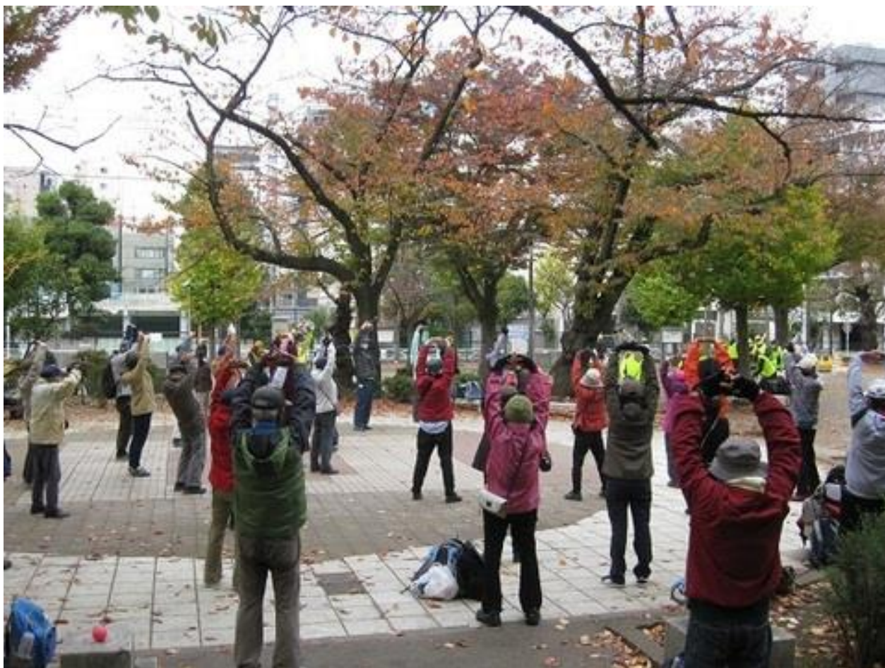
出発式でウォーミングアップストレッチをする参加者