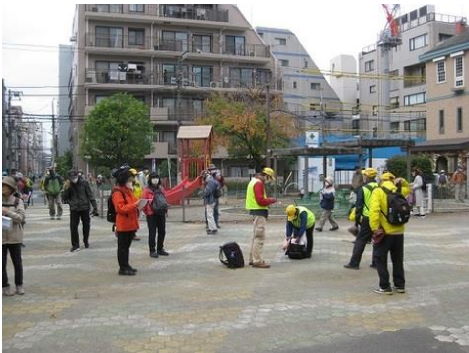
大横川親水公園広場で休憩をしています