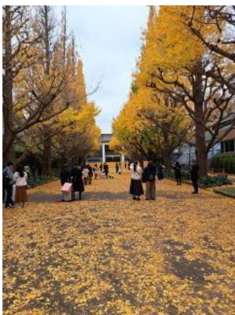
神宮外苑の銀杏並木