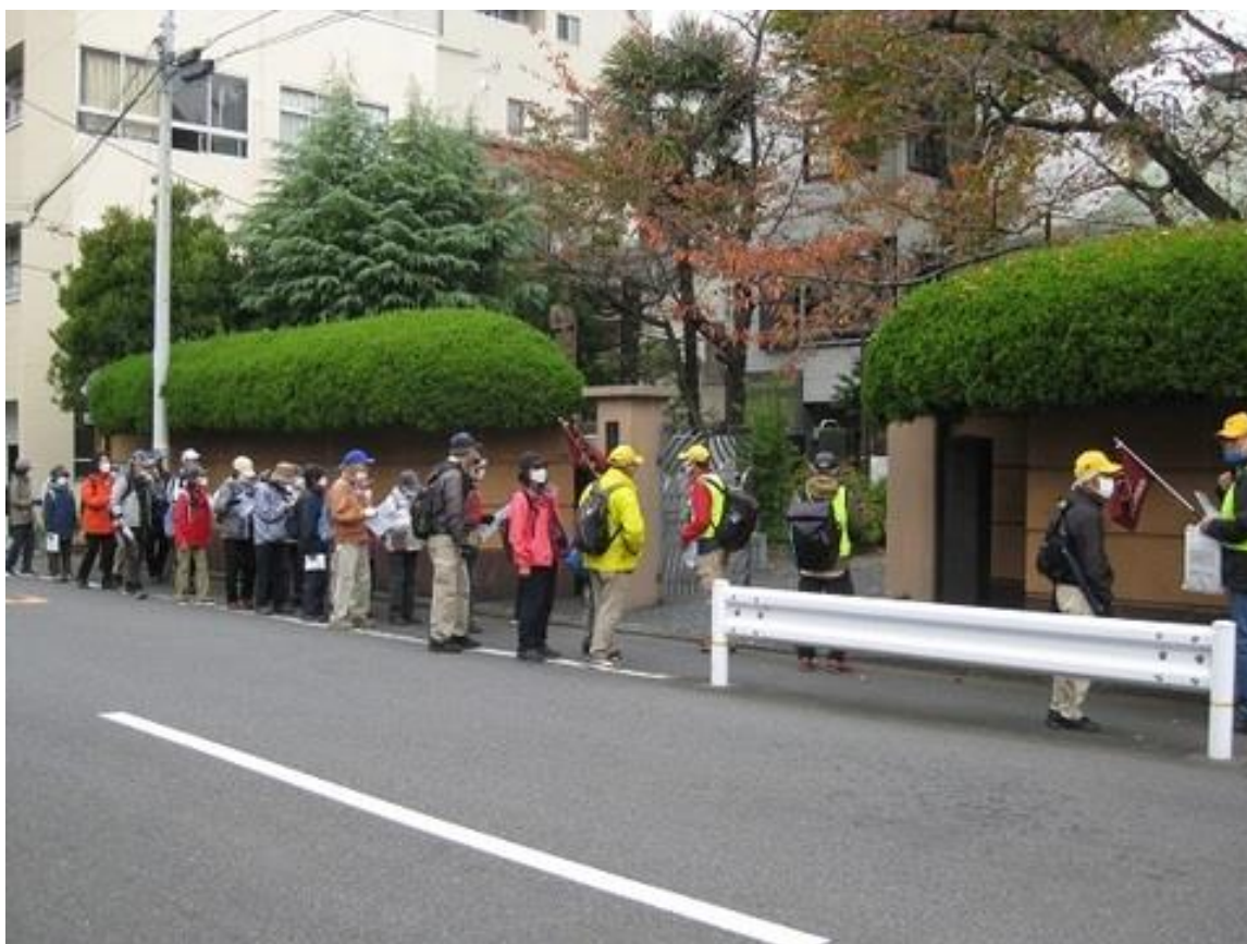
弥勒寺前で列詰めをしている参加者