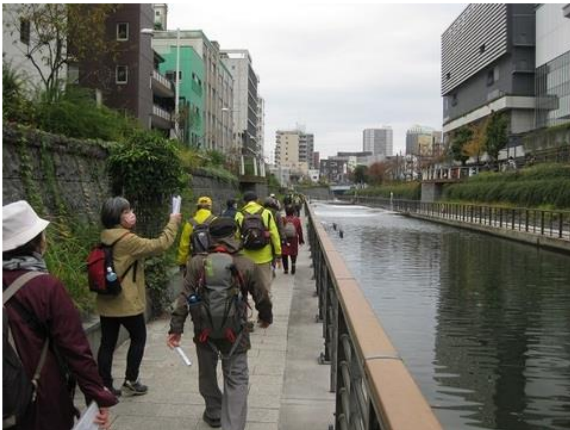
スカイツリー前のテラスを歩いています。直下からスカイツリーを見上げると圧巻でした。