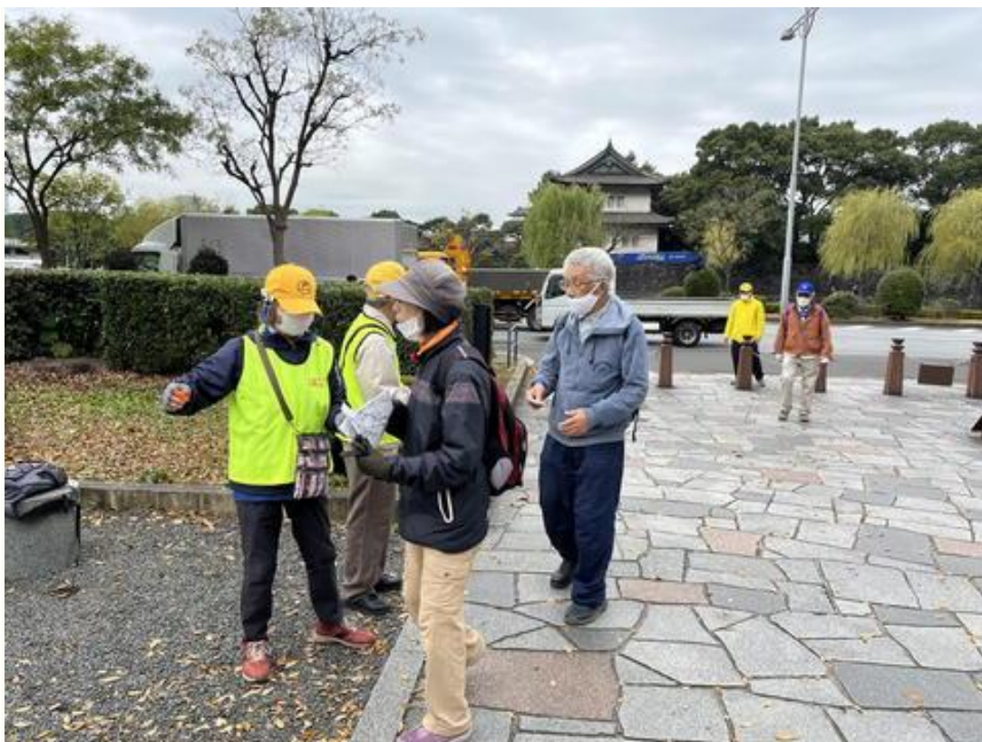
皇居前の和田倉噴水公園にゴールする参加者。IVV と完歩証を受け取っているところです。