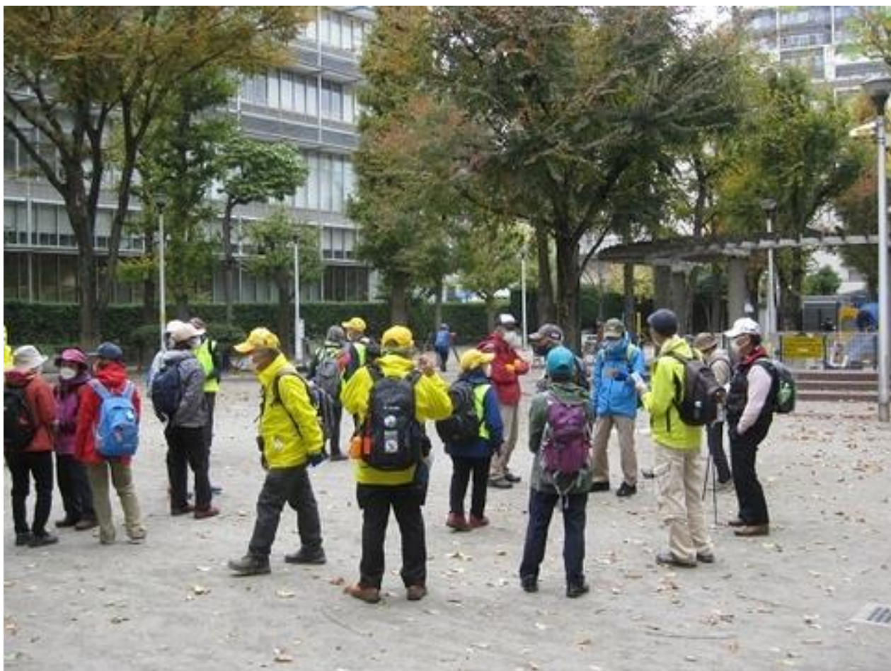
池波正太郎記念館裏の天竜公園で休憩