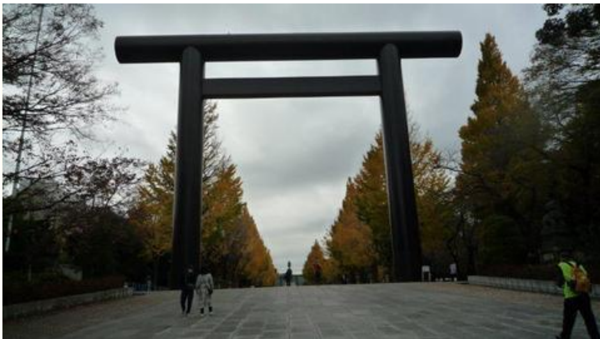
靖国神社の大鳥居