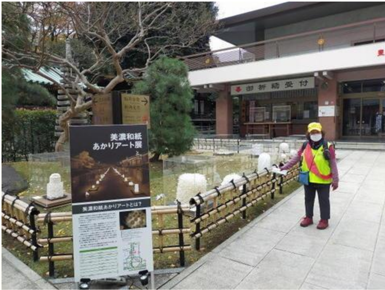
豊川稲荷の和紙のオブジェ