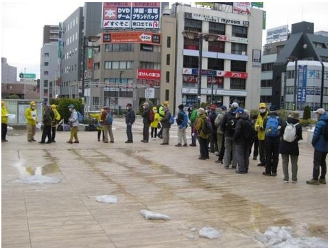
最初は善照寺（布袋尊）、家庭円満を祈願