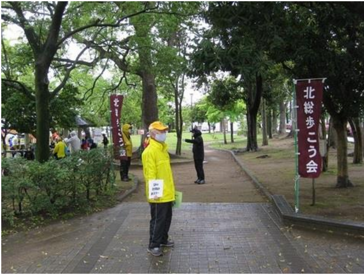
参加者を待つ役員