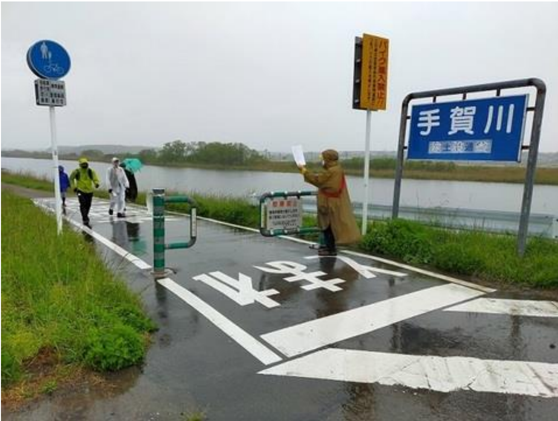
コース途中の 20kmと 30kmの分岐点付近を歩く参加者