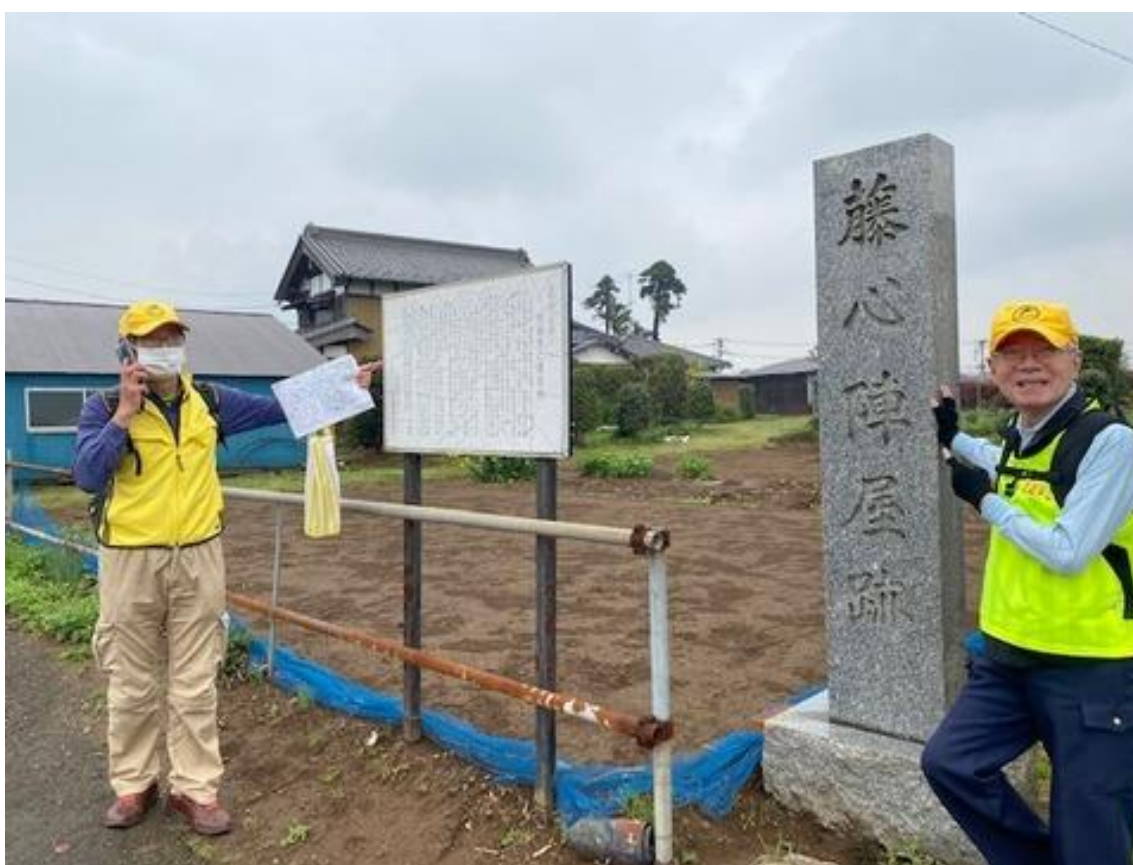
藤心陣屋跡（ふじごころじんやあと）