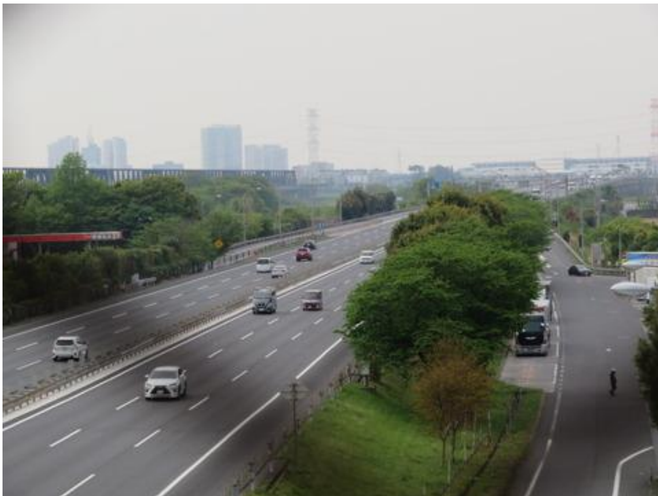
常磐自動車道（守谷 SA 付近）を渡りました。