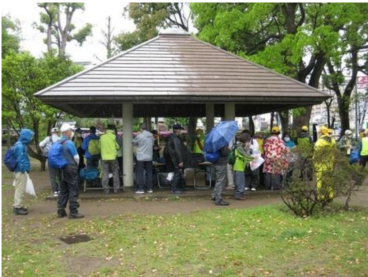
受付終了後、スタート準備をする参加者