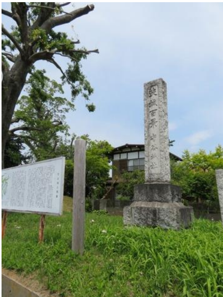
茨城百景 守谷城址