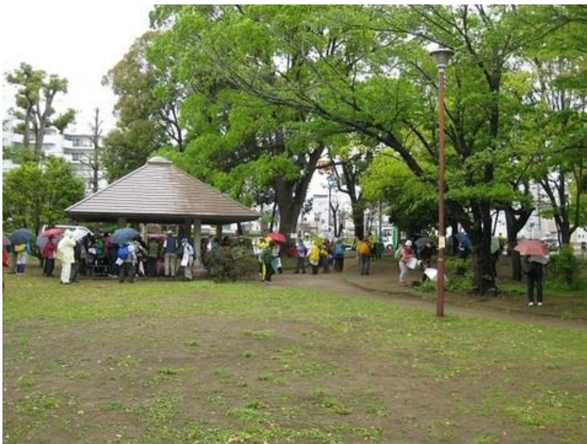
受付を済ませ、スタート準備をする参加者