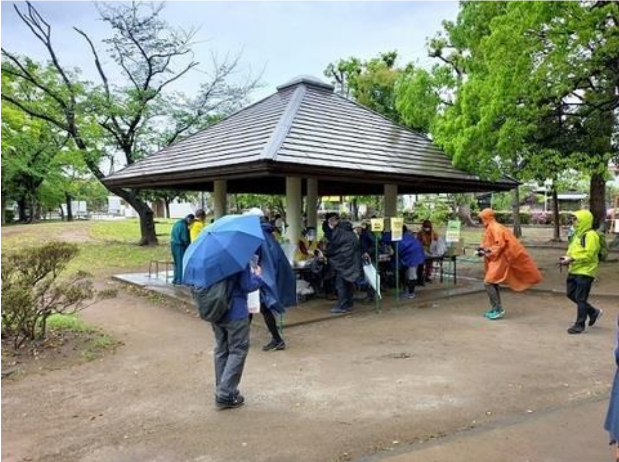
受付に向かう参加者