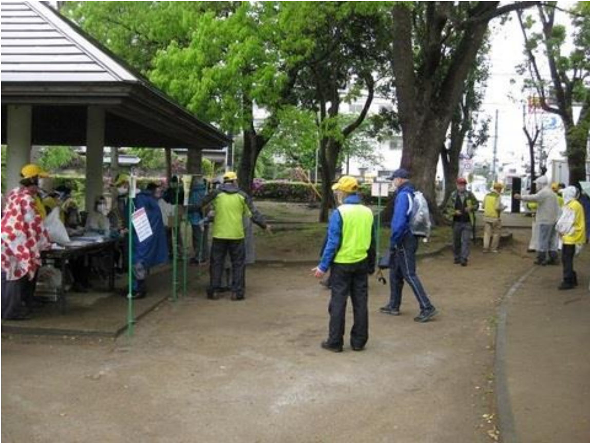
受付をする参加者