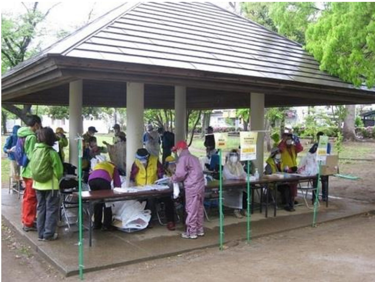
受付をする参加者