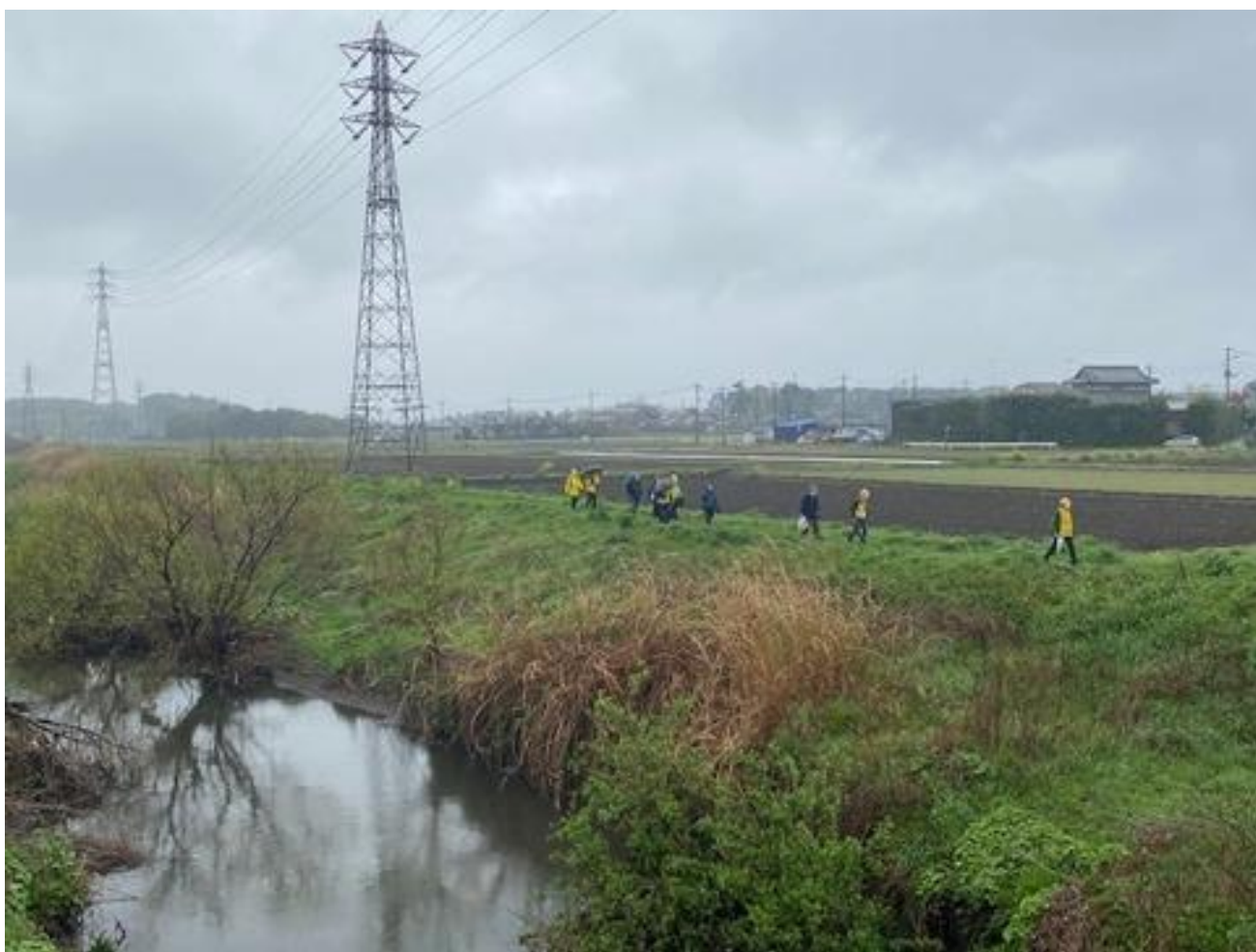
大津川・下橋付近