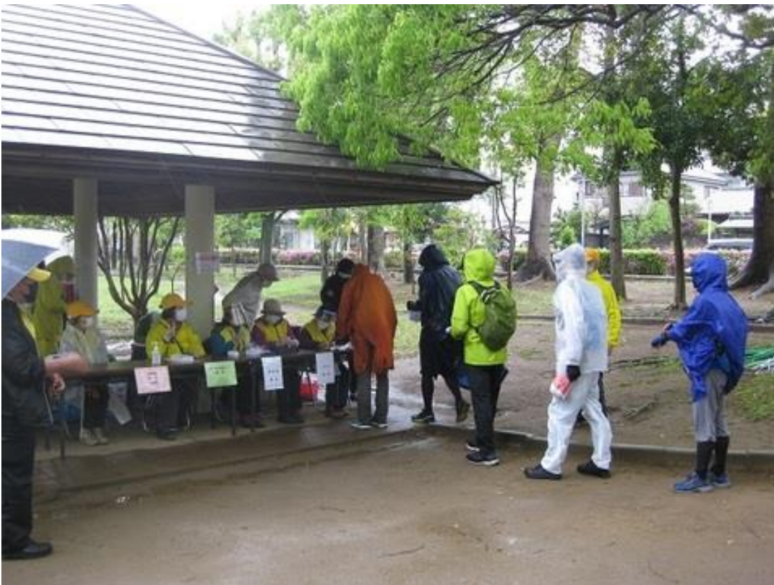
ゴールをした参加者の受付風景

今回は、雨となってしまいましたが「290名」の参加者の皆様、本当に有難うございました。 お疲れさまでした。来年は新型コロナが終息して、安心して歩けるようになることを祈念しております。ぜひ、次回も皆様のご参加をお待ちしております。 悪天候の中、40名のスタッフの皆様のおかげで無事に開催が出来、終了することが出来ました 有難うございました。