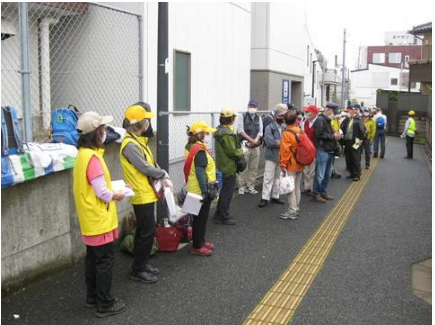
逆井駅前での受付風景。

朝方まで降っていた雨も上がったので、雨はもう降らないだろうと期待して集合場所の逆井駅前には歩友（ほゆう）が大勢集まりました。（ 86名参加 ）でも、残念なことに歩き出してももなく、雲行きは急に悪くなり、雨模様になってしまいました。雲の流れは早く、時々雨は止みましたが、傘等の雨具は、持ったままでのウォーキングになってしまいました。