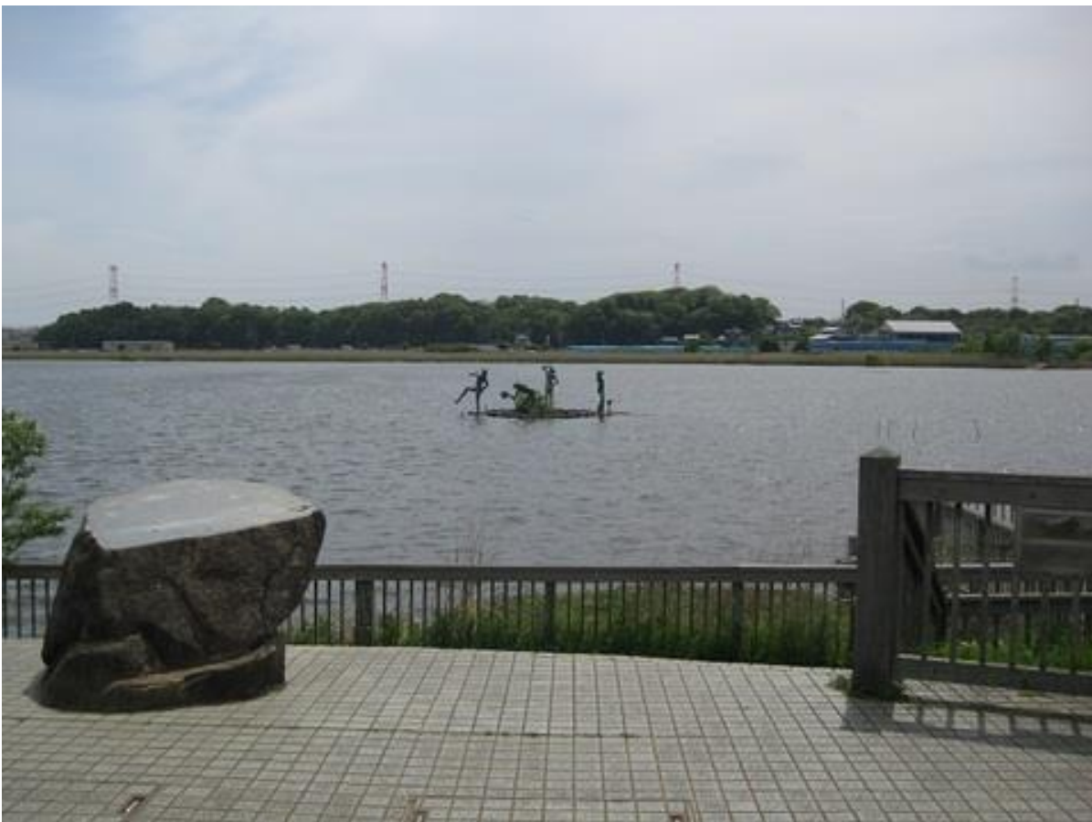
手賀沼の河童像(前日撮影)