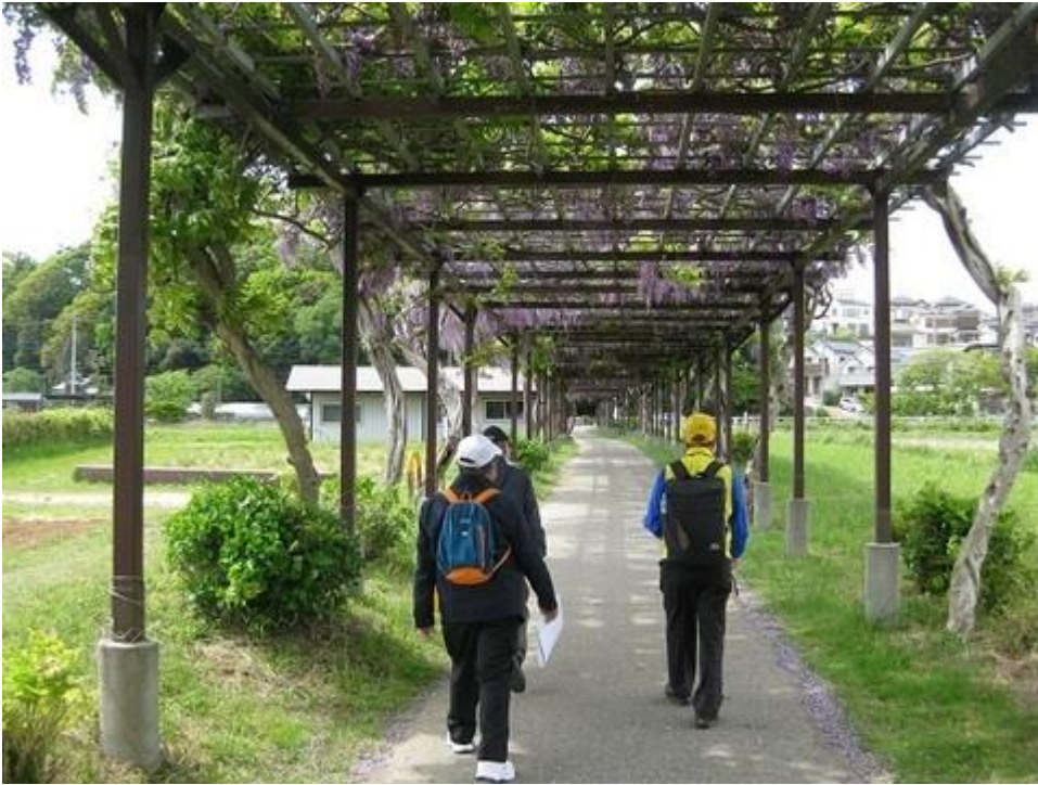
コース途中にある「藤棚」(前日撮影)