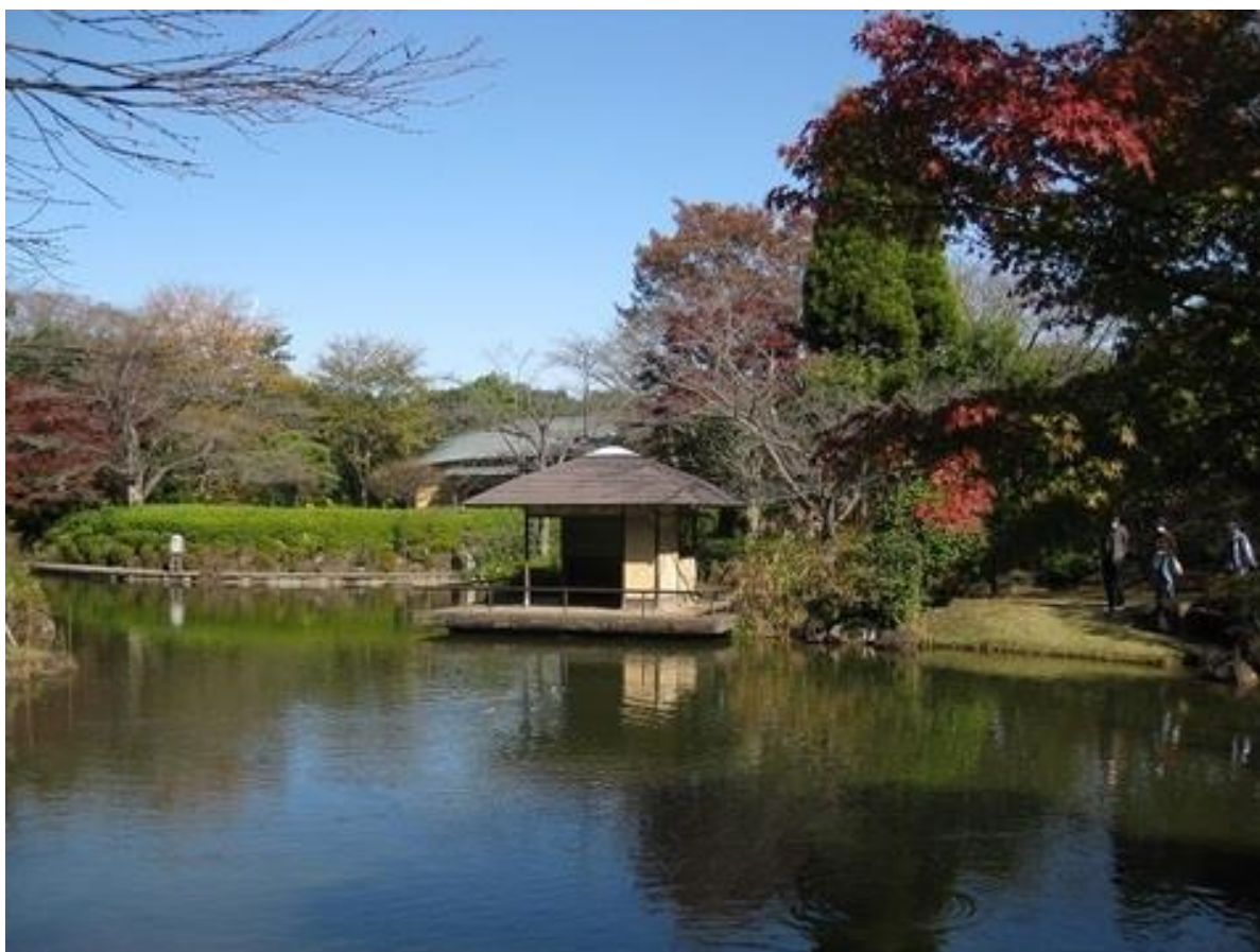
柏の葉公園内の「日本庭園」