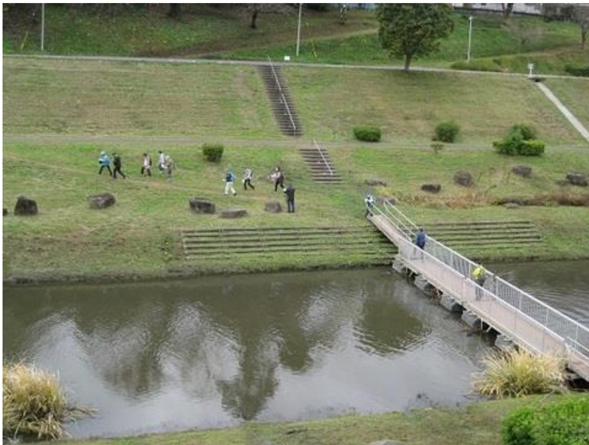
運河の浮き橋を渡し、スタートする参加者