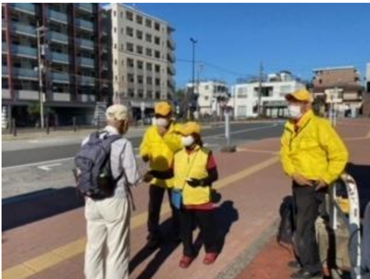
トップウォーカーのゴール風景