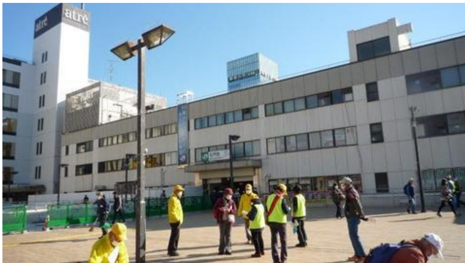
受付風景（受付終了近く）