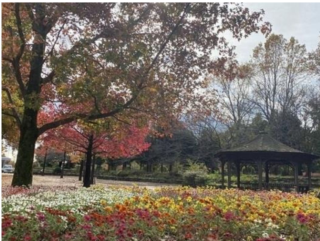
柏の葉公園内の紅葉と花