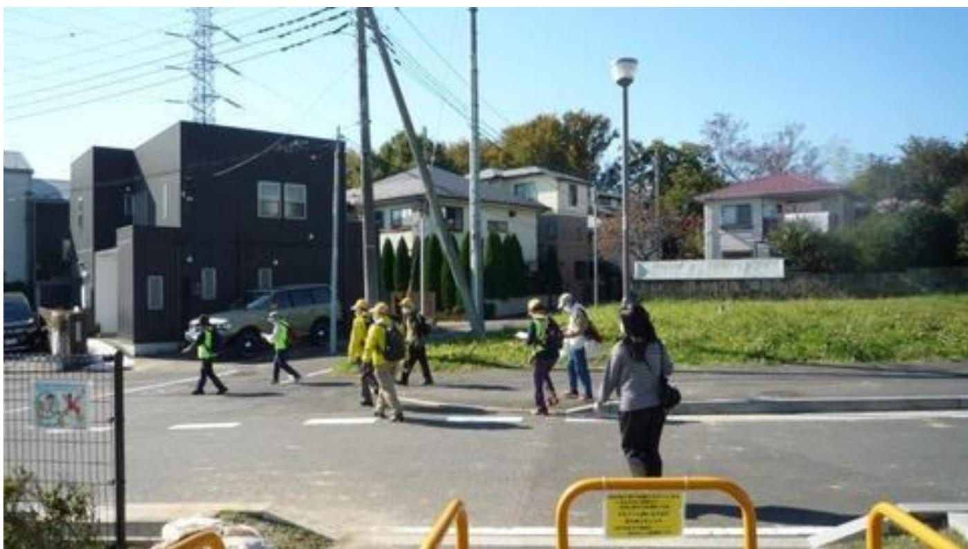
矢切富士見公園を出る参加者とアンカー達。