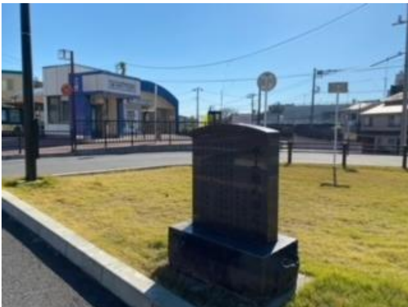
水上勉氏旧居跡（矢切駅前ロータリー）