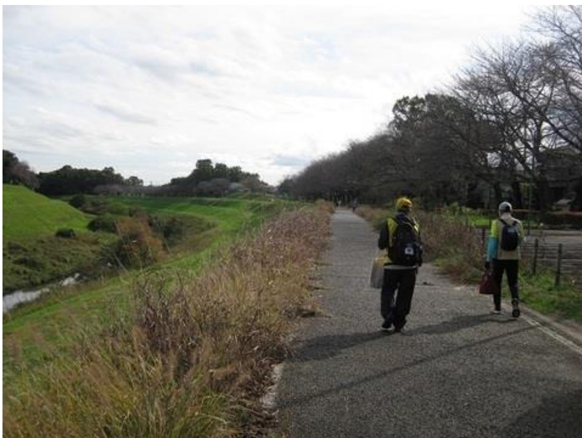
運河遊歩道を歩くアンカー