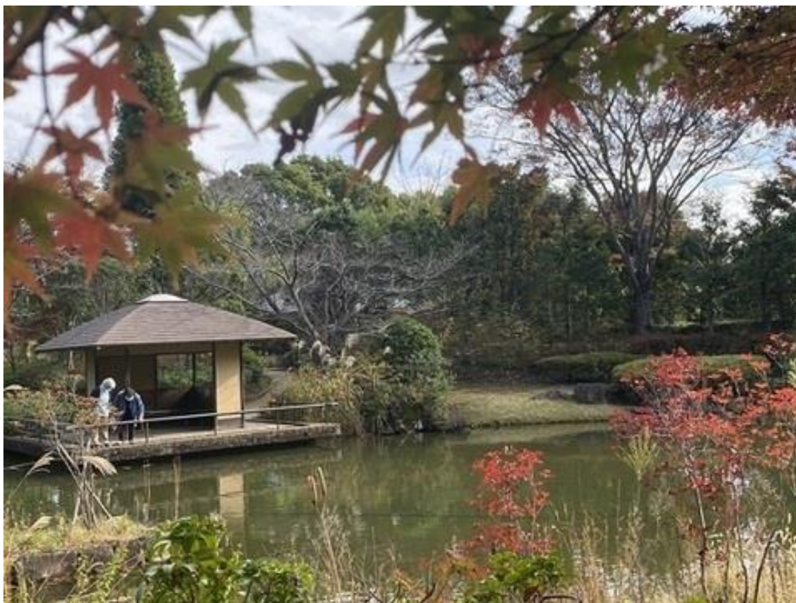
柏の葉公園：日本庭園