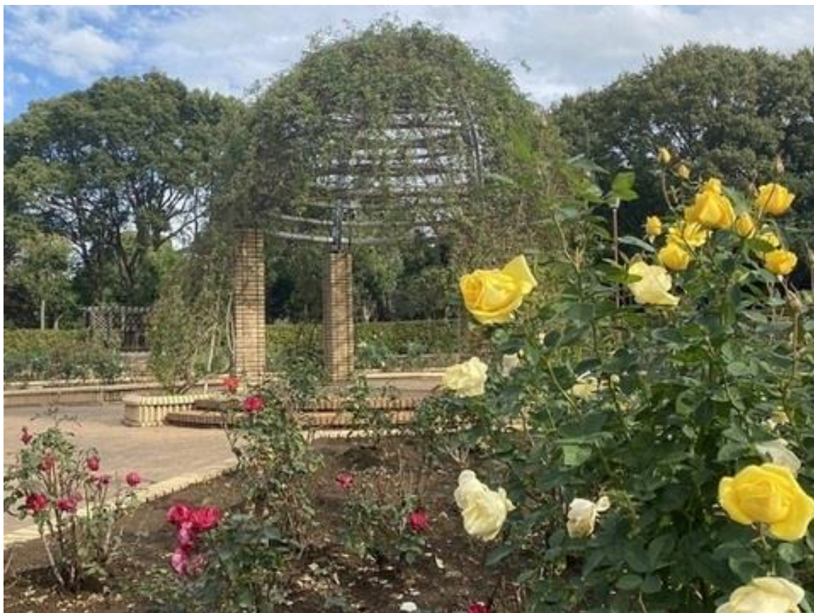
柏の葉公園：バラ園の一部