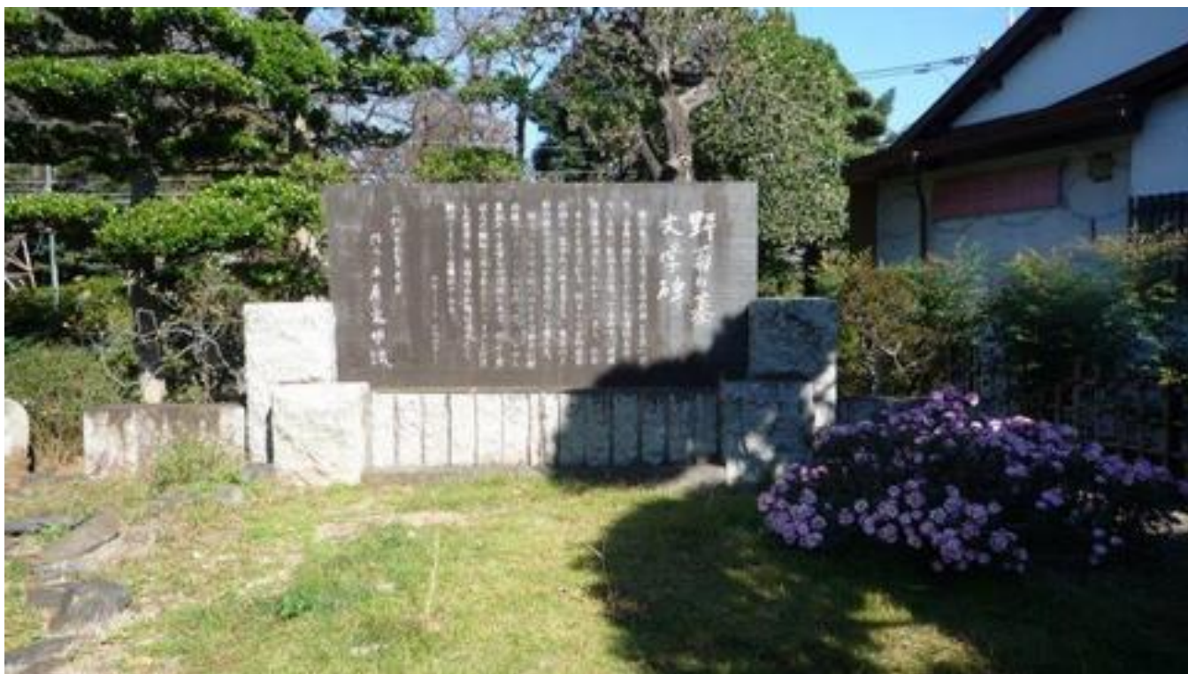
野菊の墓文学碑 (西連寺・野菊苑)

矢喰村庚申塚 (千葉県松戸市下矢切史跡) - グルコミ (rubese.net)