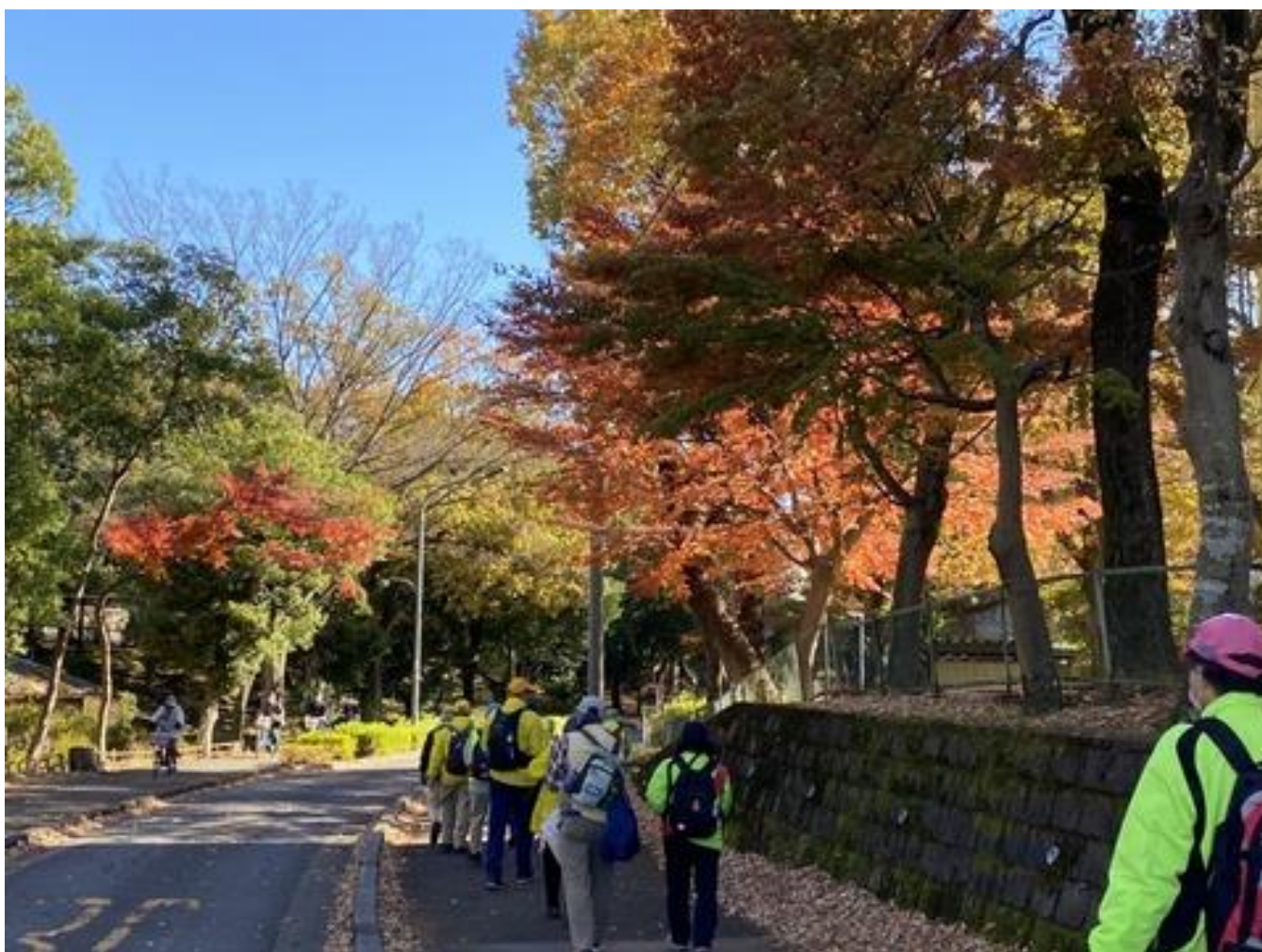
金ヶ作公園 入口では真っ赤なもみじが 公園内は落ち葉の絨毯