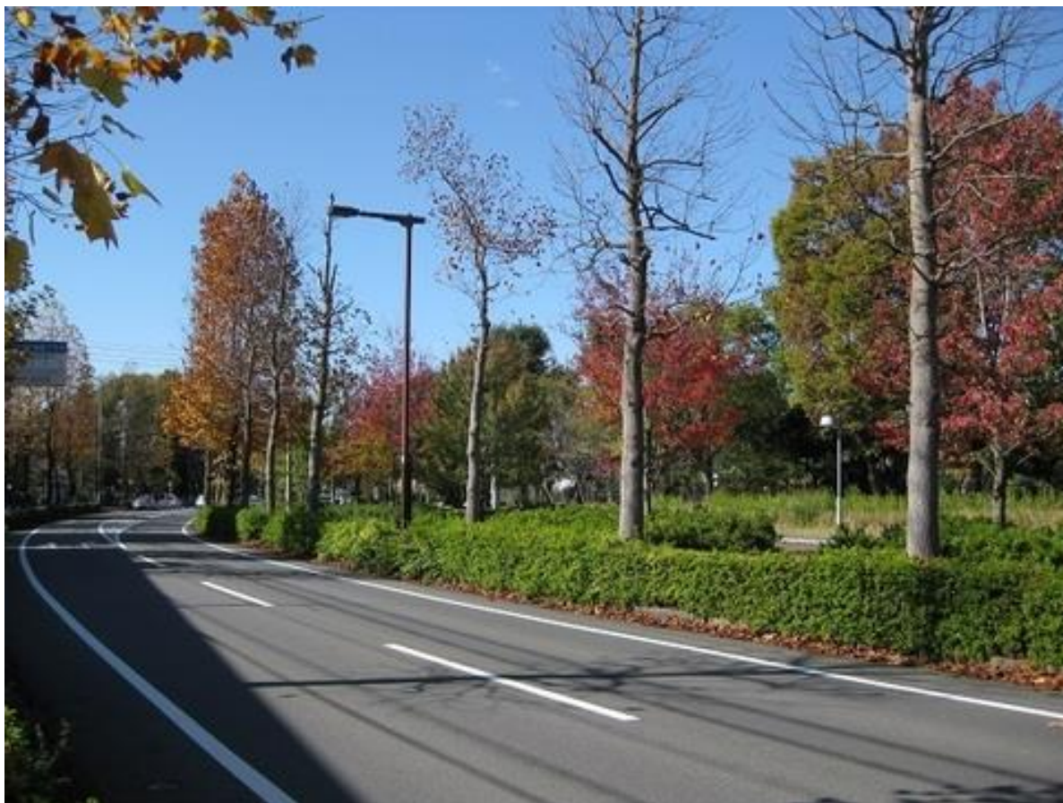
紅葉に染まった東大前の通り