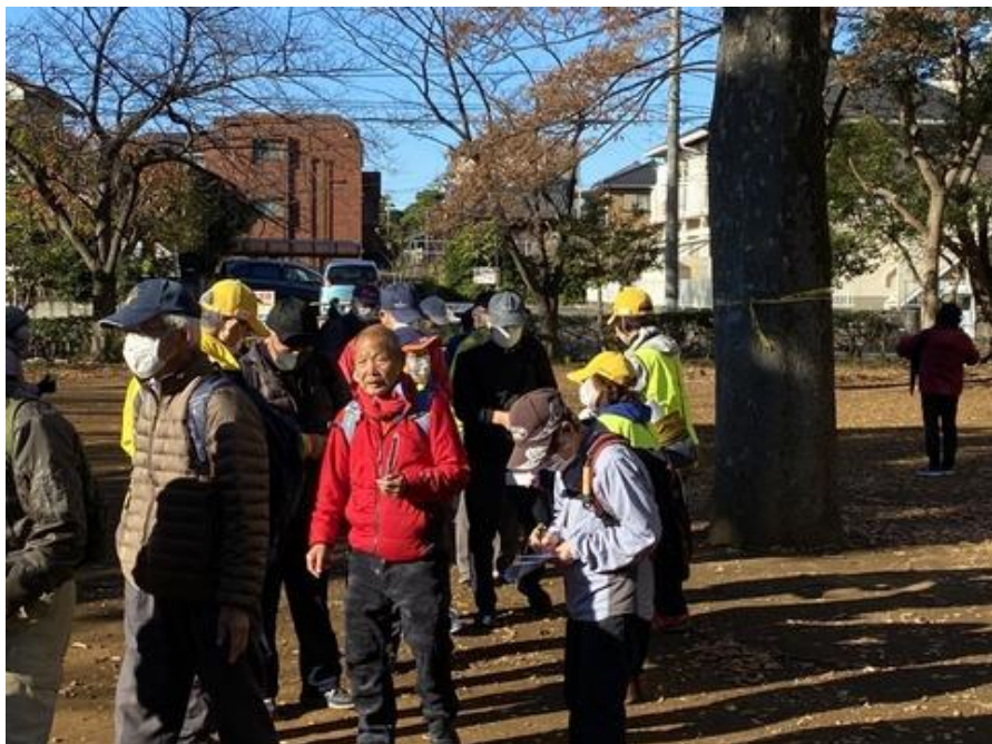
銀杏は色好きアスファルトを埋めています。