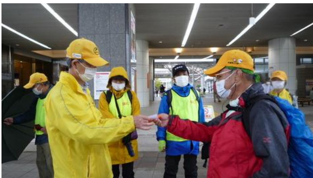
無事に全員が完歩されました。（投稿担当者）青木 茂