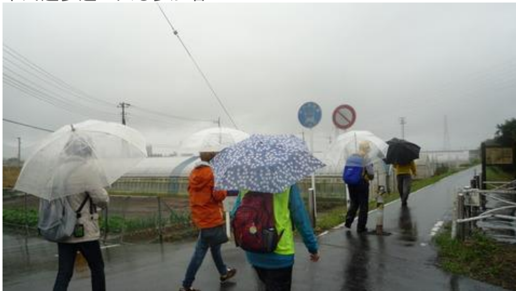
中川遊歩道を進む