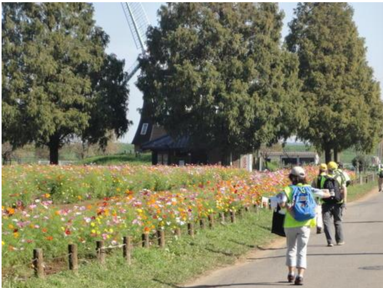
色とりどり綺麗に咲く、あけぼの山農業公園のコスモスを楽しみました。