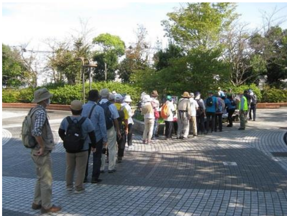
受付風景 (集合場所: 我孫子ふれあい広場)