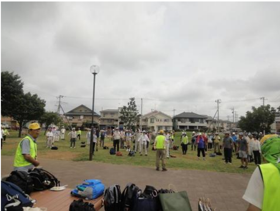
出発前の準備体操風景 (守谷 栄町公園)