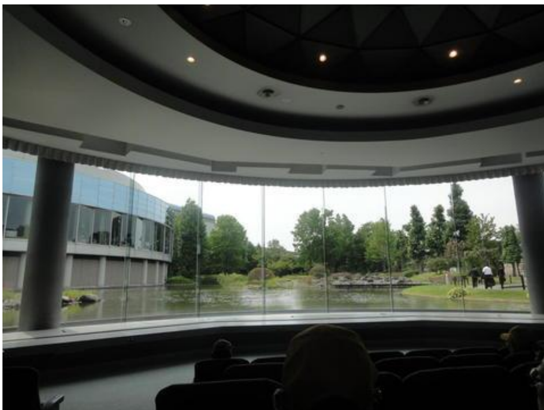
スクリーン会場からのきれいな工場内庭園風景。