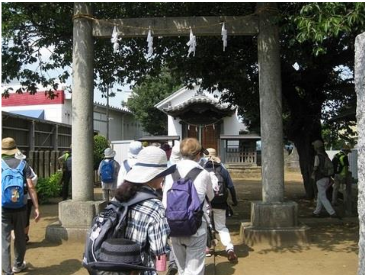
須賀神社・猿田彦神(市指定有形文化財)の見学です。