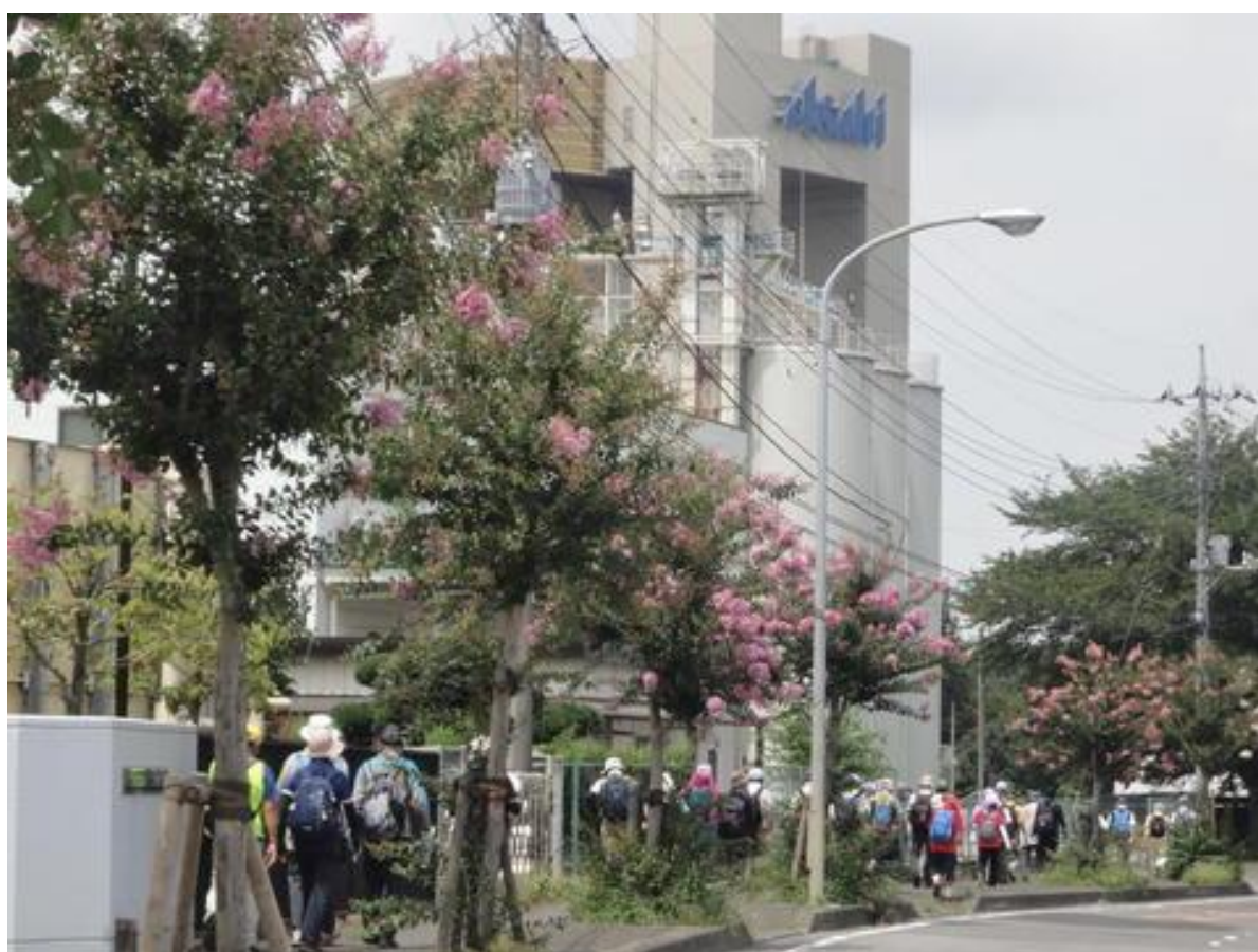
目の前にゴールの「アサヒビール工場AIMタワー」が見えてきました。