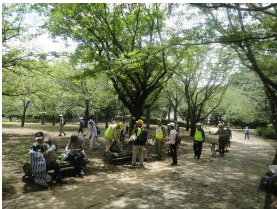
柏の葉公園に到着。昼食休憩をとりました。