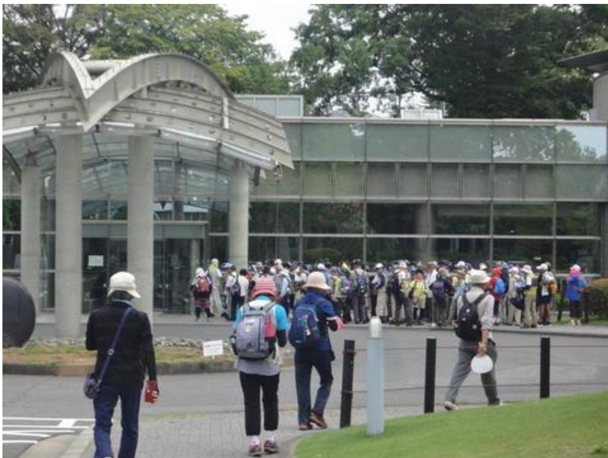
第1グループがゴールに到着したところです。