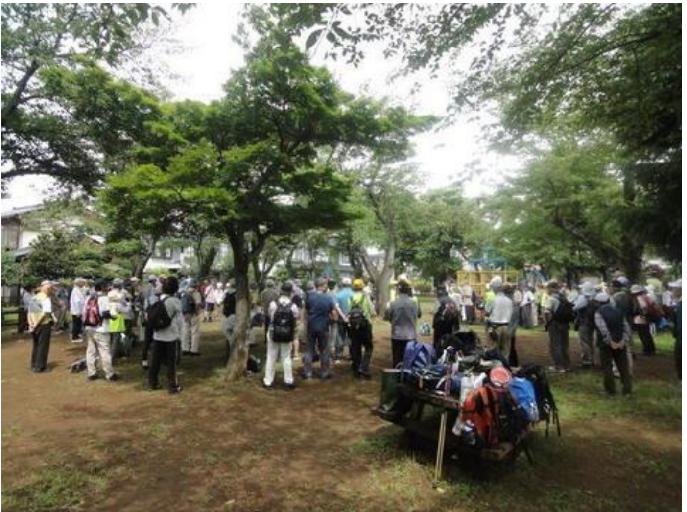
出発式風景(10号公園)

「流山・柏北部から市街地へ」というコーステーマのとおり、前半は「野馬土手跡」「東深井古墳群」「大青田の森」付近を歩き、後半は「東京大学柏キャンパス」「宇宙線研究所」付近を歩きました。ゴールは近代高層ビルが立ち並ぶ地区(柏の葉キャンパス駅近く)でした。