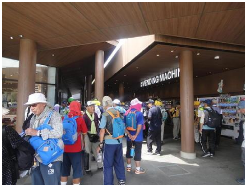
守谷SA出発前風景（第1グループ）です。