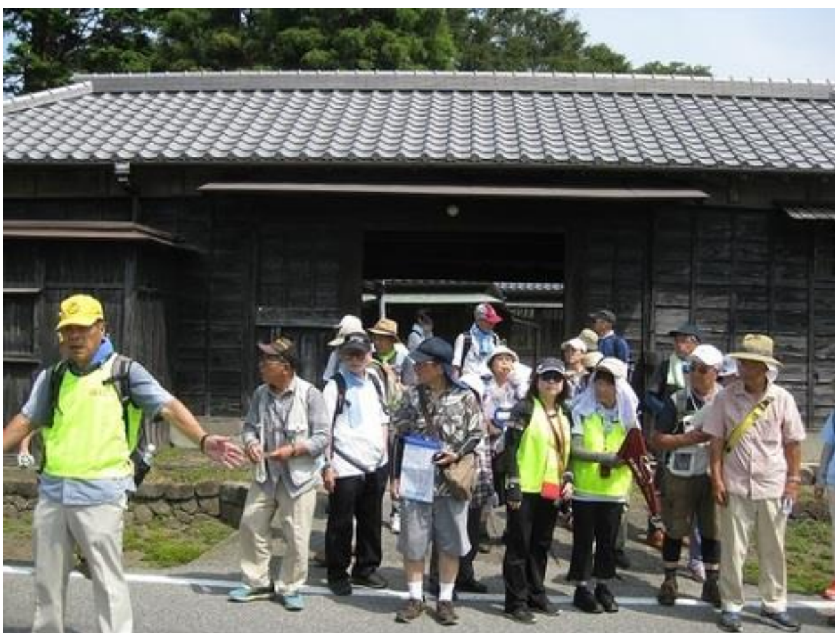
リーダーから給水塔跡の説明を聞いています。