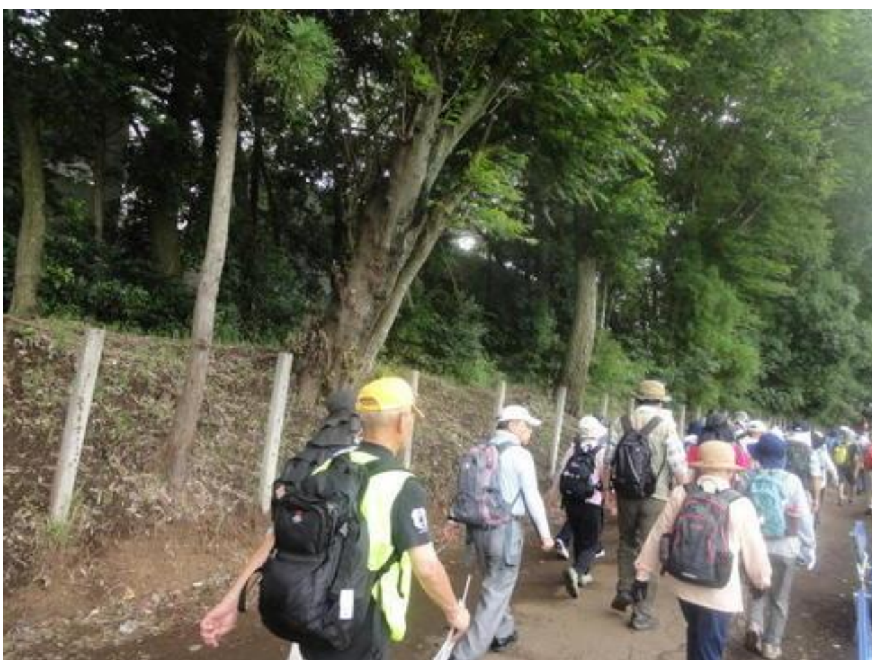
「野馬土手」(流通経済大柏高キャンパス付近)