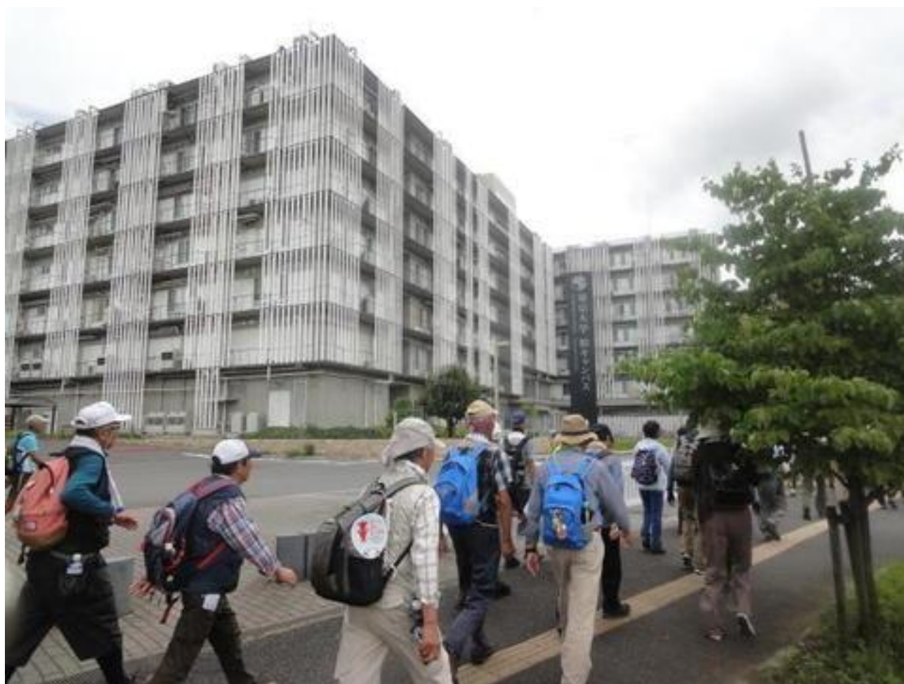
東京大学柏キャンパス前を通り、柏の葉公園に向かいました。