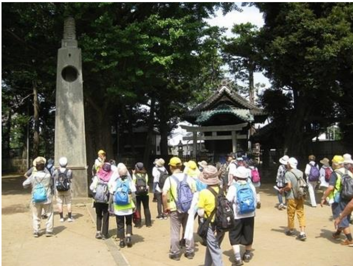
素晴らしい彫刻が有ると言われる神社に参拝、見学をしました。