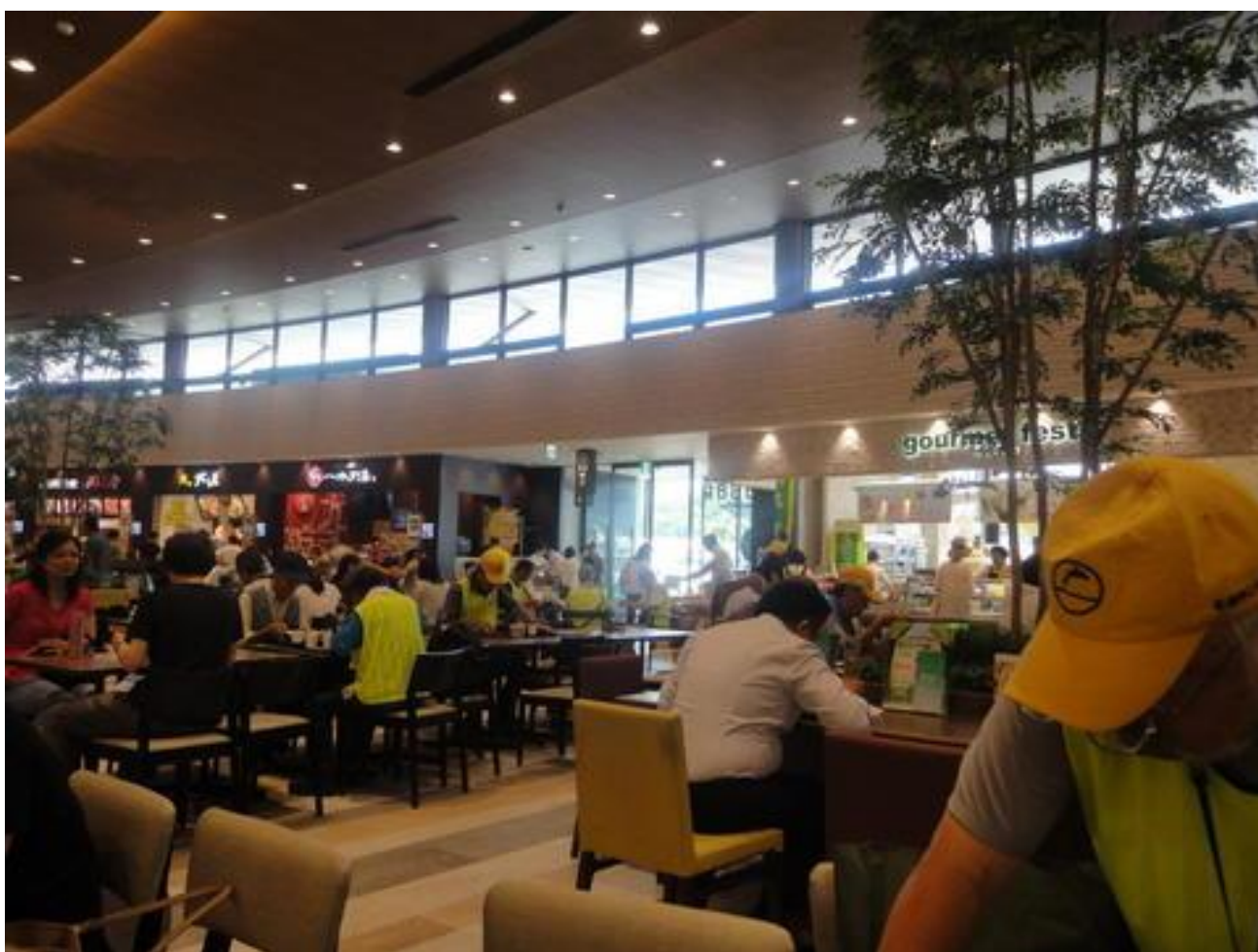
冷房のきいたフードコートで昼食をとりました。