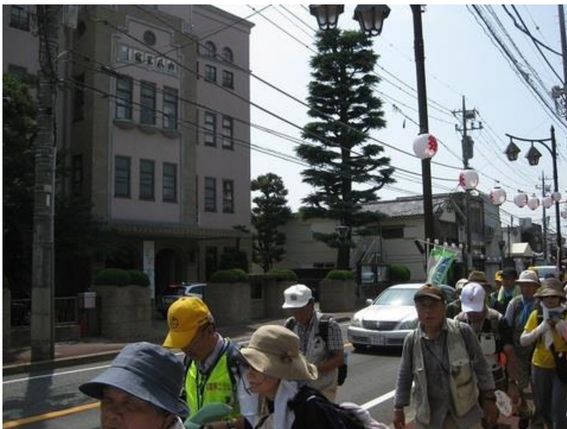
興風会館(国登録文化財)を観ながら、進みます。