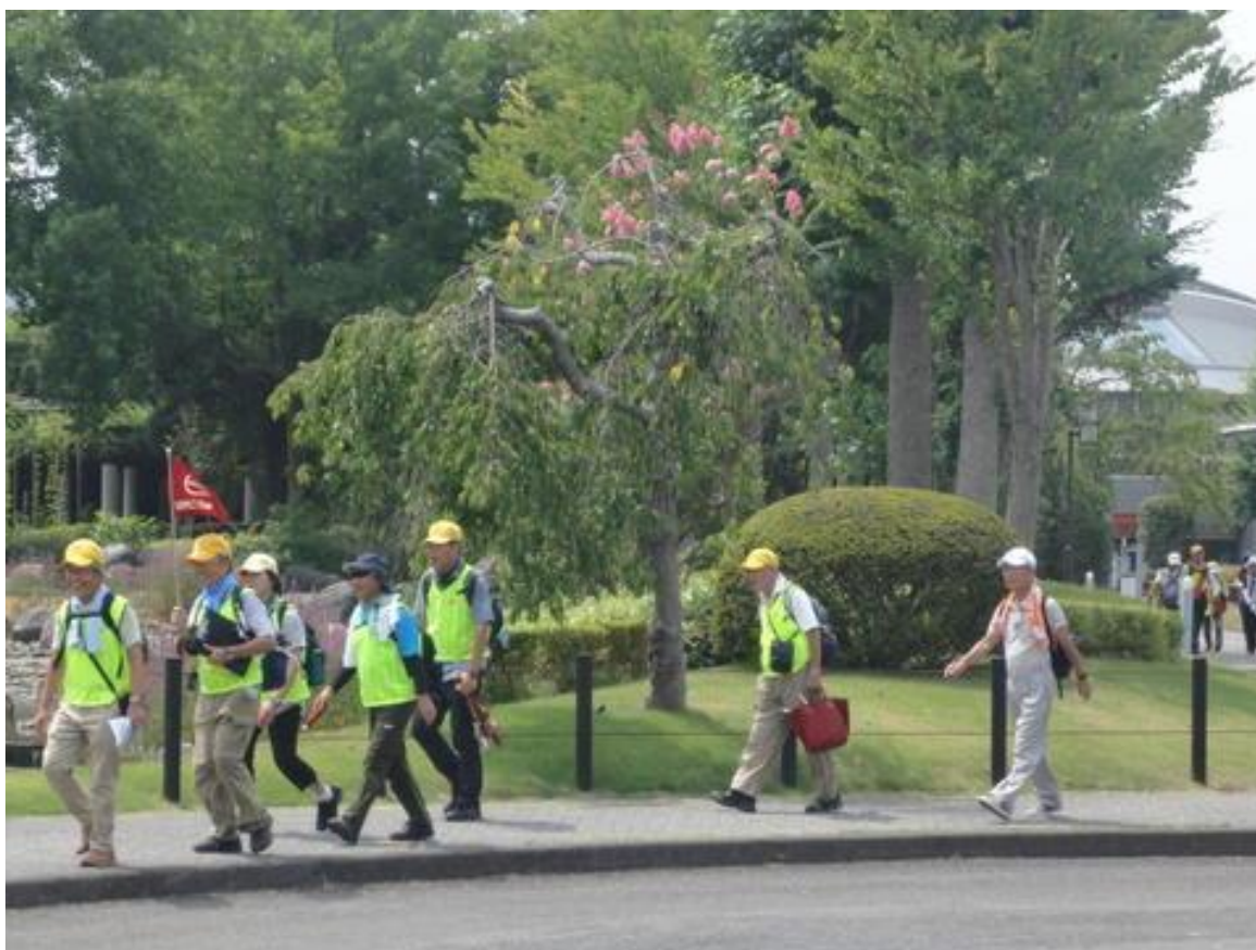
第2グループが到着しました。