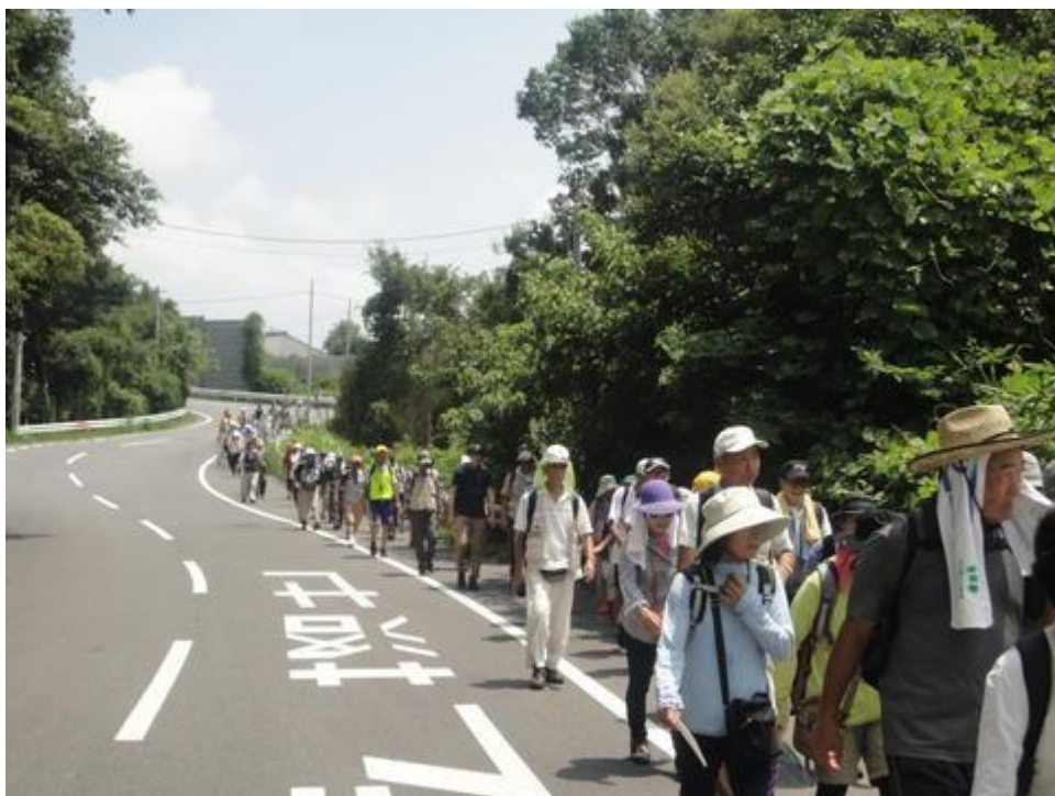
もうすぐ、常磐自動車道の守谷SA下りに到着です。