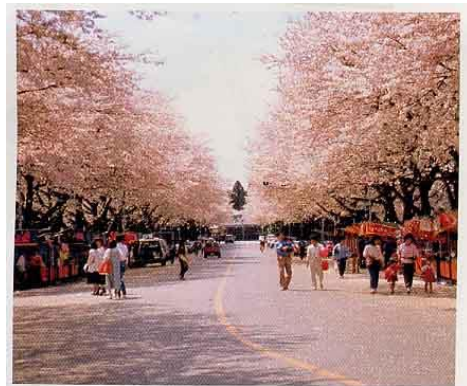
桜の名所、小林牧場