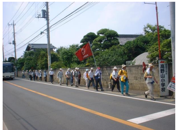
古代の東海道・国道365号を行く