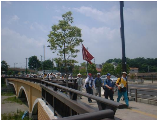
柏ふるさと大橋を渡る

前中は、適当な距離にトイレのある公園や日影がありましたが、午後からは約8キロの間、休憩場所がありませんでした。寒い時期では、歩くのになんでもない距離ですが、暑い時期では休憩・水分を取らないと体調を崩す危険があります。そこで予定には無かったコンビニや神社境内で休憩を取り、予定時間より遅れました。