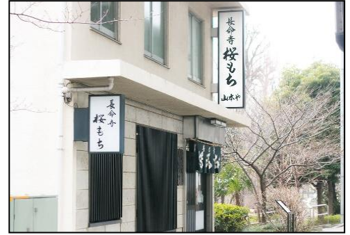
長命寺桜もち 山本や

コース / 東白鬚公園~言問橋(WC)~駒形橋~蔵前橋~両国橋~浜町公園(8kmゴール・昼食)~清洲橋~隅田川大橋~永代橋~新川公園(WC)~中央大橋~佃大橋~はとば公園