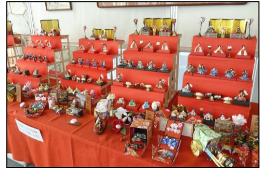
ひなまつり(イメージ)

コース ／10km:東松戸駅～東松戸中央公園～本光寺前 8km:市川大野駅～みかど公園～本光寺前 ～姥山貝塚(WC)～奥の院(IVV・完歩証配布)～ 法華経寺～清華園～京成中山駅～下総中山駅