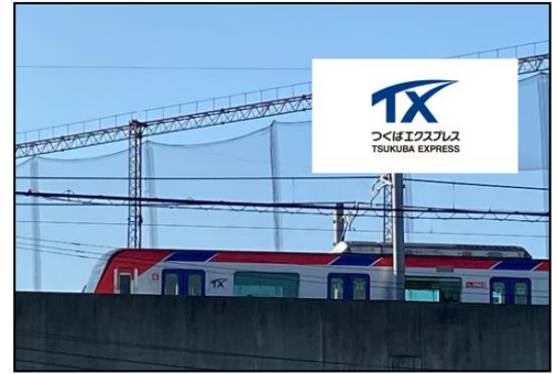
つくばエクスプレス線

○みどころ 14年ほど前(2006年3月)に「つくばエクスプレス線沿線ウォーク」が実施されました。会員の中には当時この行事に参加された方もいらっしゃるかもしれません。記録資料を見ると、コースは南流山駅から柏たなか駅までの16kmでした。141名の方が参加されたようです。今回のコースは、南流山駅から柏の葉キャンパス駅までの10kmです。歩行距離も大幅に短縮しました。時代の変遷を感じますね。