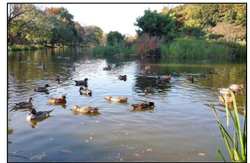
じゅん菜池と冬鳥

○みどころ 3箇所の梅園を含め見所いっぱい。ゆっくり歩こう！最初は松戸神社から戸定が丘歴史公園の梅園。浅間神社から野菊の墓文学碑を経て、じゅん菜池北側梅園、遊歩道を半周し南側梅園。最後は里見公園梅園に寄り、江戸川に出ればゴールはすぐ。