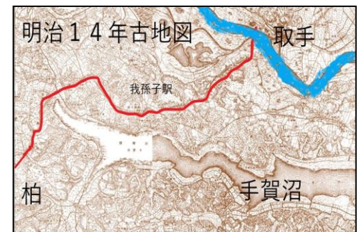
旧水戸街道(明治14年古地図)

○みどころ ㊤自由歩行なので受付時間9時30分～10時受付後順次スタートとなります。早くお見えになっても受付はできません。旧水戸街道沿いには沢山の神社仏閣があります。それを見学しながら昔の旅人になってゆっくり歩いてください。