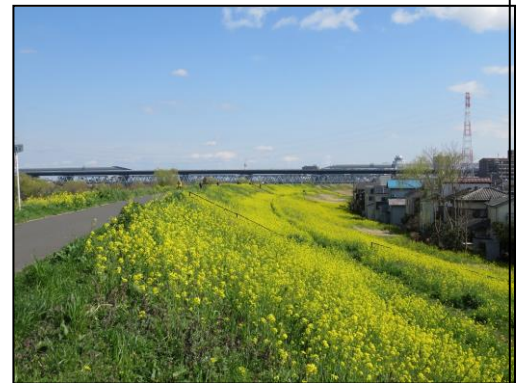
江戸川土手の菜の花

○みどころ 春風に乗って自然豊かな運河と江戸川堤をウオーキングし、土手いっぱい咲き誇る菜の花の香りをかぎながら春を満喫しましょう。