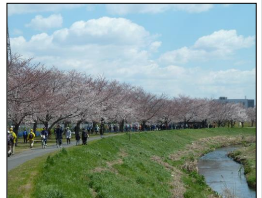
大堀川リバーサイドパークの桜並木

○みどころ 今や桜の名所となった大堀川リバーサイドパークの桜並木。満開の桜をゆっくりたっぷり観賞、楽しんでください。