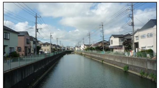
竹の橋から見る坂川

〇みどころ けやき通りを直進し、坂川左岸を進み親水プロムナードを歩きます。馬橋旭大橋を過ぎ、香取稻荷神社に立ち寄り、坂川を松栄橋で左折します。小僧弁天脇を通り、古ヶ崎五差路を左折し、直進するとゴールはすぐです。