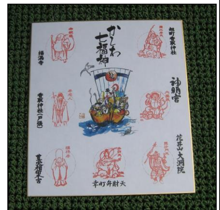
かしわ七福神 御朱印台紙

○みどころ 柏市に2018年念願の「かしわ七福神」が誕生しました。今回は柏駅を中心に4か所の七福神をご案内いたします。御朱印を押す台紙は「豊受稲荷本宮」「神明社」「大洞院」の3か所で販売しています。御朱印は通年可能ですので今回ご案内出来なかった3か所も時間の有る時に参拝して御朱印を頂けます。なお、幸町弁財天と戸張香取神社は御朱印を置いていないので台紙を購入した所で押印を受けます。コロナの収束とご自身の健康を祈願しましょう。