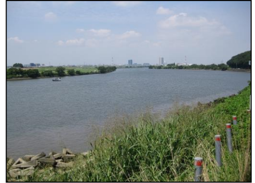
国府台付近から江戸川上流を望む

○みどころ おなじみの江戸川堤防を自由歩行で歩きます。松戸から左岸を8kmコースは国府台まで、15kmコースは国府台から同じコースを松戸まで戻ります。晩秋の江戸川の風景をお楽しみください。