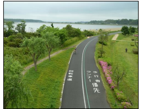
手賀大橋からふれあい緑道・東側を望む

○みどころ 手賀沼公園をスタートし手賀大橋を渡り東側を一周します。全コース平坦なふれあい緑道を歩きますので風光 明媚で自然いっぱいの手賀沼をのんびり楽しんでください。 ハスの群生地(広さ約23.6ha・70,800坪)は時期が過ぎていますが、今年は葉の一枚・花一輪も咲かず全滅状態でした。