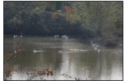
まだ少ないが飛来した白鳥(12/5撮影)

○みどころ 去年は、成田線小林駅から白鳥を見に行きましたが、今年新鎌ヶ谷から西白井を目指します。極力交通費を抑えるため少し距離が長くなってしまいました。沢山の白鳥が飛来して欲しいものです。極寒真っ盛りですので防寒対策をお願いいたします。足に自信のない方は途中の西白井駅から電車・バスも利用できます。(ご案内します。)