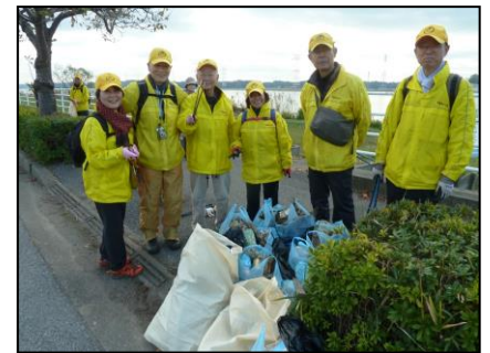
ごみ拾いの成果を前に記念撮影

【編集後記】明けましておめでとうございます。本年もよろしくお願ひいたします。良い初歩きができましたでしょうか。会報の編集を引き継ぎ一年が過ぎました。今後も色々なご意見、感想、情報などお寄せください。〈歩友人〉