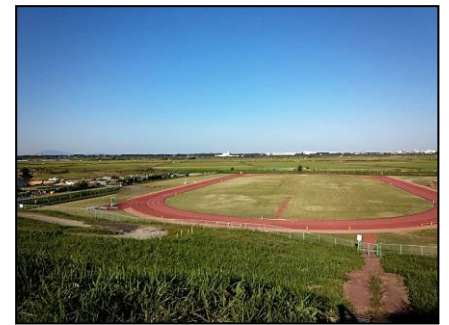
利根川堤防から中央学院大グラウンドを望む

○みどころ 2017年に好評だった我孫子の裏道を再度歩きます。総会ウォークなので皆様が楽しめるコースを選定しました。