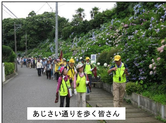
あじさい通りを歩く皆さん

最初の休憩場所の東部公民館前の「東部あじさい苑」では休憩を長めにとり、皆さんにあじさい園の小径を散策して頂くことが出来ました。その後、「あじさい通り」の紫陽花をゆっくりと歩きながら鑑賞して進み、その次に「江戸川八十八ヶ所の大師様」が並んでいる宝蔵院は法事を行っていたので静かに見学をしました。富士川から坂川の遊歩道を歩き、順調に流山総合運動公園に着いて、早めの昼食を摂り、ウオ読を行いました。午後からは市街地の平坦な歩道を歩いて、本土寺に到着し、山門付近の紫陽花を観ていただき、近くの東平賀公園で解散となりました。天候にも恵まれ、沢山の参加者の皆さんに喜んでいただくことが出来ましたこと、参加者の皆様、的確に誘導をして下さった役員・協力員の皆様有難うございました。