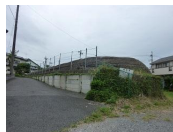
写真は「秋水」燃料庫

○みどころ 太平洋戦争時、柏は飛行場を始め陸軍の諸部隊や軍需工場が進出する町になりました。当時の戦争遺跡を見乍ら平和な時代の柏を歩きたいと思います。