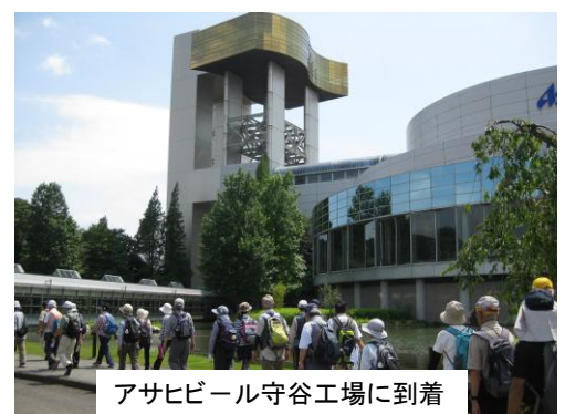
アサヒビール守谷工場に到着

今回のコースは、平成21年以降ビール工場ウオークでは、守谷城址・野鳥の森方面には行っていなかつ