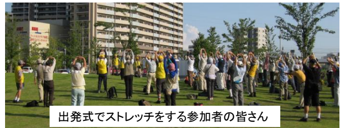
出発式でストレッチをする参加者の皆さん

8月6日(土)午後4時、気温35度、熱中症指数計は「厳重警戒レベル」を指しピーピーと警告音の鳴る中121名のウォーカーが集り出発式が開始された。出発式終了後流れ落ちる汗を拭きながらウォーキングスタート。柴又帝釈天で最初の休憩をとる頃には気温が28度まで下がり、江戸川の土手を歩くころには江戸川の涼しい風を全身に受けながらウォーキングすることができた。市川橋に近づくにつれ花火見物客が増え団体では歩きづらくなり、市川橋を渡り一次解散場所のさくら堤公園に着くころには花火見物客とウォーカーの区別がつかなくなるほど混雑してきた。18時30分全員元気にさくら堤公園に到着。IVVと完歩賞をお渡しした後自由歩行に替わり混雑する中ゴールめざして歩き18時55分ゴールに到着し解散となった。