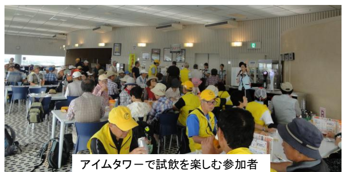
アイムタワーで試飲を楽しむ参加者