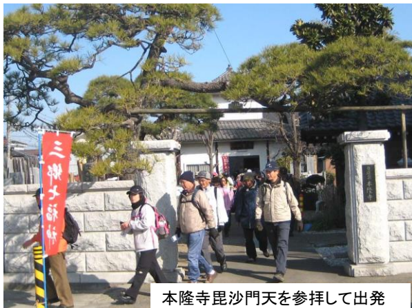
本隆寺毘沙門天を参拝して出発

それから9月中に2回、自分の足で歩いて確認したがどうしても距離を15km以内に納めるコースが出来なくて悩んでいた。10月になって2回、コース担当メンバーと合同で歩きながら「距離が17kmを縮められないなら、短コースを考えよう」と言うことになり探した結果、松戸駅に出られる便利なバス路線があることを発見した。これで長短2コースを確定し、平成24年1月4日に最終下見となった。西福寺の布袋尊と香岩寺の寿老人以外は寺院内に保管されているので松の内(7日まで)以外は参拝出来ないからである。この日は最初の寺である大雄寺の住職にもお会い出来て「当日には特別に大黒天の仏像を参拝出来るように出しておきます」と申された。