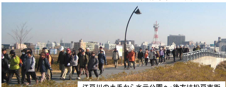
江戸川の土手から水元公園へ・後方は松戸市街

さて当日は無風の晴天に恵まれ173名(役員19名)の方にご参加頂いた。短コースでやめてバスで帰られた方は約50名で、多くの方が長いコースを無事に完歩されたのは、参加者と役員の協力の賜物と感謝している。