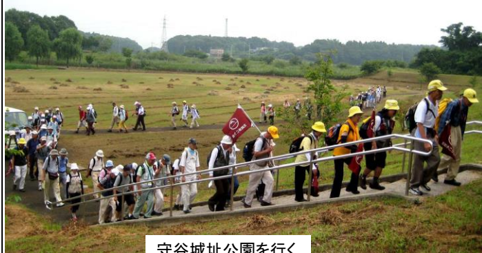
守谷城址公園を行く