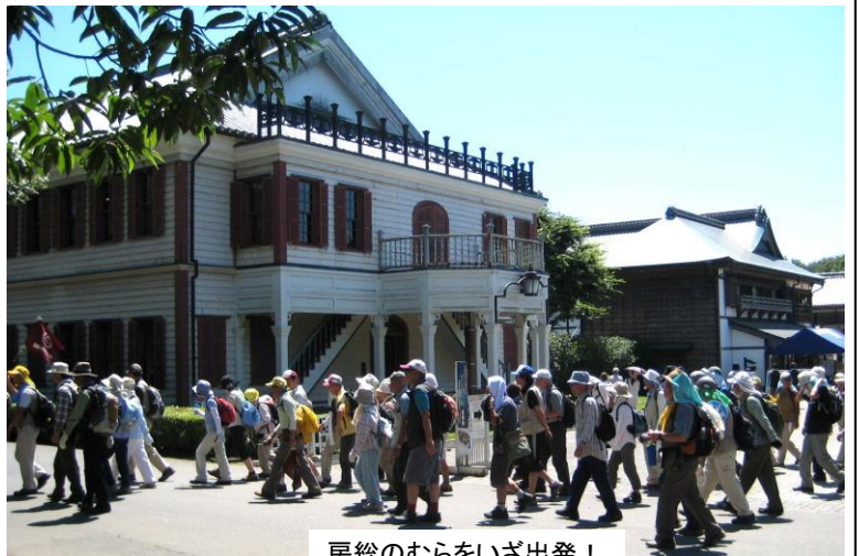
房総のむらをいざ出発!

さて、まさか当日がこんなに暑くなるろうとは想定外の予定外となり、熱中症の心配をしなければと思いながら、ゆっくりと歩くことを念頭に歩行しました。昼食時間と房総のむらをドッキングし、約 1 時間としたことは良しと思