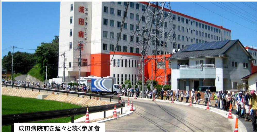
成田病院前を延々と続く参加者