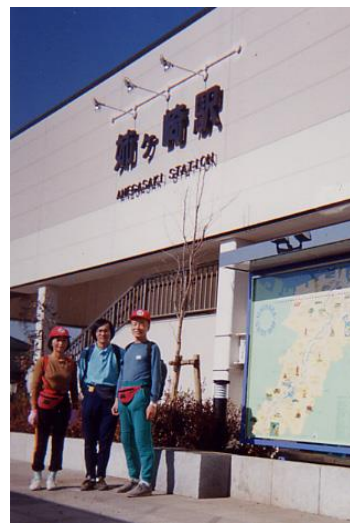
7日目の途中 姉ヶ崎駅

岸にたどり着いた。しかし尊は姫の事を思ってその地を去りがたかった。「きみさらず」が後に「木更津」の地名になったという。今はすっかり工場地帯で、神話の時代の面影は無い。富津岬に向かう道を左折して緑の自然が目立つようになった頃、17:15 今夜の宿である佐貫町駅近くのいとや旅館に着いた。お風呂に入り、食事の時に3人でビール3本、お酒6本倒して寝た。