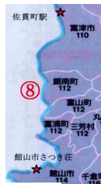
8日目の途中 浜金谷駅