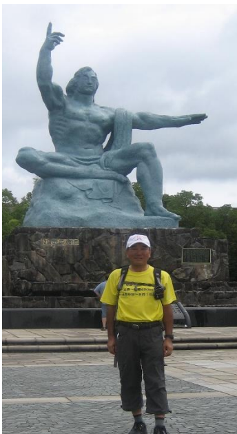
長崎平和公園にゴールした筆者

1日50～57kmの長距離ウオークを10日間歩く体験は、楽しいウオーキングというより「歩いたな」という感じ。暑くないといっても30度超、雨、早朝4時スタート、夕方5～6時のゴール。荷物、地図を持ってどのルートを決めても良く、ひたすら長崎を目指します。日々の準備、装備、対処法はウオーキングのあらゆる知識が試される。参加者は7名。佐世保105(イチマルゴ)や四国八十八箇所を数年間連続して歩く長距離ウオーカーばかり。ウオーク歴5年半の私は