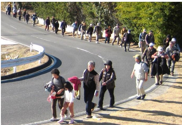
老夫婦も小1のお孫さんも完歩証を貰って大喜び

新年最初の月例会を担当する事になり、「コースは南回りから成田ニュータウン」と基本的には決めましたが、問題は田んぼの中の道を歩行するので雨・風の場合を想定すると天気の方が気になりました。雨が降ったら雨宿りする場所も無く、印旛沼の風は 1 月頃が最も強いと地元の人から聞かされておりましたので、「強風の場合は中止もありえる」と、思い悩みながら毎日の天気予報を気にする有様でした。