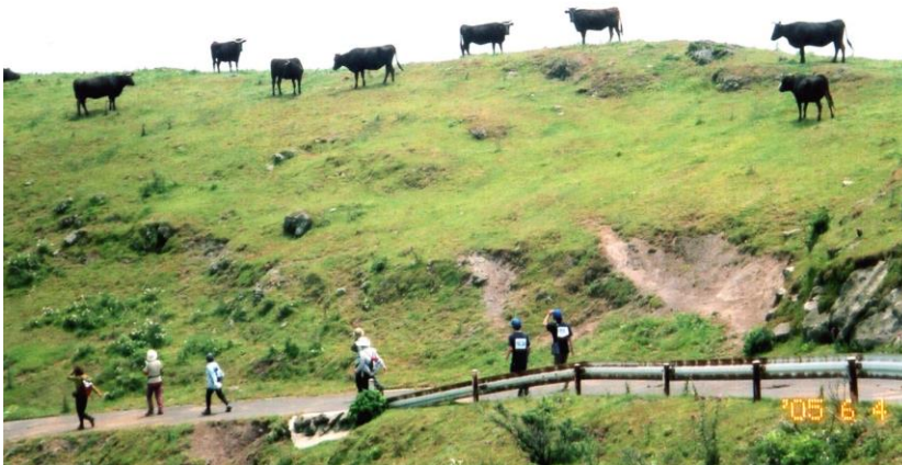
日本海に浮かぶ隠岐の島を歩く仲間達

参加しているうちに 2005 年 6 月、島根県の大会「第 3 回とって隠岐ツーデーマーチ」で 47 都道府県完歩を達成いたしました。2 日目の朝の出発式では「エイエイオー！」の檄発声も経験させて頂き、大変大きな思い出になりました。