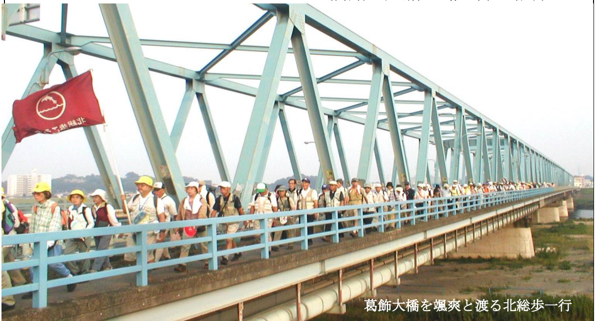
葛飾大橋を颯爽と渡る北総歩一行