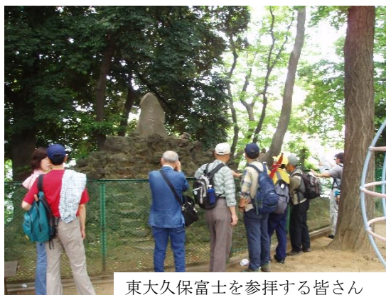
東大久保富士を参拝する皆さん