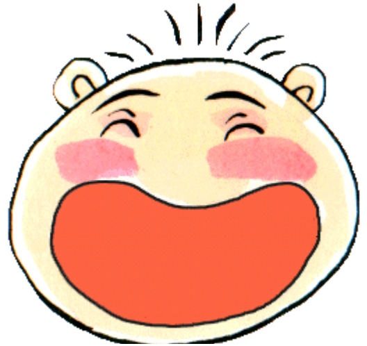
爺ちゃん・婆ちゃんいっぱいボク通れないよー

役員さんの指示が出た例外のとき以外は、常に右側通行を守って楽しく歩きたいし、訪れる各地の皆様にご歓迎されるウォーカーであり続けたいと思いますが、いかが？(つづく)