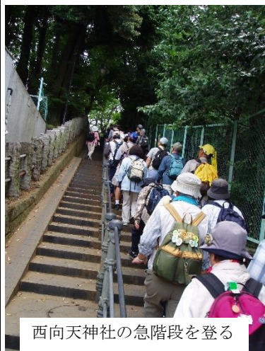
西向天神社の急階段を登る

富士塚については日頃から興味があり、資料もそれなりに集めていたので、それらの文献を参考にしながら、山手線内の富士塚を線でつないで見た。20km以内の条件のもと、スタートを鳩森八幡神社の千駄谷富士とし、高田富士（早稲田水稲荷神社内）、東大久保富士（西向天神社）、音羽富士（護国寺）、白山富士（白山神社）を加え、上野の山をゴールと設定してコースの下見に入ったが、距離の関係から小野照崎神社の下谷富士とした。駒込富士（富士神社）も始めはコースに入れたのだが、雰囲気がいまいちだったので地図上に表記するにとどめた。千駄谷富士と下谷富士の二つはそれぞれ都と国の有形民俗文化財となっ