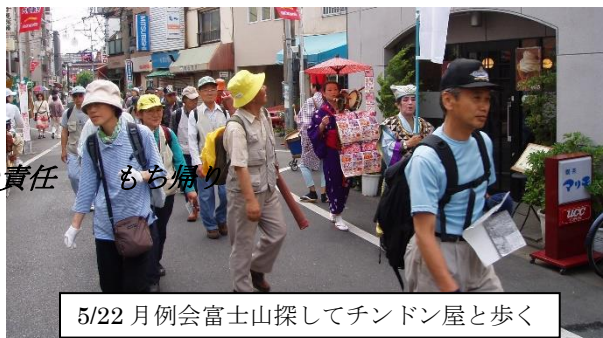
5/22 月例会富士山探してチンドン屋と歩く