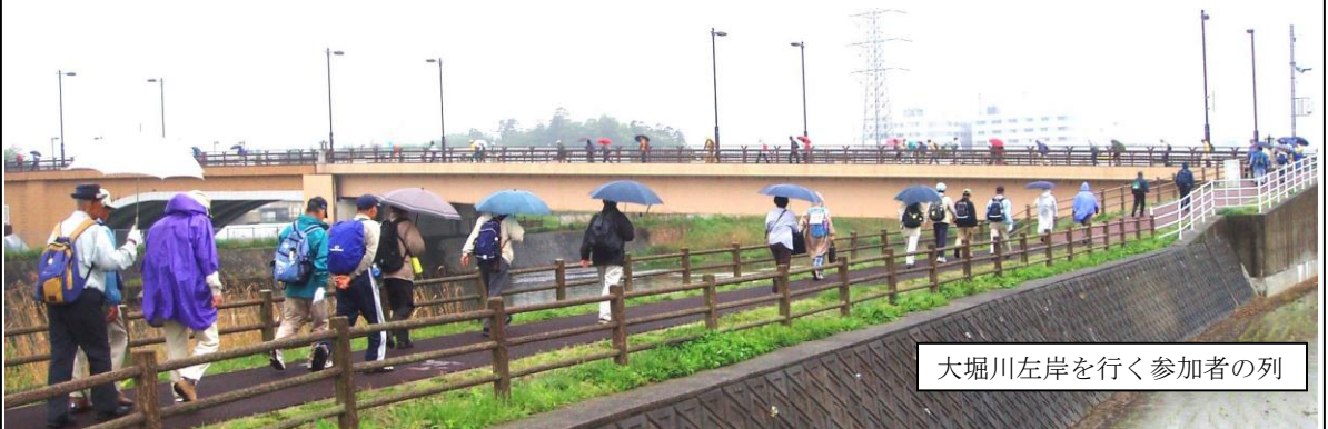
大堀川左岸に行く参加者の列