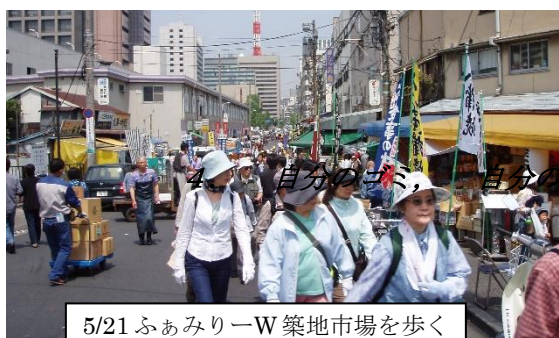
5/21 ふぁみりーW 築地市場を歩く