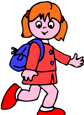
歩くマナーを孫が見ている

【編集後記】第10回東京スリーデー2日目の夕食が悪く、3日目の歩きは散々だった。井の頭公園から一緒に歩いた北総会員の男性と話しながら仙川で、彼は30kmへ私は泣く泣く20kmコースを選んだ。3日間の完歩はしたが皆様、季節がら生ものにご注意を。一歩遊人—