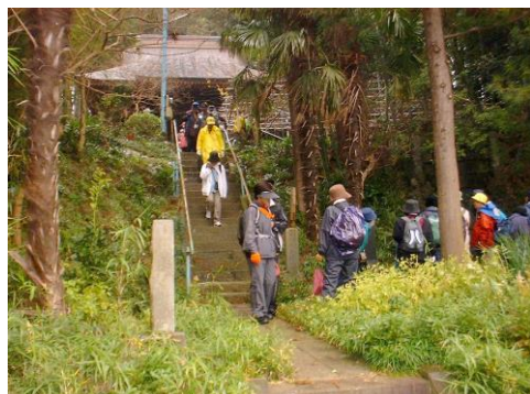
H16,12,12 例会・滝前不動尊にて

例会等イベントに参加しなくても、個人的にあるいは何人かの友人と、気軽に自分の都合の良い時間（基地が開設されている時間内）に楽しく歩いて、しかも記録が認定されるというものです。基地になって頂く方の協力と歩く人の自覚が無くては出来ない制度です。