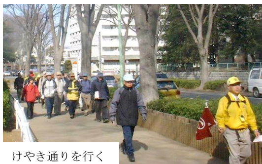
けやき通りに行く

地図で見るとかぶと公園から八柱霊園まで行く道があったのでいってみると畑の中でその先は崖で道が無かった。また河原塚中学の辺りに裏道があるので行ってみると橋が工事中で1月31日に完成する予定となっていた。解散場所は松戸中央公園か松戸神社にするか迷ったが松戸中央公園は昨年春に市川の公園めぐりを行ったときの集合場所で逆に戻る形になるため松戸神社とした。千葉大から戸定邸へ直接行ければと考えたがまだ常時