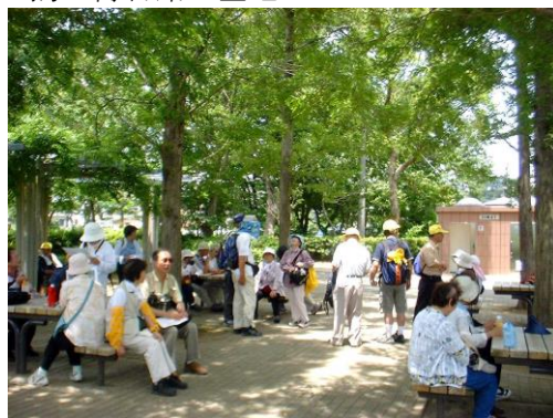
H16,6,19 FW・滝下広場で休息中

イヤラウンド・ウォークとは競争でない、みんなのスポーツ「ウォーキング」の一層の推進を図るためにJWAが認定したコースを歩きます。大会や