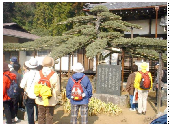
H.16.2.21 沼南町・善龍寺の五葉松