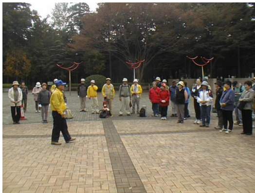
11/15 野田市役所前のウォーキング教室