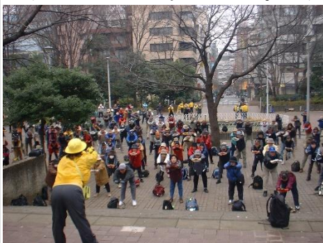
南池袋公園での出発式・体操 た。反省多き例会でした。

満のあった事と思います。勉強不足で紙面をもってお詫び申し上げます。お天気も昼頃から雨になるとの予報で心配しましたが、ゴールの神田明神まで降らなかった事は幸いでした。