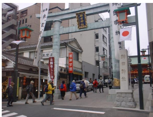
神田明神の鳥居に入る参加者の皆さん