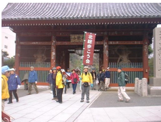
護国寺の山門を出る参加者の皆さん