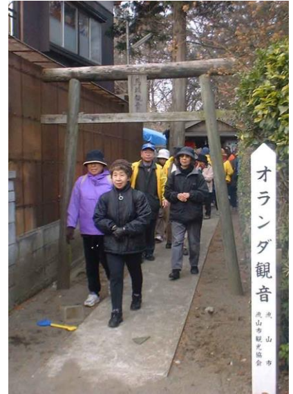
↑オランダ観音を参拝 1/18