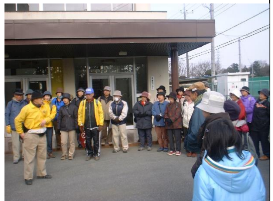
十太夫福祉センターでの「ほんの一言」講義

「……私の一番怖い!? 山の神が愛宕の駅で階段を下りる時に足を踏み外して転倒、そのまま歩けず未だに病院通い。(次ページ下段へ続く)